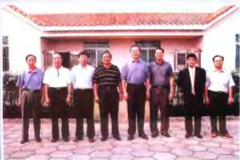
◀ 2001年10月14日，国家农业部副部长（右四）李炳李广实（右三）到汕尾市（在汕尾市）考察，省委副书记、省长卢瑞华（前排中）陪同。