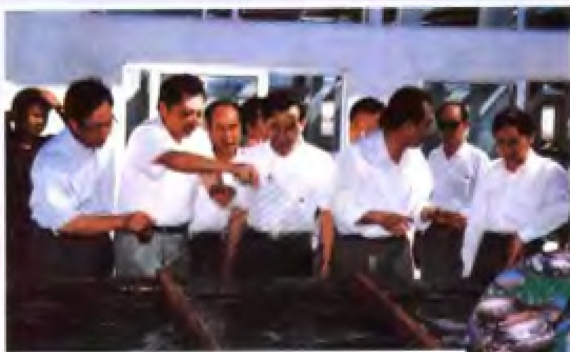
▶ 1996年10月23日，省委副书记、省长卢瑞华（前排中）视察汕尾市工厂化养鲍场。