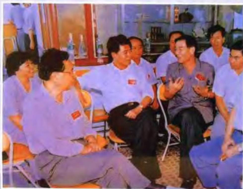
书左欧洋排江商 副排长海前阳共 委前省省（入部 省（副在汉深干 林，）水，地 森委二杨下当 1995年7月，省常 长朱委排厅陪，经 省（产）渔海 （）源水三海展 记一广与左沿发