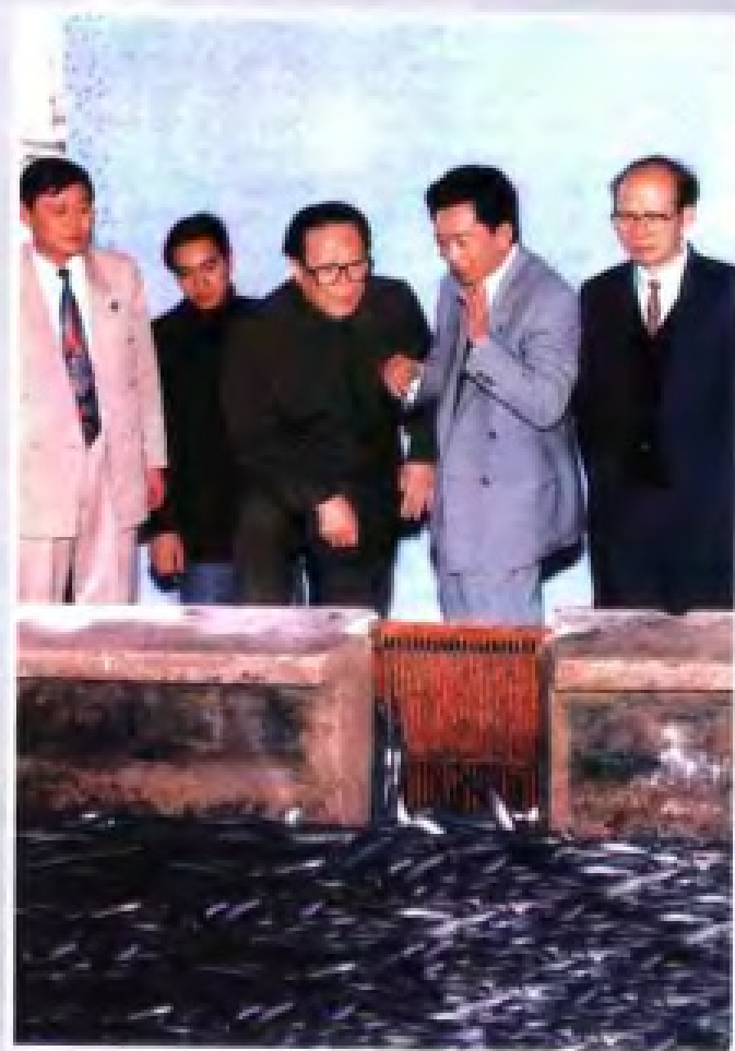
▲ 1995年12月29日，中共中央总书记、国家主席江泽民（中）在中共中央政治局委员、省委书记谢非（右一）陪同下，视察潮州市金曼集团。