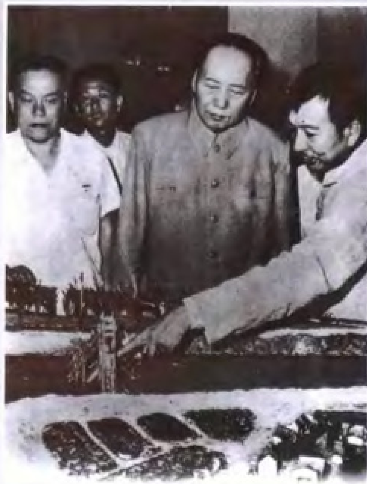
1958年4月30日，在（右）广东陶县（中）（广展为会）排陶视察比图新。型。主席下推具模的（记，广馆介模年第一同革工主鱼东第陪改产毛养泽委）具水向浦毛省一农会铸河