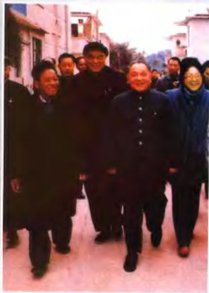
▲ 1984年1月25日，邓小平（前排右二）在省长梁灵光（前排左二）陪同下，视察深圳经济特区渔民新村。