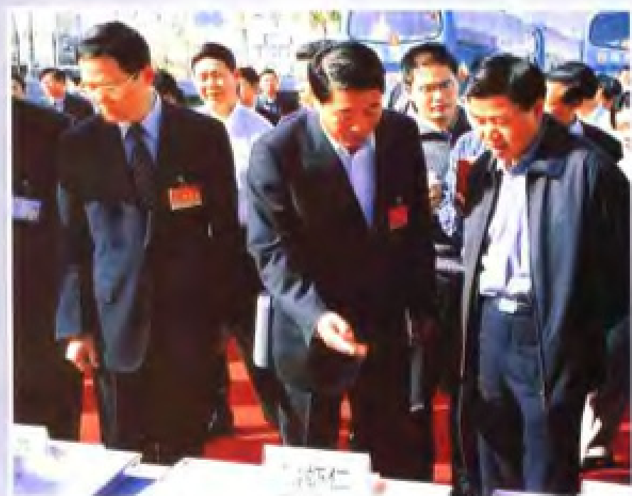
◀ 2003年12月，省委副书记、省长黄华华（右一中）考察湛江市水产加工产品。