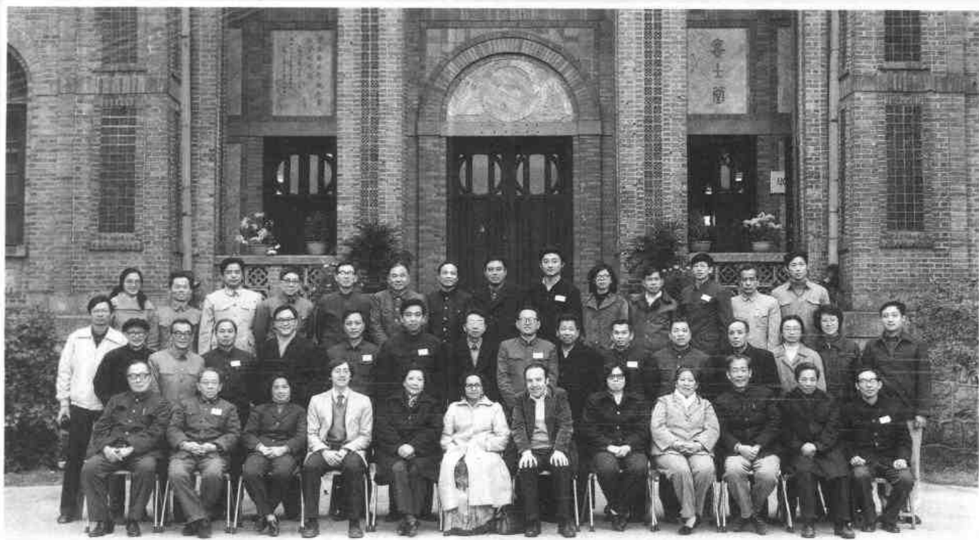
▲1983年1月，教育部在中山大学召开联合国人口基金P01项目会议。