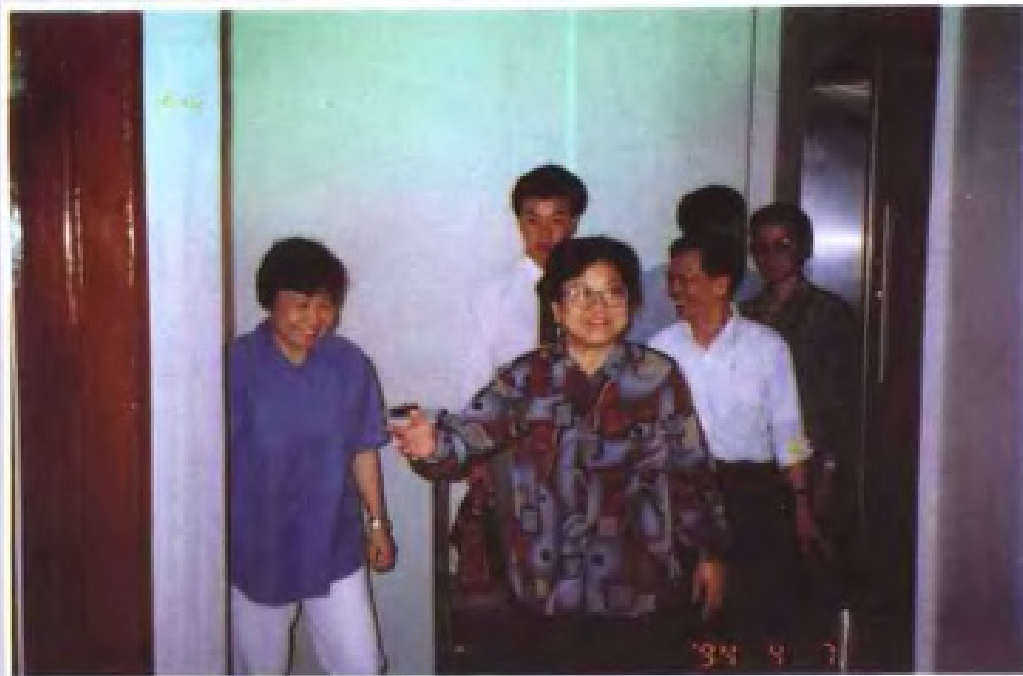
◀1994年4月，国家计生委主任彭佩云到广东视察工作。左一为广东省副省长李兰芳。