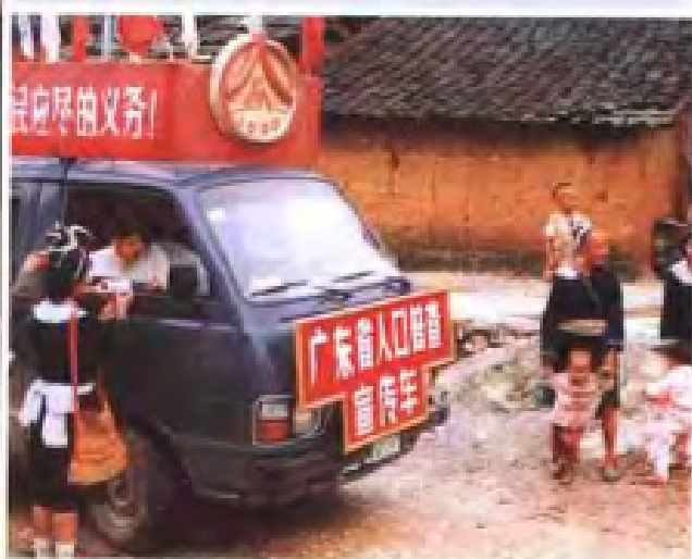
▼人口普查宣传车到瑶寨 (1990年)