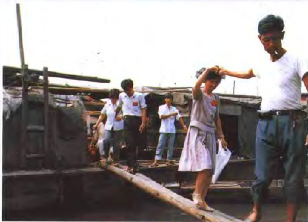
◀对水上居民进行 人口普查登记。 (1990年)