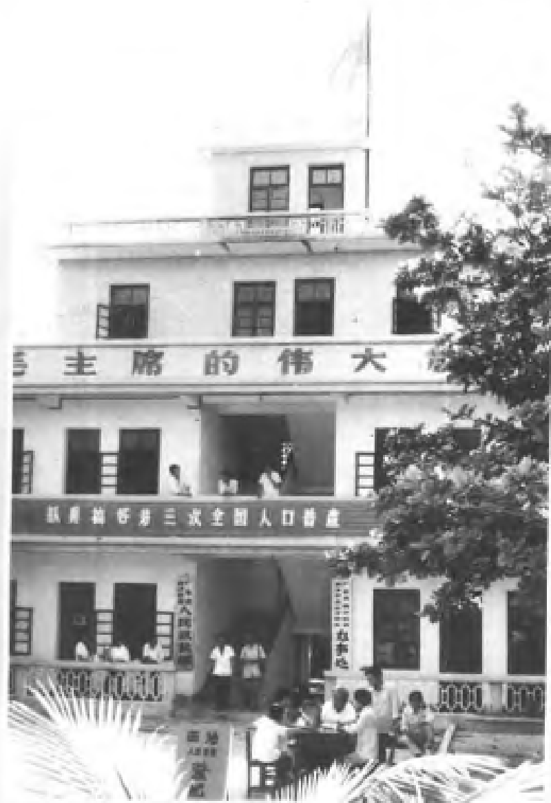
◀ 西沙永兴岛的居民在 申报人口普查登记。 (1982年)