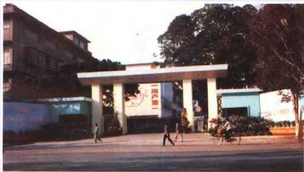
国内首家生产避孕套的工厂——广州第十一橡胶厂。