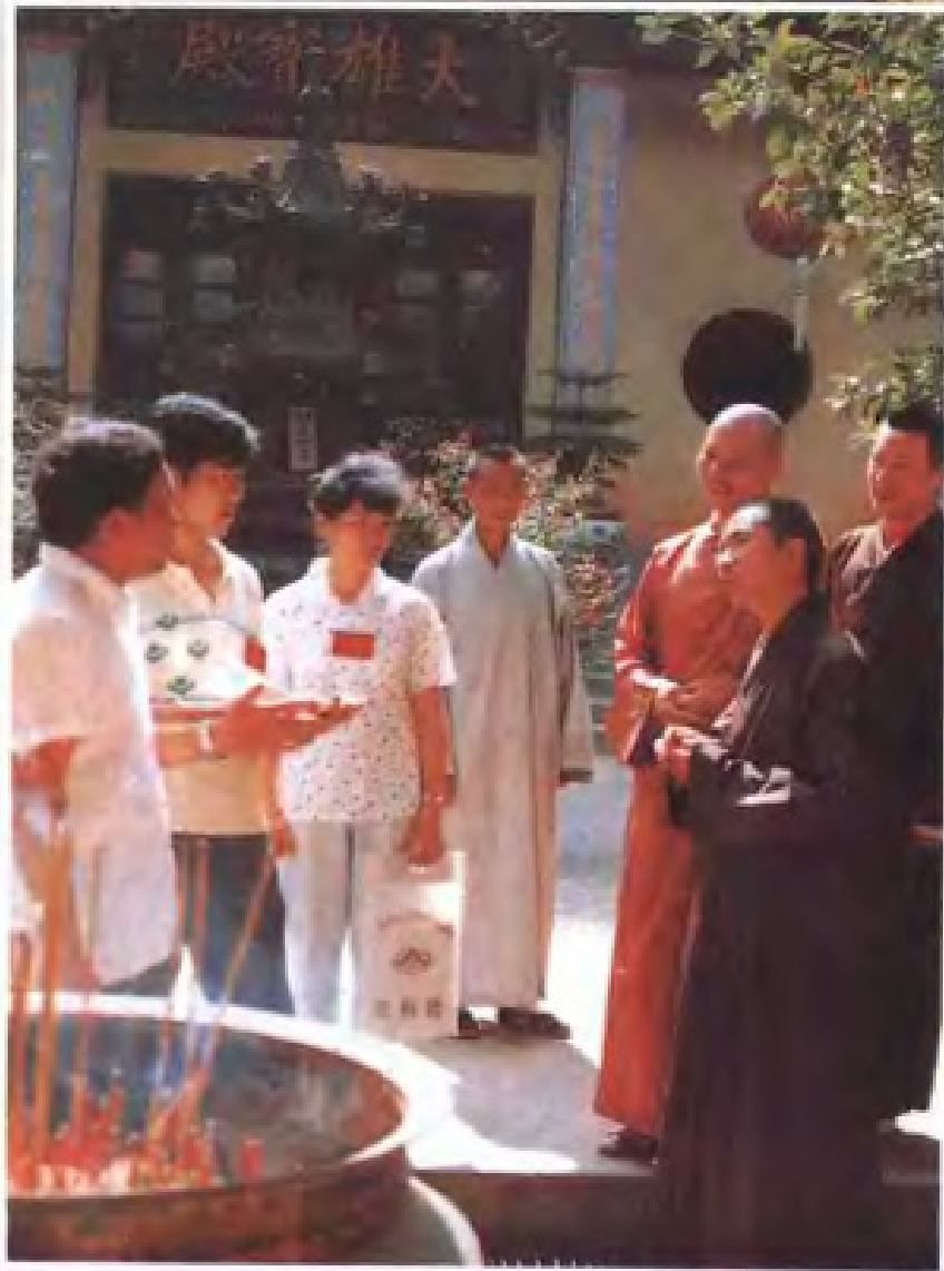
◀佛教人员申报人口普查 登记。(1990年)