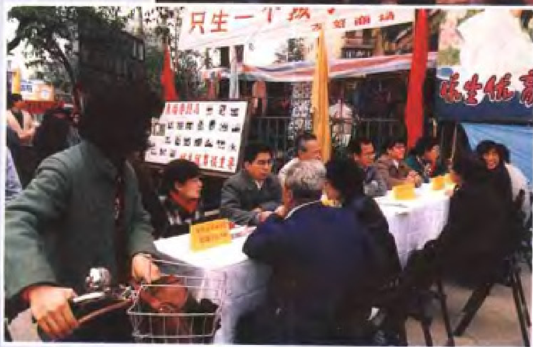
◀计划生育宣传日。 (1990年1月11日)