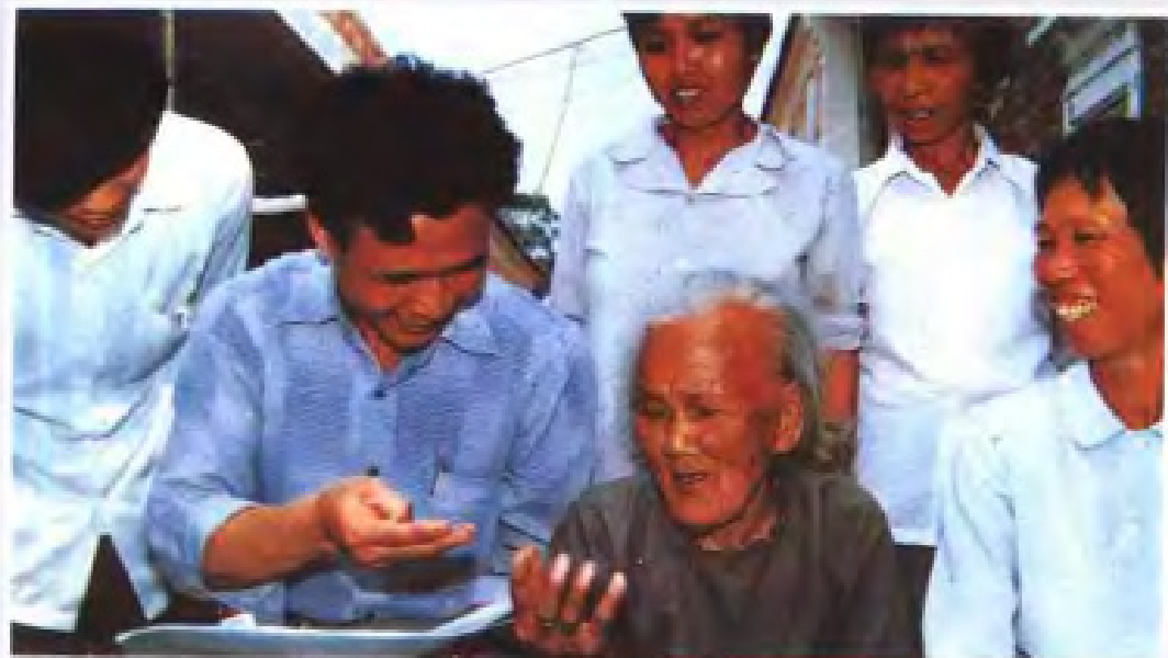
◀人口普查时， 老人回忆年龄。 (1990年)