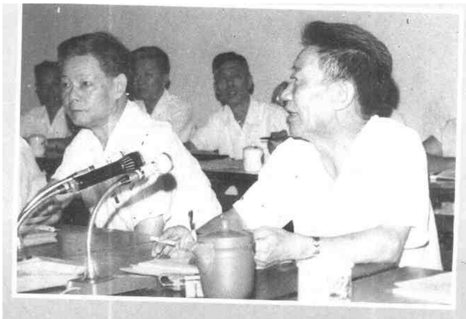
1983年，广东省委、省政府召开全省计划生育工作会议，副省长叶选平（前左）和省委常委杜瑞芝（前右）共同主持会议并作指示。