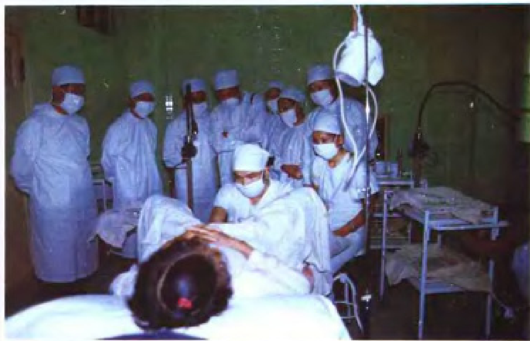
1984年，世界卫生组织官员参观广东省计划生育科研所女性输卵管粘堵术。