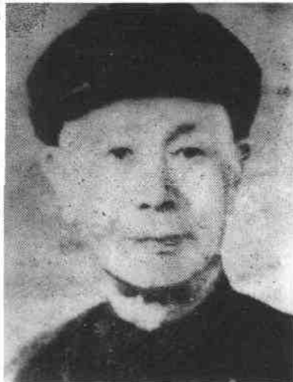
◀张竞生(1888—1970年)是中国现代最早倡导节育的学者之一。