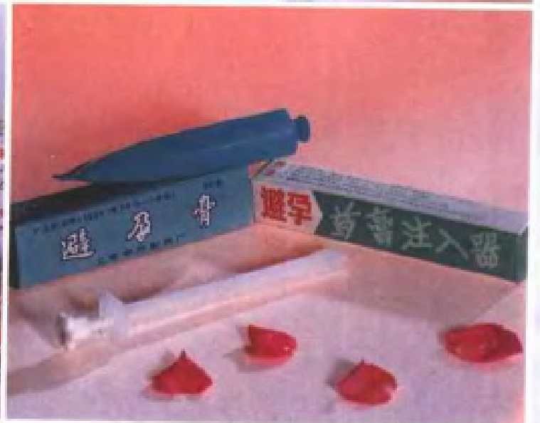
▲广东省育龄夫妇使用的主要避孕药具。