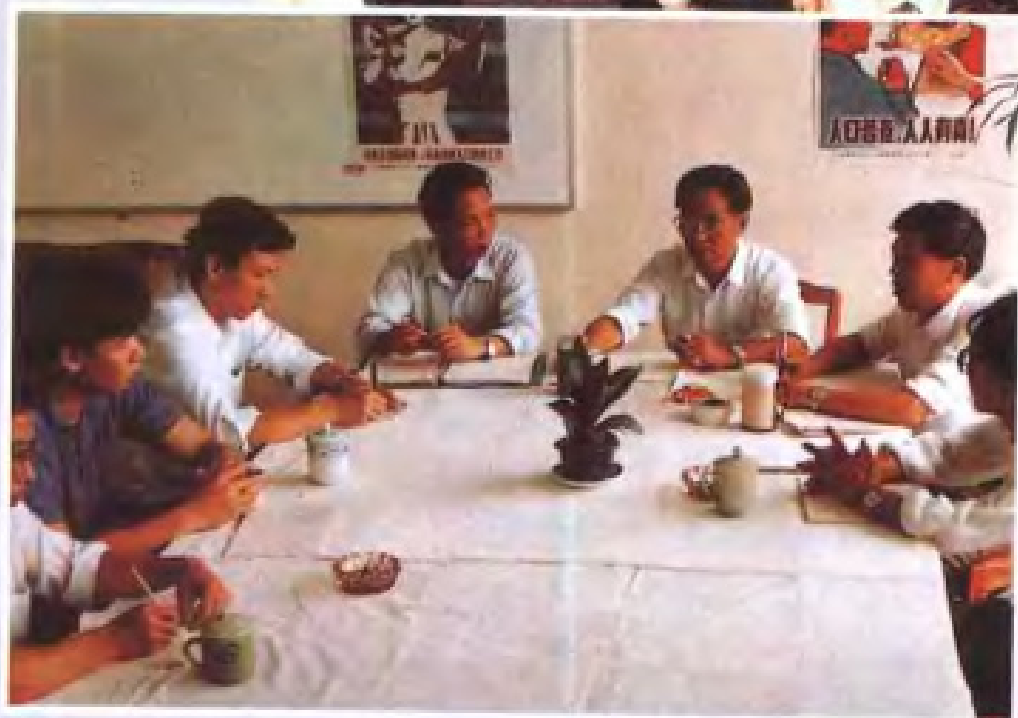
◀广东省人口普查办公室在研究部署工作。 (1990年6月)