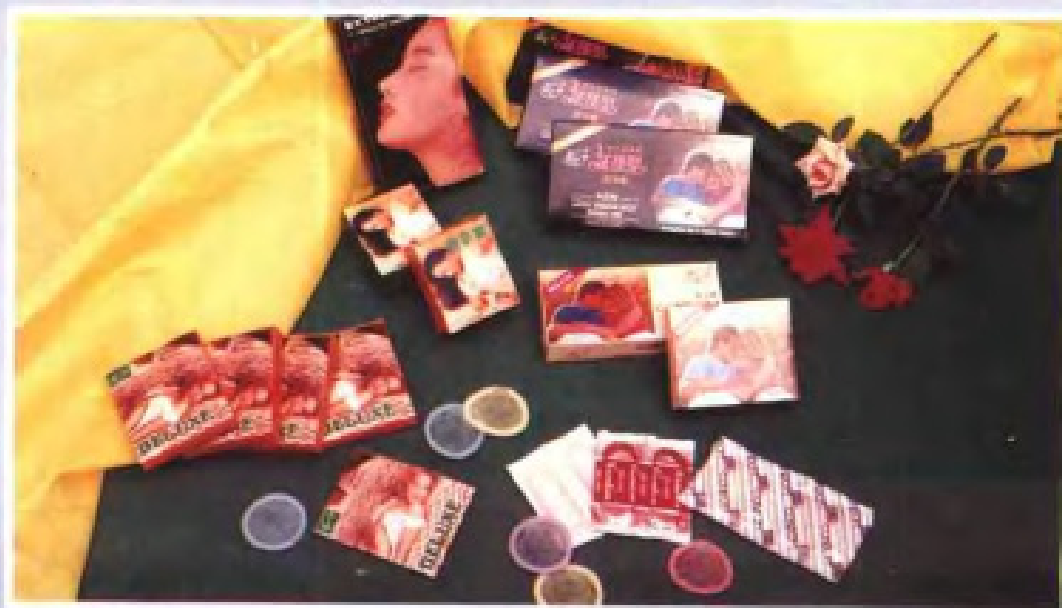
广州第十一橡胶厂生产的避孕套。