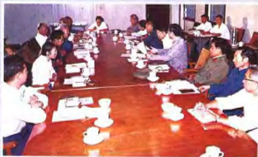
1982年，广东省人口普查领导小组召开会议，部署工作。