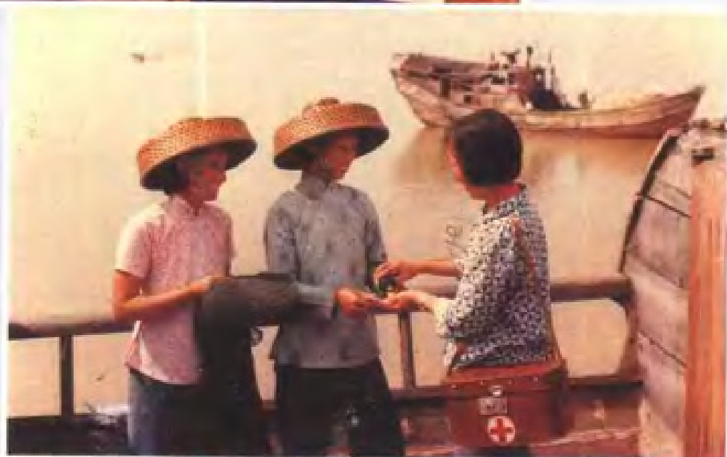
台山县计划生育 干部送避孕药上 渔船。(1983年)