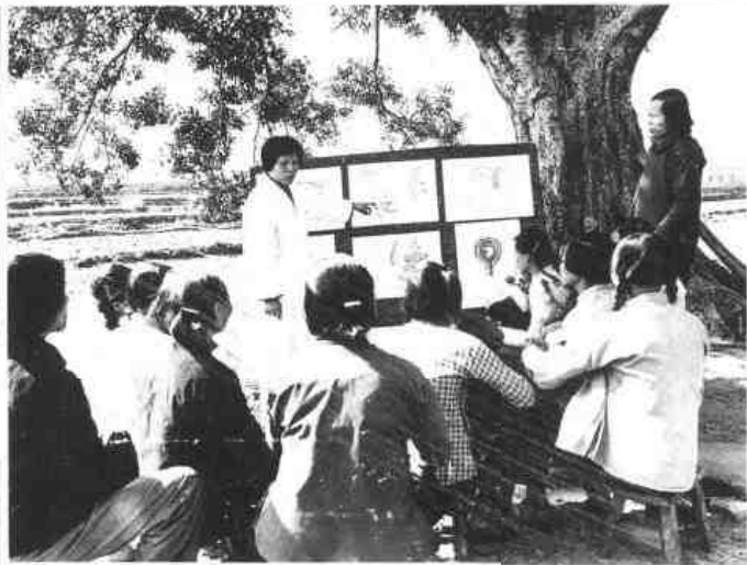
▲高要县白土公社医生向妇女讲解节育知识。(1981年)