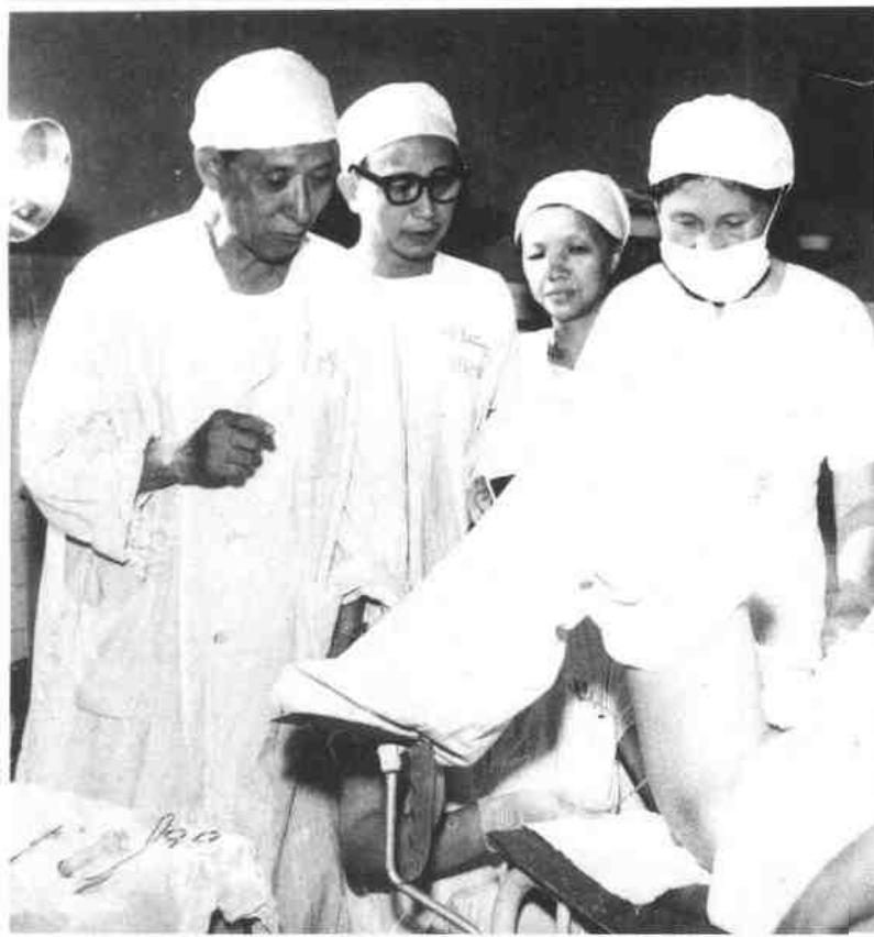
▲中山医学院郑惠国、陈学煌等所创的苯酚胶浆粘堵输卵管绝育术获1978年全国科学大会奖。图为临床观察。(1970年)