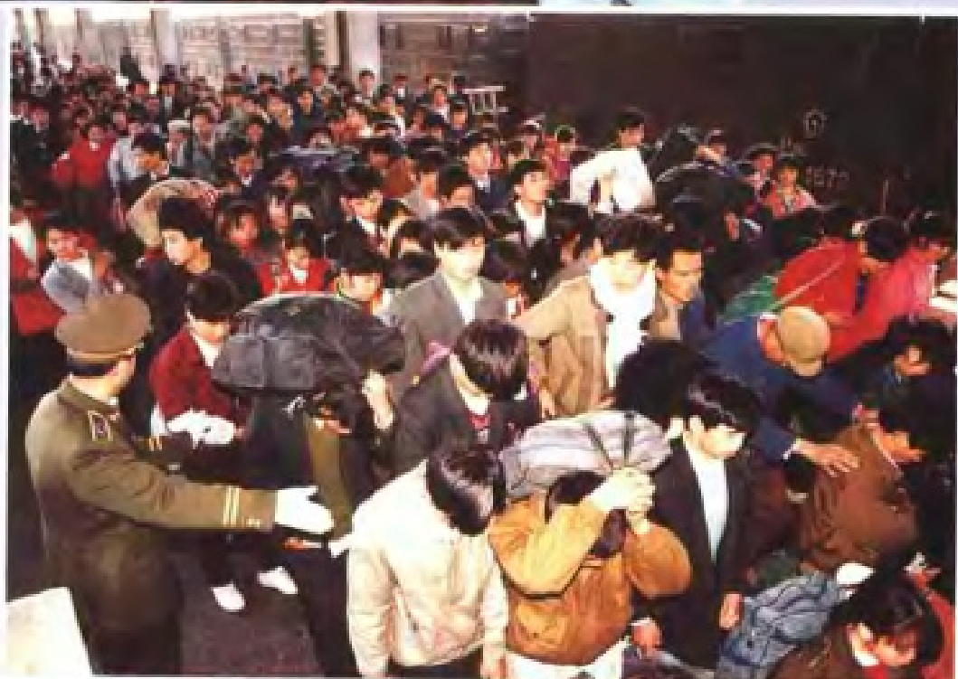
民工潮一角▶ (广州火车站 1992年)