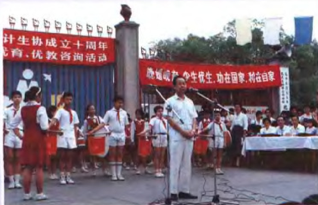
◀ 庆祝广东计划生 育协会成立十周 年，副省长、会 长王屏山讲话。 (1993年)