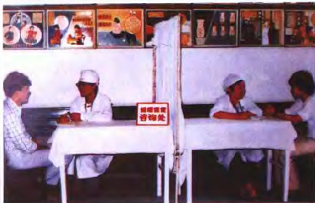
◀ 婚姻保健咨询。 (1990年)