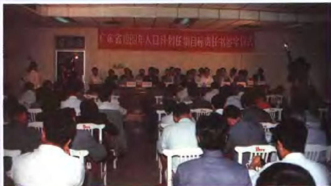
“广东省1989年人口 计划任期目标责任书 签字仪式”在广州举 行。(1989年)