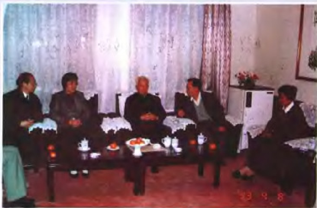
◀ 1993年4月，原中国计划生育协会会长王首道（左三）视察广东计划生育工作。