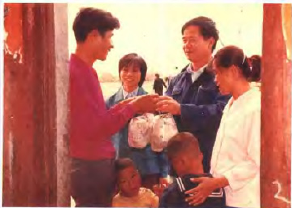
◀开平县负责人上 门慰问实行计划 生育的农民。 (1982年)