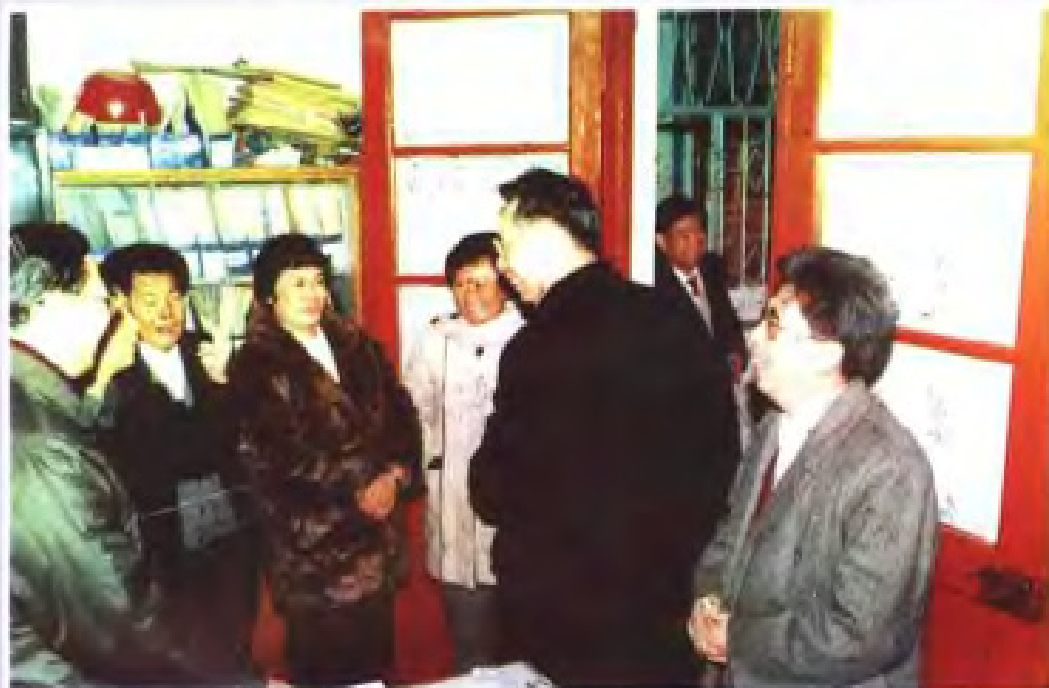
◀ 1993年1月，朱森林省长（右二）到广东省计生委慰问全体同志。