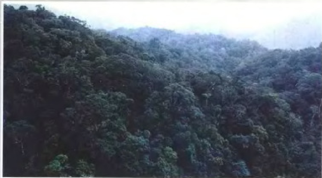
▲ 海南岛尖峰岭的天然热带雨林 (1982年)