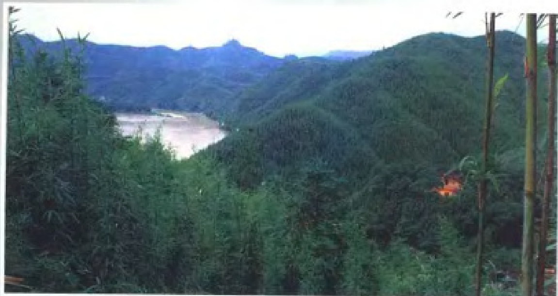
▶ 怀集的天然茶杆竹林 (1988年)