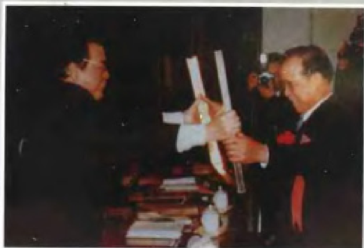
◀ 1991年3月中共中央、国务院授予广东省“全国荒山造林绿化第一省”称号。李鹏总理（左一）在北京给凌伯棠副省长（右一）授奖