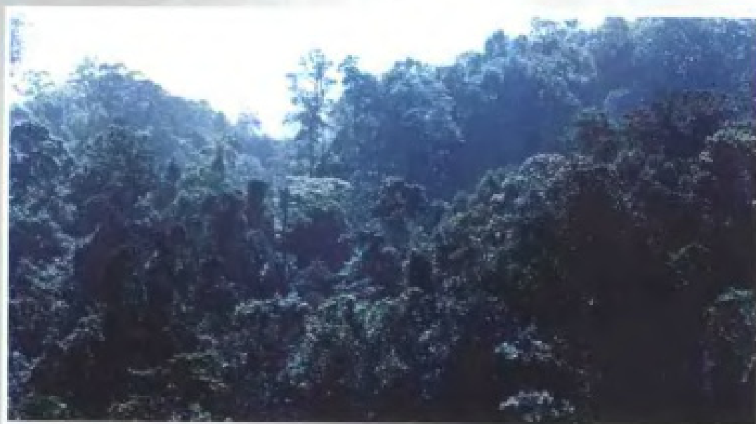
▲ 海南岛坝王岭的天然热带季雨林 (1982年)