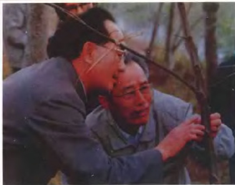
◀ 中共广东省委书记林若（右） 在丰顺县视察林业（1989年）