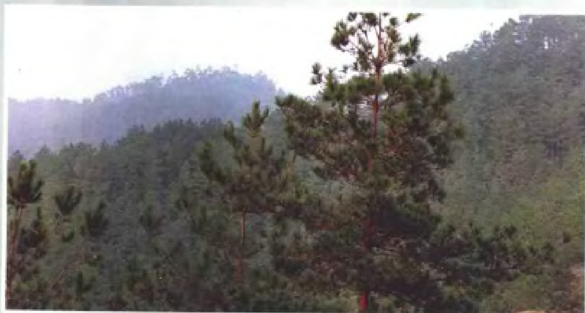
◀ 信宜的天然马尾松林—亚热带针叶林 (1995年)