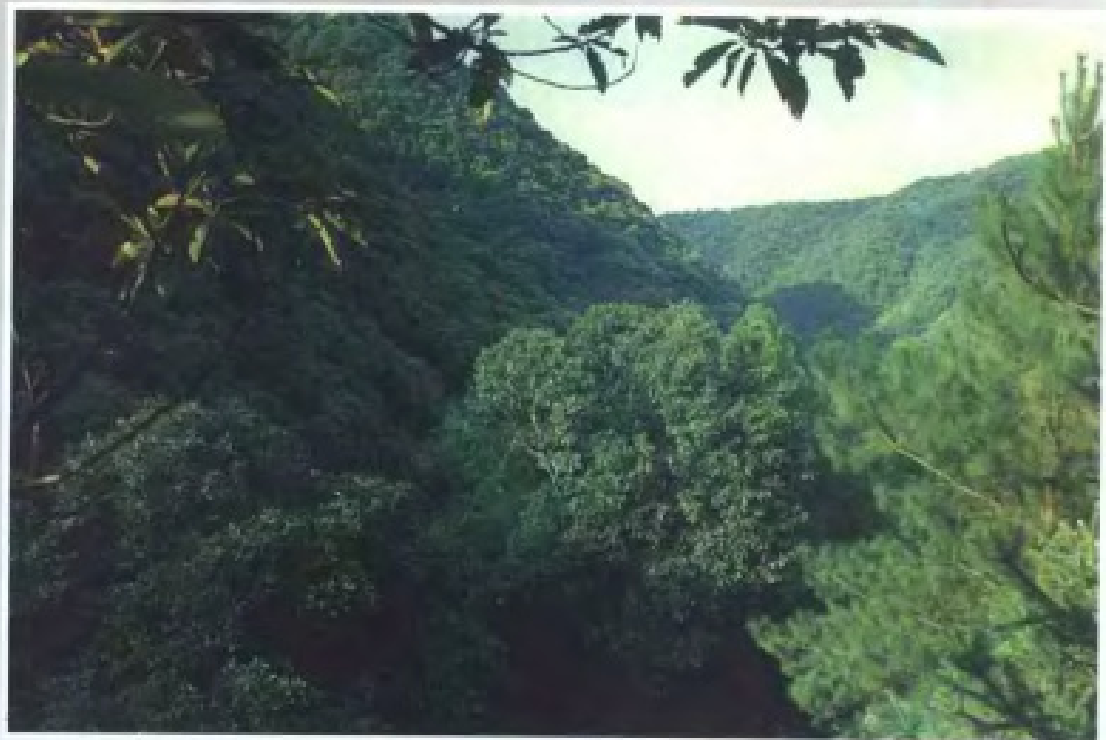
◀ 始兴车八岭的天然中亚热带常绿阔叶林 (1989年)