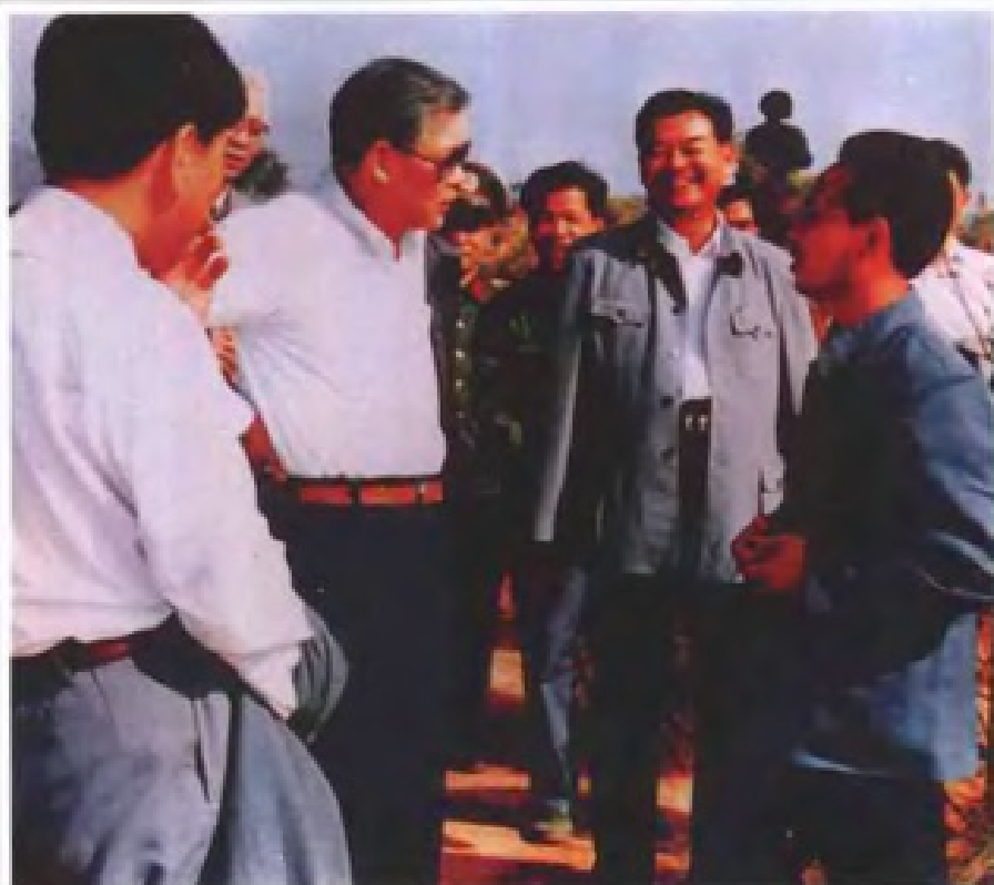
广东省省长叶选平（左二）在 梅州市视察林业（1990年）▶