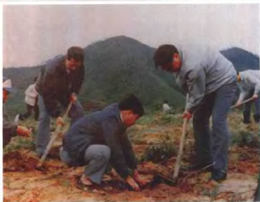
◀ 中共广州市委书记朱森林（右一）在增 城县荔城镇后龙山造林绿化点上植树 （1989年）