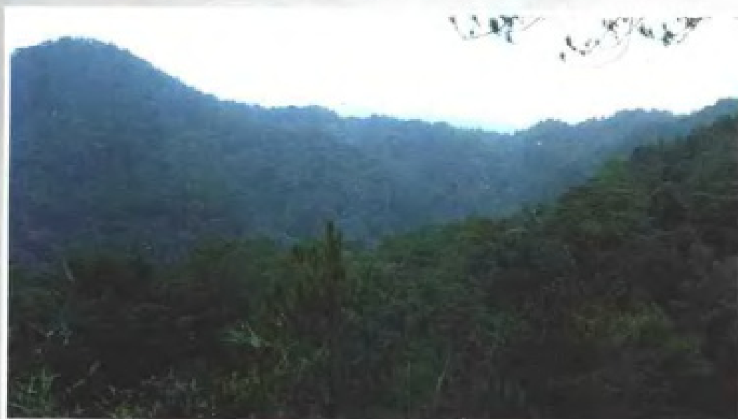
▲ 封开黑石顶的天然亚热带季风常绿阔叶林 (1985年)