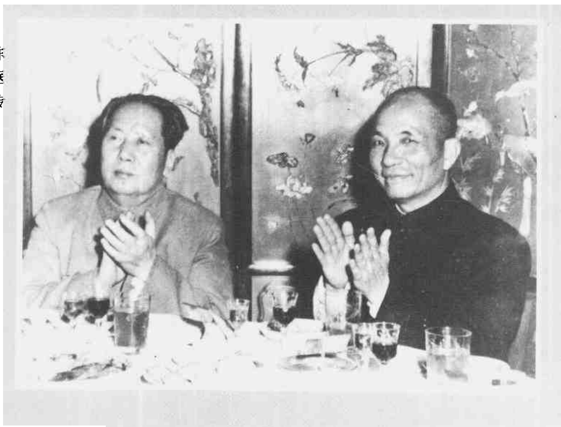
►1956年,毛泽东同志亲切会见中山医学院血吸虫病防治专家陈心陶教授