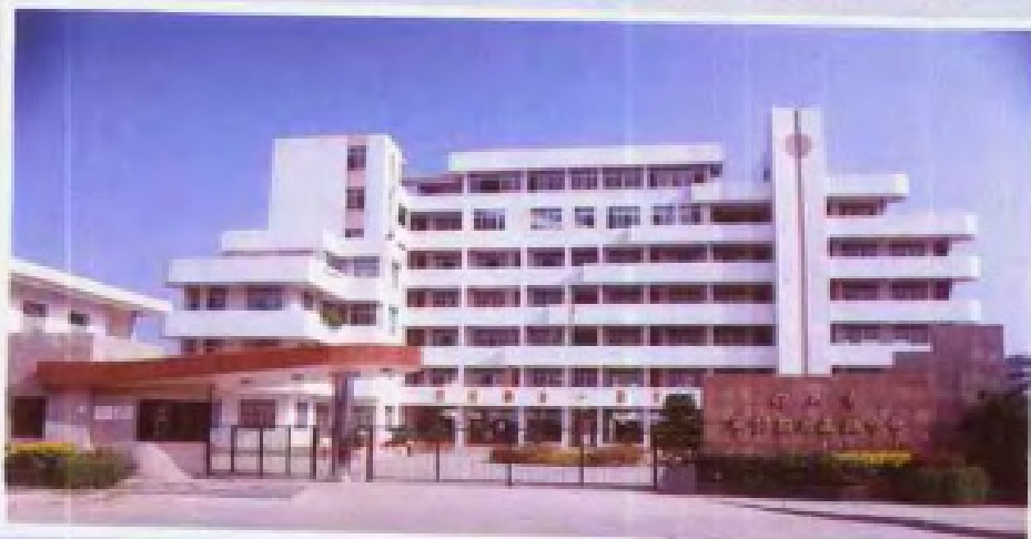
◀ 佛山华 材高级职业中 学