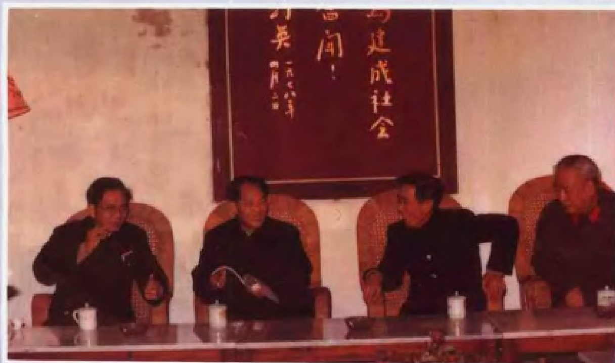
▼ 1984年2月6日，胡耀邦同志视察梅县东山中学