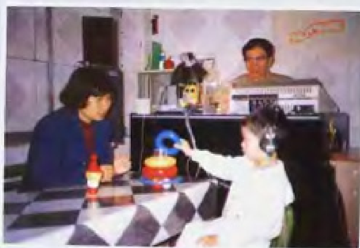
▲ 广州市聋人学校教师为幼儿诊断听力