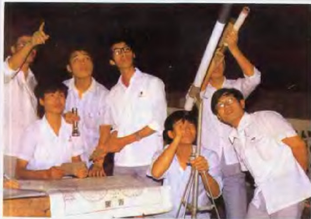
◀ 惠州市第一 中学气象小组在观 察哈雷彗星