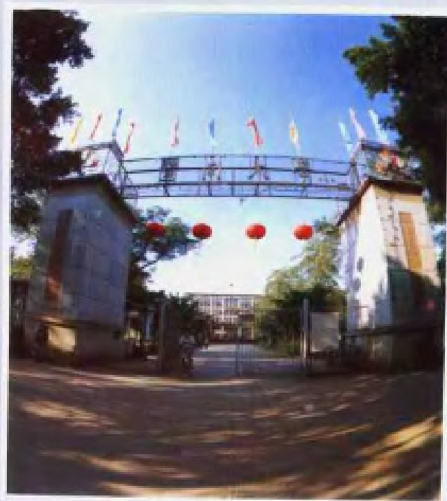
▲暨南大学校门(南门)