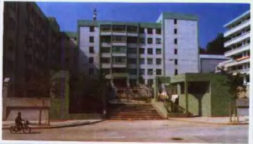
▶ 广州电 子职业高级中 学