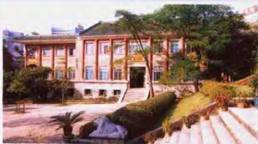
◀ 执信中学是 孙中山为纪念他的 亲密战友朱执信， 于1921年创办的。 这是坐落在校园北 面的图书馆