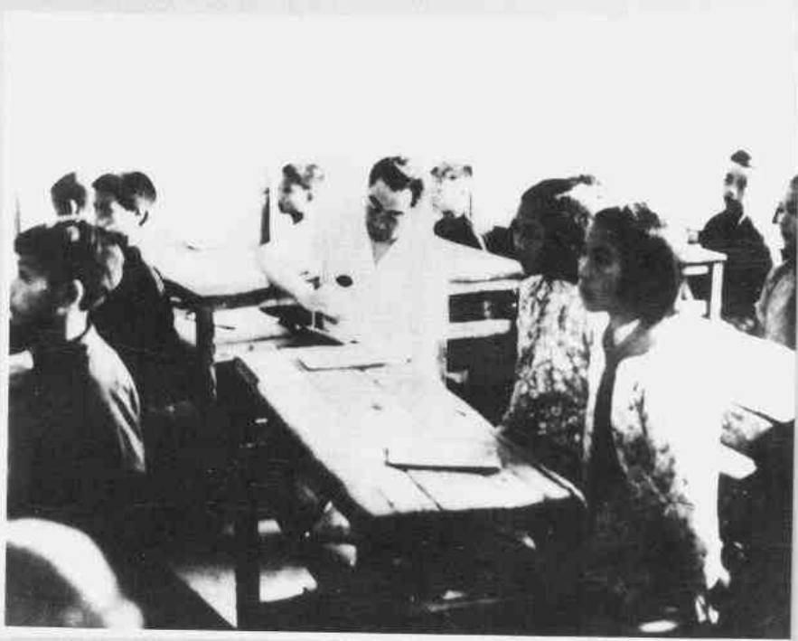
▲1958年7月3日,周恩来同志在新会县棠下周郡小学听课