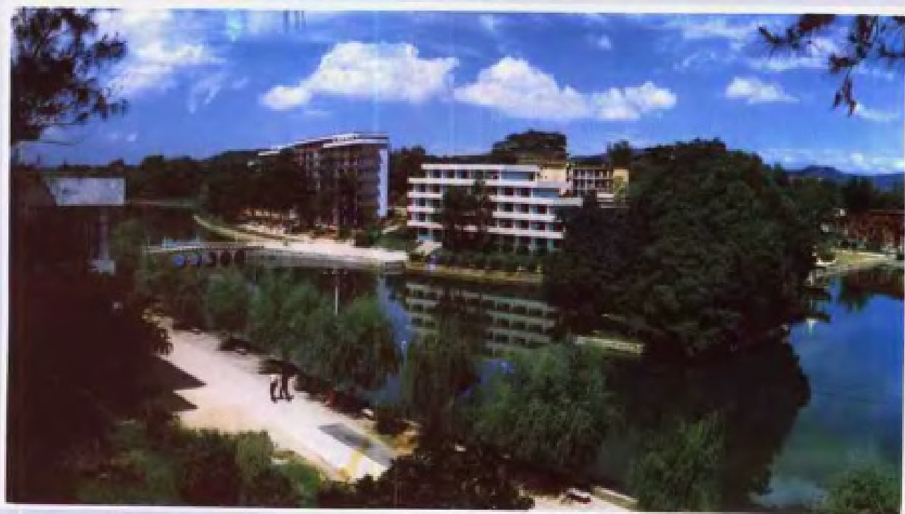
▲华南理工大学(西湖)