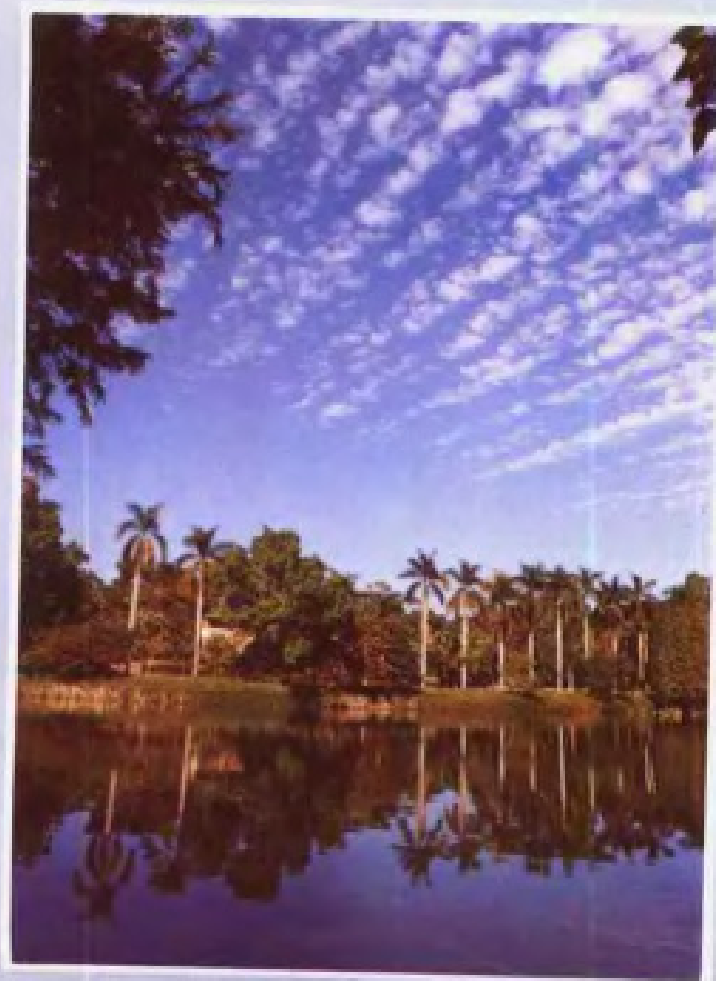
◀华南农业大学亚热带风光的校园