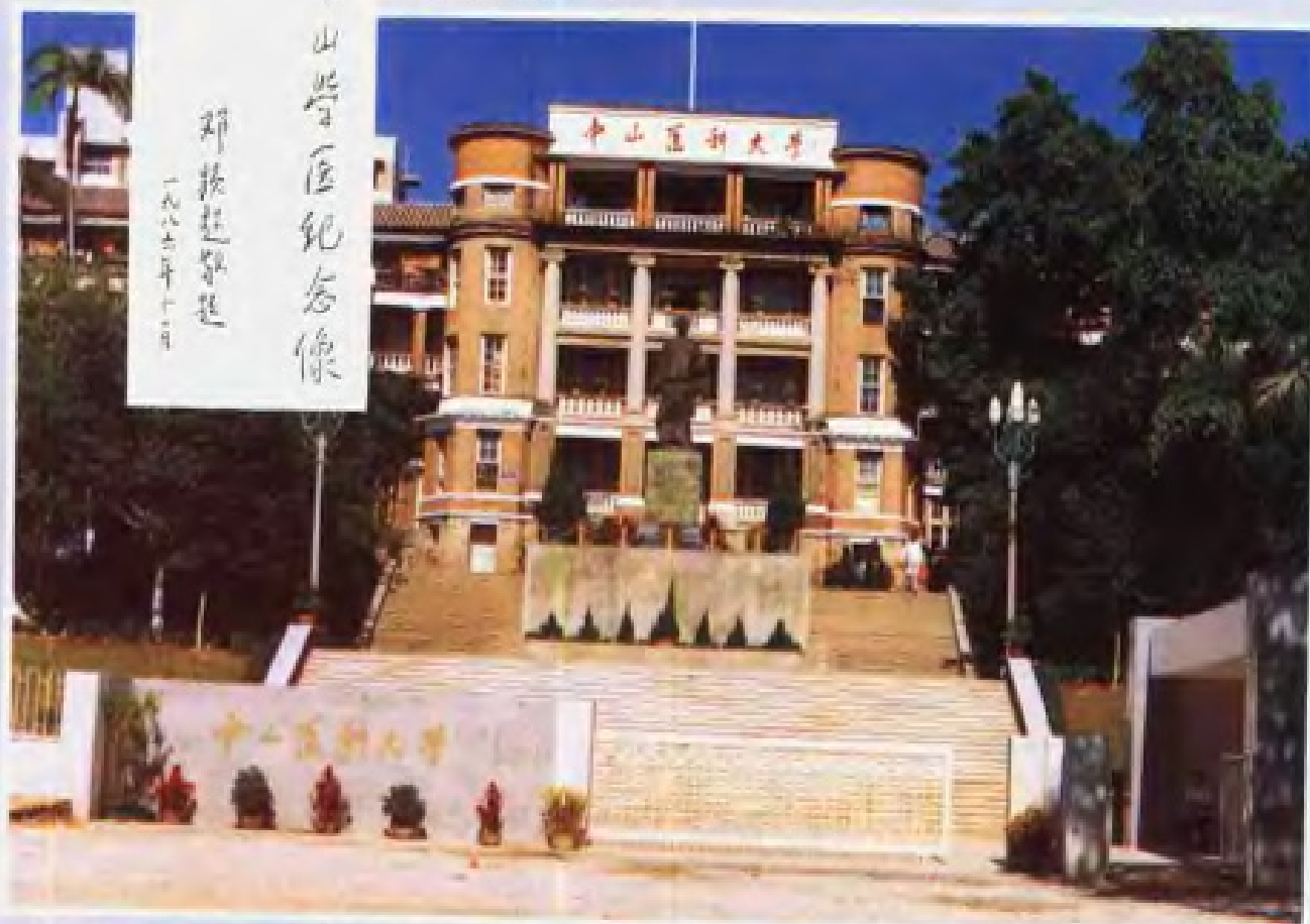
▲矗立在中山医科大学正门的孙中山学医纪念像，基座上镶嵌着邓颖超同志的题字。楼顶上横幅校名为邓小平同志题写