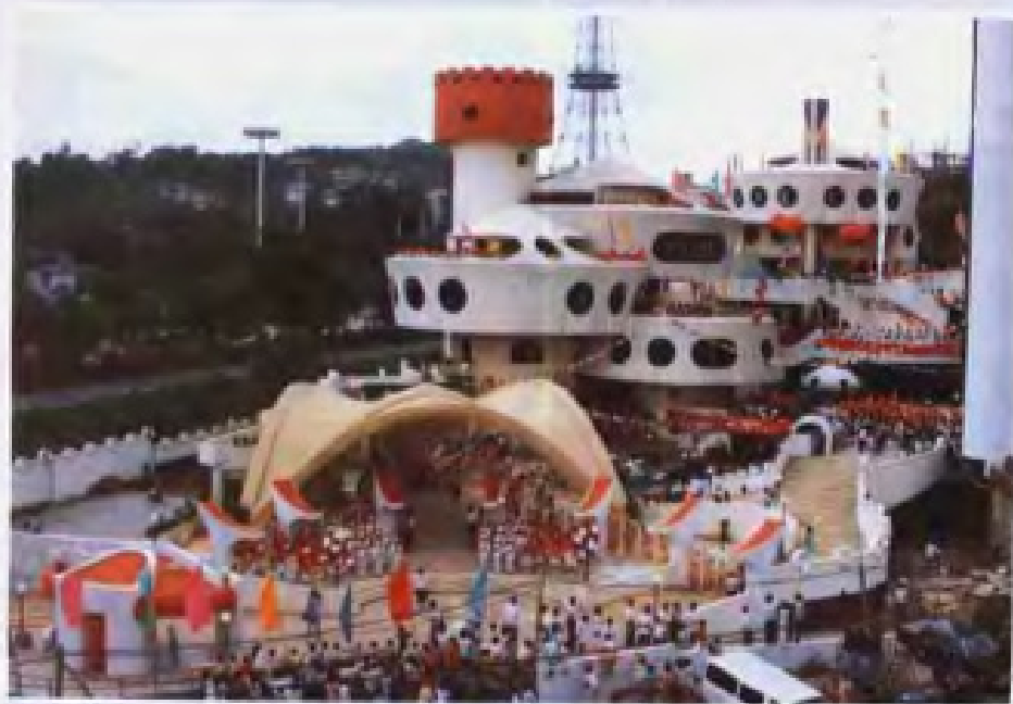
「六一」国际儿童节 广州市儿童活动中心庆祝