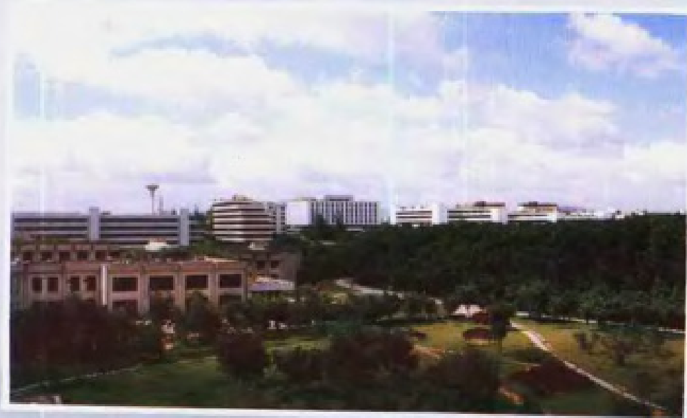
◀ 深圳 大学校园一角