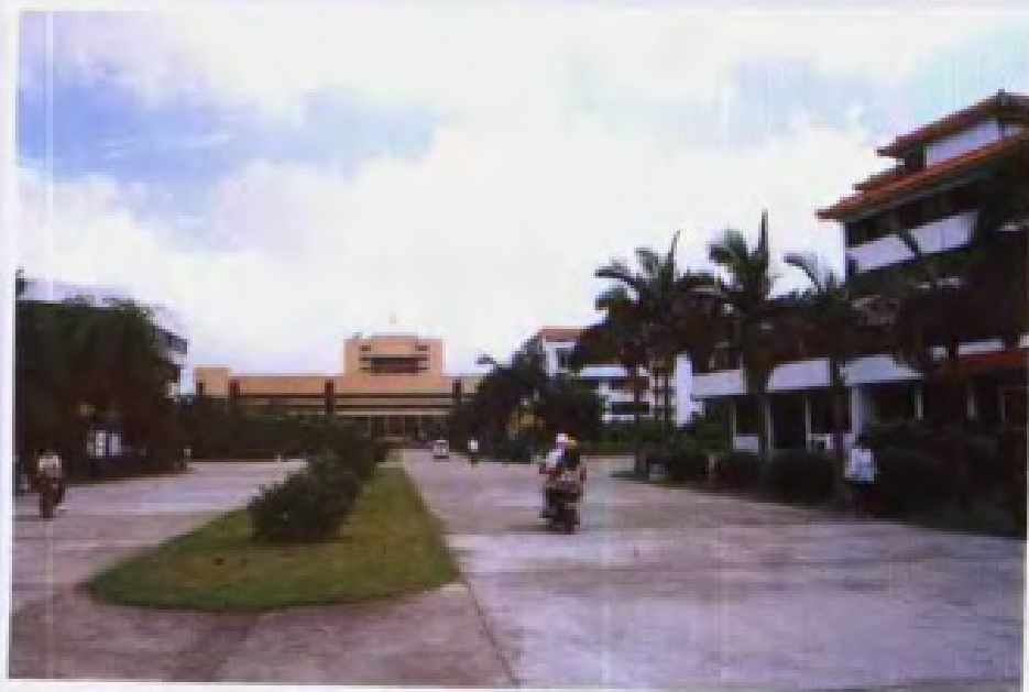
◀ 五邑 大学宽阔的 校道