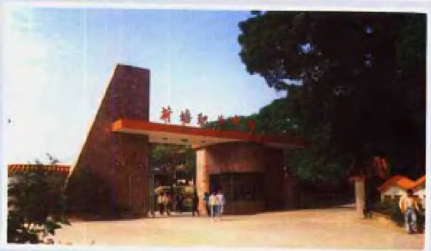
▶ 新会荷 塘职业中学