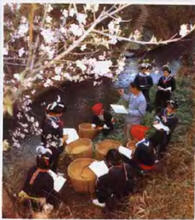
▲ 连南农业学校瑶 族班学生在学习浸种催 芽技术