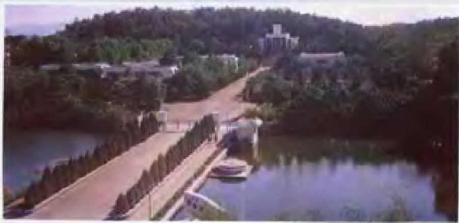
◀ 新会陈瑞祺 中学