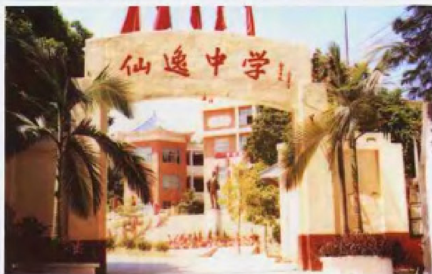
► 纪念杨仙逸将军的中山市仙逸中学。校名为徐向前同志题写