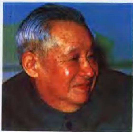
▲1958年暨南大学在广州重建后的第一届董事会董事长廖承志同志