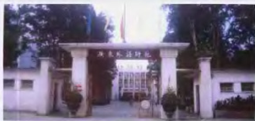
◀ 广东外语师范学院