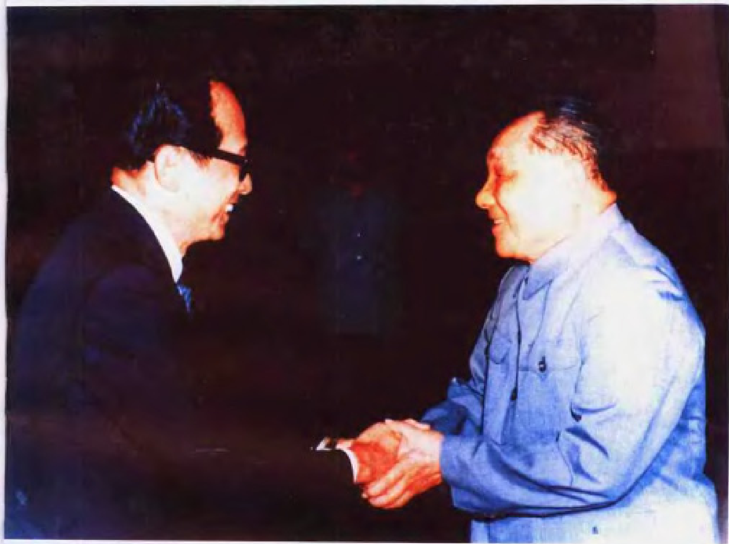
▲ 1986年6月20日，邓小平同志会见汕头大学校董会名誉会长李嘉诚先生