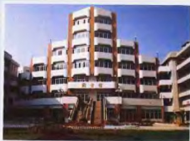
▲ 中国民航广州中等专业学校图书馆