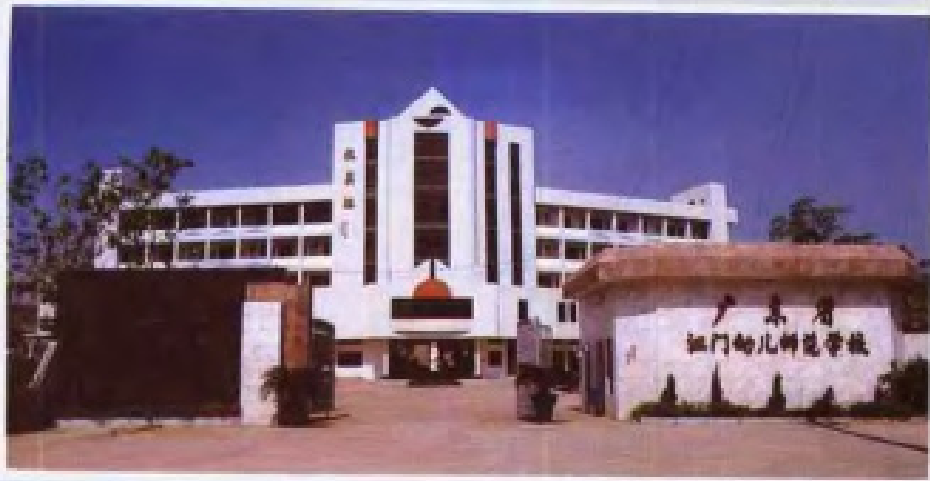
◀ 江门幼 儿师范学校