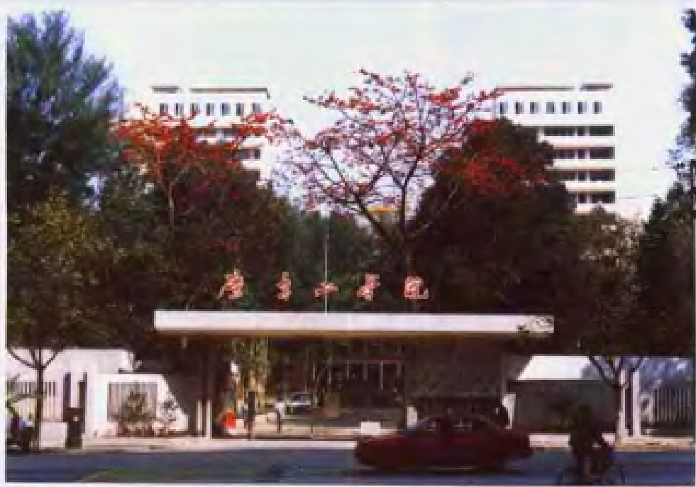
华南师范大学教学大楼