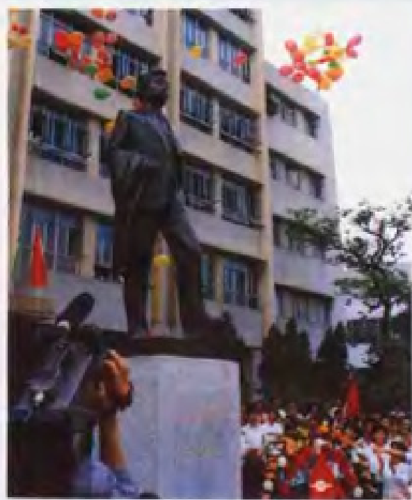
▲1987年4月23日，坐落在仲恺农业技术学院的廖仲恺先生铜像落成典礼