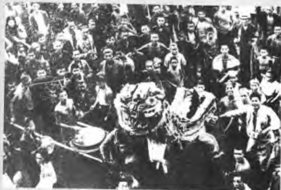
民国34年（1945年），广州工人欢庆抗日战争胜利。