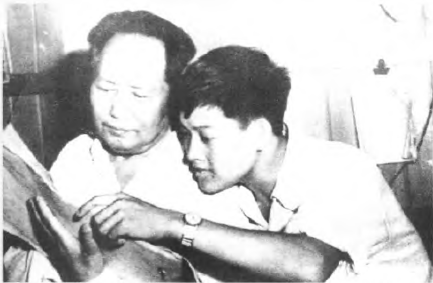
1956年5月29日，毛泽东在广州造纸厂视察时与磨木车间团支部书记一起看值班长记录簿。