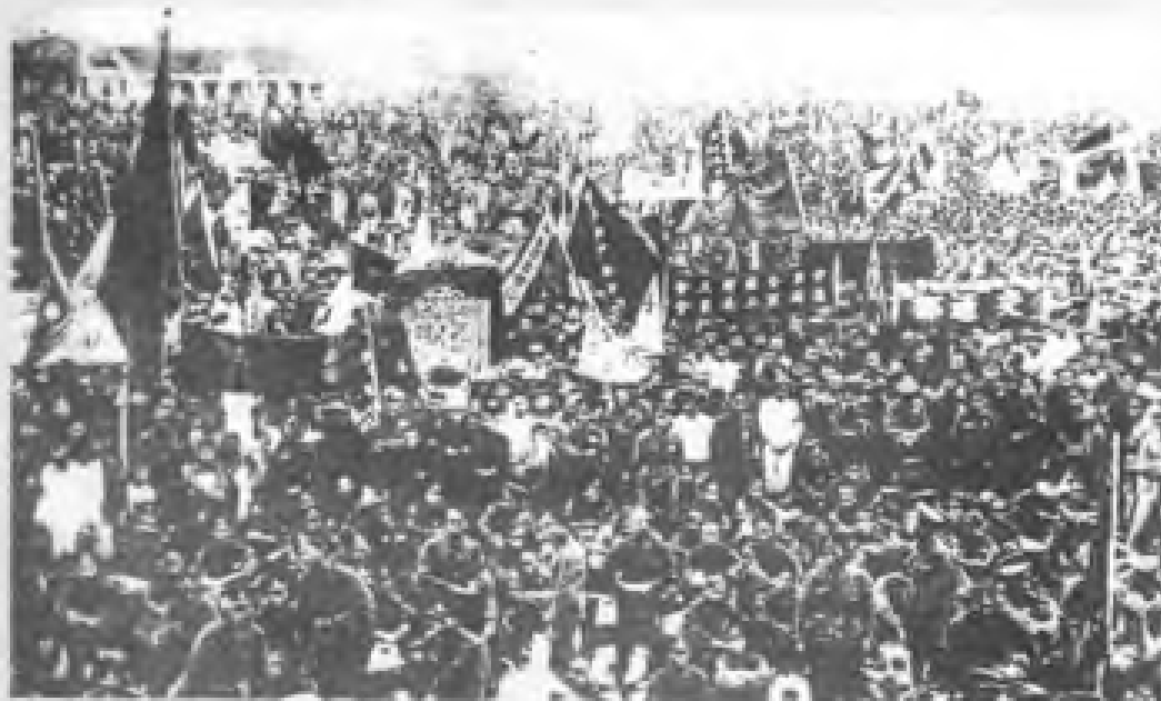
民国15年（1926年）5月1日，第三次全国劳动大会与广东省农民第二次代表大会在广州同时开幕，广州工、农、兵举行庆祝五一节示威大游行。