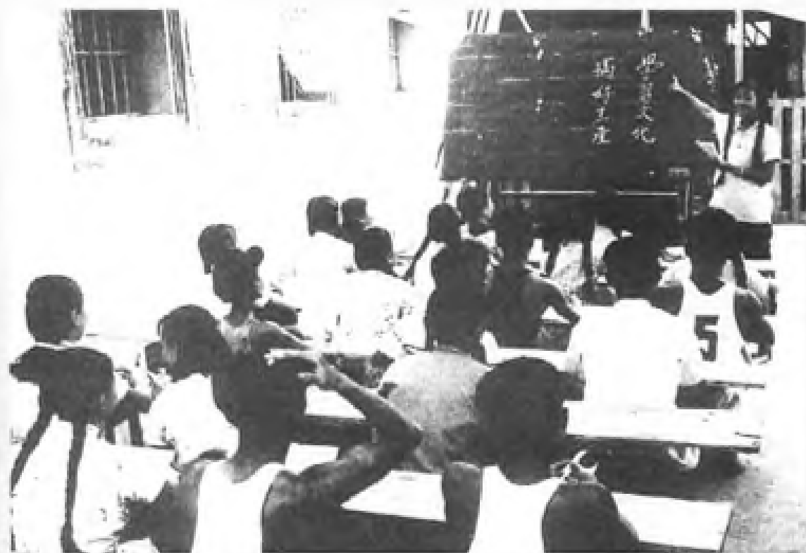
汕头工人学习文化。