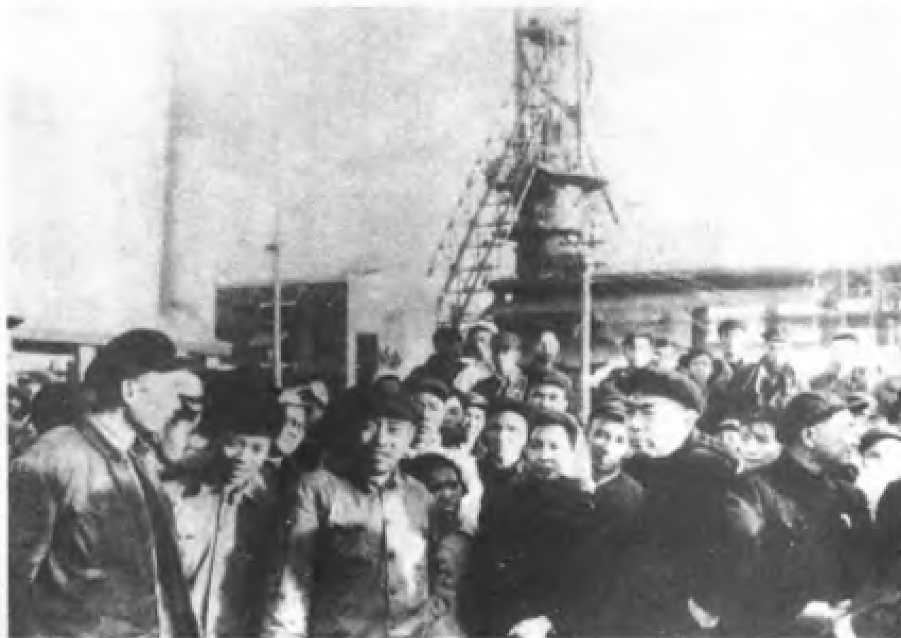
1958年7月，周恩来与广州造船厂工人在一起。