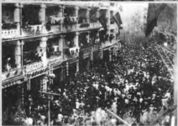
民国11年（1922年）1月，香港海员大罢工爆发。