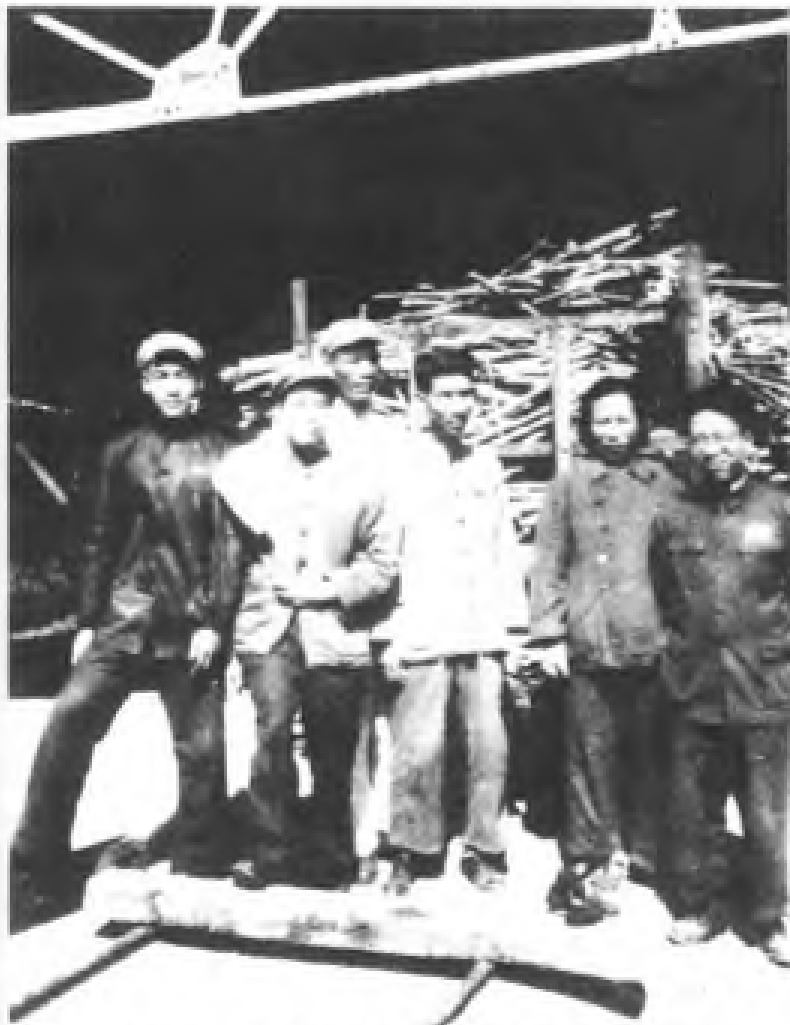
50年代初，广东省总工会工作组在顺德糖厂。