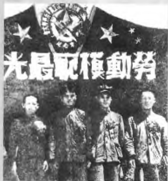
1950年9月，广州市第一次工农兵劳动模范大会上工人劳模合影。