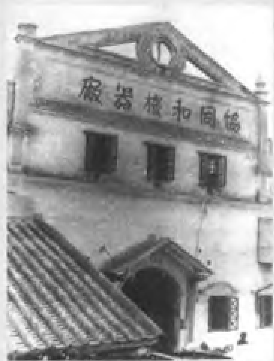
民国元年（1912年）在广州建立的协同和机器厂。