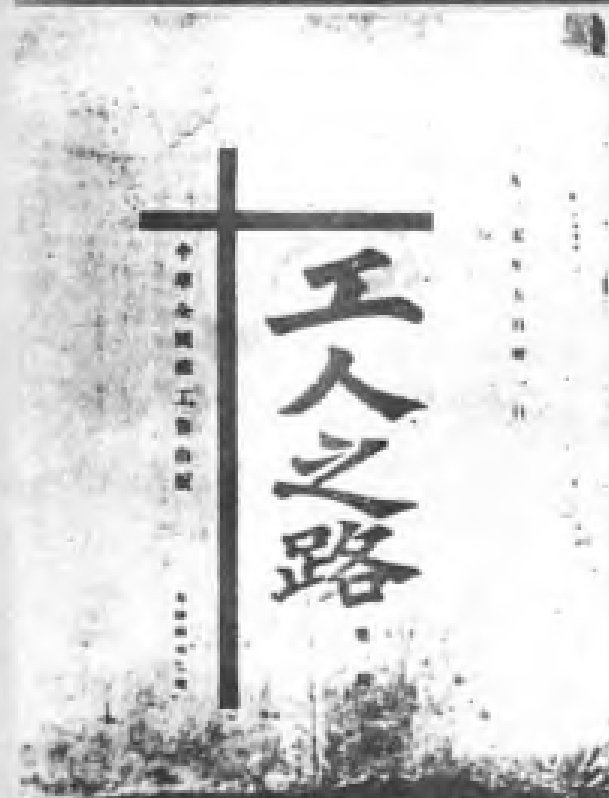
省港罢工委员会机关刊物《工人之路》。