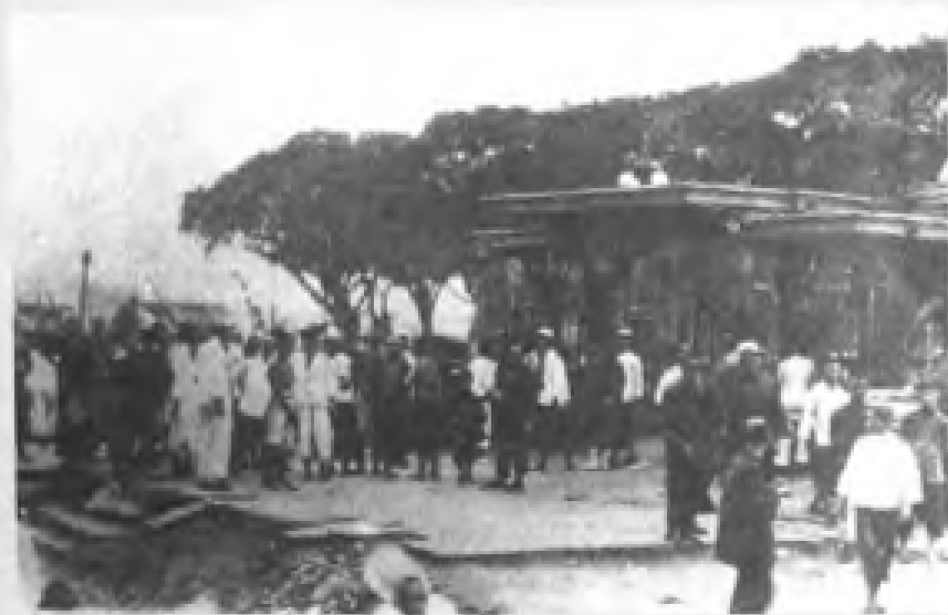
民国13年（1924年）7月，广州沙面租界的3000多名洋务工人为反对英法帝国主义实施侮辱中国人民的《新警律》，举行罢工，罢工在全国工人的支持下取得胜利，迫使帝国主义者取消苛例，取得胜利。