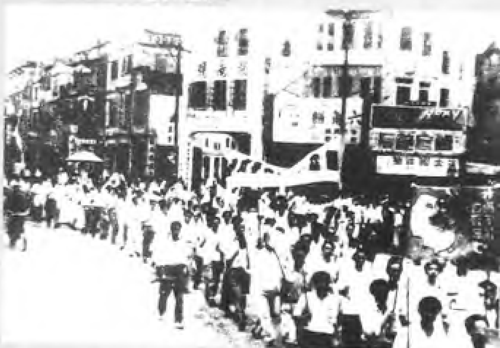
民国36年（1947年），广州人民举行“反内战、反饥饿、反迫害”大游行。