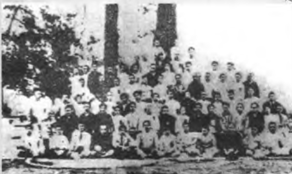
民国11年（1922年）5月1日，中国第一次全国劳动大会在广州召开，图为大会代表合影。