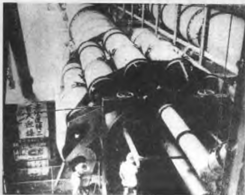
建国初广州西村水泥厂职工创安全生产300天记录，迎接“七一”党的生日。