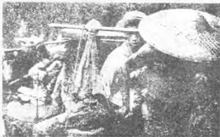
民国15年（1926年）9月，支援北伐战争的省港罢工工人运输队。