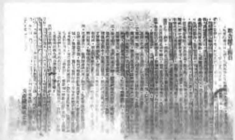
中共广东支部发表《敬告罢工海员》书。