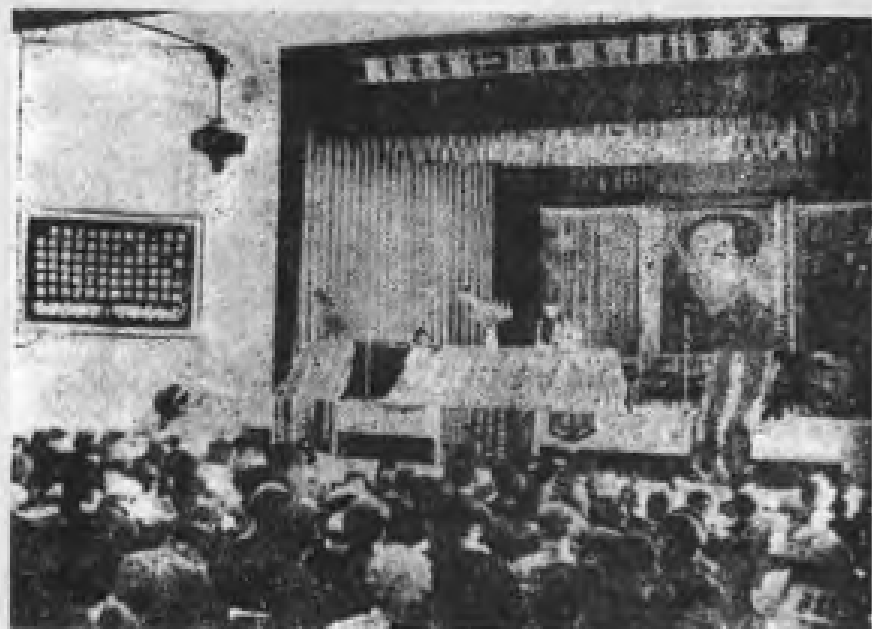
1953年4月，广东省第一届工会会员代表大会召开，广东省总工会成立。