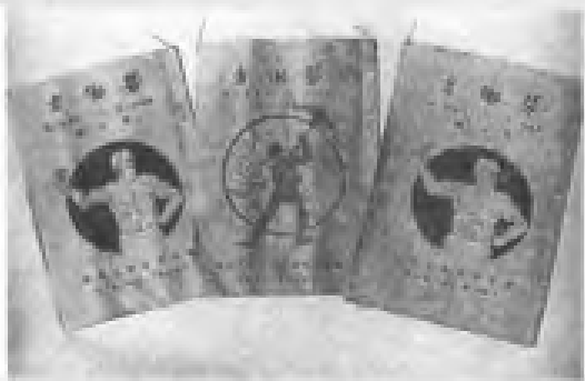
五四运动时期革命知识分子在广东宣传马克思主义，在工人阶级中产生深远影响。