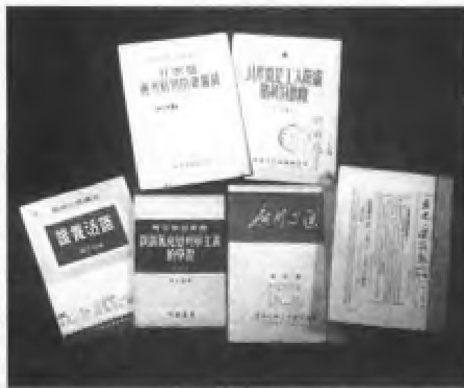
建国初期部分广东工人读物与工会工作刊物。