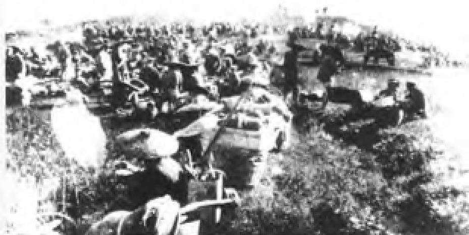
为统一广东革命根据地，省港罢工工人配合革命军参加了讨伐陈炯明和邓本殷的东征和南讨。