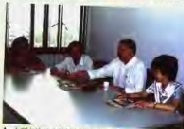
▲ 本所与波兰商务领事洽谈合作项目。