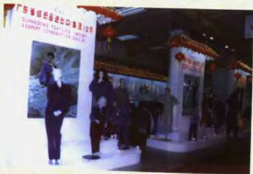
广东省纺织品进出口(集团)公司1996年春季中国出口商品交易会的展厅。