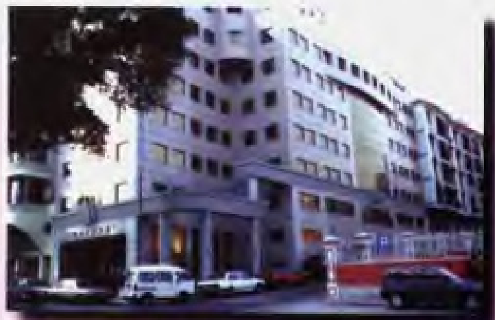
南粤集团大厦 Nam Yue (Group) Building

Nam Yue (Group) Co., Ltd. is a representative economic organization of Guangdong Provincial Government in Macau, as well as the sole agent in the Territory for all the import and export corporations and other economic enterprises Guangdong. The business scope of the Group Company, initiated with the import and export trade, covers trading, manufacture, finance, transportation, tourism, hotels, project contracts, real estate, insurance, labour service export and property management as a whole, which guarantees the diversified, associated and transnational business activities, so the the Group Company takes pride in its large scale and comprehensive economic strength.