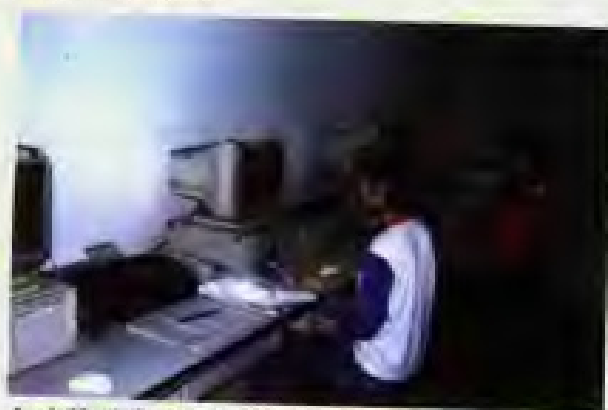
▲ 本所《国际市场每日传真EIF》制作室。