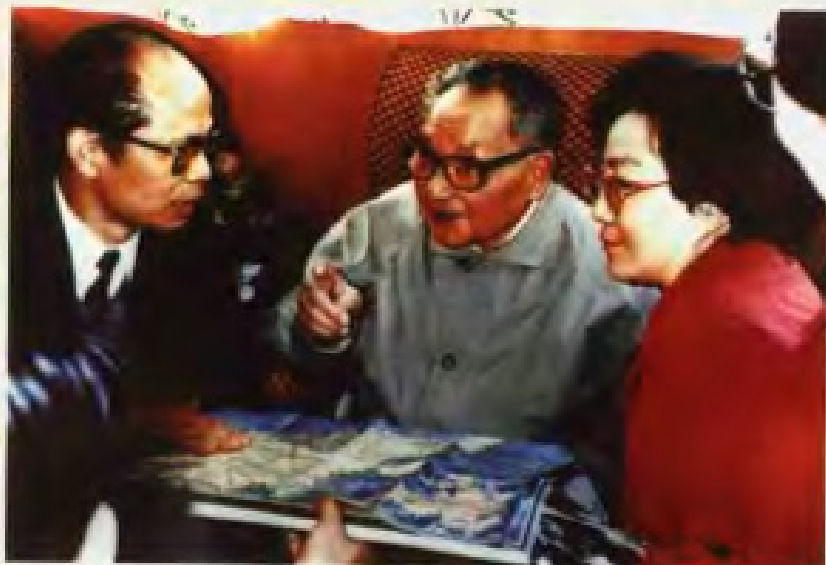
1992年1月23日，邓小平同志视察广东时与中共广东省委书记谢非同志交谈。