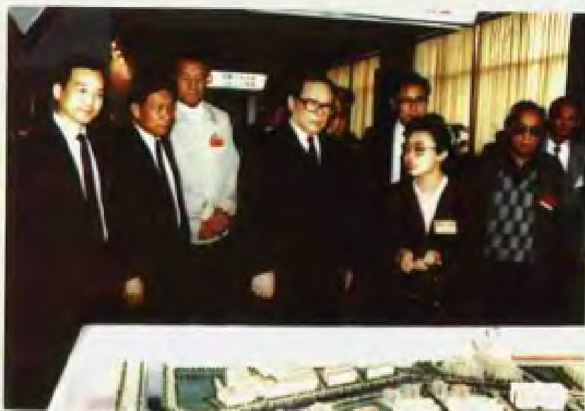
1991年12月17日，江泽民总书记参观汕头经济特区成立十周年成就展览。