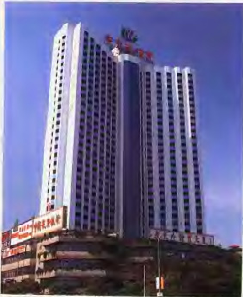
广东外经贸大厦 Guangdong Foreign Economic & Trade Building

广东省对外经济贸易委员会 (简称广东省外经贸委), 是广东省人民政府主管全省对外经济贸易工作的部门, 在业务上接受中国对外贸易经济合作部的指导, 主要任务是: 贯彻执行国家和省关于发展对外经济贸易的方针、政策、法令和指示, 归口管理全省对外贸易和对外经济技术合作。我们竭诚欢迎海内外各界朋友前来广东进行经济技术合作及开展贸易往来, 并为此提供服务。