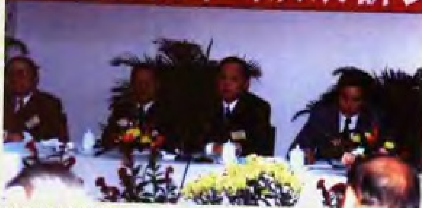
广东省经贸委主任徐德志（左三），副主任梁耀文（左四），原副省长曾定石（左二），出席广东国际经贸学会十四周年纪念暨广东外贸改革与发展研讨会。