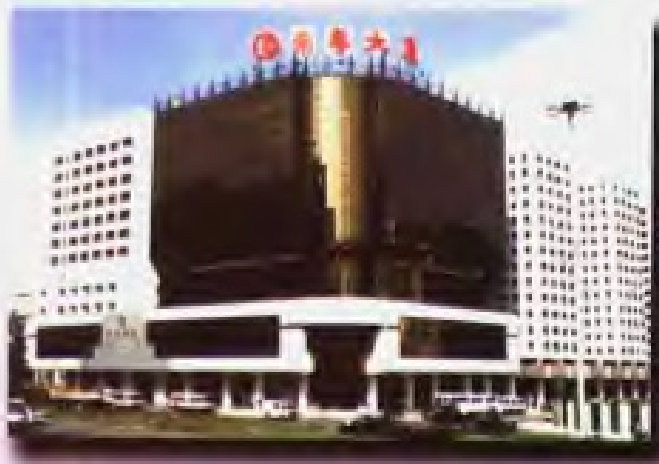
南粤大厦 Nam Yue Building