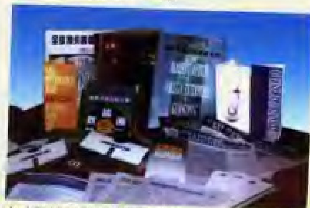
▲ 本所出版的部分信息系列产品。