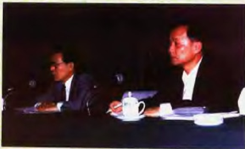
1994年，在广州召开省利用外资工作会议，卢瑞华副省长(左)，徐德志主任在主席台上，卢瑞华副省长在会上作工作报告。