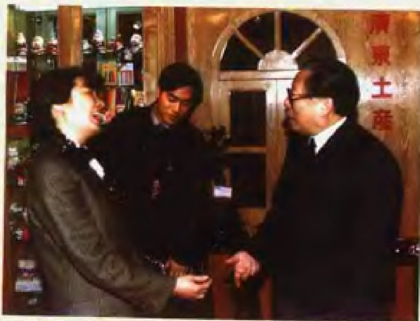
1991年12月，在北京举办的全国外贸出口商品生产基地成果展览会上，中共中央总书记国家主席江泽民来到广东省土产进出口（集团）公司的展台上参观，并与工作人员亲切交谈。