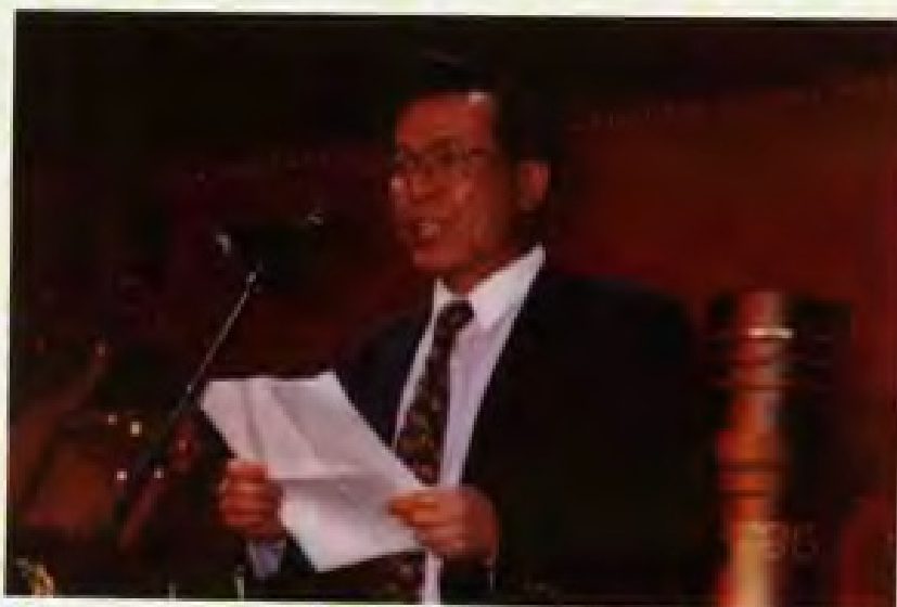
1996年1月5日，广东省副省长卢瑞华在香港会议展览中心庆祝粤海企业集团有限公司成立十五周年晚会上发表讲话。