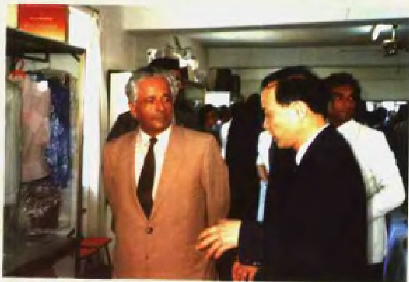
1989年2月21日 毛里求斯总理贾格纳特在广东省外经贸委徐德志同志陪同下，参观在该国举办的广东省出口商品展销会。