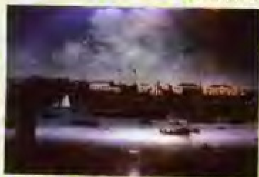
▲ 图为鸦片战争前的广州港。