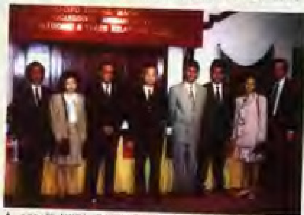
▲ 1994年本所与欧洲资讯(澳门)中心签署合作协议。

该所拥有多年从事对外经济贸易业的、经验丰富的研究员及经济师，聘请了一批资深专家学者为高级咨询员，并建立了信息员网络，形成了高效率的研究、咨询与信息一体化的工作系统。