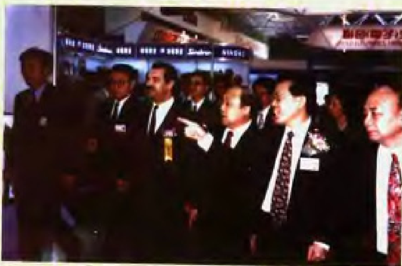
1996年4月15日，广东省省长卢瑞华(右二)视察第七十九届中国出口商品交易会展览馆。