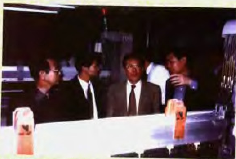
1996年4月17日，广东省省长卢瑞华到韶关视察了解国有企业在改革中如何重建机制，实现两个根本性转变。(图为卢瑞华省长到韶关第一棉纺厂视察)。