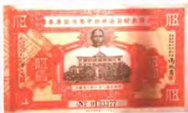
民國21年(1932年)廣東省財政廳發行的維持中幣有獎庫券