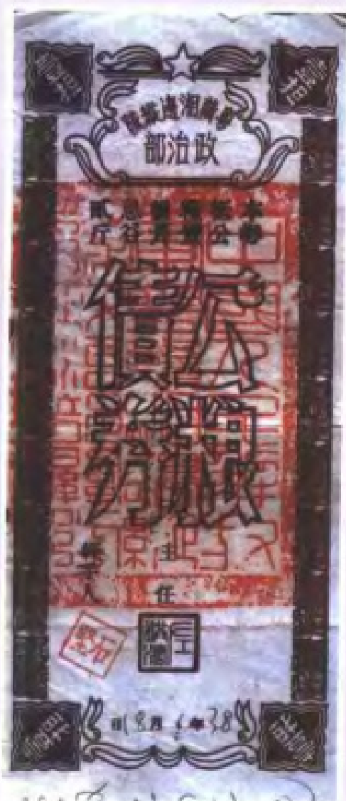
1949年6月粤赣湘边队政治部发行的公粮公债券