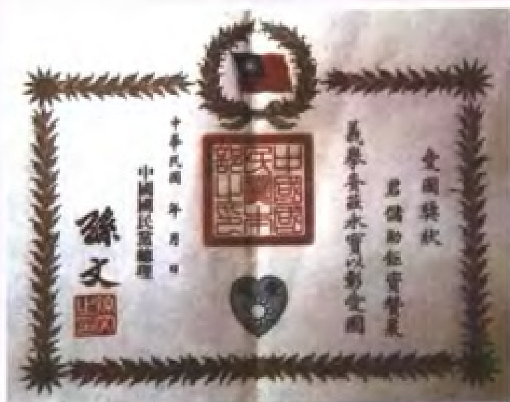
民國初，中國國民黨總理孫文簽署的愛國捐獻獎狀