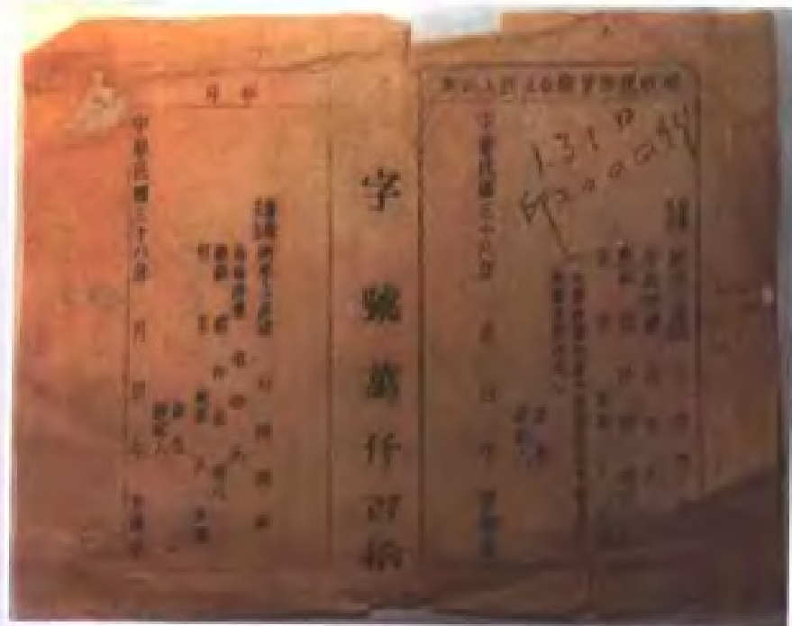
1949年初潮汕人民抗征队使用的货物税收据