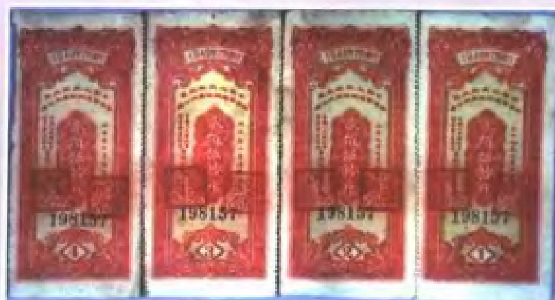
1949年7月间粤赣边纵队发行的军粮公债券