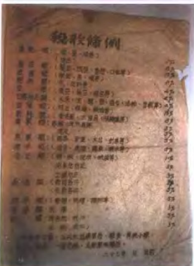
1948年潮汕人民抗征队制订的《稅收条例》

義舉外六十僑胞統籌債 捐達二百萬 秘幣是僑胞 之模範 是抗戰之先聲！ 潮汕華僑抗戰籌款會 中華民國二十九年一月 周總理題詞