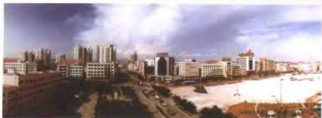
全国财政首 富镇——虎门镇