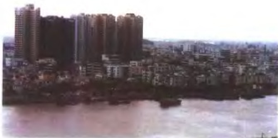
财政收入亿元镇——顺 德容奇镇建城一瞥