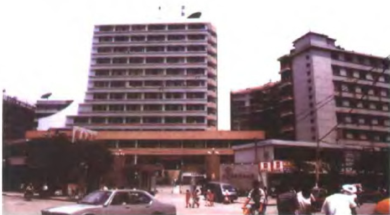
广东广播电视大学