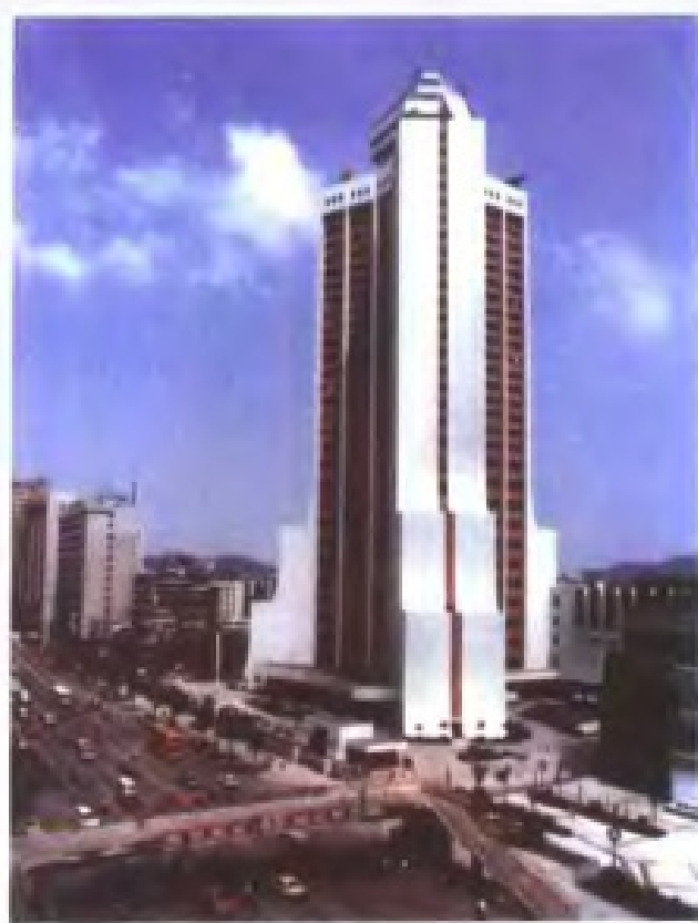
投资 1.28 亿元，建成于 1990 年的广东 电视中心大楼