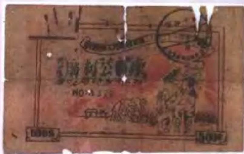
1949年秋粤桂边人民解放军二十团和二十一联合发行的胜利公债券