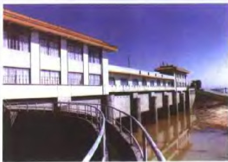
三水芦苞排灌水闸