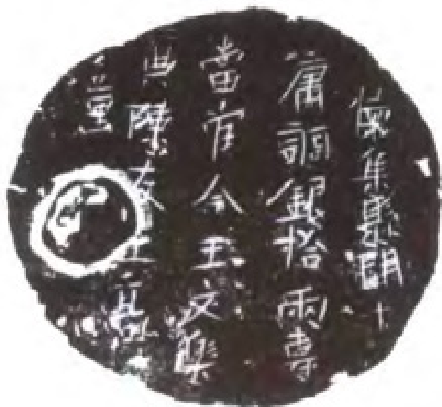
唐开元十年(722年)怀集县上缴的庸调银饼(1970年于西安市何家村出土)