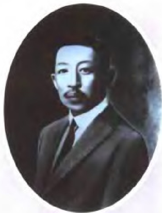
中华民国时期曾五任广东省财政厅(司)长的廖仲恺