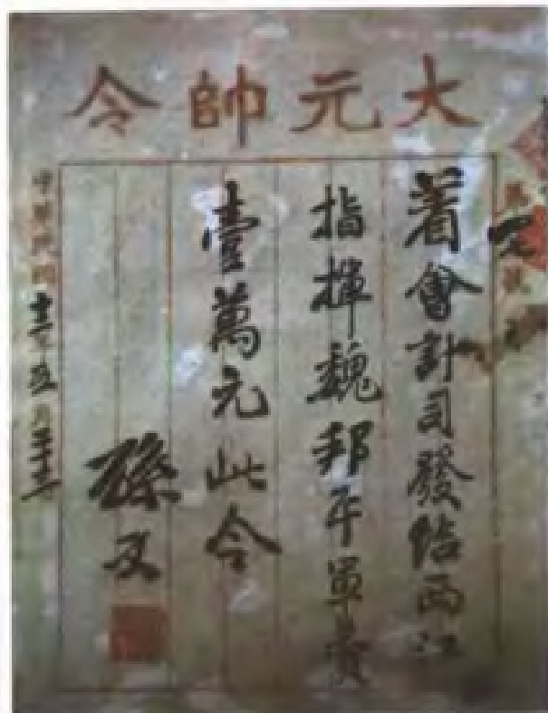
由中华民国军政府大元帥孫文批給西江總指揮的軍費手令