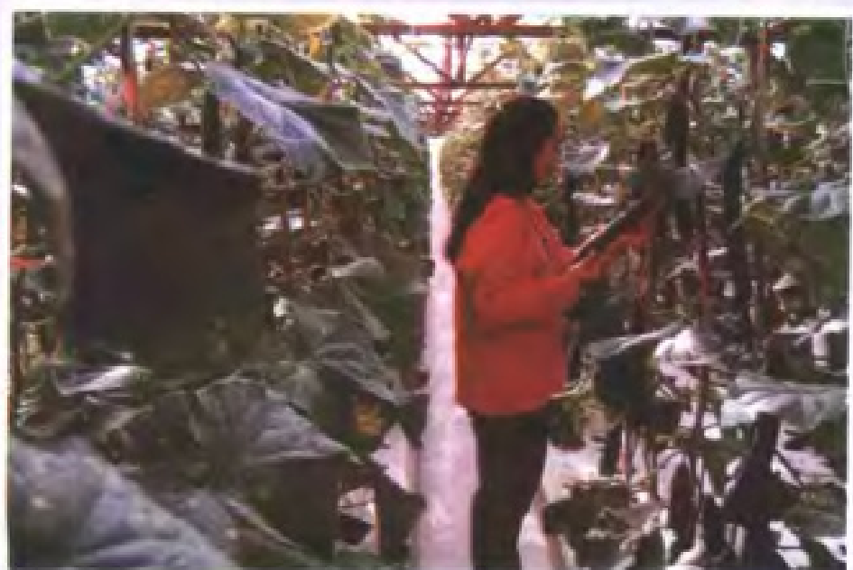
“菜篮子”工程项目之一 ——蔬果无土栽培