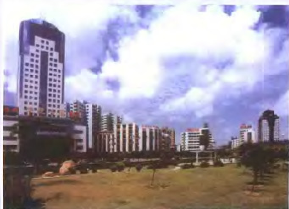
财政收入亿元镇 ——顺德大良镇