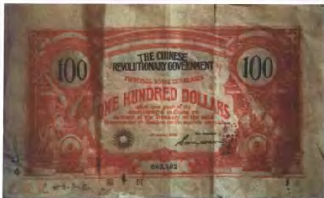
1906年广东革命组织在海外发行的债券