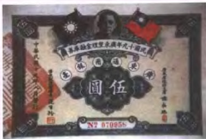
民國19年(1930年)廣東省財政廳發行的廣東省整理金融庫券