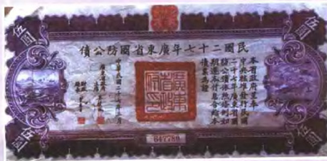
民國27年(1938年)廣東省政府發行的廣東省國防公債券