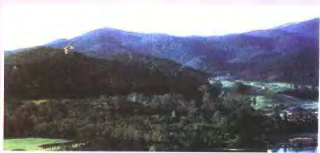
积极支持植树造林，荒山变绿坡