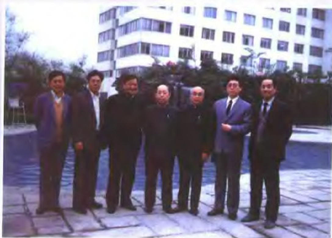
1987年，国务委员兼财政部长王丙乾到广东视察