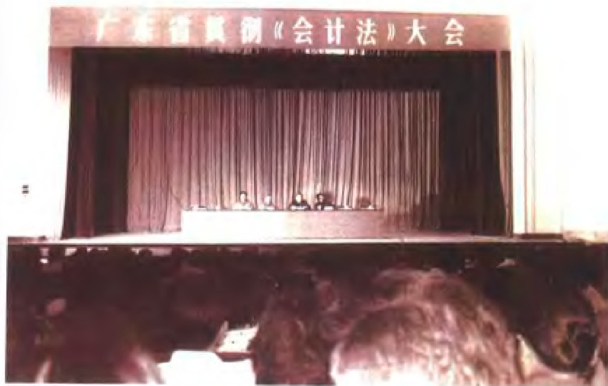
1985年广东省贯彻《会计法》大会