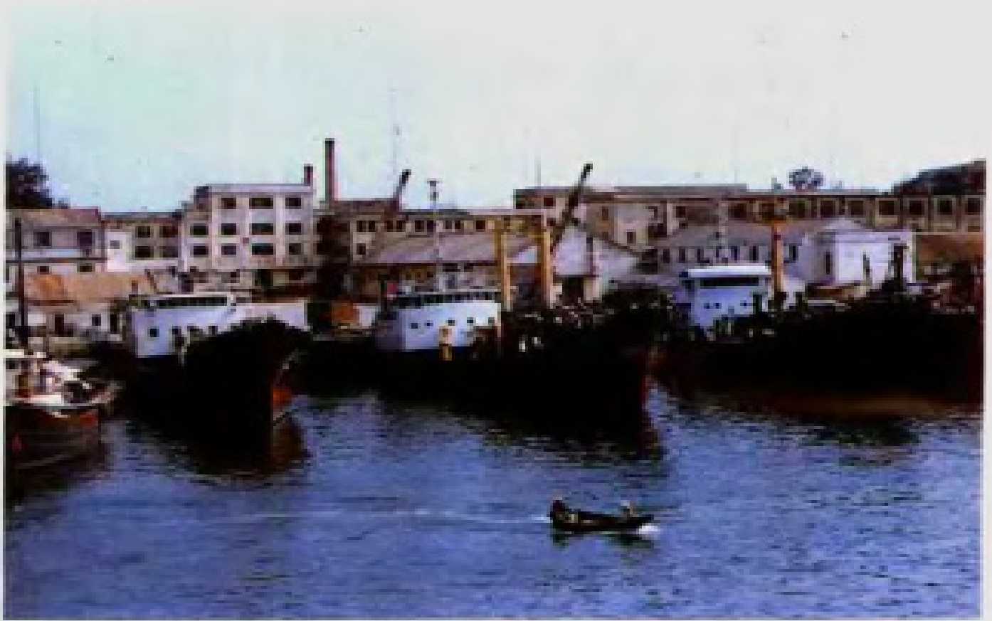
海运公司码头船只