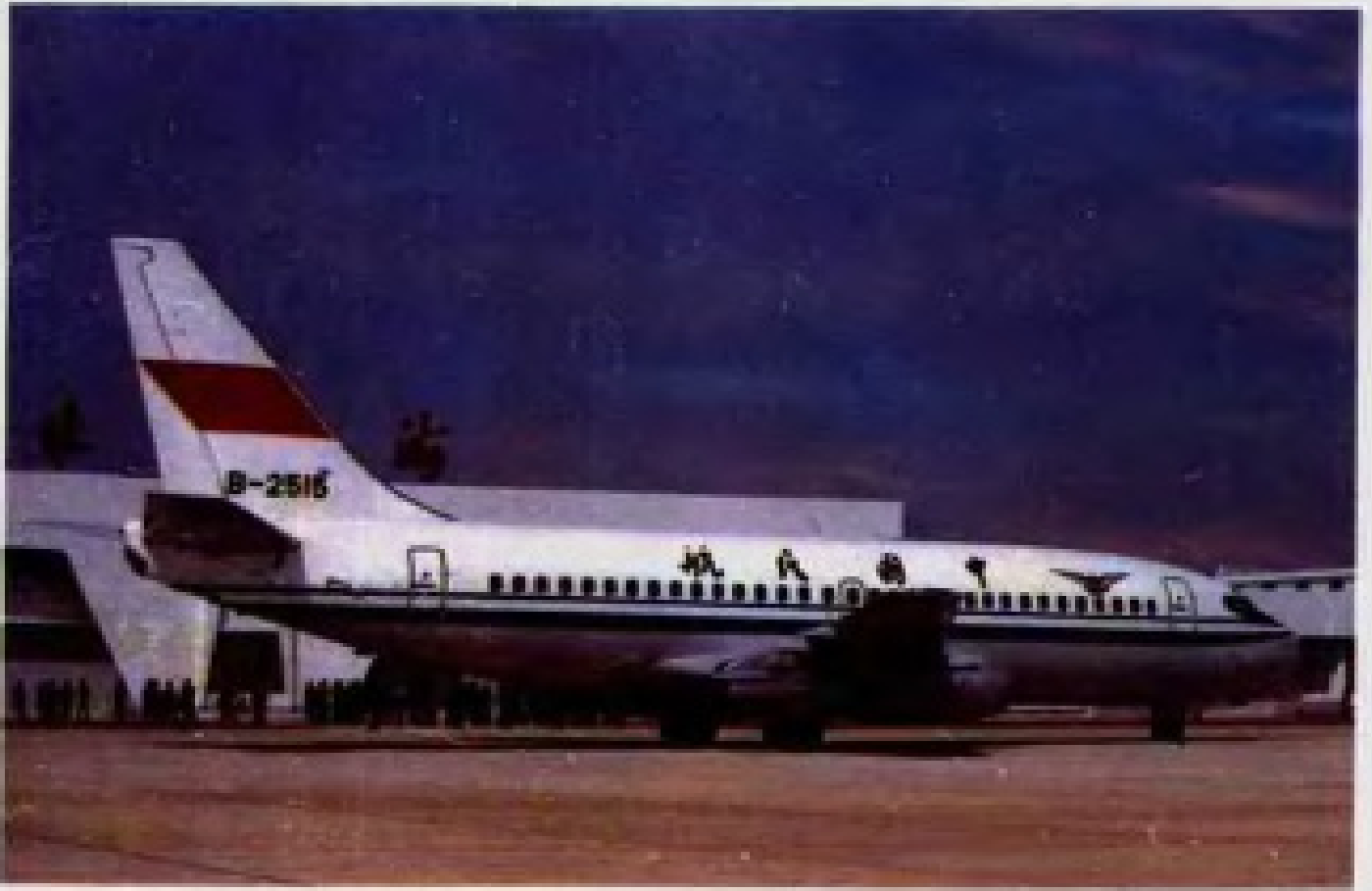
北海航空站福成机场