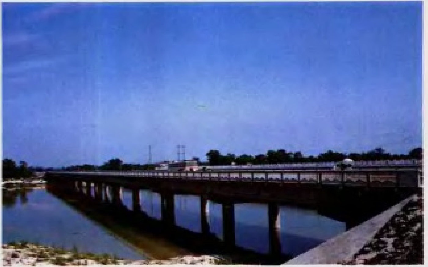
南宁—北海二级公路总江大桥