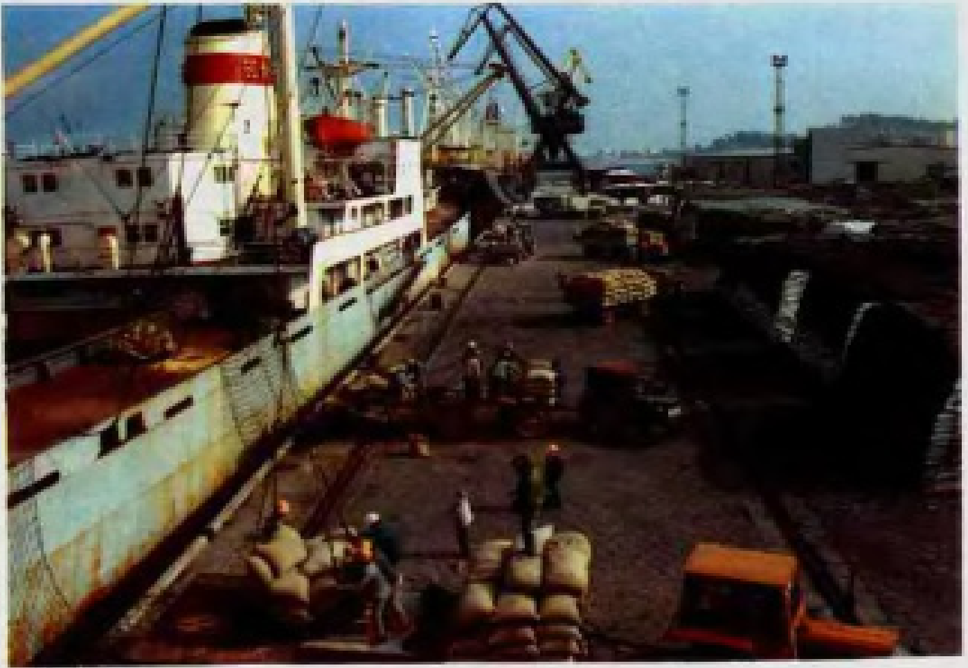
北海港万吨级码头