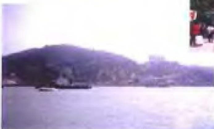
图三、“枕戈待旦”是 使南竿岛弥漫着往日 战地的气息