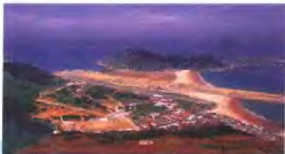
图一、马祖北竿机场系 马祖与台湾空中航运的 惟一小型机场