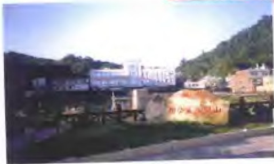
图四. 山陔村系马祖 政经文教中心