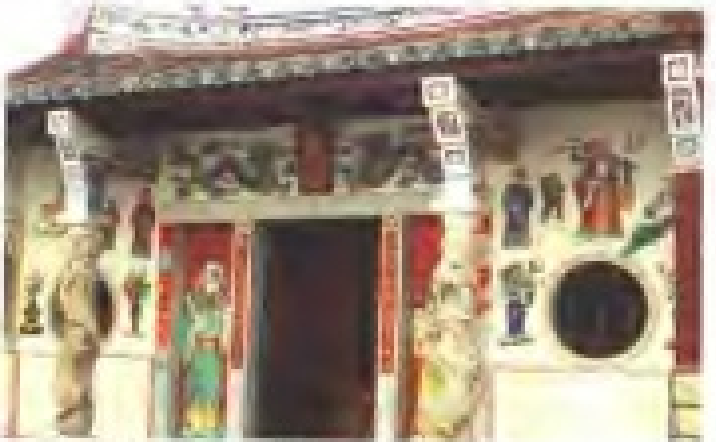
海山寺慈济宫 理事：林文堂 电话：5962972