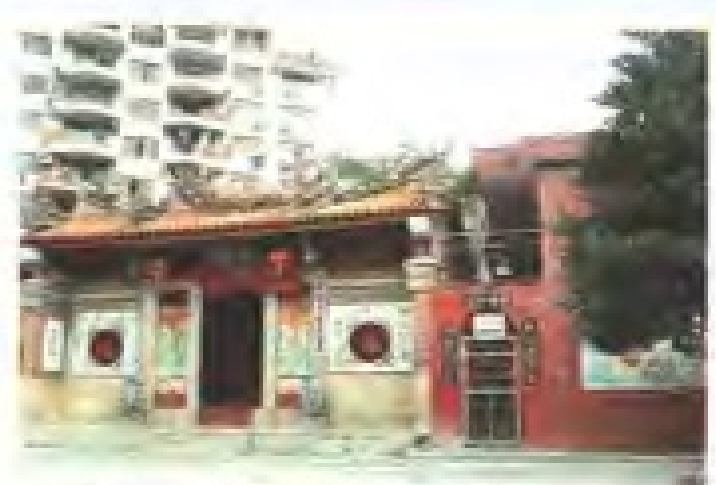
江仔尾路慈济宫 理事：梁永春 电话：5962971