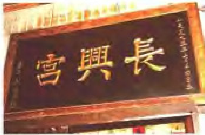
梧栖社保生宫 地址：梧栖街 电话：2819872