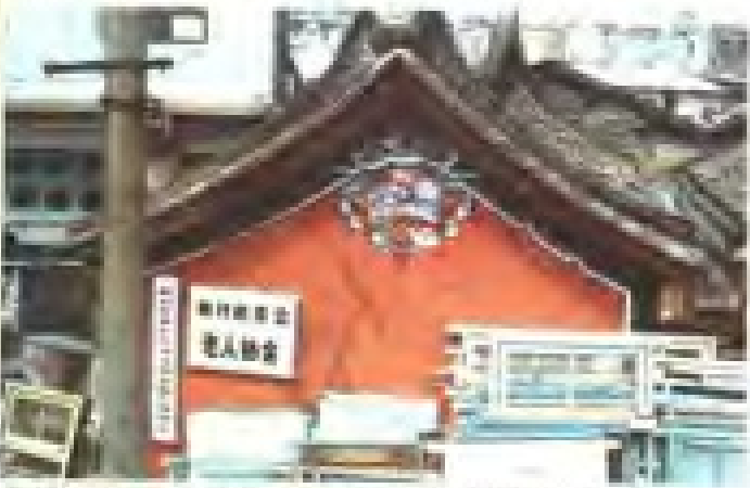
江仔尾路慈济宫 理事：刘平 电话：5962971、5962972