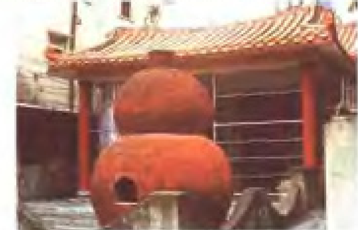
后山社保生宫 地址：林埭街 电话：2813482