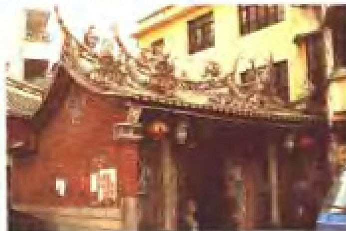
湖前社保生宫 地址：湖前街 电话：2818182