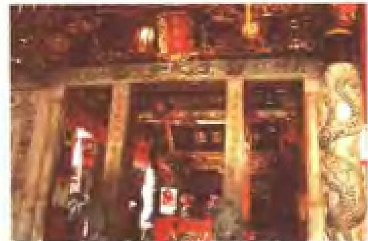
溪南村保生宫 地址：溪南街 电话：2818841