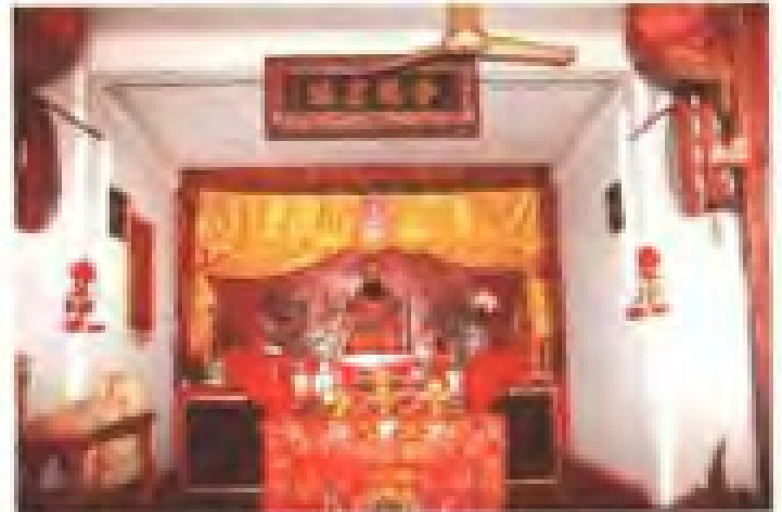
溪尾站保生宫 地址：古楼街 电话：2821803