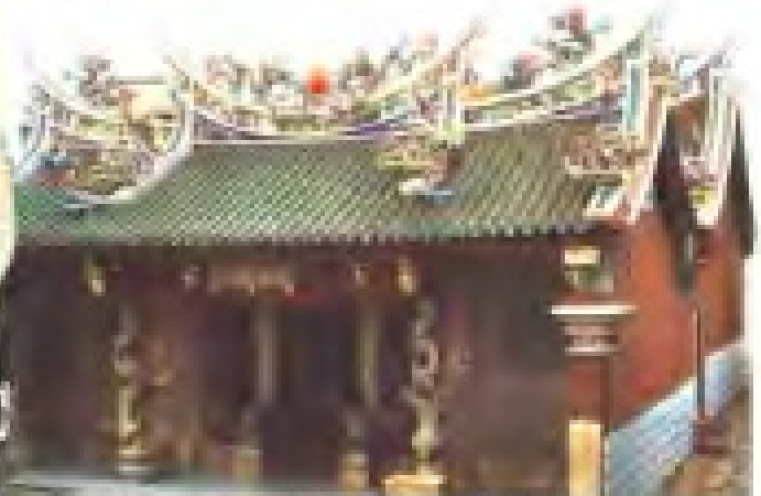
蔡厝村慈济宫 理事：陈定坤 蔡文博 电话：5921529、5921663