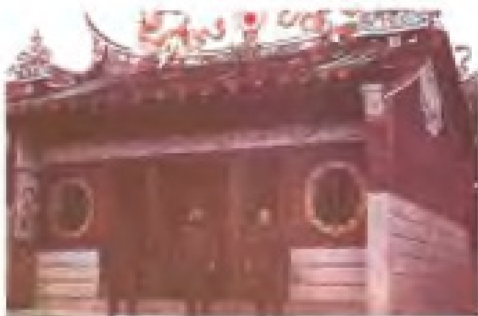
庵前村保生宫 地址：庵前街 电话：2810282