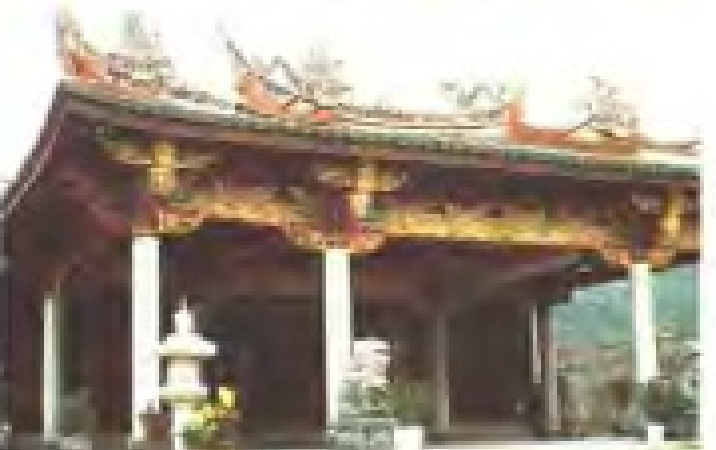
内厝港慈济宫 理事：陈礼忠 电话：5922524