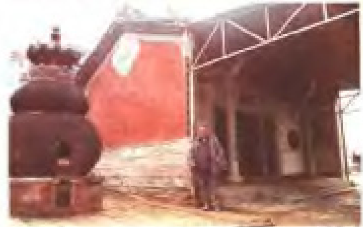
塘边村保生宫 地址：土金街 电话：2822241