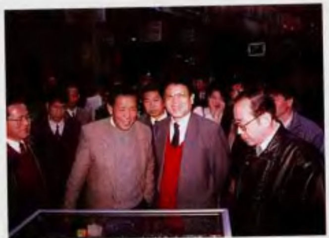
国务委员李瑞环到石狮考察小商品市场