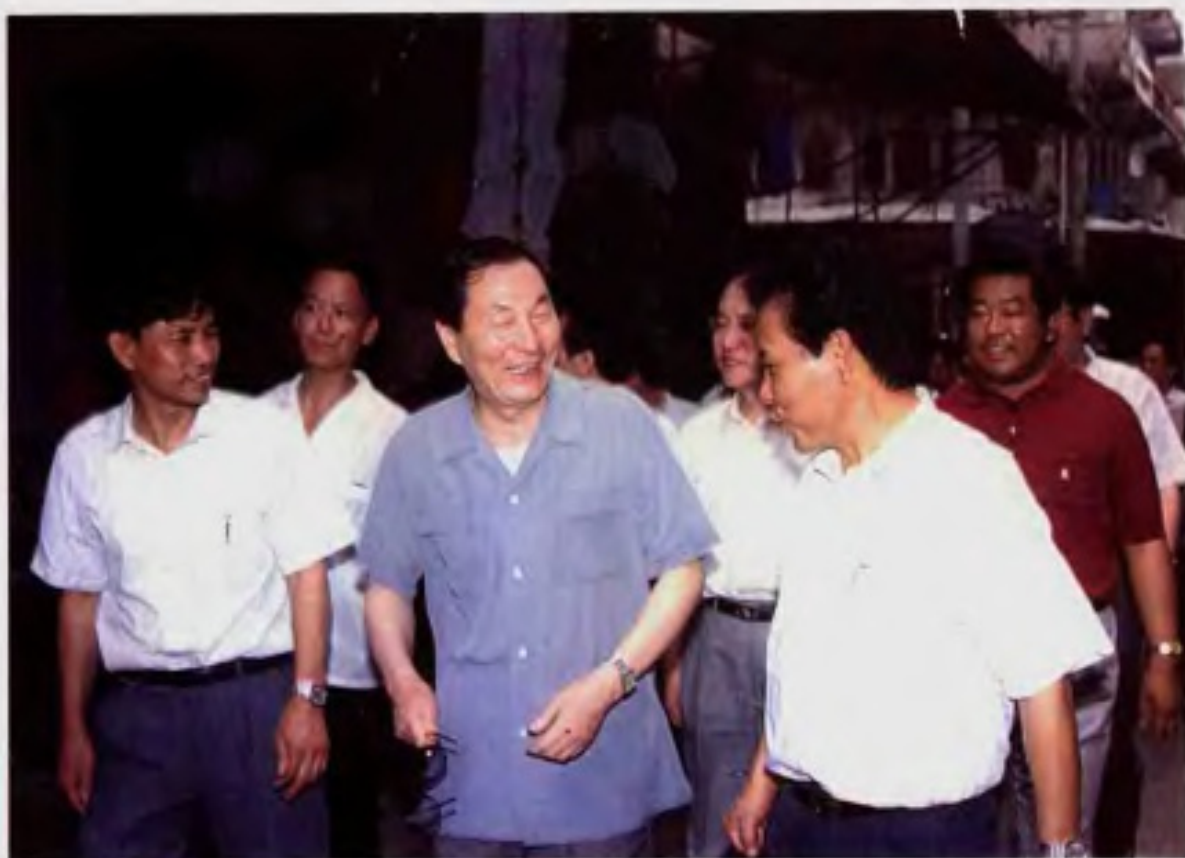
朱镕基总理视察石狮