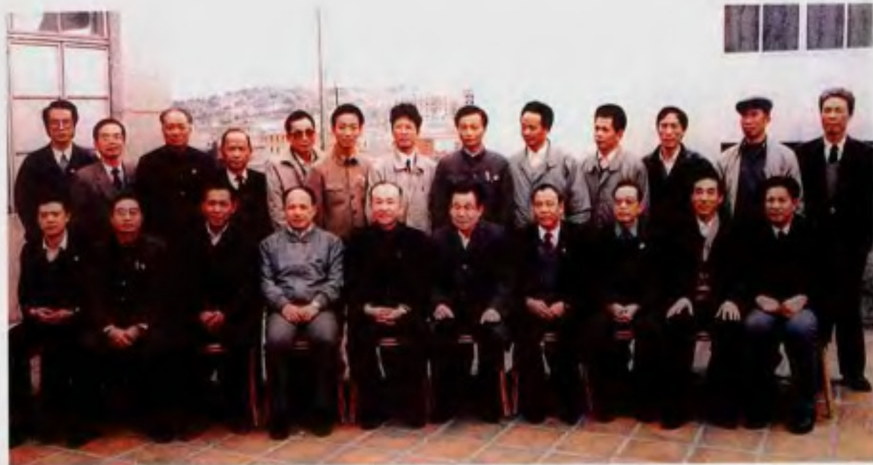
中共中央政治局常委、全国政协主席李瑞环视察石狮时与省、市领导合影