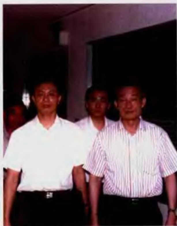
国务院副总理吴邦国视察石狮