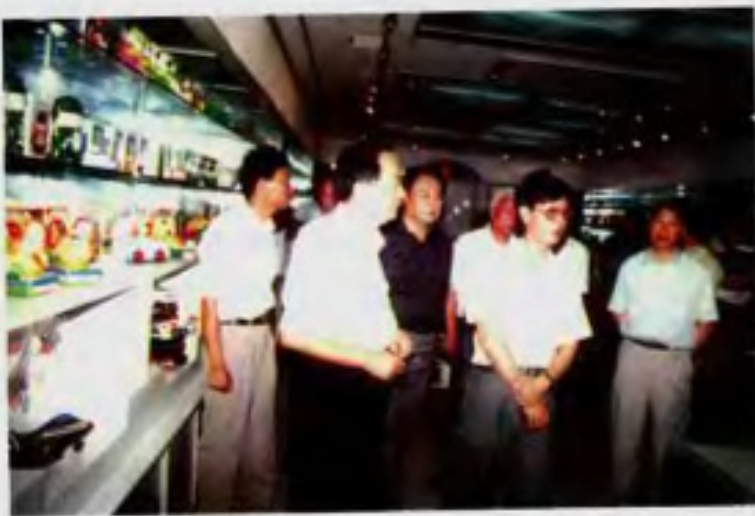
全国人大常委会副委员长田纪云在 石狮视察