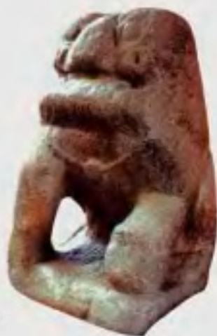
市名溯源—凤里庵前古石狮