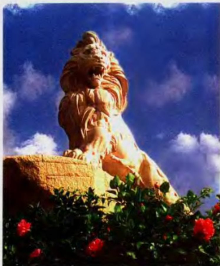
石狮市城雕——东方醒狮