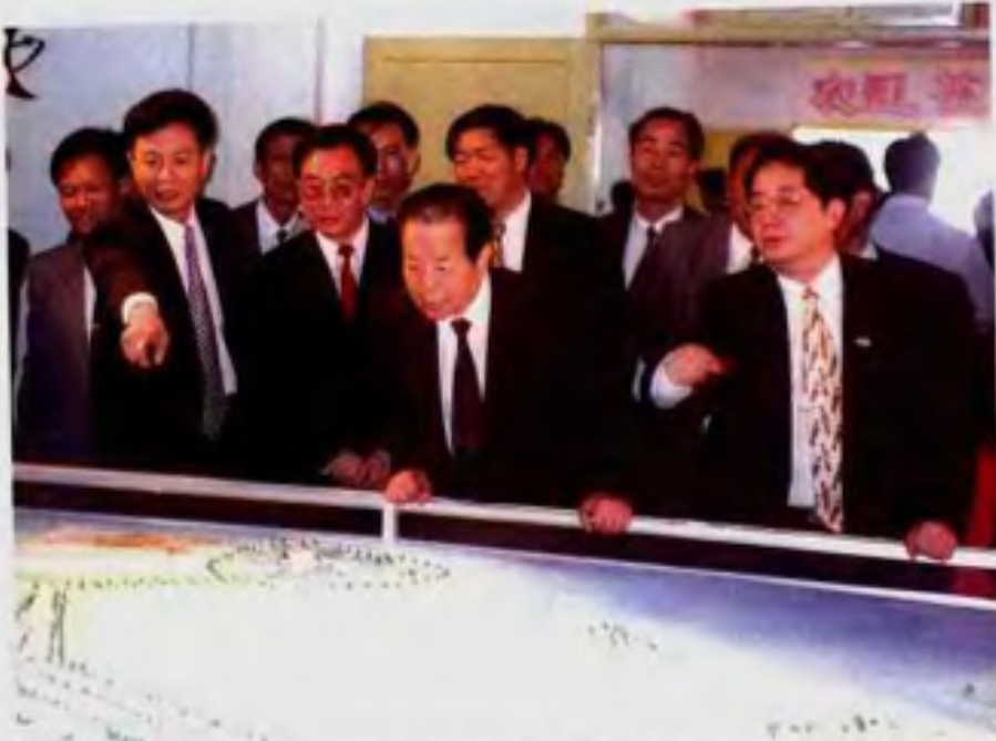
国务院副总理、外交部长钱其琛视察石狮闽南黄金海岸