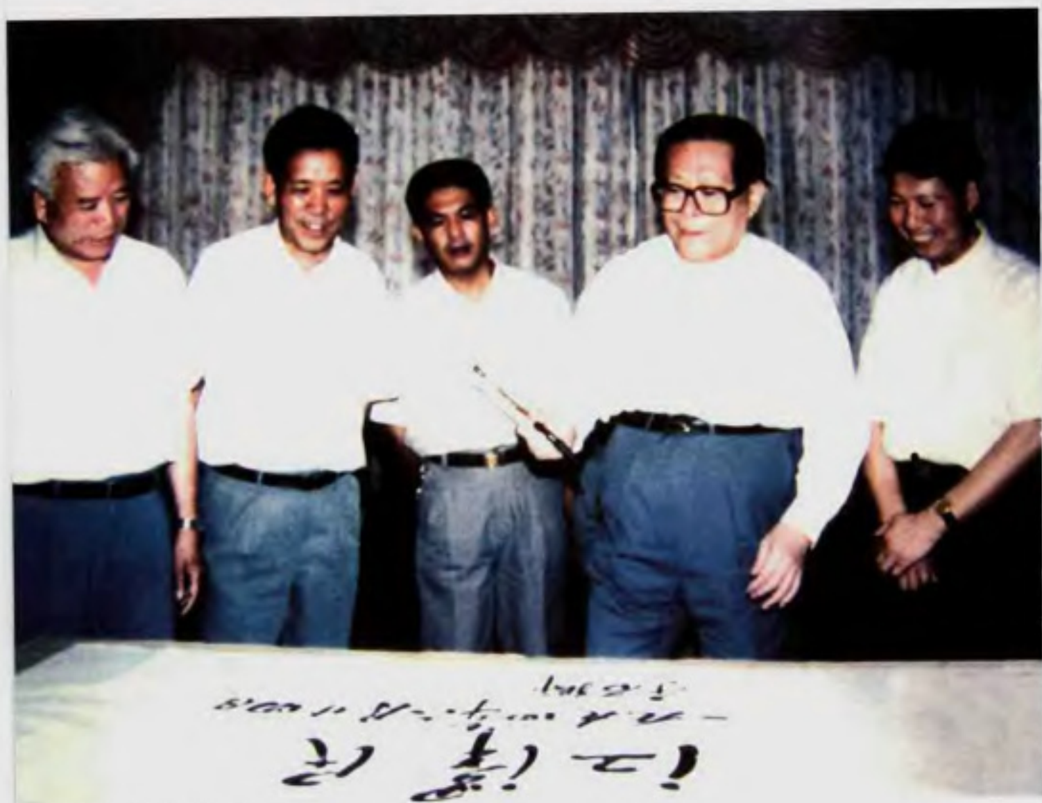
江泽民总书记在石狮考察