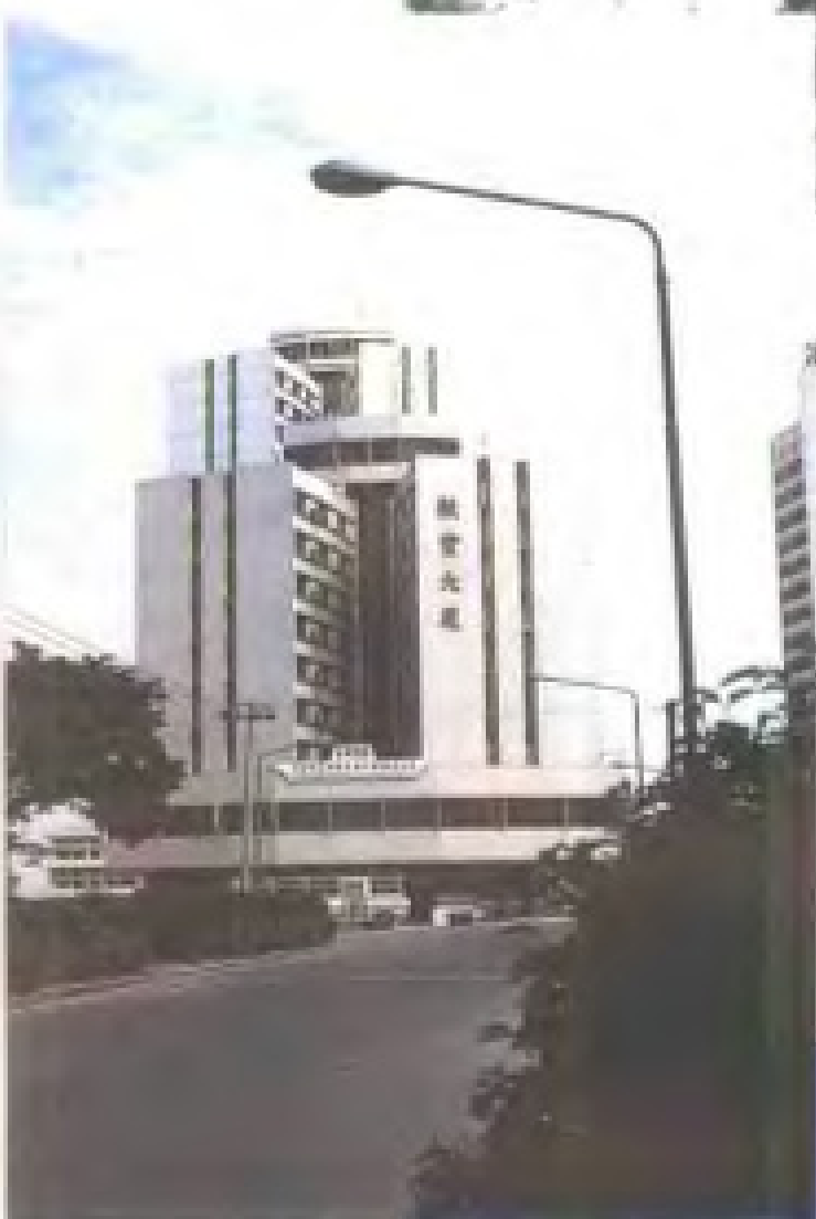
厦门航空有限公司航空大楼