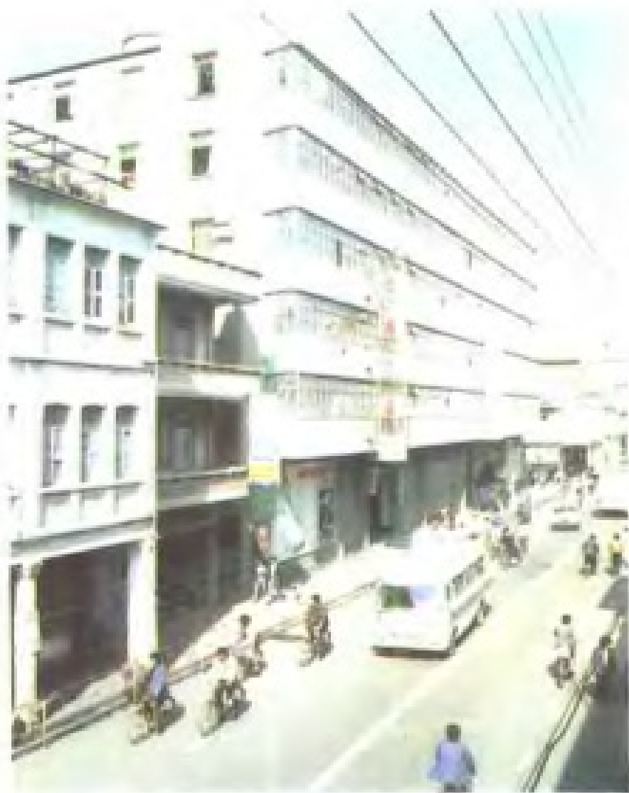
厦门市交通局大楼