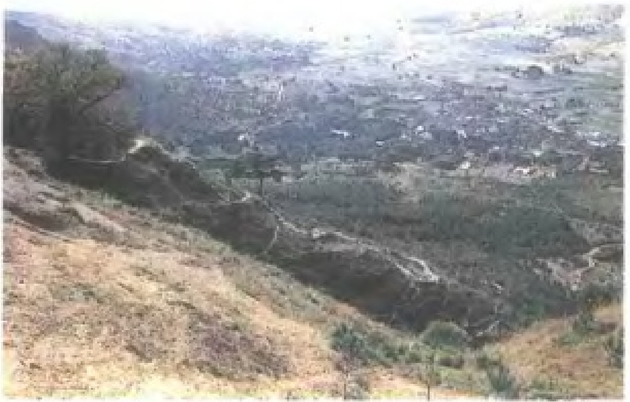
同安县新墟乡古道古宅十八弯