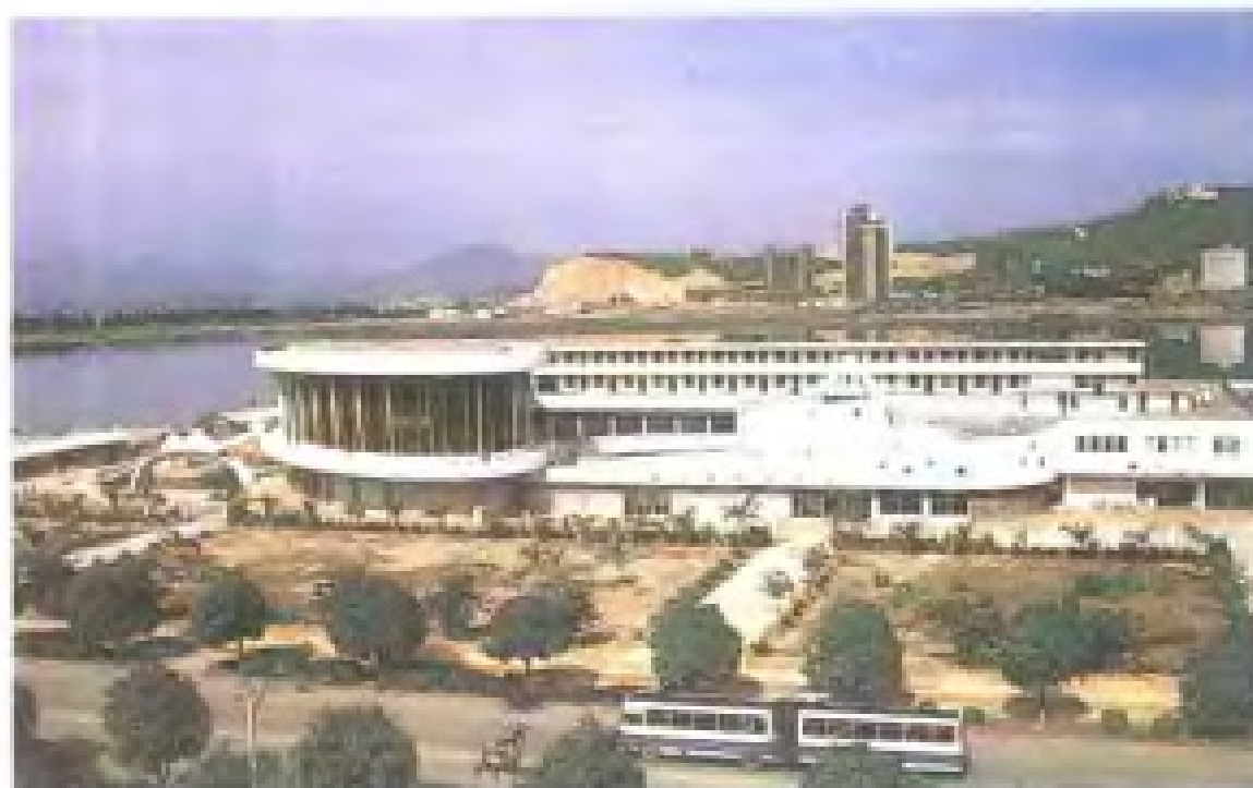
福建省汽车运输 总公司厦门分公 司新车站