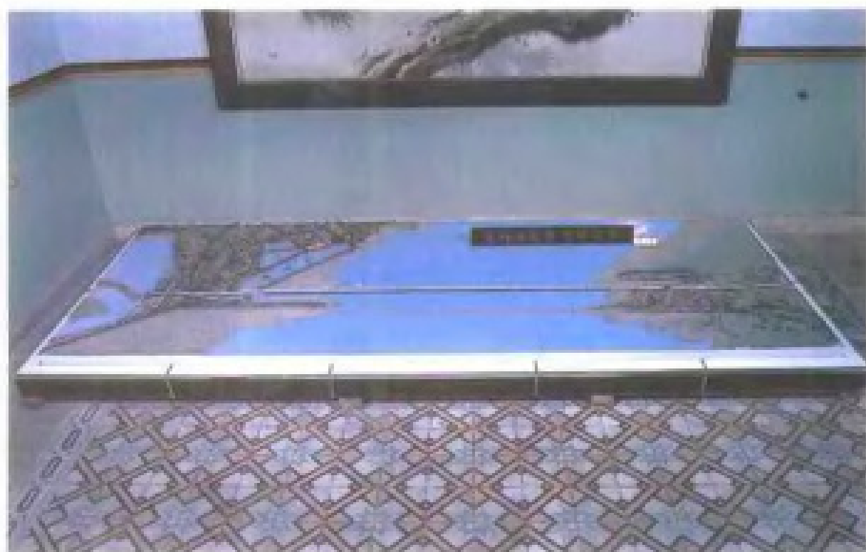
厦门高集海峡大桥模型