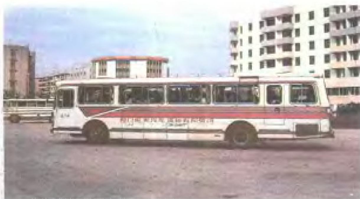
厦门联发汽车有 限公司客车