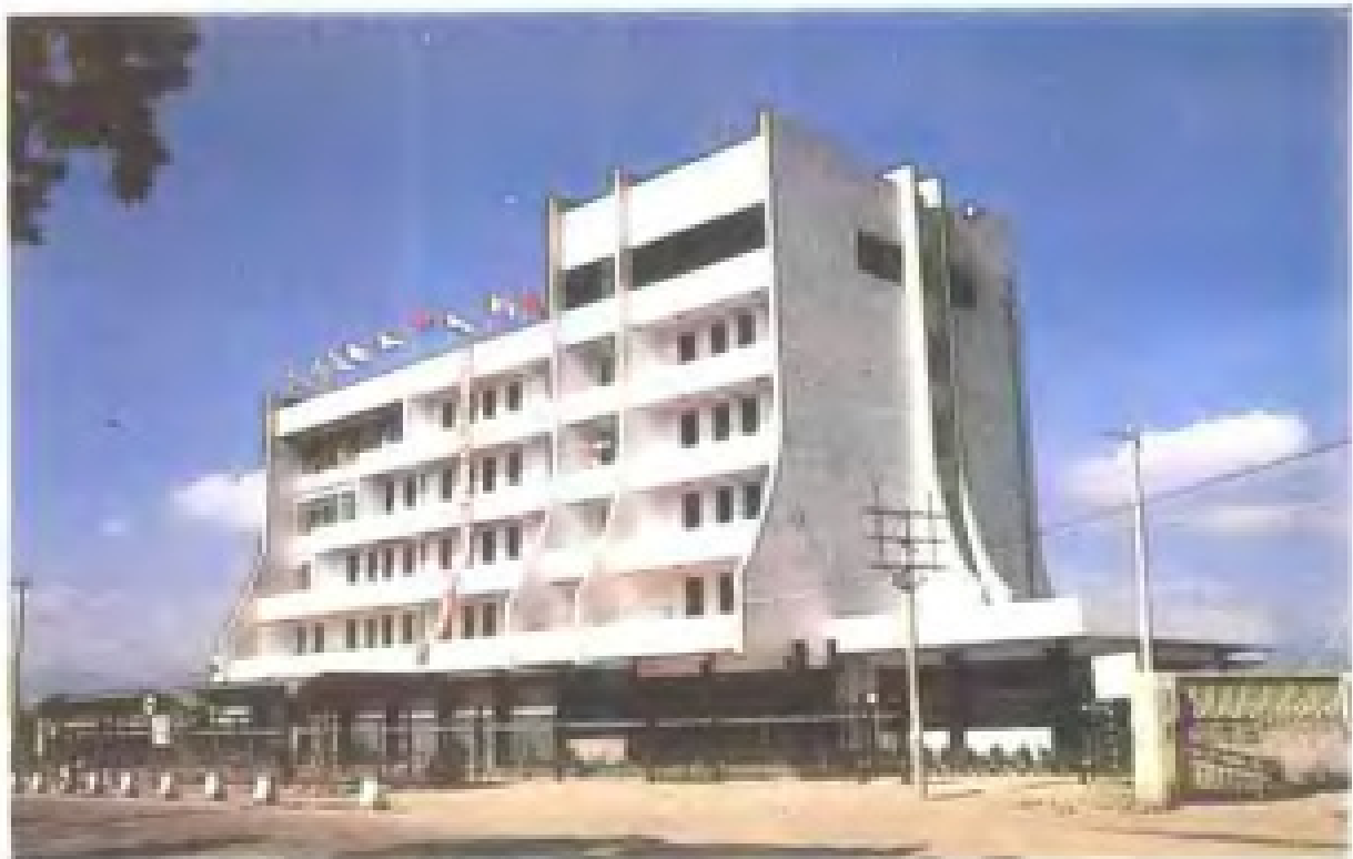
同安县交通局大楼