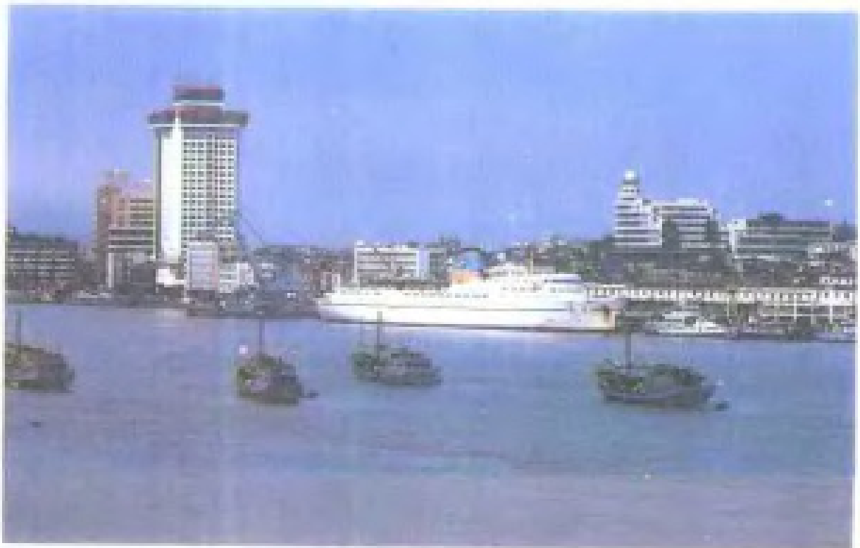
厦门轮船公司“集美号”轮