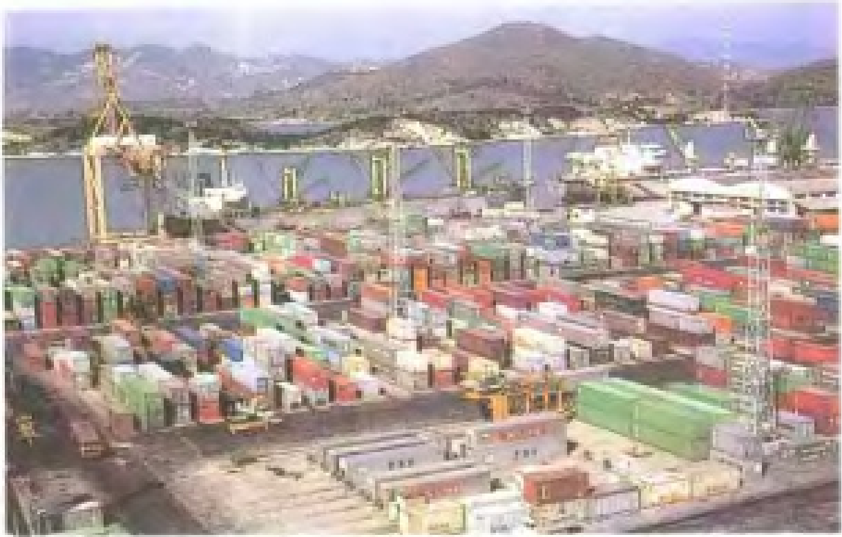
东渡港集装箱码头