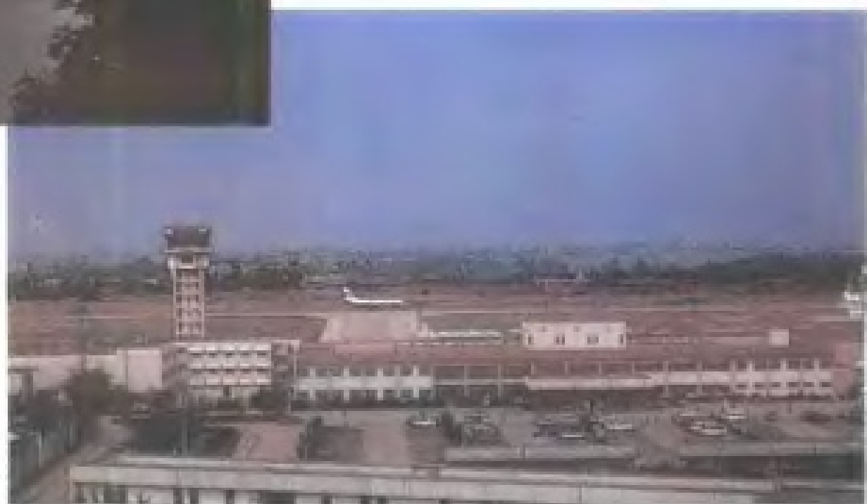
厦门高崎国际机场