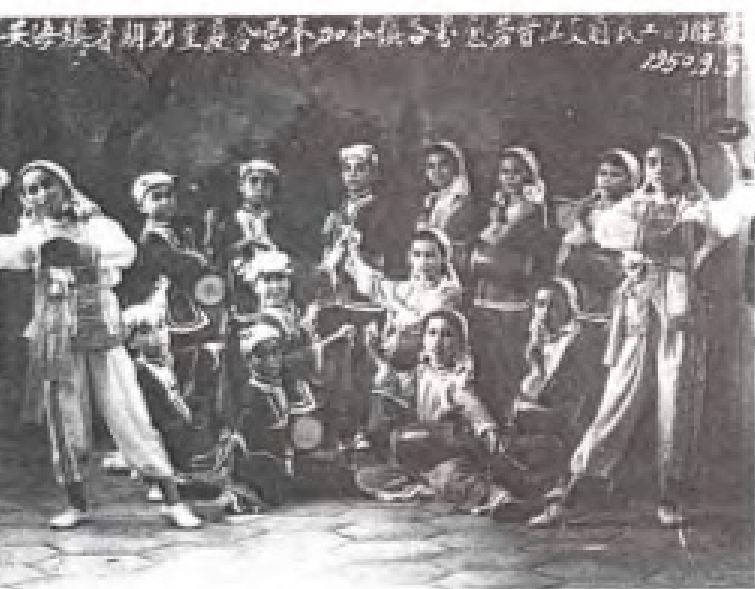
50年代小学生课余活动