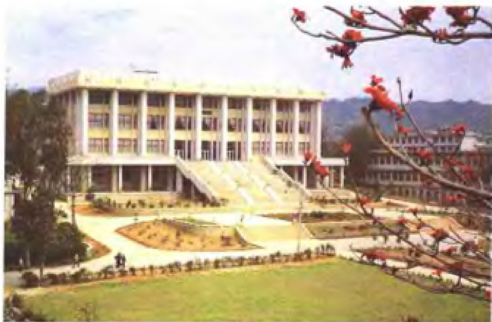
国立华侨大学陈嘉庚纪念堂