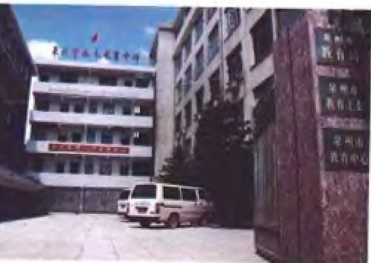
泉州市教育局机关大院