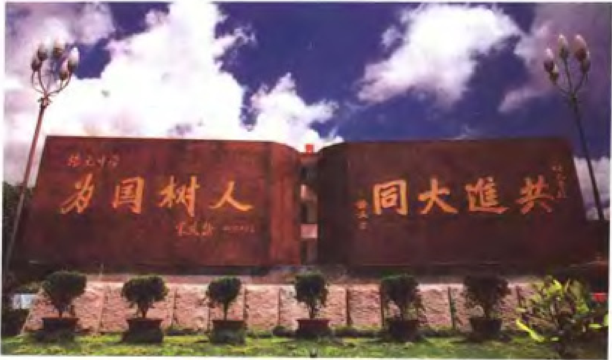
泉州培元中学孙中山、宋庆龄题词纪念碑