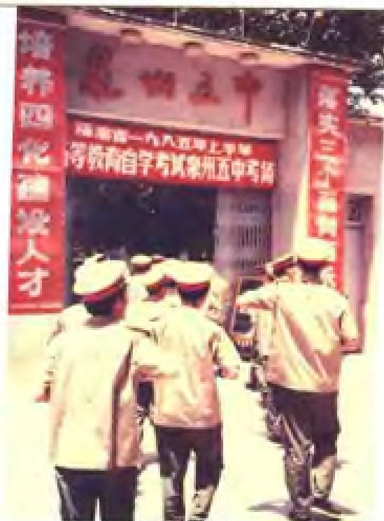
解放军官兵踊跃参加高等教育自学考试