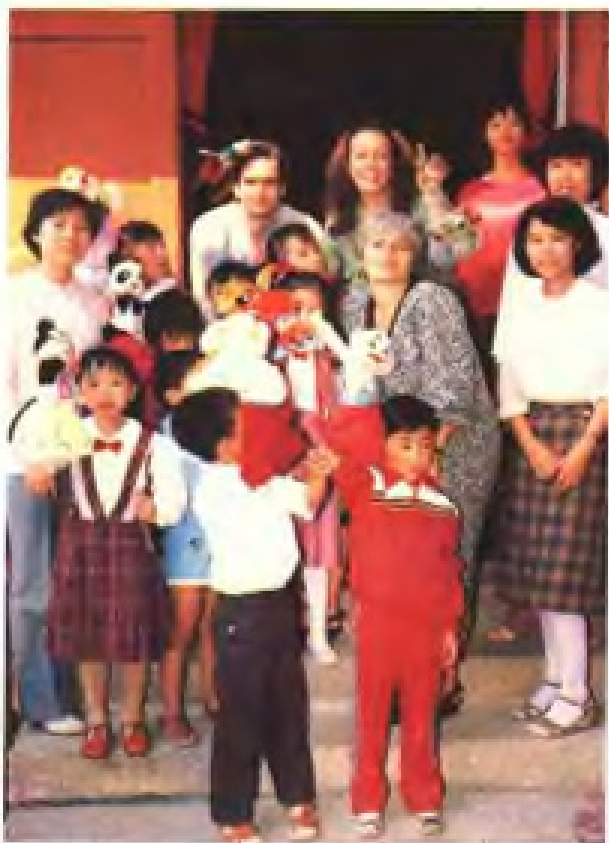
美国芝加哥学前教育考察团在 鲤城区实验幼儿园观摩幼儿游戏活 动