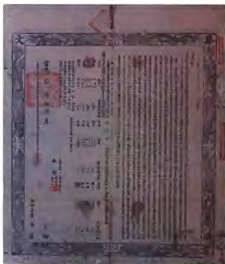
泉州府官立中学堂首届 毕业生毕业证书