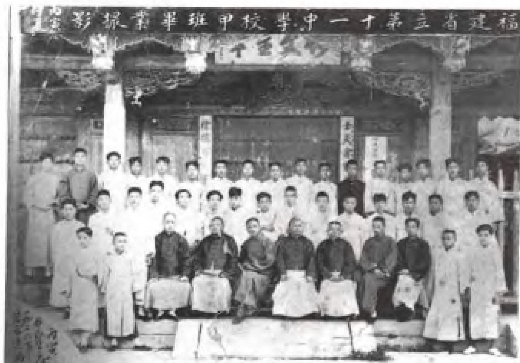
省立第十一中学(1926年)毕业照(校舍为清代泉州府贡院)