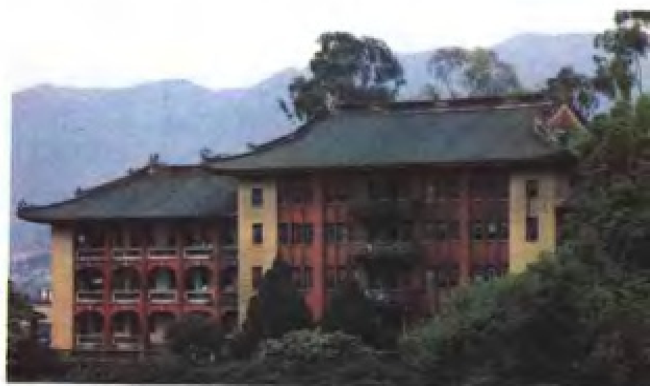
华侨李光前 1950 年捐建的南安国光中学新华楼