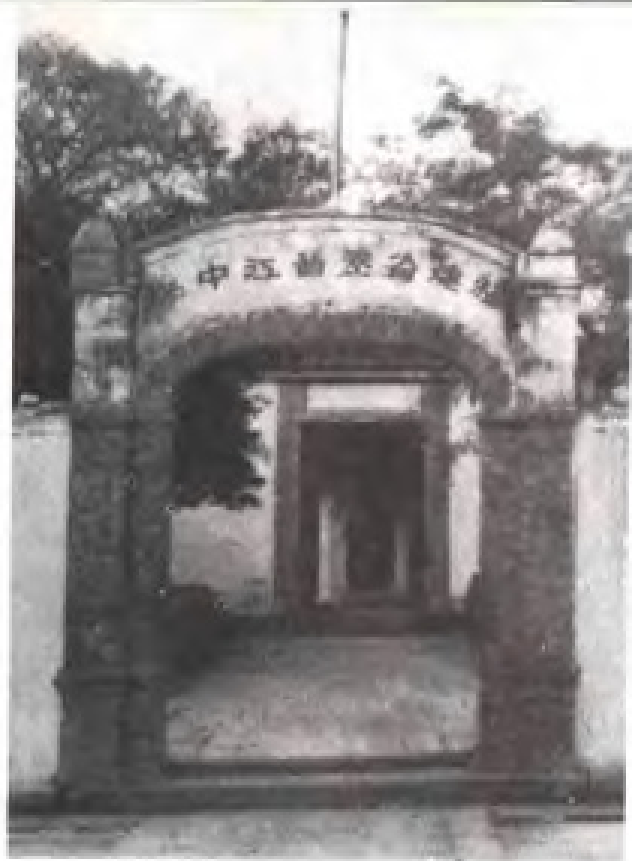
福建省立晋江中学(40年代)校门