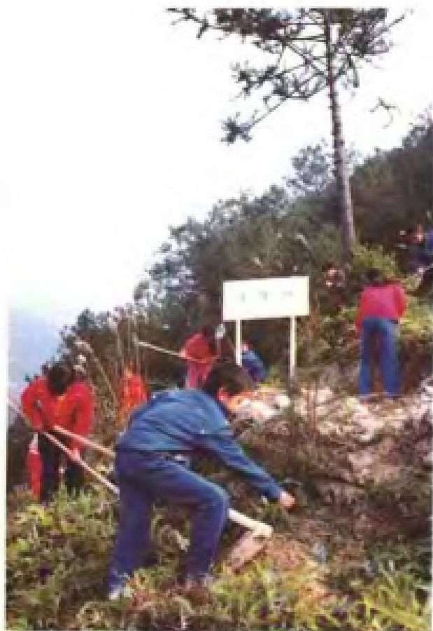
小学生植树造林劳动