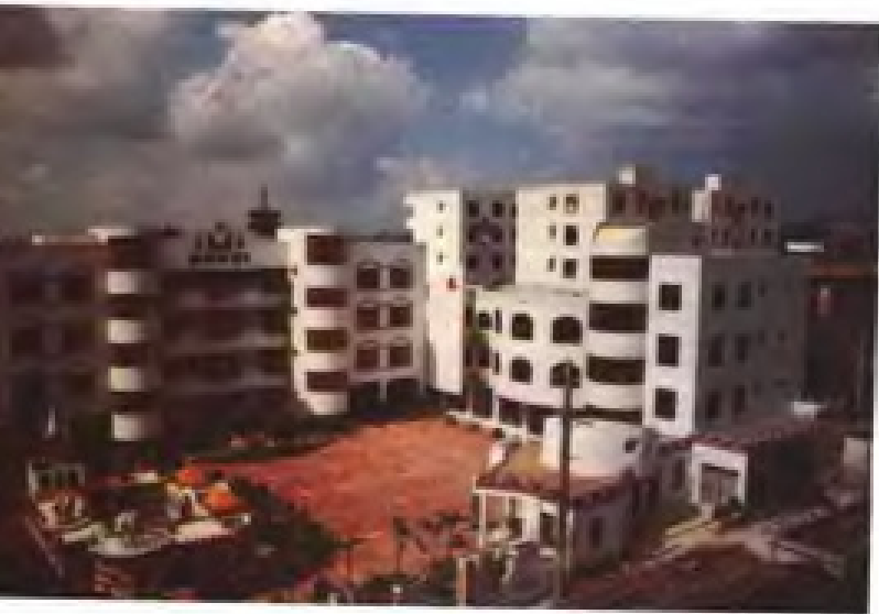
泉州幼儿师范附属幼儿园