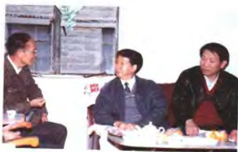
泉州市教育学会开展教育科学 研讨活动

中共泉州市委书记陈晋官、泉州市人大副主任，中共鲤城区委书记林荣取登门慰问老教师。