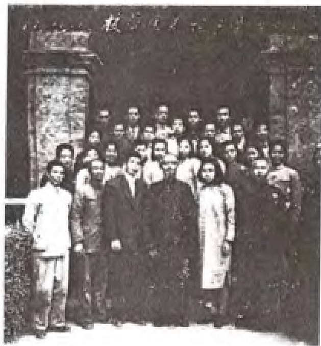
丰子恺 1948年在晋江师范学校演讲留影