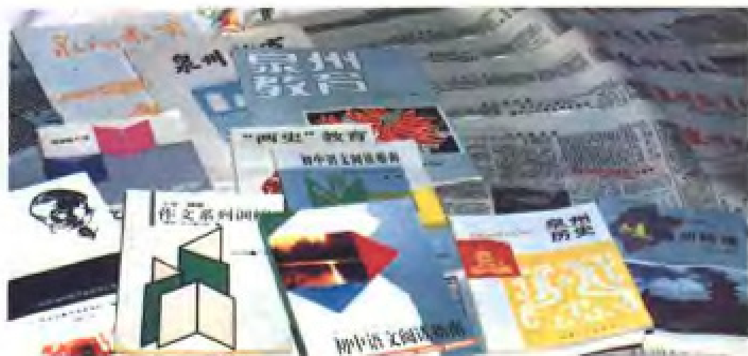
泉州市教育工作者 编写出版的部分教育报 刊书籍