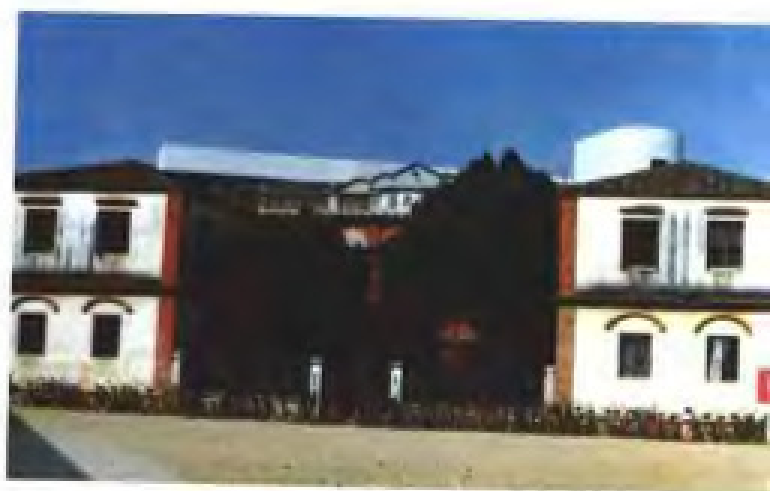
20年代华侨捐建的晋 江养正学校校舍