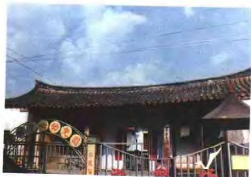
清乾隆二十年(1755)建的丰州书院遗址