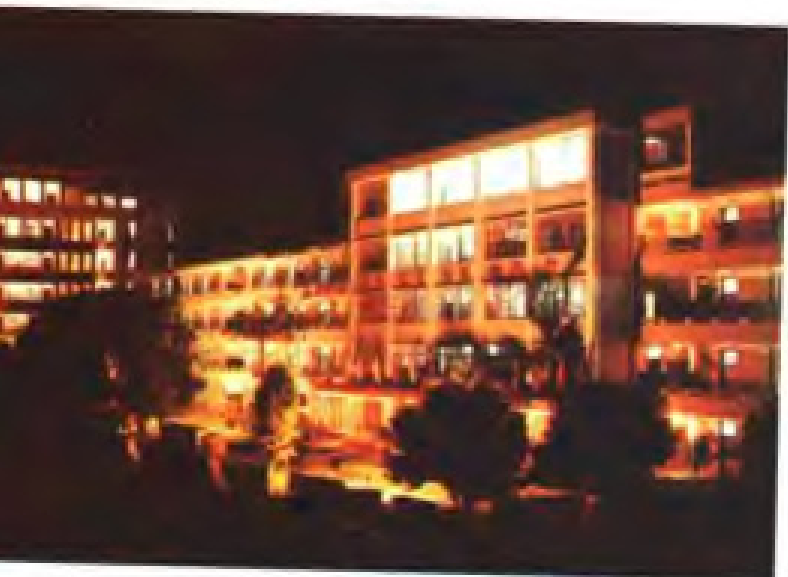
泉州华侨职业学校校园夜景