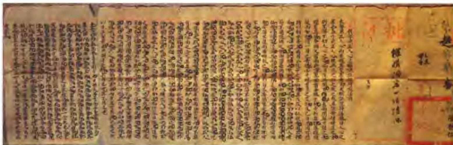
进士陈某仁的科举试卷