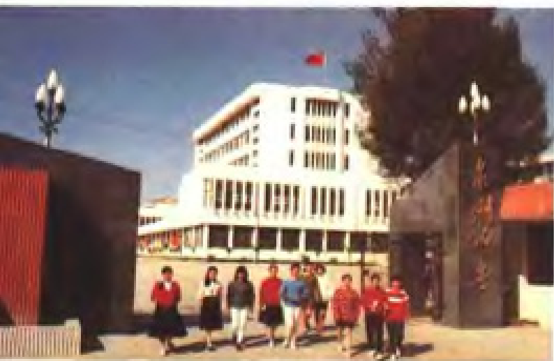
泉州师范专科学校