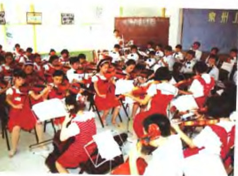
泉州市儿童交响乐团