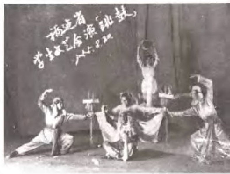
50年代中学生课余活动