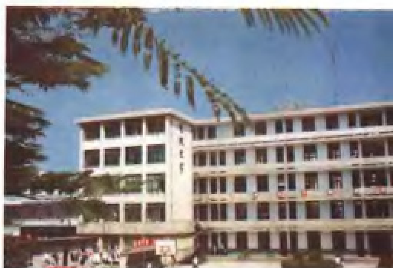
福建广播电视大学泉州分校