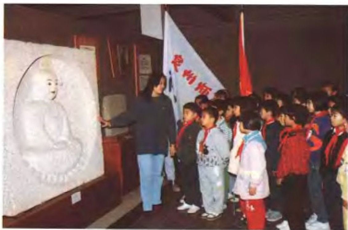
爱国主义教育基地活动