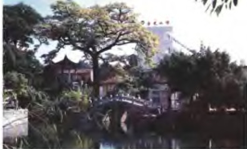
清乾隆三十二年(1767) 建的清源书院遗址