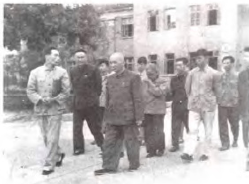
1963年叶圣陶在泉州五中参观