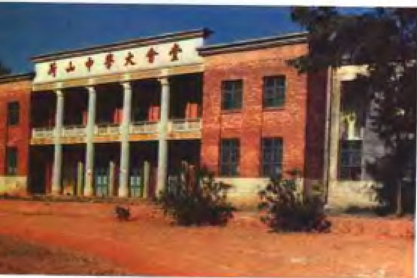
华侨刘玉水 1950 年捐建的惠安荷山中学大会堂