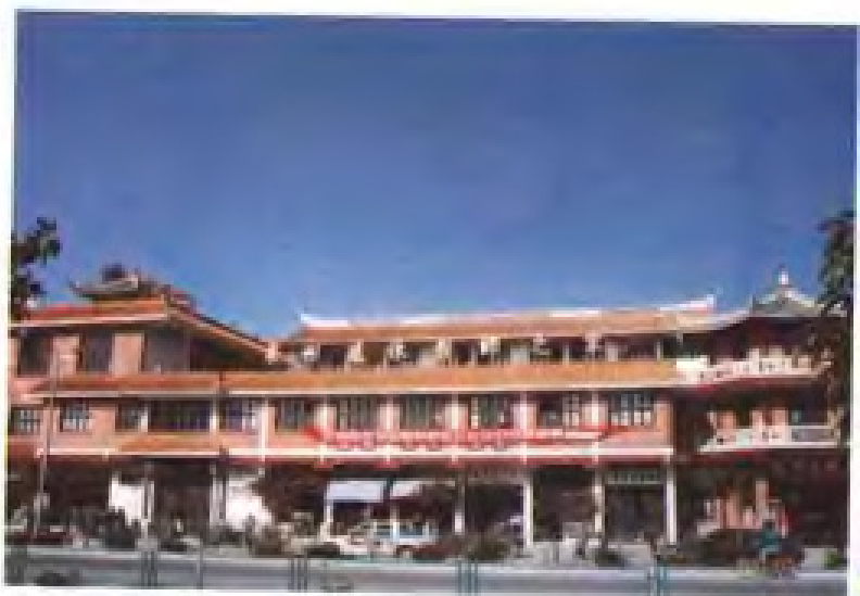
泉州退休教师之家