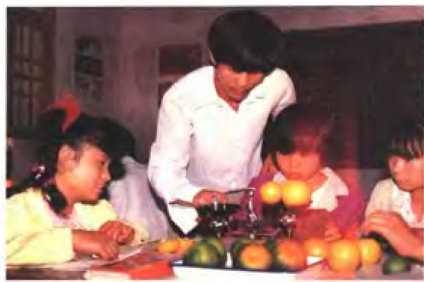
校办柑桔场实验活动