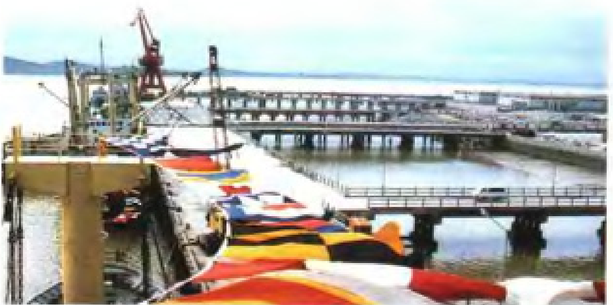
泉州后渚港3000吨级码头