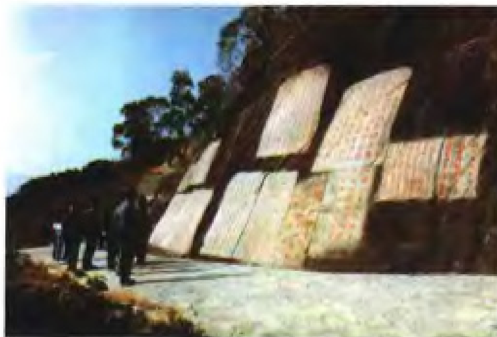
宋代泉州太守和市舶司官员对外商举行祈风仪式的九日山遗址