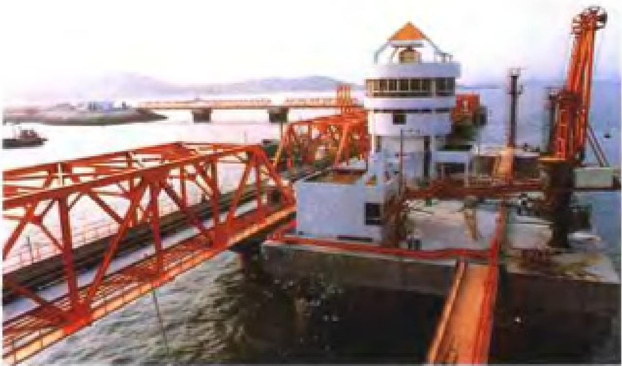
泉州肖厝港10万吨级码头