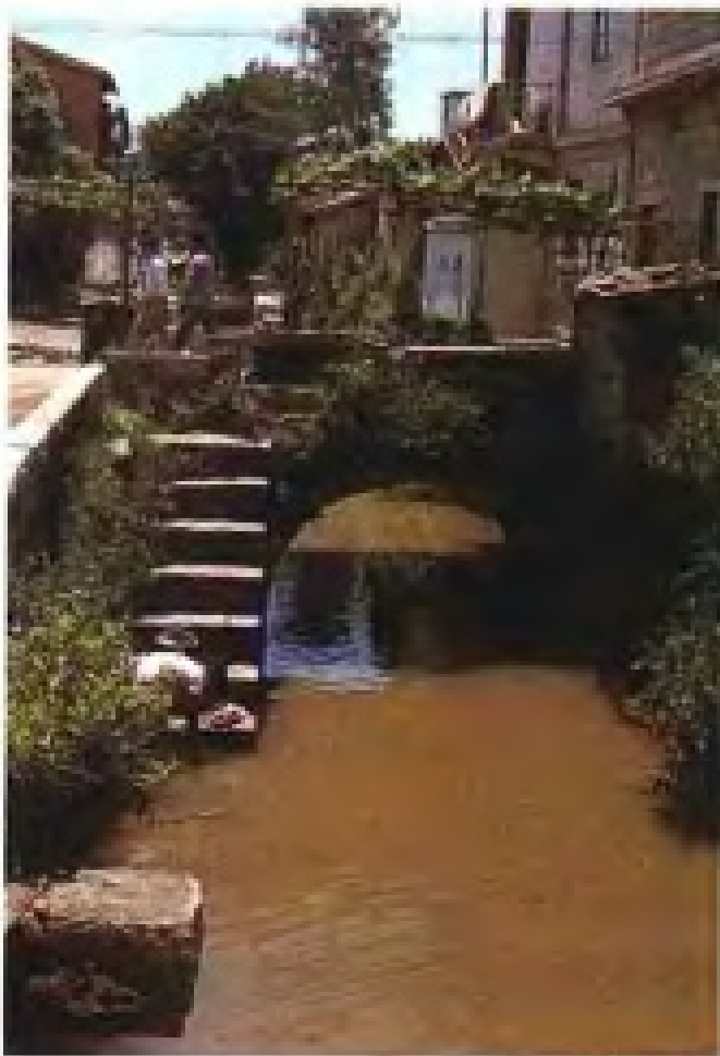
宋代泉州市 舶司水关遗址