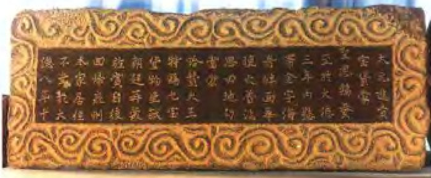
元大德八年泉人奉使波斯碑记