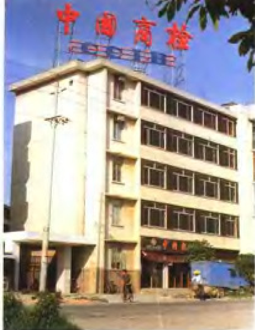
中华人民共和国泉州进出口商品检验局大楼