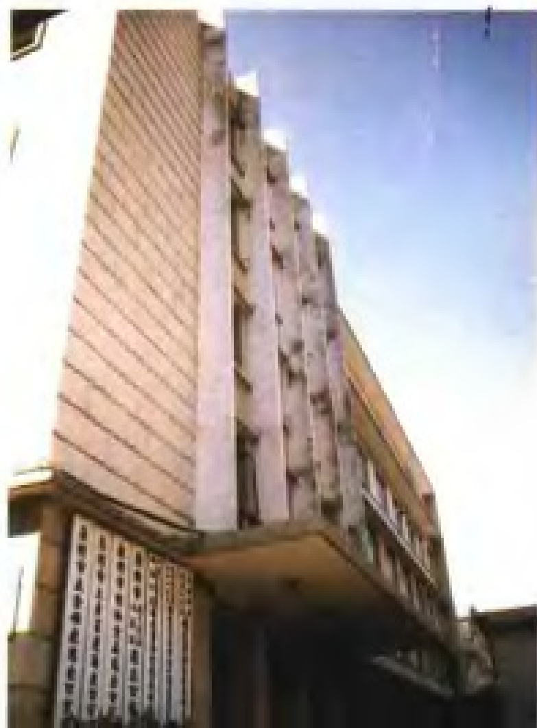
泉州市各专业进出口公司大楼