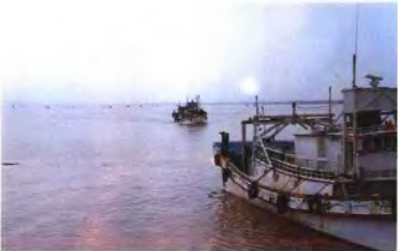
对台贸易的泉州埭埔港