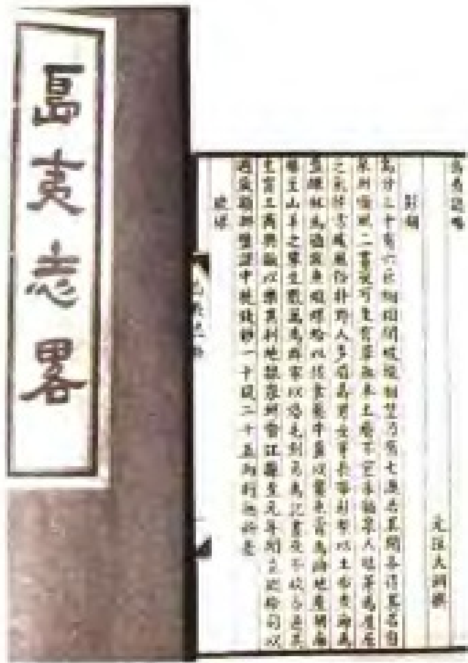
元汪大渊《島夷志略》书照