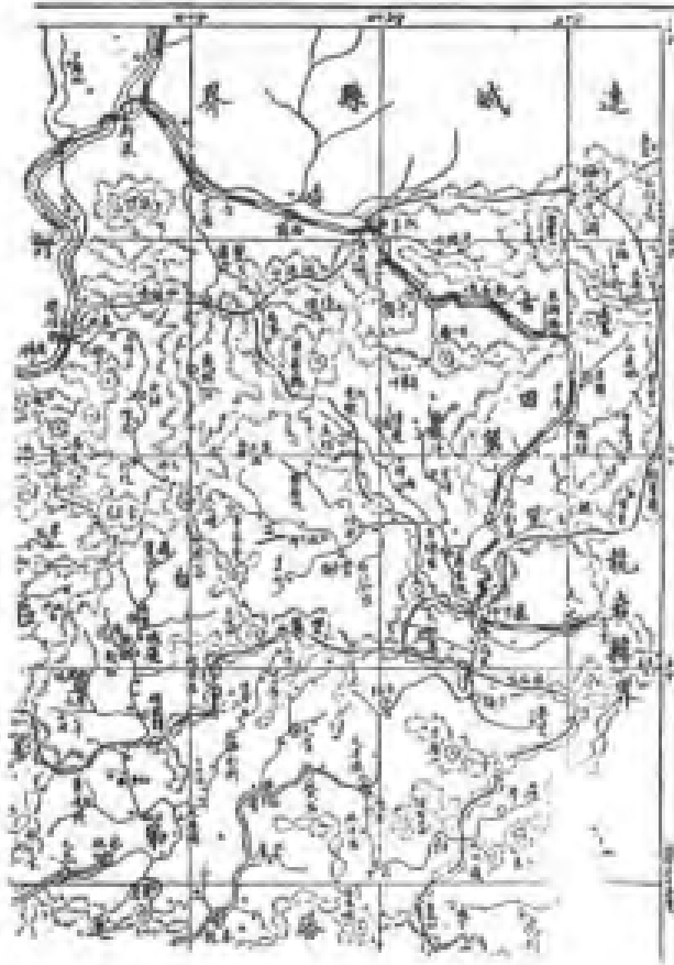
上杭縣志 卷首 上杭縣文獻委員會