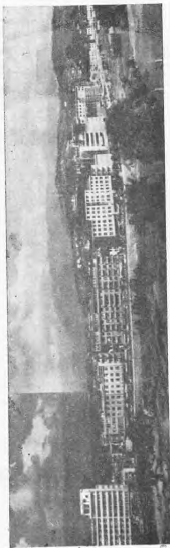
龙岩龙川中路，位于本市区中部，是一九八一年新建成的街道。