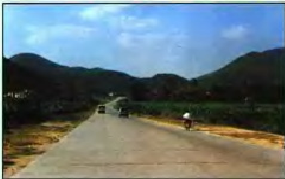
鲤城区河市乡村大道