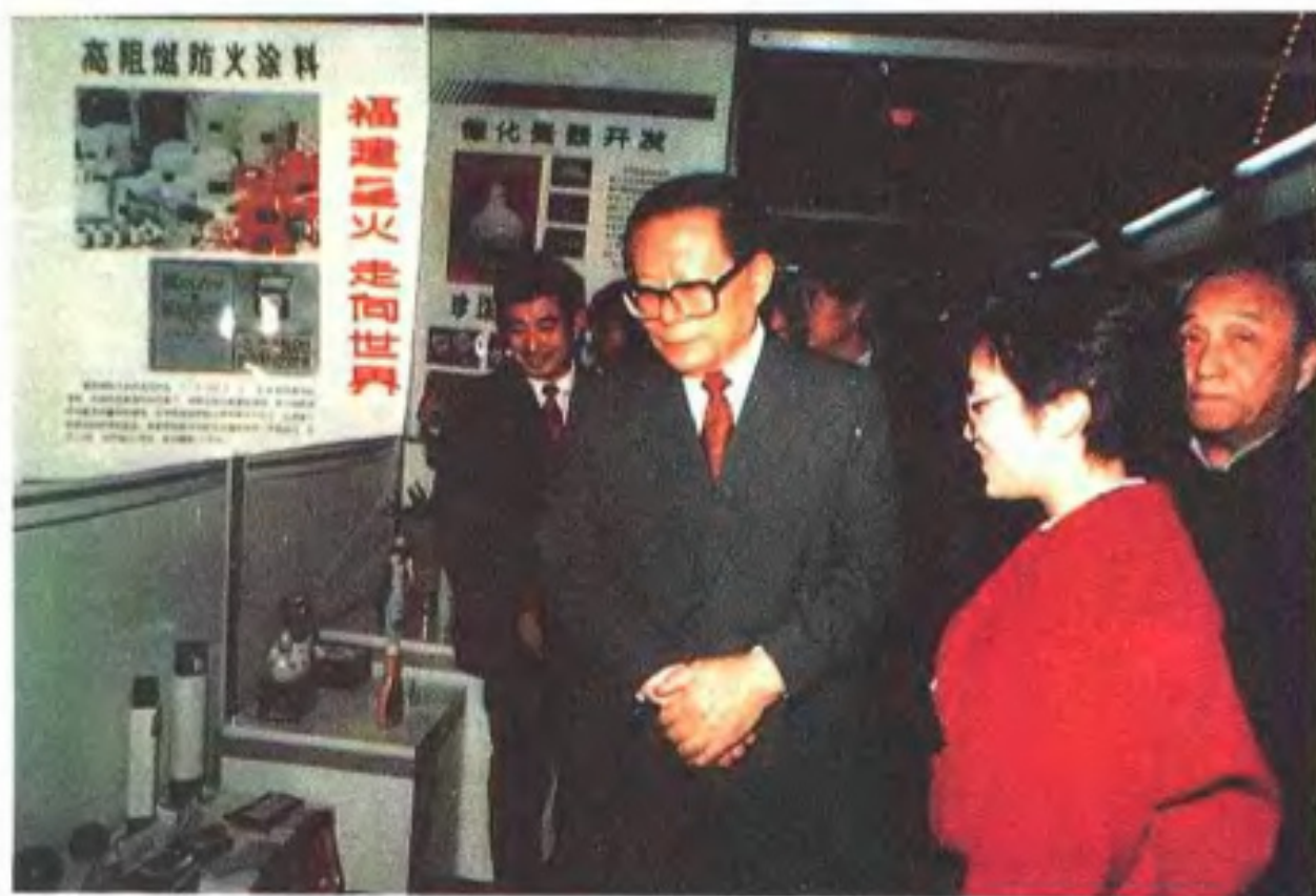
江泽民参观晋江科技成果展览