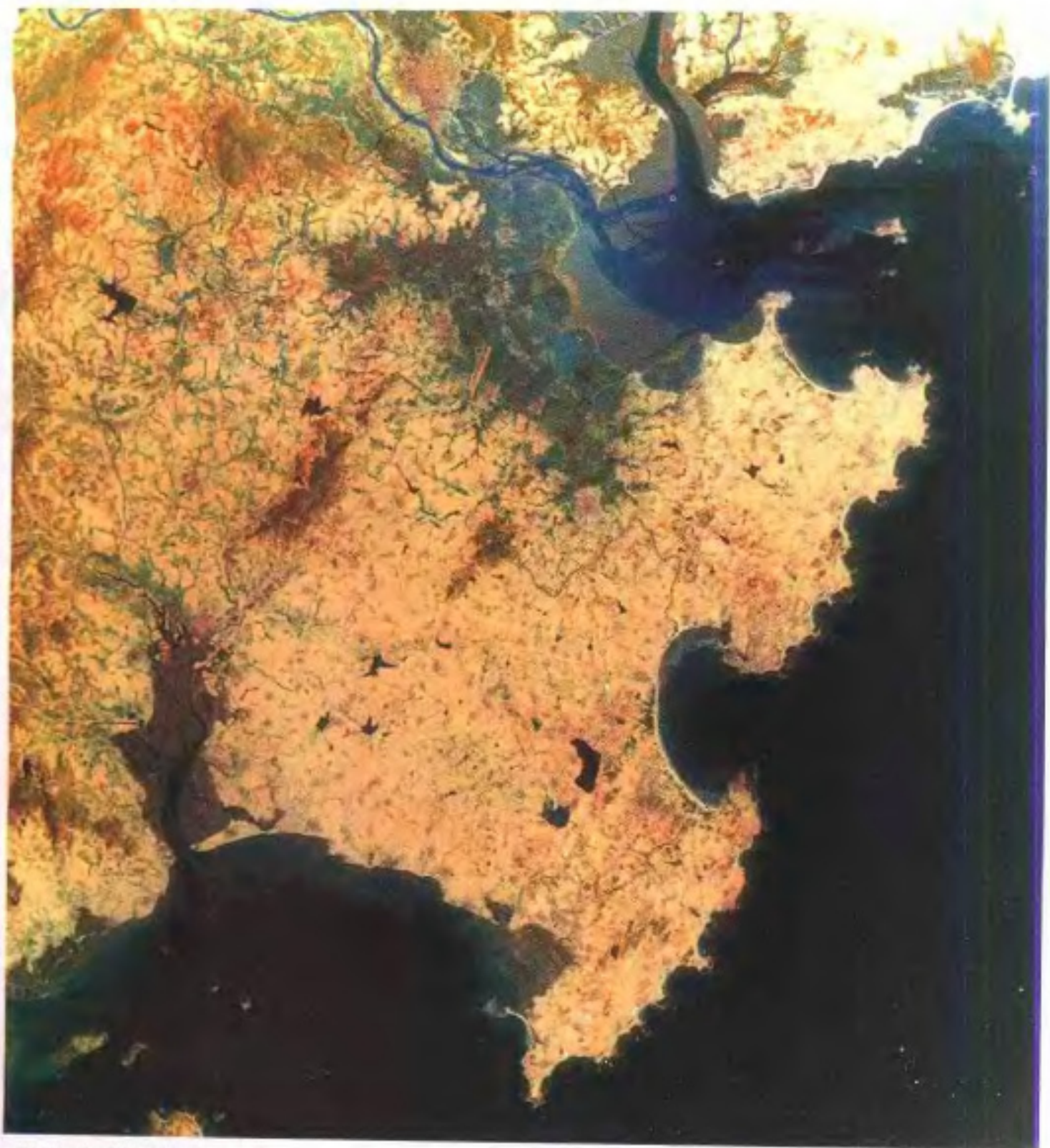
卫星鸟瞰下的晋江地形地貌