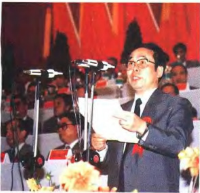
中共晋江市委书记、人大主任施永康在大会上发言