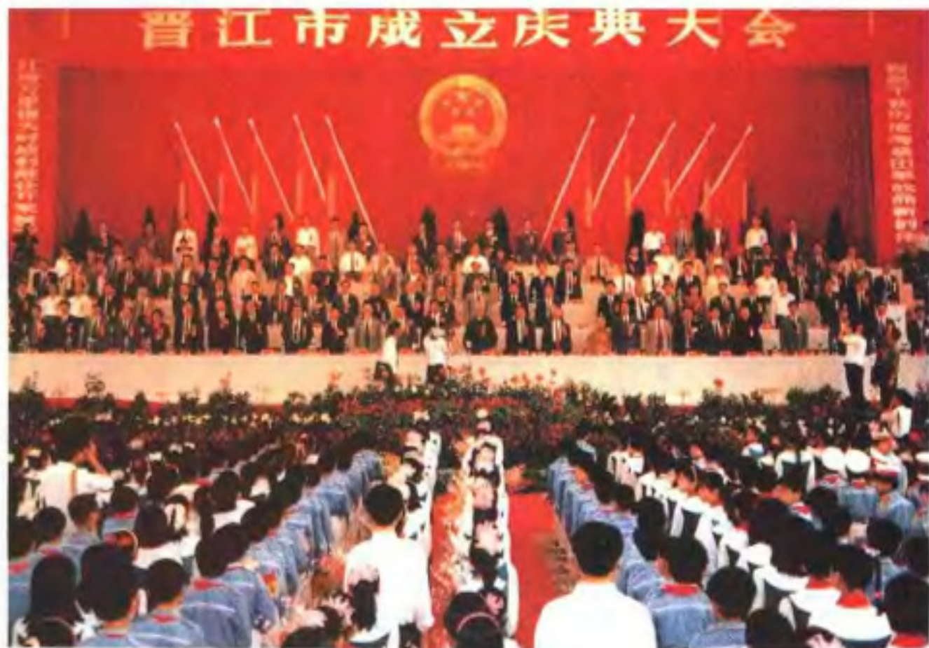
晋江建市庆典大会