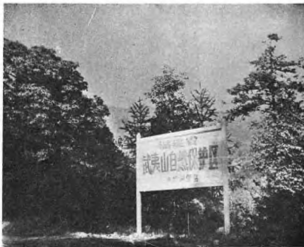
福建省武夷山自然保护区大竹岚管区。