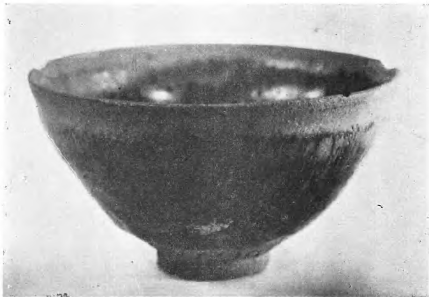
驰名中外的宋瓷——“建盏”。