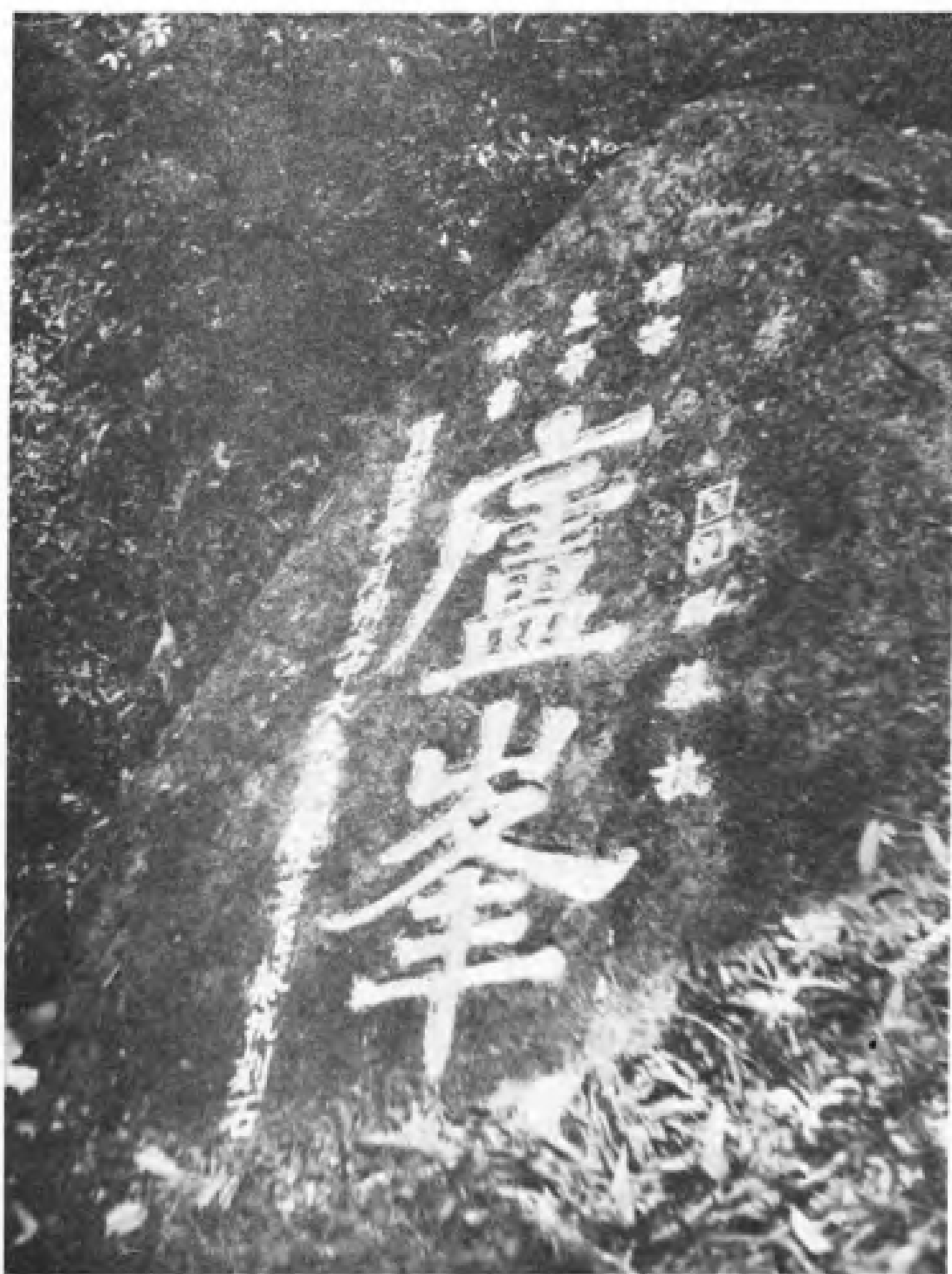
庐峰御书摩崖石刻