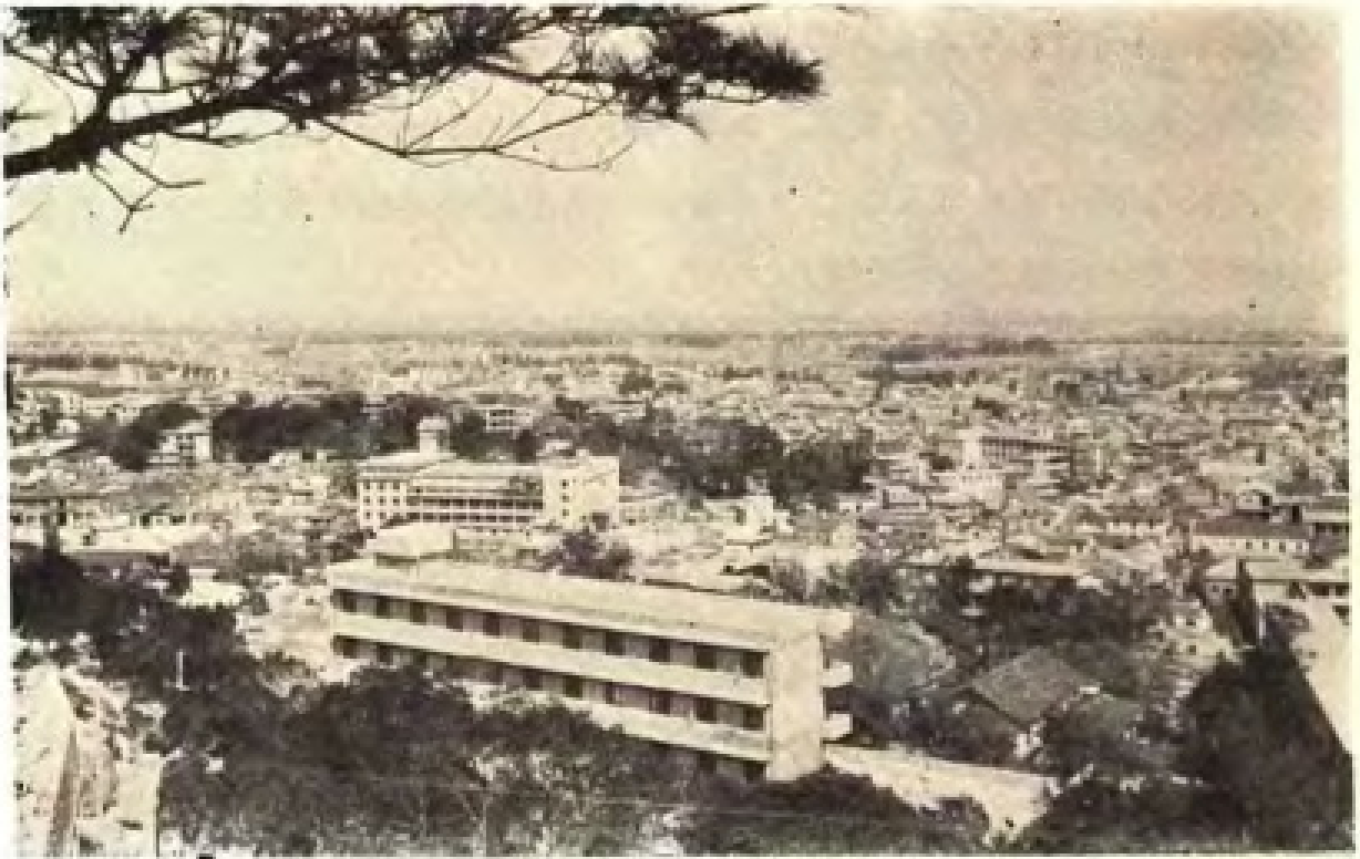
螺 城 新 貌