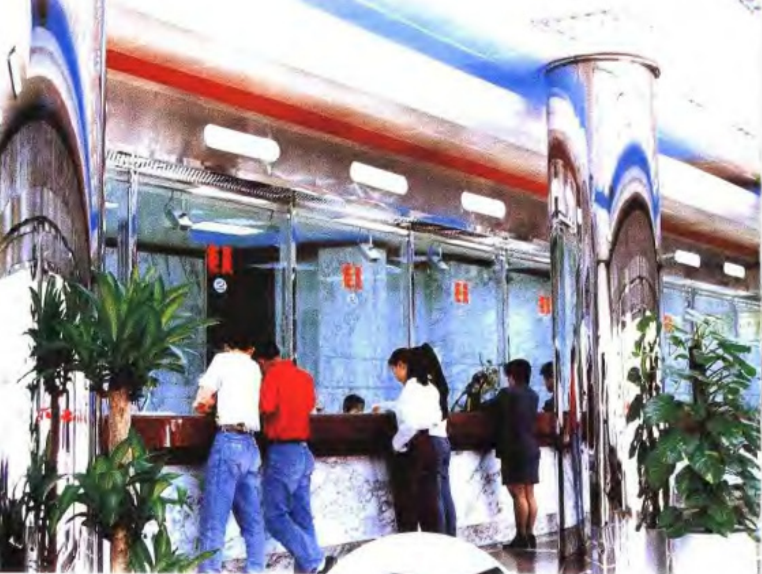
中国工商银行福州营业厅一角