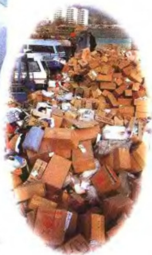
销毁假冒伪劣商品