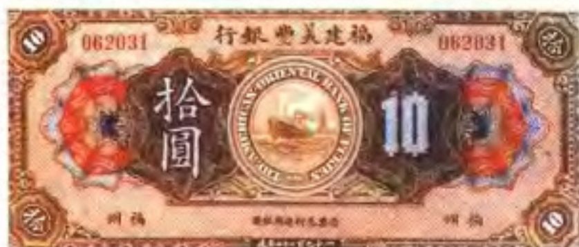
民国22年(1933年)中美合办的福建美丰银行发行的福州地名10元纸币