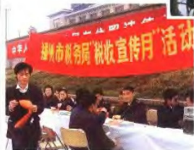
地税局干部上街宣传