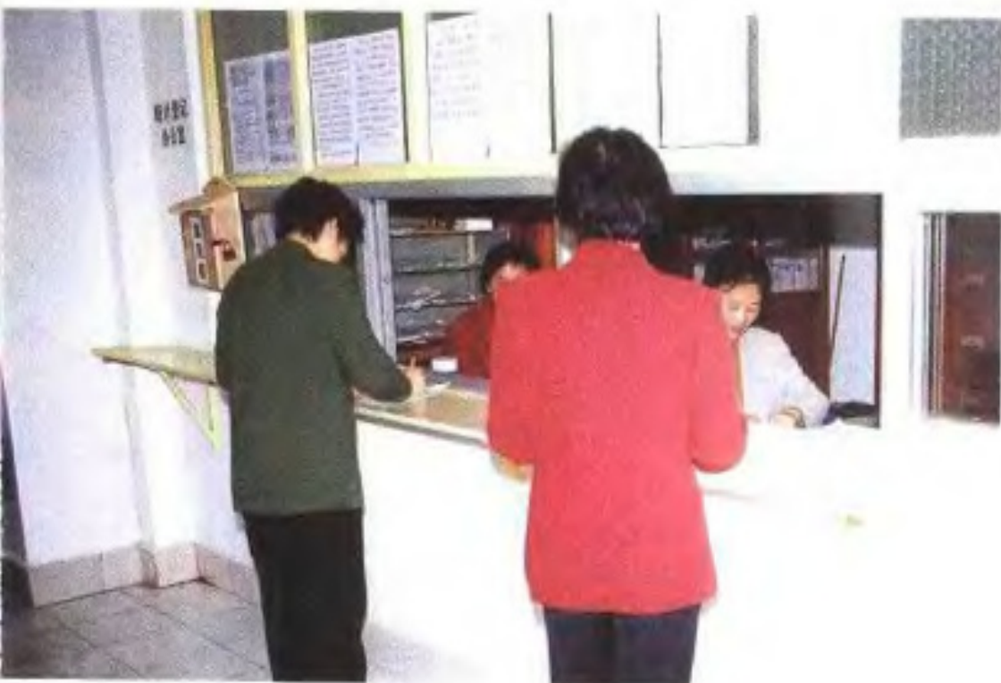
统计登记对外窗口