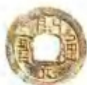
唐“开元通宝”福字制钱