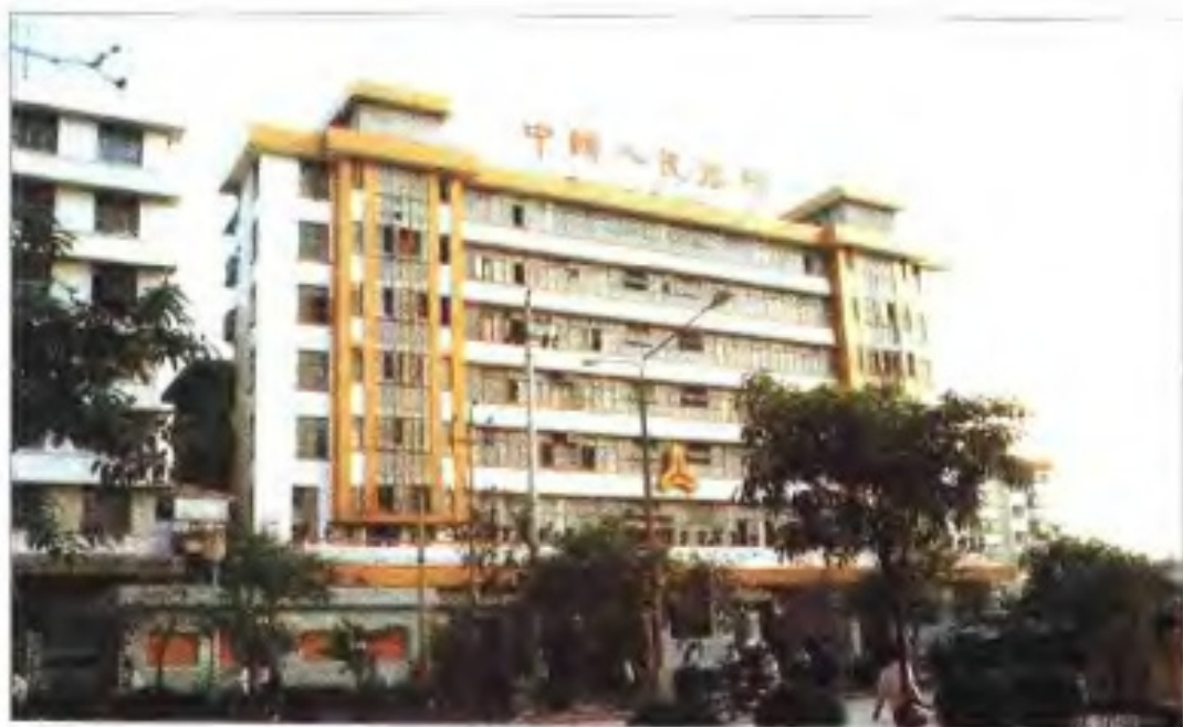
中国人民银行福州分行·外管局福州分局