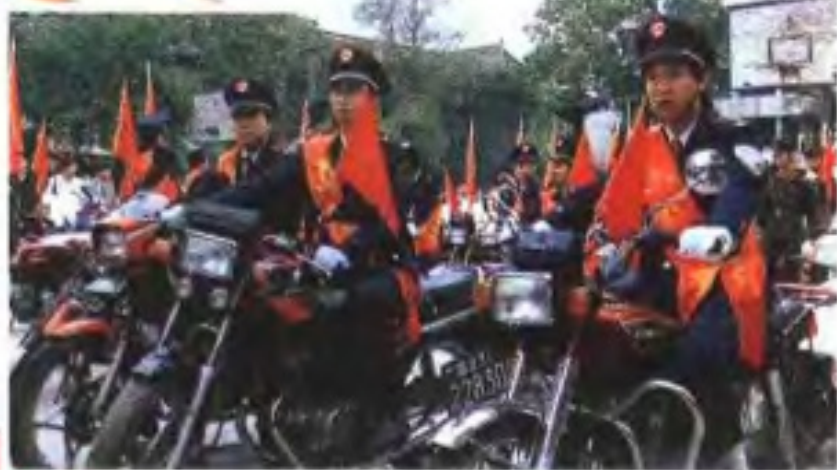
开展税收宣传活动