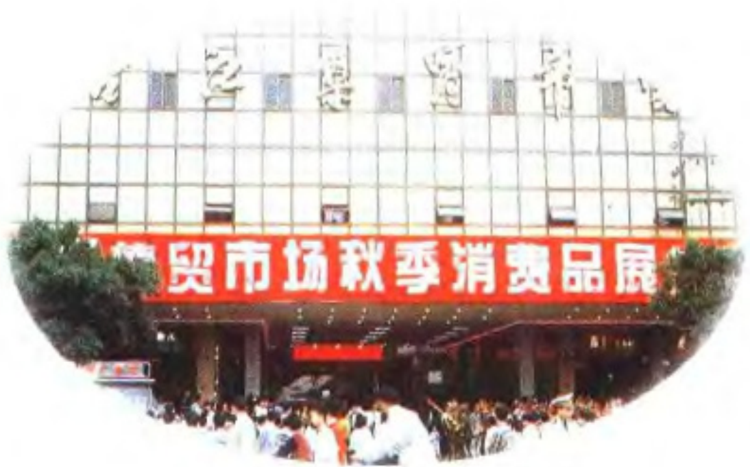
福建省最大的集贸市场——台江集贸市场