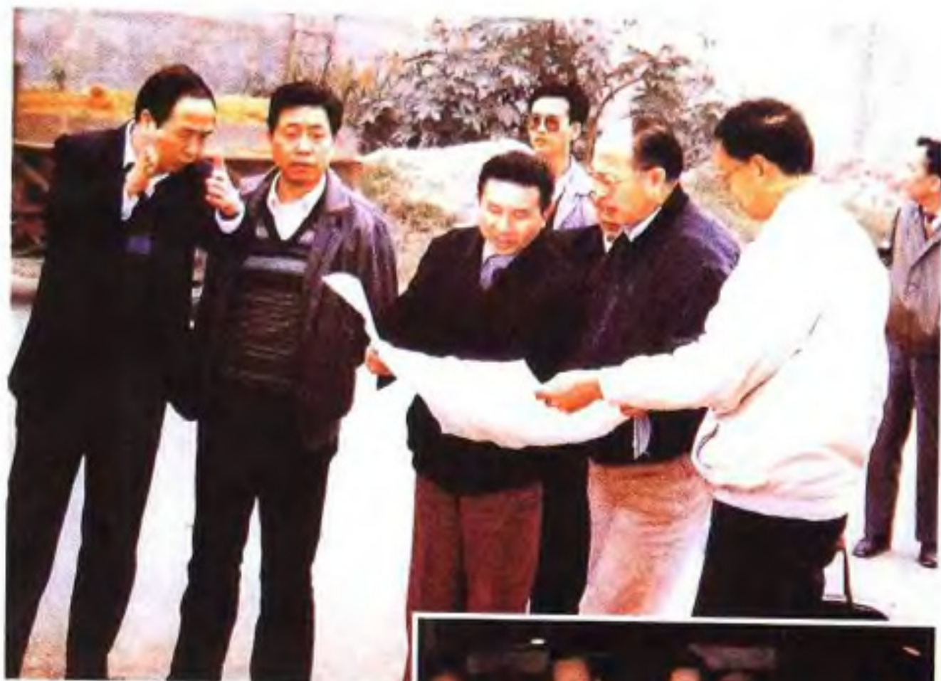
财政部项怀诚 在福州检查防汛抗 洪工作