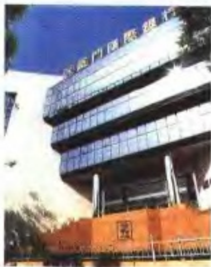
厦门国际银行福州分行