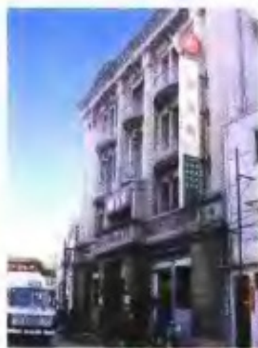
民国35年(1946年)中国银行福州支行在观井路的行址