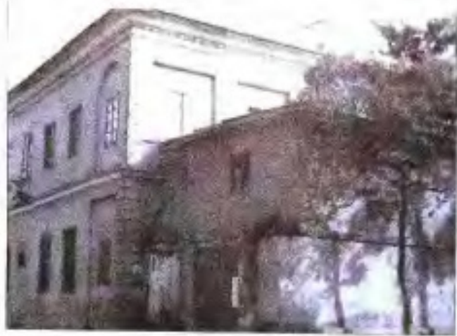
闽海关总关办公大楼旧址（福州泛船浦）