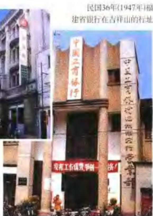
民国36年(1947年)福建省银行在吉祥山的行址