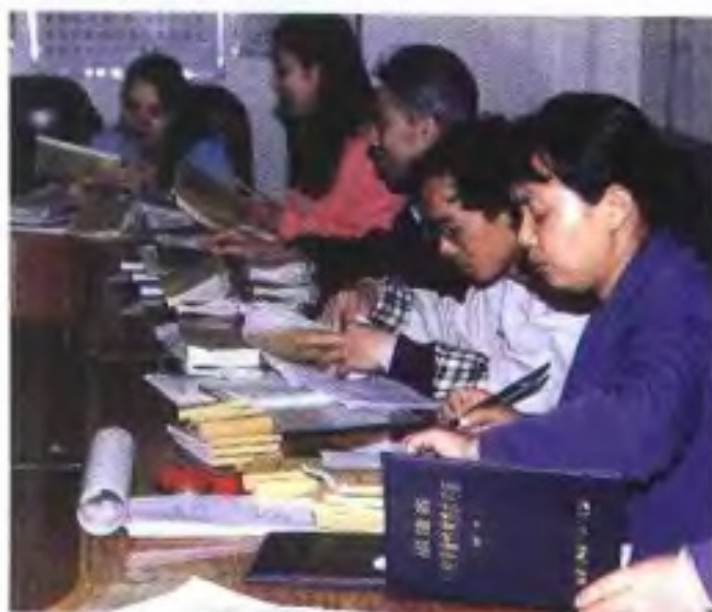
核发《行政事业性 收费许可证》