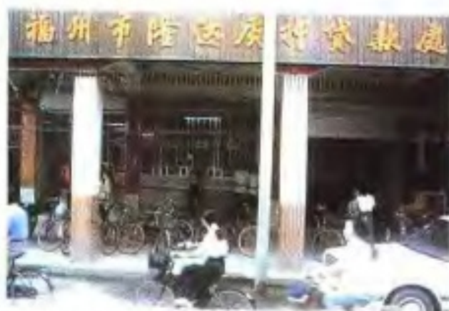
福州市隆达质押贷款处营业室