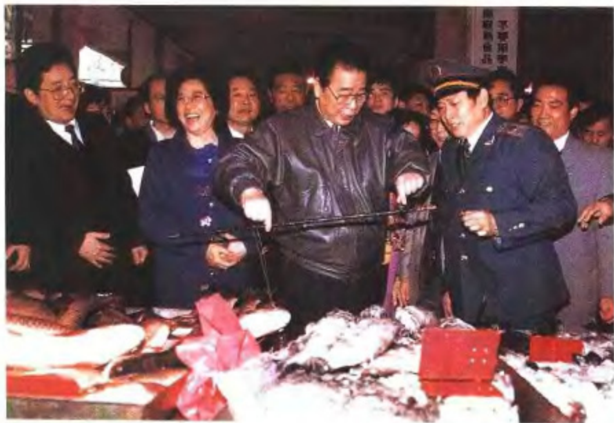
1995年2月李鹏视察福州台江集贸市场