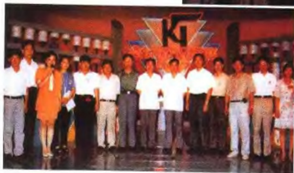
福建省会计知识 竞赛活动在福州举行