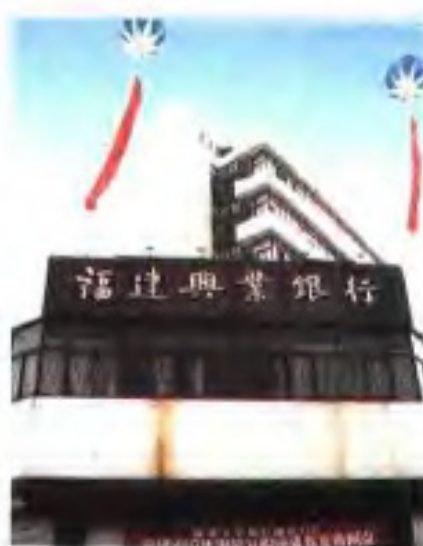
福建兴业银行福州分行