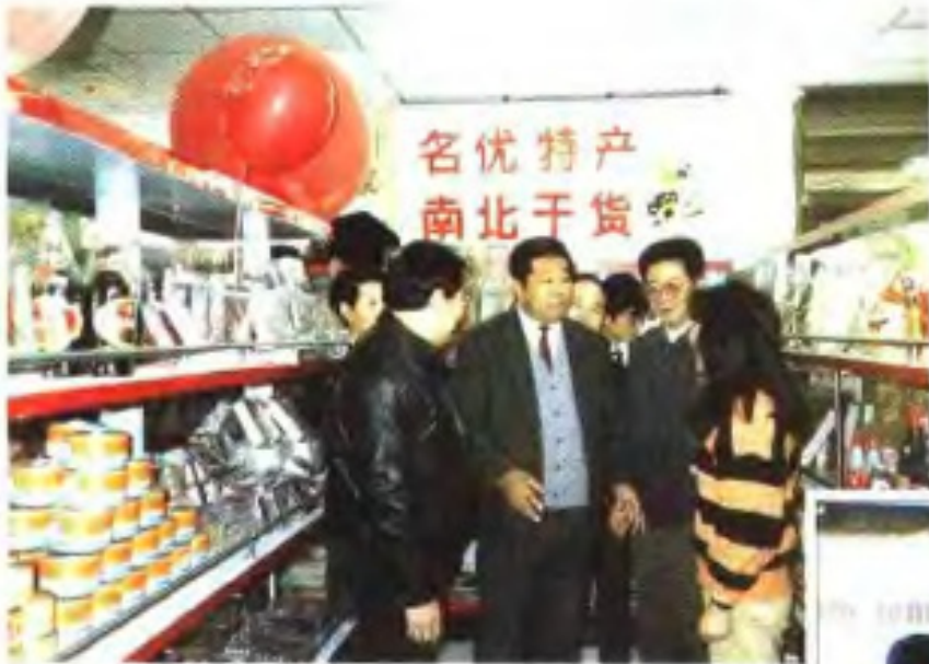
省委领导视察永德超市