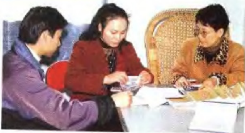
实地盘点库存现金