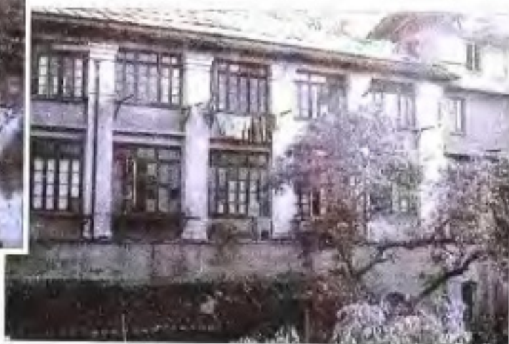
闽海关税务司公馆旧址（福州食山东路群路）