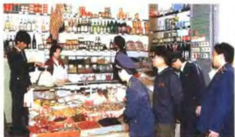
市场物价检查监督