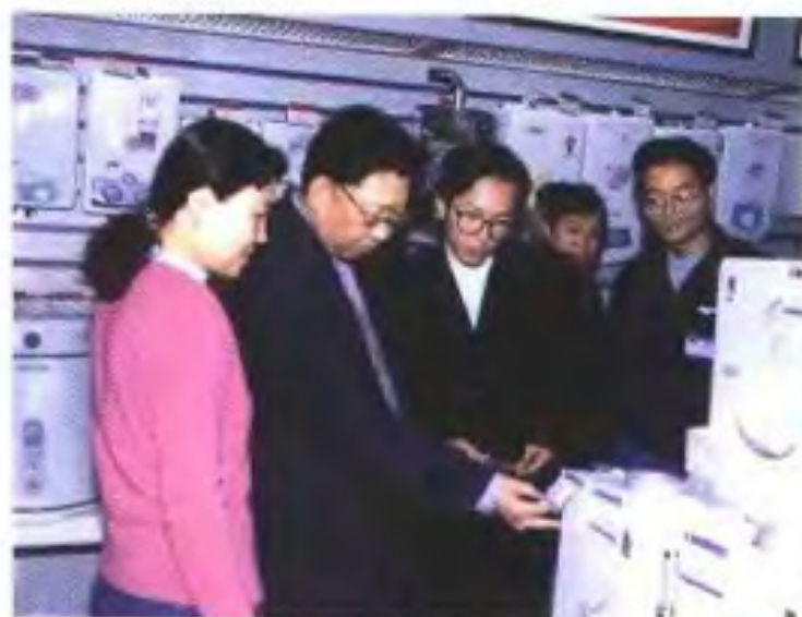
检查明码标价工作