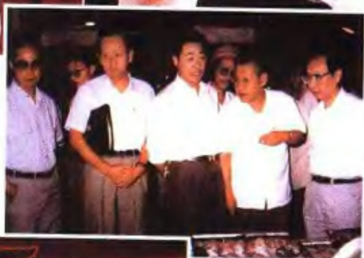
省市财政干部检查 副食品基地建设