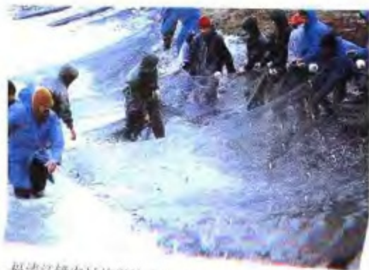
福清江镜农村信用社支持荣华养殖场发展生产