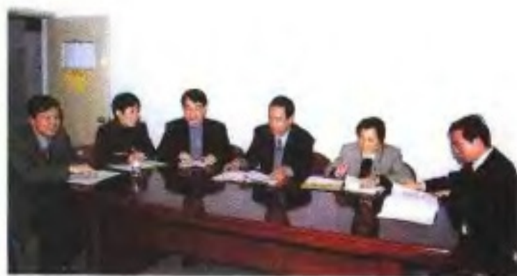
市计委研究计划工作