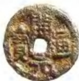
五代“开元通宝”背福字大铁钱