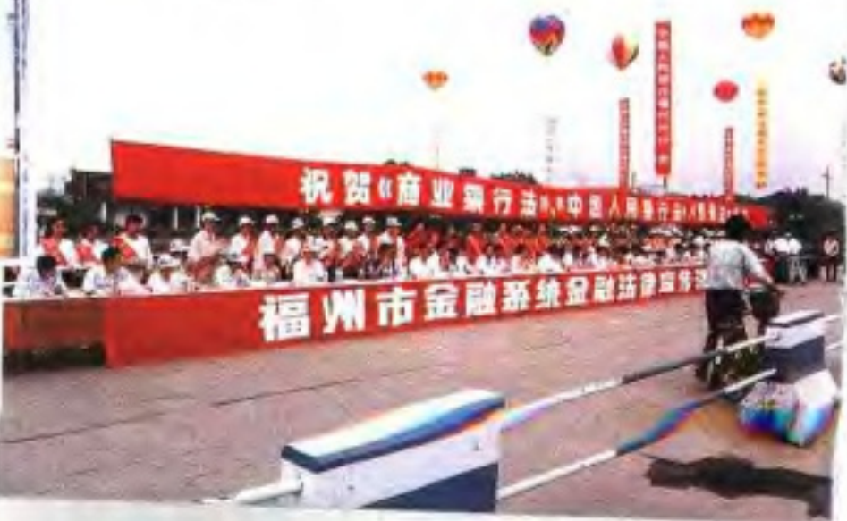
金融系统在五一广场宣传“三法”