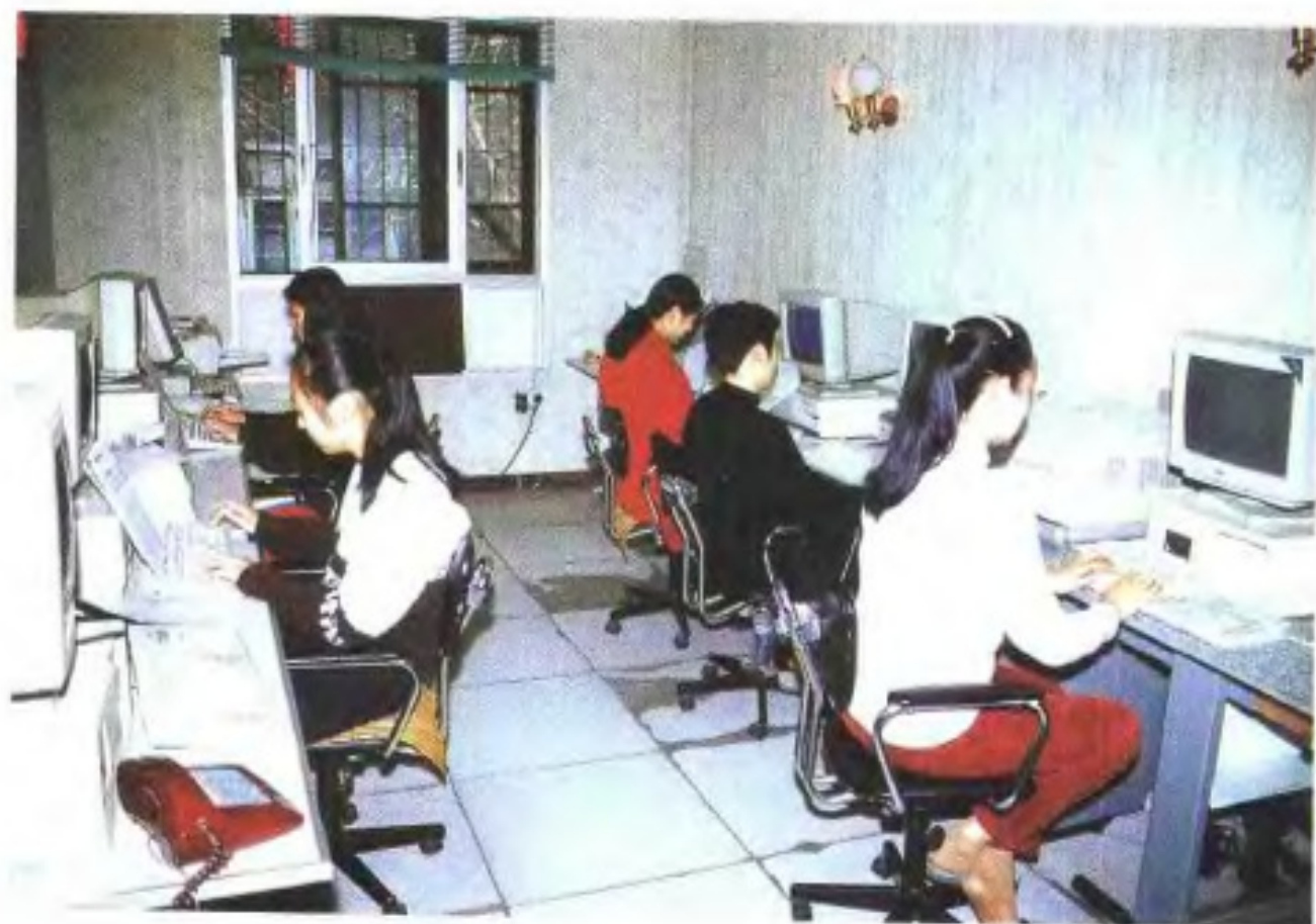
福州市统计局计算机站