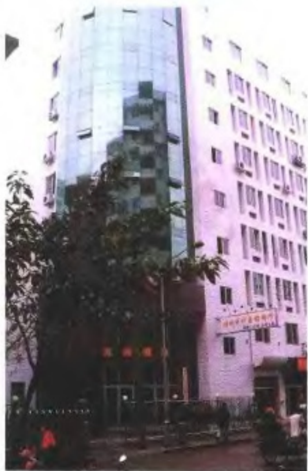
福州市计委办公楼