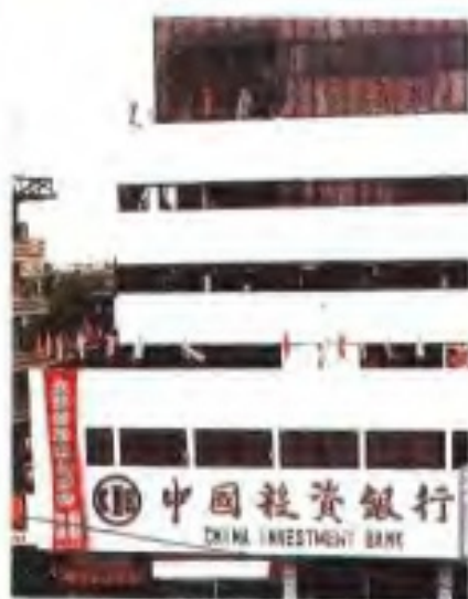
中国投资银行福州分行