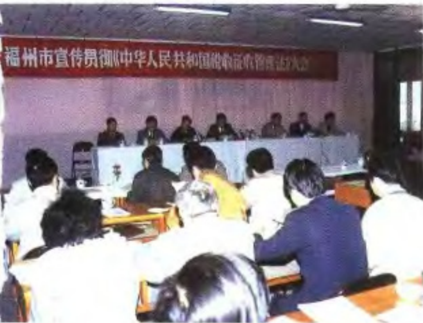
福州市宣传贯彻 《中华人民共和国税收 征收管理法》大会