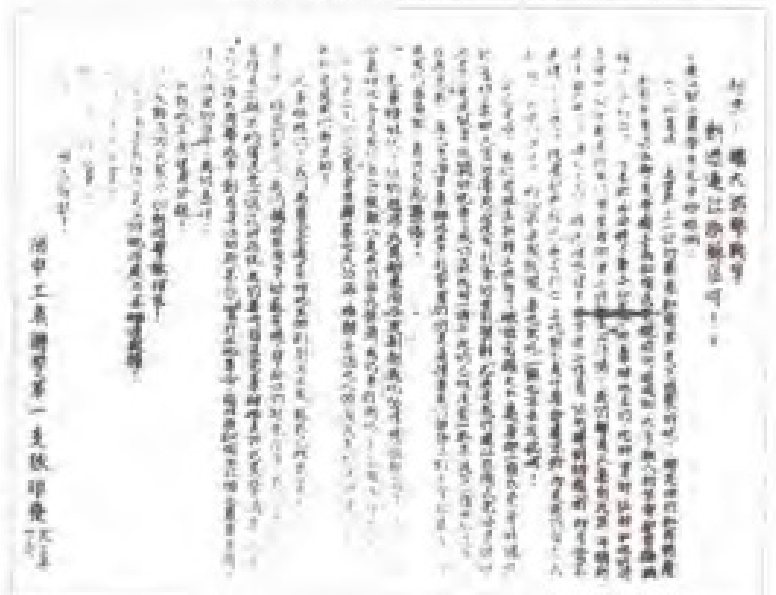
闽中工农游击队第一支队告连江工农书