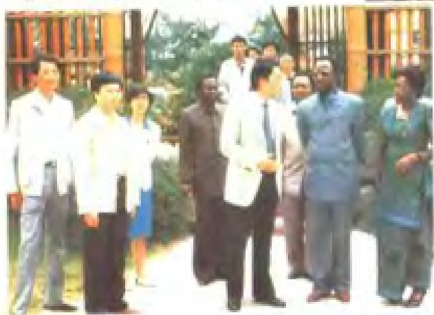
非洲朋友在福州参观农舍