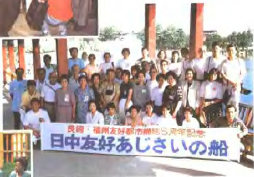
1985年8月日本朋友游览福州西湖