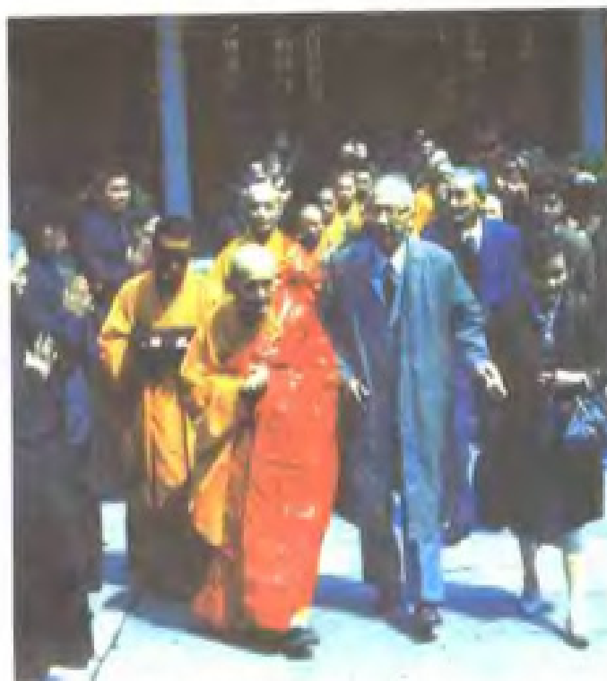
1990年4月6日日中友好人士到 福州法海寺朝拜