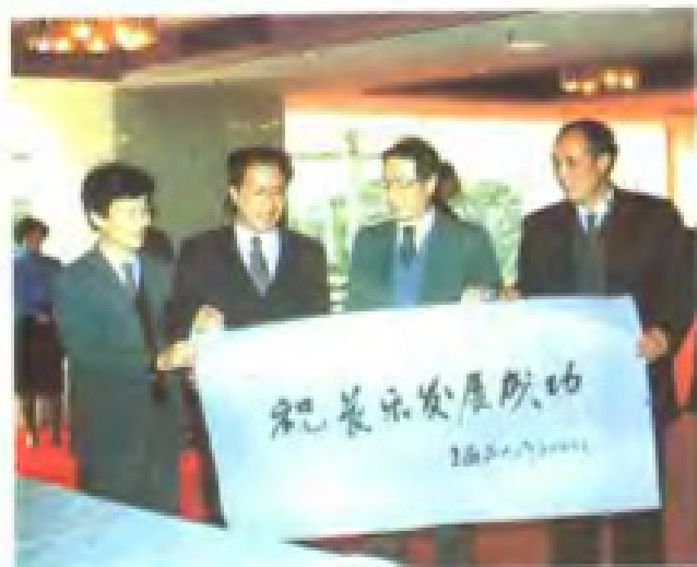
1993年新加坡总统王鼎昌(右二) 考察长乐并题词