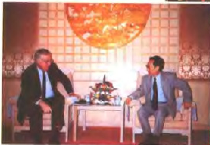
1996年10月福州市市长翁福琳会见美国驻广州总领事