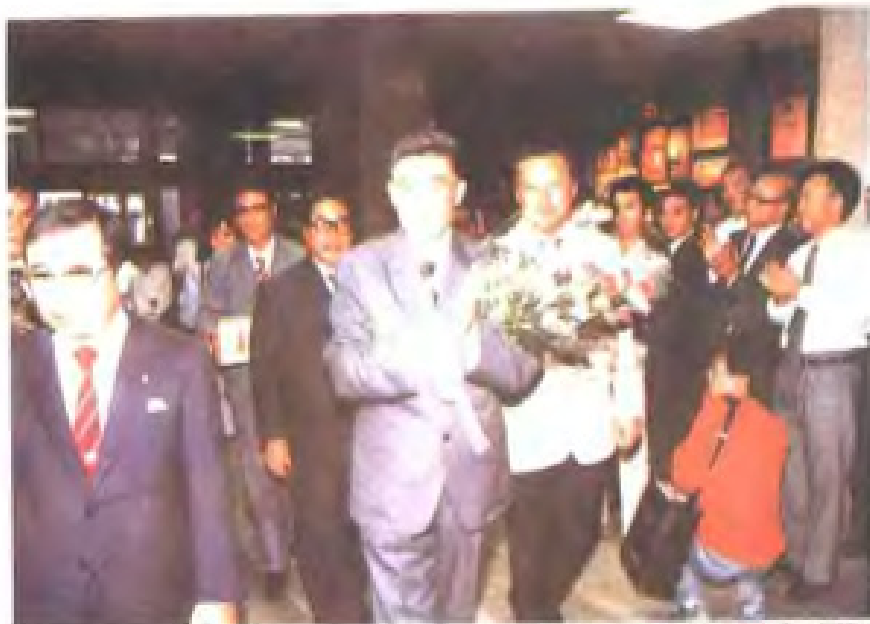
1983年10月中共福州市委书记， 市人大常委会主任张维中率友好代表 团访问日本长崎市