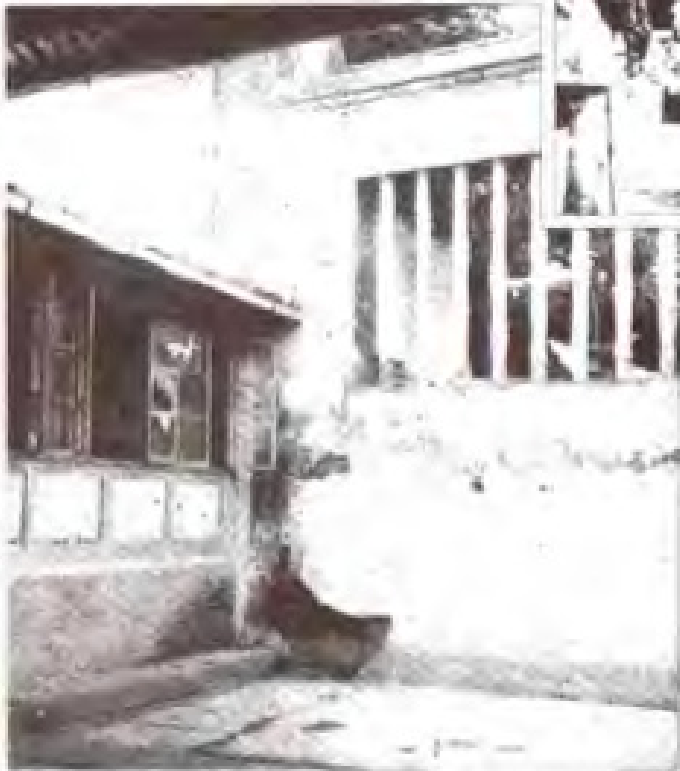
新四军驻福州办事处旧址(今安民巷53号)