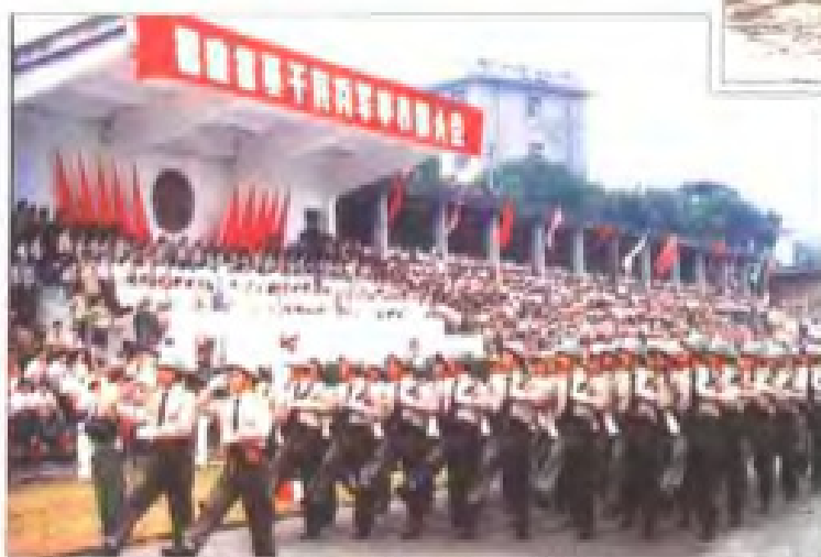
福建省基于民兵军事表演大会在福州举行