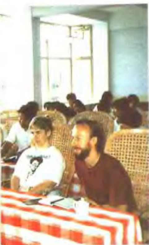
1991年西德康复医学工作者到市儿童福利院举办讲座