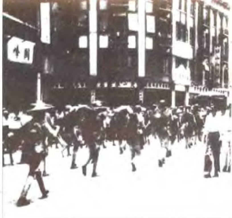
1949年8月17日解放大 军进入福州中亭街