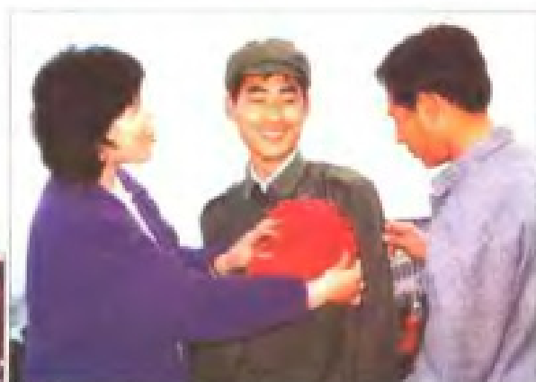
适龄青年踊跃应征入伍