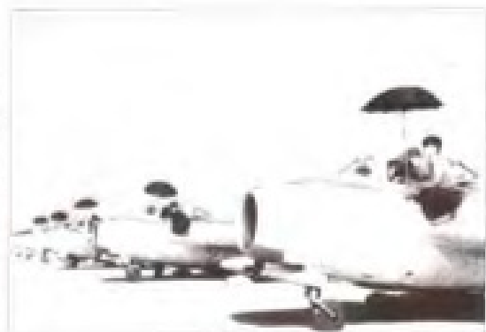
福州机场歼击机在战备中