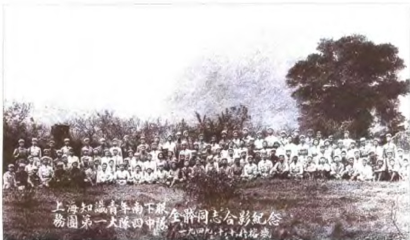
南下服务团一大队四中队在福州后的合影