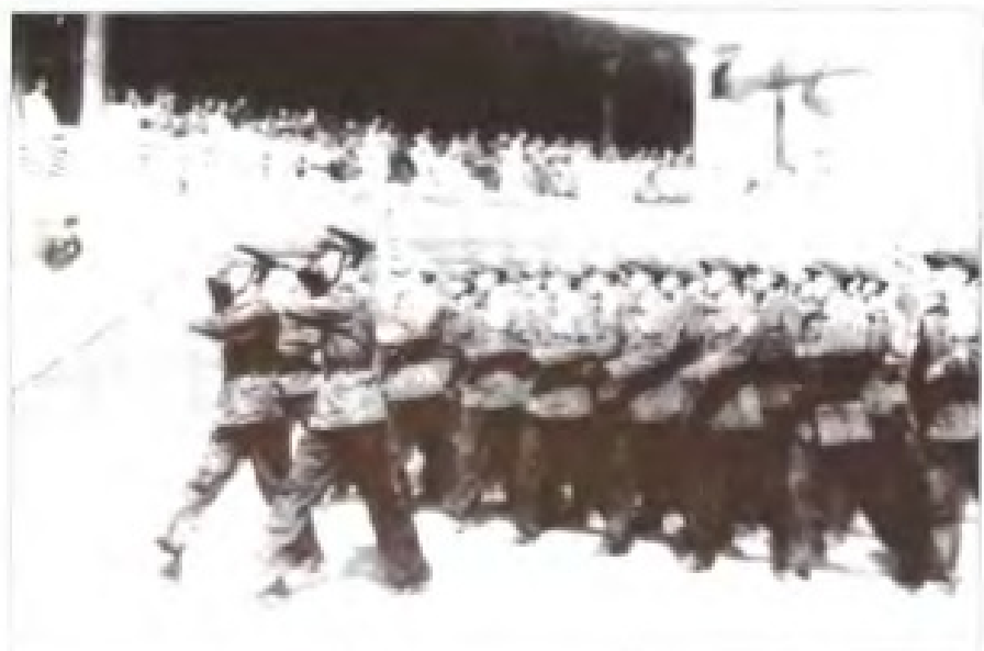
1959年福州市国庆阅兵式