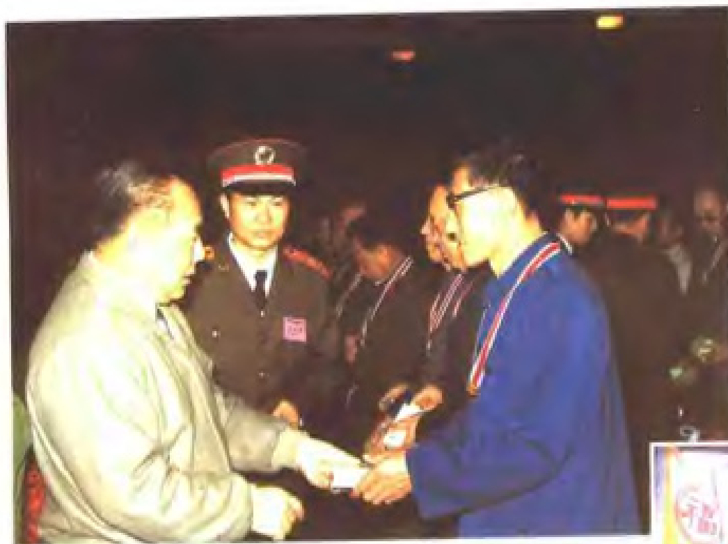
1988年市委书记袁启彤向参加福州市授勋仪式的军队离休干部颁赠纪念品