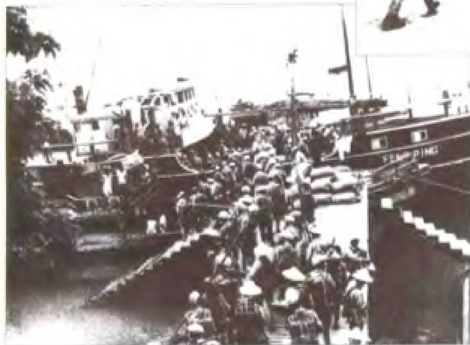
济南二团解放军登上轮船追击南逃之敌