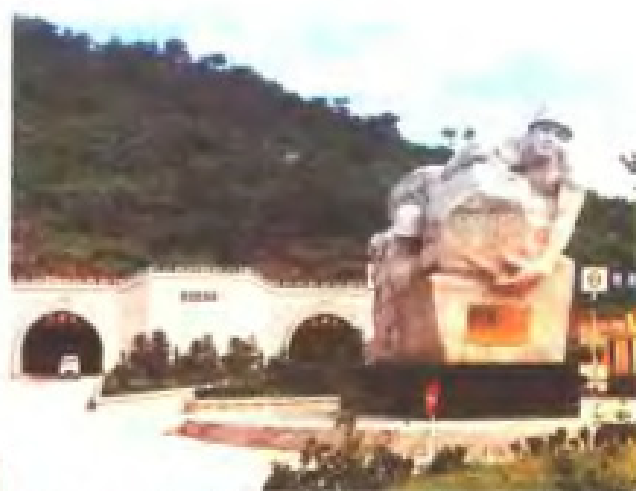
由驻闽部队支援建设的鼓山隧道