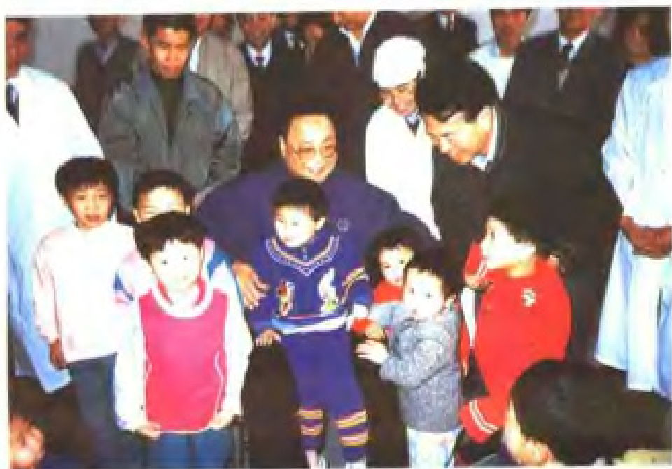
1992年中国残联主席邓朴方看望福州市儿童福利院儿童