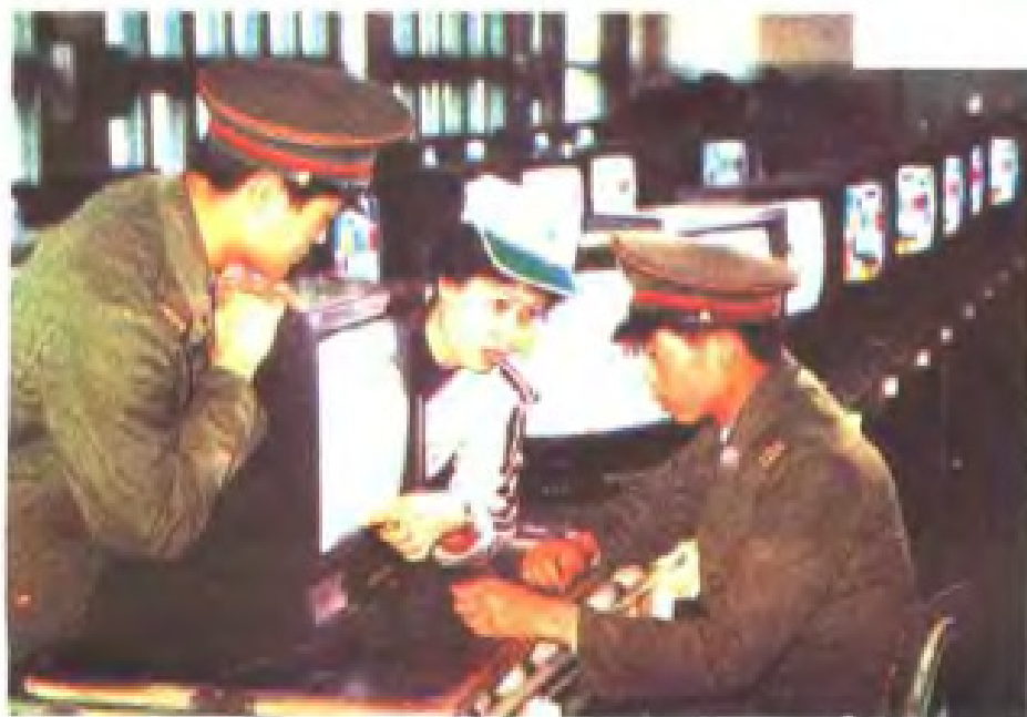
军民共建单位福日公司职工向驻榕部队战士传授彩电维修技术