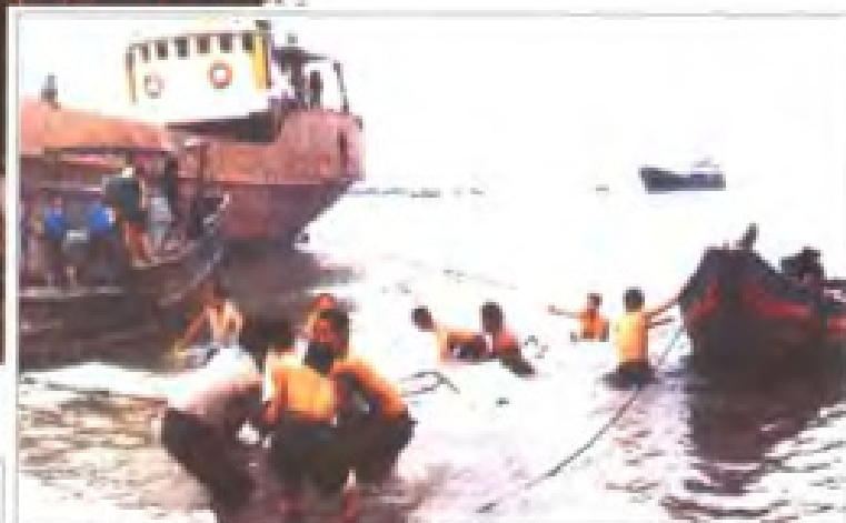
平潭岛驻军在海协助抢捞受损的国家物资