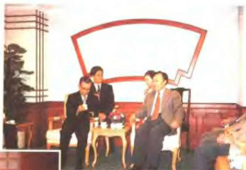
1996年11月省委常委、市委书记赵学敏会见日本友人塚本幸司先生。