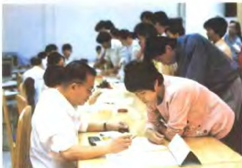
福州市劳动力市场求职登记处