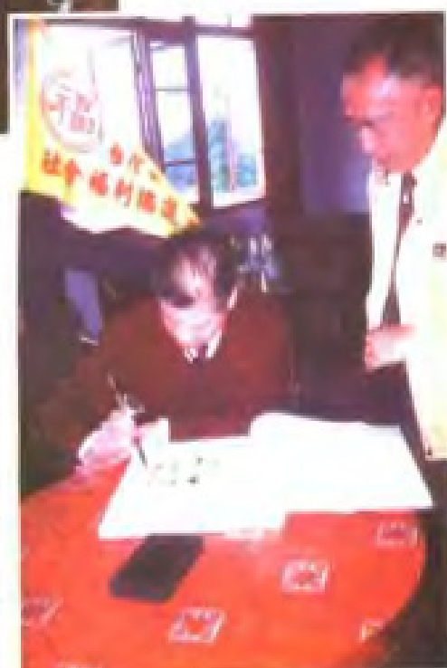
1991年台湾社会福利协进会人士到市社会福利院参观