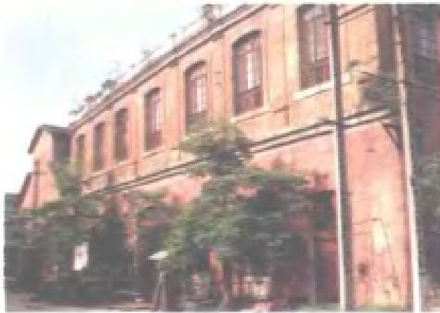
马尾造船厂绘事院