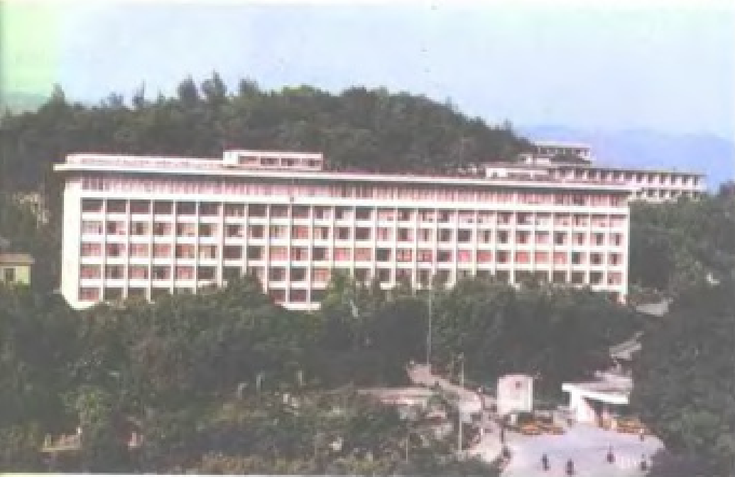
福建省人民政府办公楼