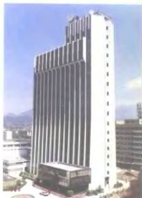
省电网中心调度所