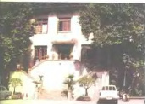
中共福州市委、福州市人民政府办公楼