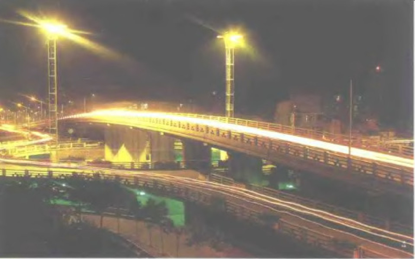
闽江桥北立交桥夜景