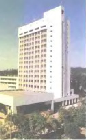
福州大学科学大楼