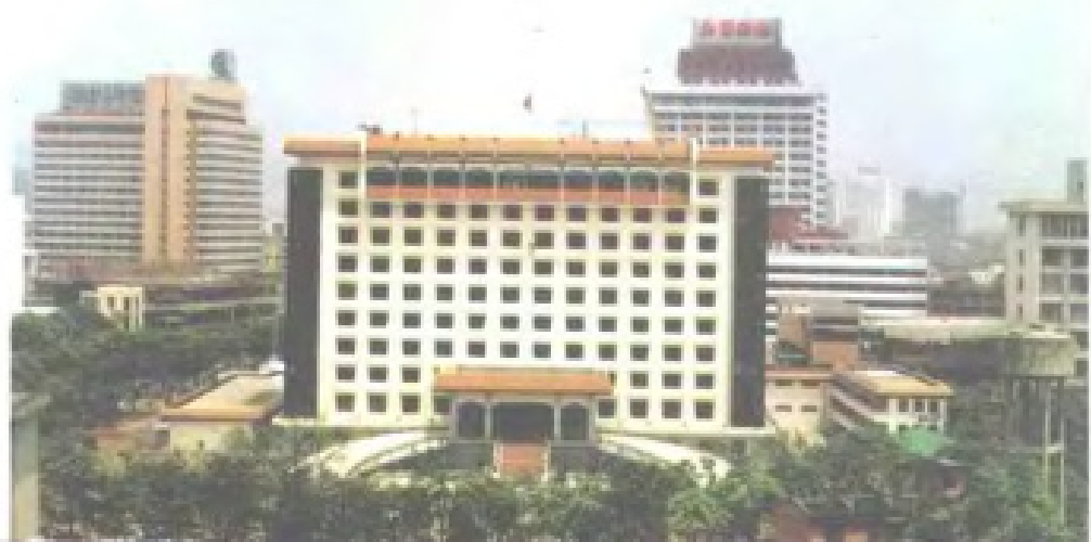
福建省人民代表大会常务委员会办公楼