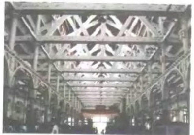
马尾造船厂轮机车间