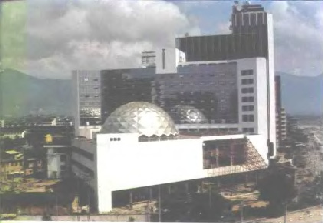
福建省工业展览大厦