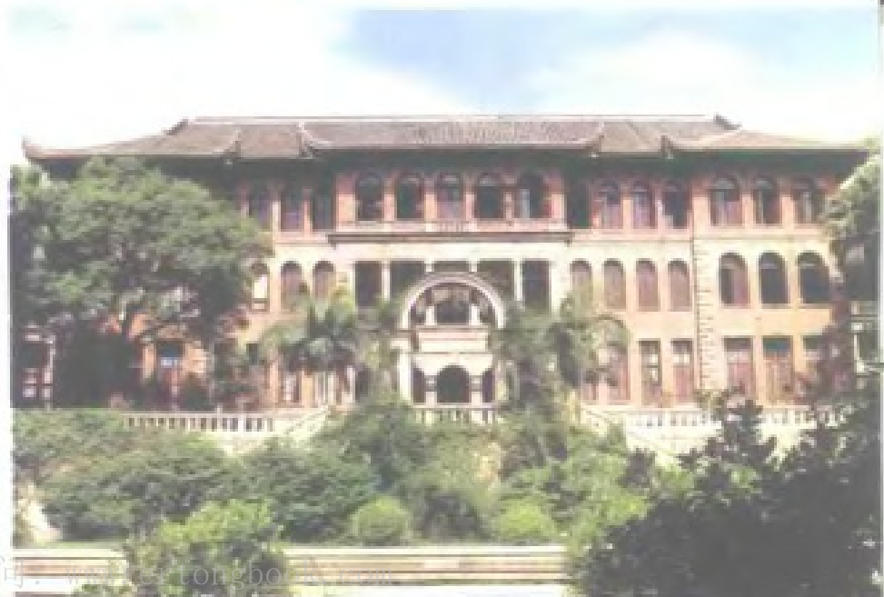
原华南女子文理学院