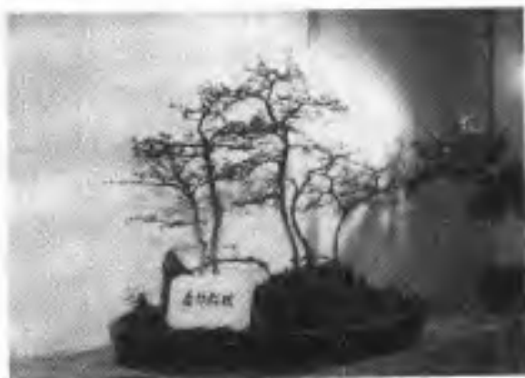
(4) 第二届省展三等奖