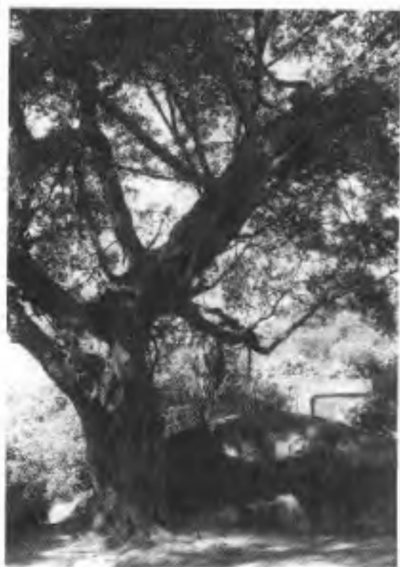
(3) 千山月朗风清岩栎树