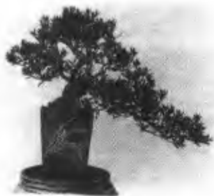
(1) 第一届省展一等奖