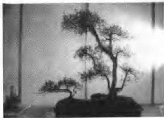
(3) 第二届省展二等奖