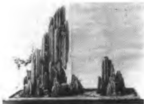
(2) 第一届全国展二等奖