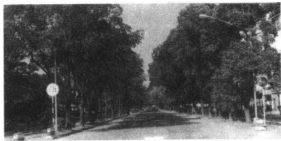
图 7-5 华林路西段行道树

园林绿化管理虽有暂行办法，但有法不依，执法不严的情况仍时有发生，砍伐道路树木，占用道路绿地的现象仍较严重。如80年代，鼓屏路、八一七北路、朱紫坊河旁、五四路、达道路等处就砍掉数以百计的20年路树及古树，园林管理部门无力制止。1981年