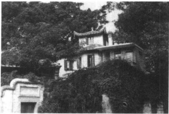
图 7-3 仓山私人住宅绿化

(一)大中学校:福建师范大学、福州大学、福建医学院、市十四中学、省银行学校、省建筑工程学校、福建师大附属中学、福州高级中学、省农学院、福州第八中学、福建省邮电学校。