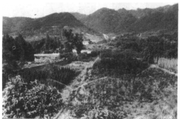
图 7-4 东山苗圃

八一苗圃，始建于1964年，1969年底撤销，1972年8月复建，经过10多年的艰苦创业，开山造梯田，有苗圃19.09公顷，山地46.67公顷，温室1座40平方米，培植园林绿化的树木及花卉270个品种，年可出圃苗木3万株（丛）。