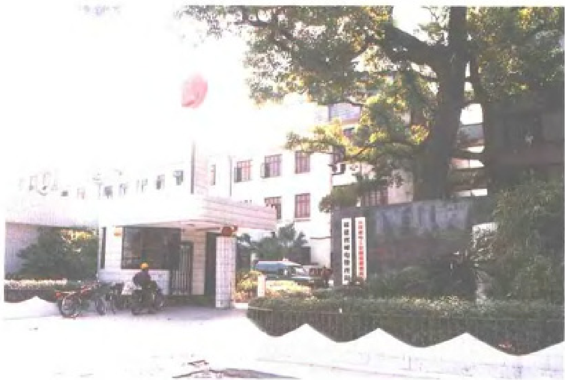
福建省邮电管理局