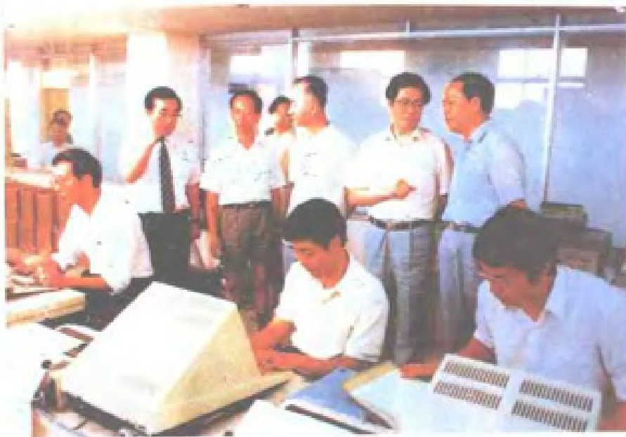
1989年6月，中共 福建省委书记陈光毅、 省长王兆国视察福建富 士通通信软件有限公司