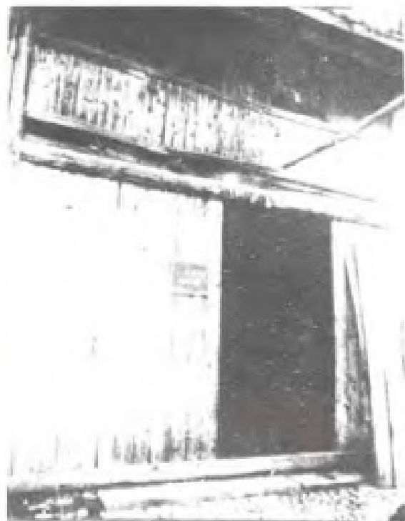
1932年，设在长汀县五通街的中华苏维埃福建省邮政管理局