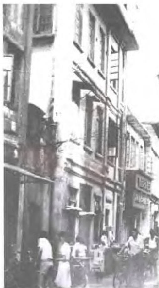
民国时期的厦门电话公司