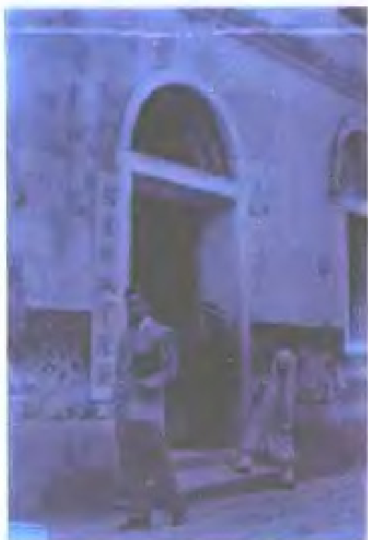
建 政 管 理 局 民 国 时 期 ， 设 在 福 州 泛 船 浦 的 福