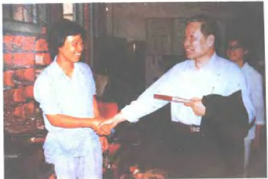
1985年10月11日， 邮电部部长杨泰芳视察 福建省邮件转运处