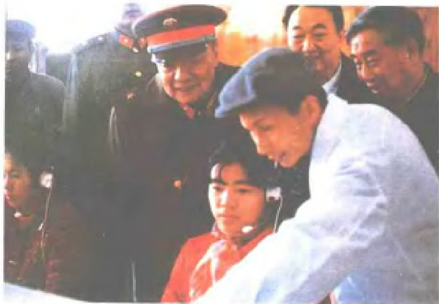
1986年2月8日,中央军委副主席杨尚昆视察福州电信局长途交换台