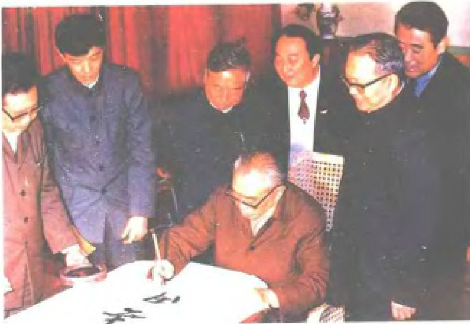
1987年1月20日， 全国人大常委会副委员 长朱学范视察福州电信 局并题词作勉