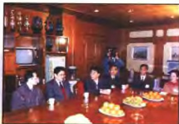
▲ 1995年2月，国务委员李铁映（左二）与漳州片仔癀集团公司职工座谈。