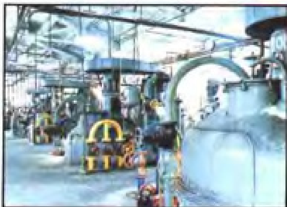
◀ 庆大霉素发酵(三明制药厂)