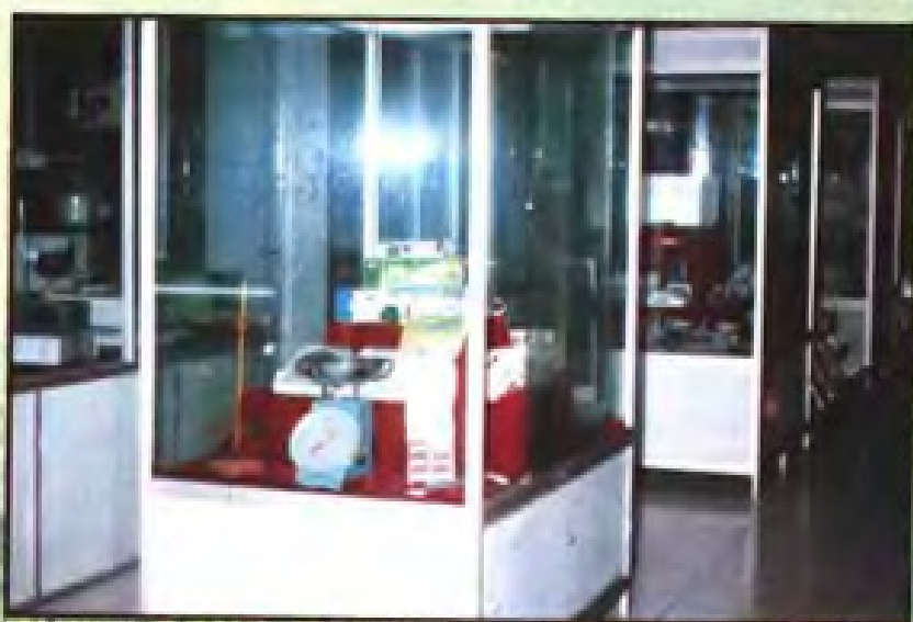
▲ 地产医疗器械产品