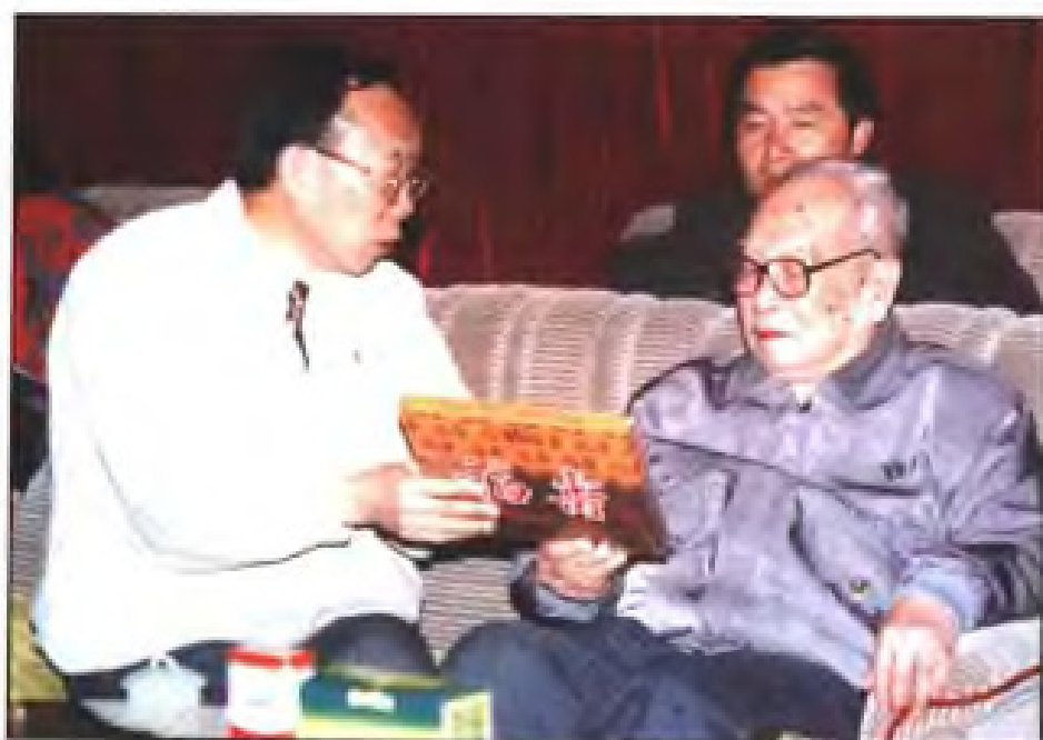
◀ 1994年1月18日，原全国人大常委会副委员长叶飞（前排右一）听取厦门中药厂领导介绍新产品。