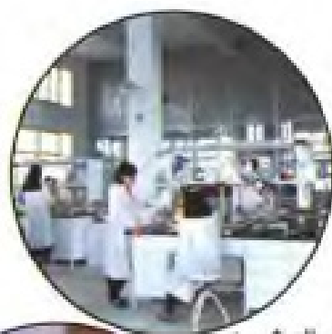
▲ 合成、半合成药物研究室