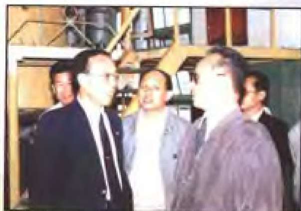
▲ 1991年12月24日，全国政协副主席谷牧（前排右一）视察厦门中药厂。