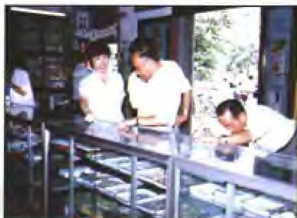
▲ 1992年9月23日，国家医药管理局副局长金同珍(右二)观看三明市医药公司网点柜台。