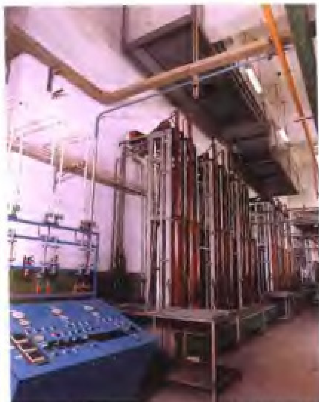
厦门虹鹭钨钼工业有限公司 \phi 20毫米钨条插熔设备