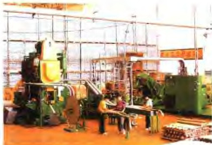
漳州国际铝容器有限公司铝质易开盖二片罐制盖生产线