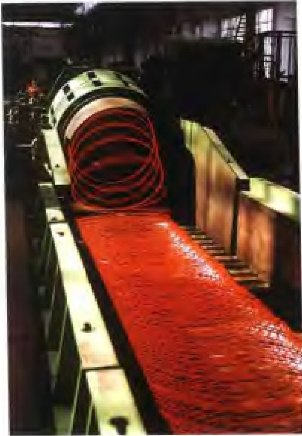
生产中的三明钢铁厂高速线材生产线