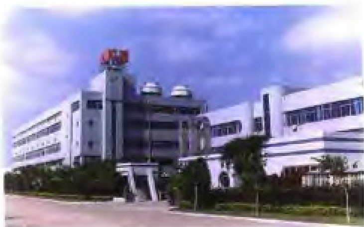
厦门虹鹭钨钼工业有限公司外景