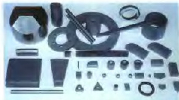
厦门金鹭特种合金有限公司生产的部分硬质合金产品