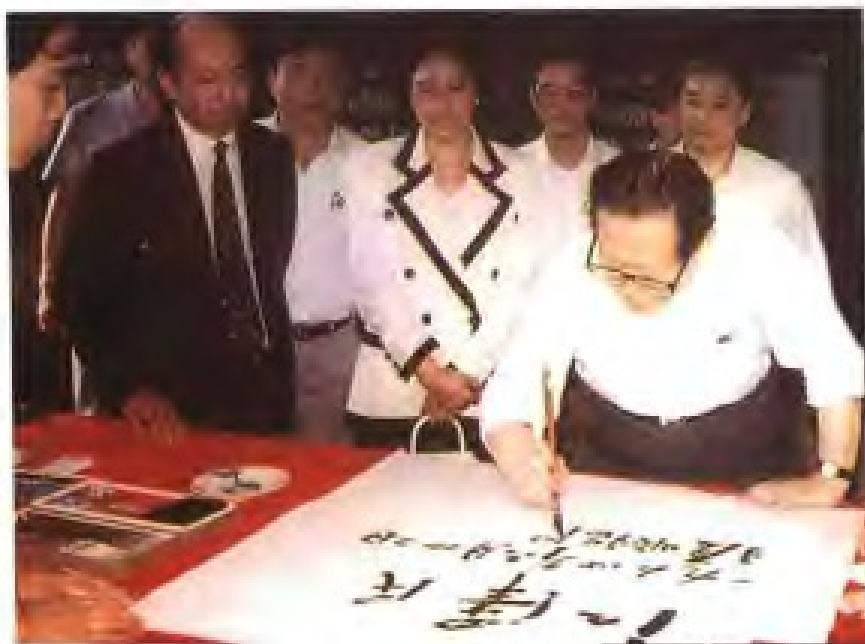
1994年6月22日，中共中央总书记、国家主席江泽民视察厦门厦顺铝箔有限公司并题词