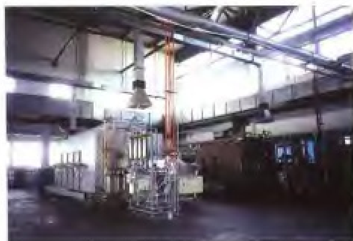
厦门金鹭特种合金有限公司碳化炉群