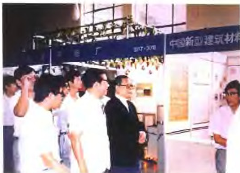
1988年8月，江泽民参观上海产品博览会展厅中的南平铝厂展馆