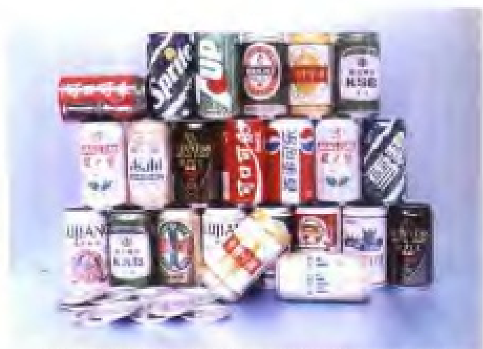
漳州国际铝容器有限公司铝质易开盖二片罐产品