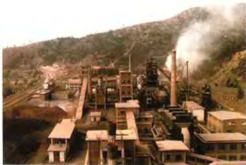
福建省生铁铸造基地——龙钢有限责任公司厂区一角