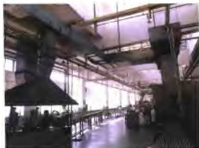
厦门虹鹭钨钼工业有限公司旋锻串打设备流水线