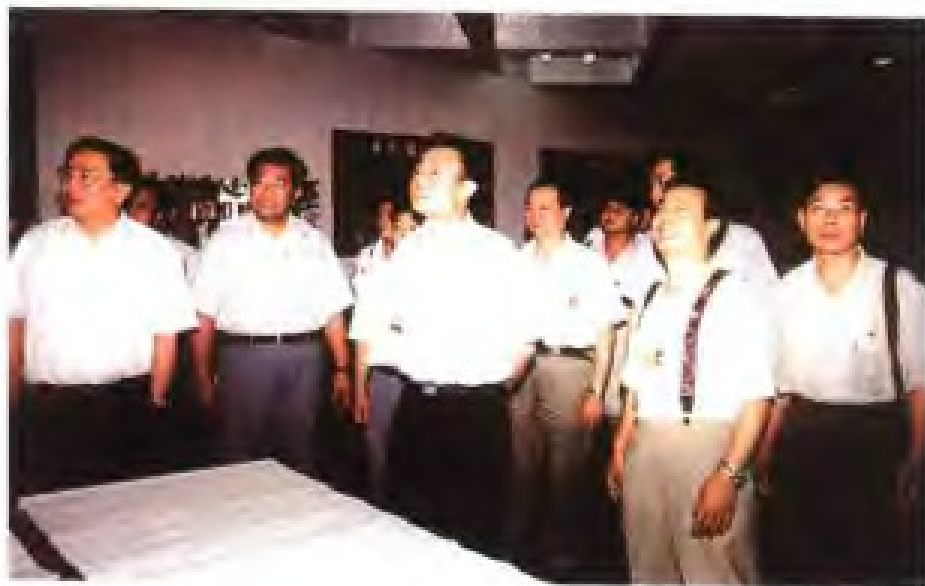
1995年7月9日，国务院副总理吴邦国（前左三）、国务委员兼国务院秘书长罗干（前左一），在中共福建省委书记贾庆林、省长陈明义陪同下视察漳州国际铝容器有限公司。