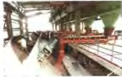
三明钢铁厂烧结小球造球机及所属烧结厂外景