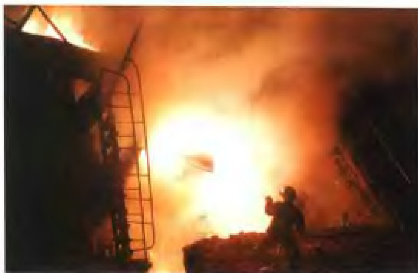
龙钢有限责任公司电炉炼钢生产情景