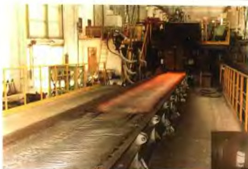
中国国际钢铁制品有限公司摩根型高速线材轧机