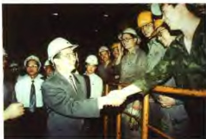
1995年5月16日，国家副主席胡锦涛视察中国国际钢铁制品有限公司