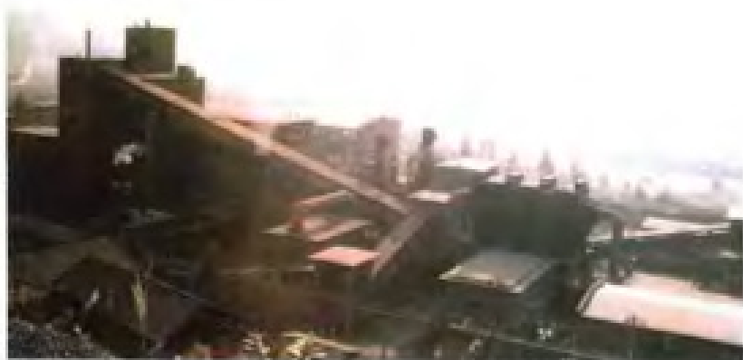
龙钢有限责任公司烧结车间