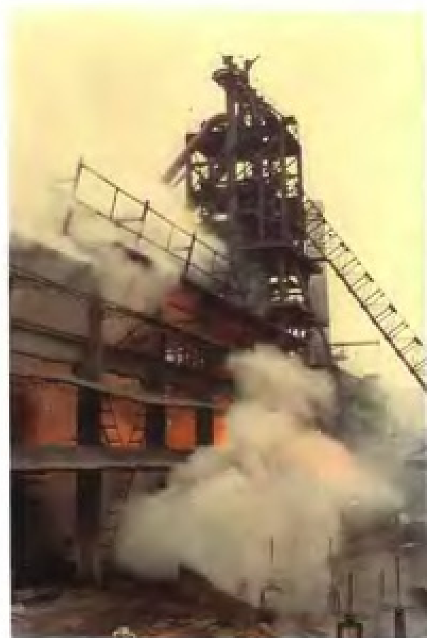
龙钢有限责任公司120立方米高炉正在出铁