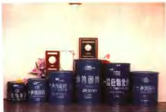
厦门钨业股份有限公司生产的国优产品仲钨酸铵和省优产品蓝色氧化铈