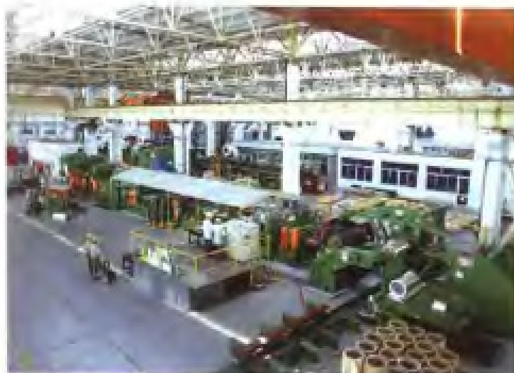
瑞闽铝板带有限公司从美国引进的拉弯矫直机列