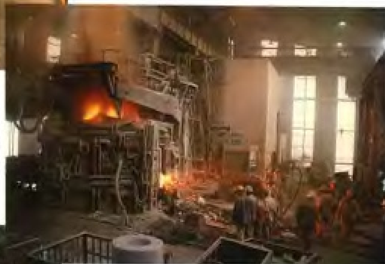
中国国际钢铁制品有限公司从英国引进的超功率50吨电弧炉