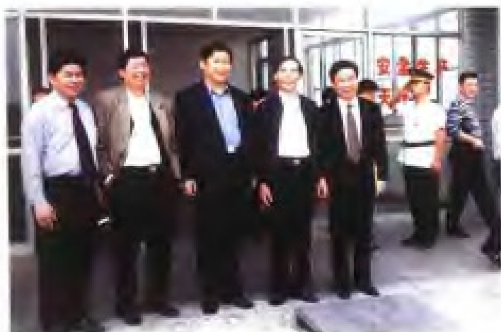
2000年4月，福建省省长习近平（左三）视察厦门金鹭特种合金有限公司