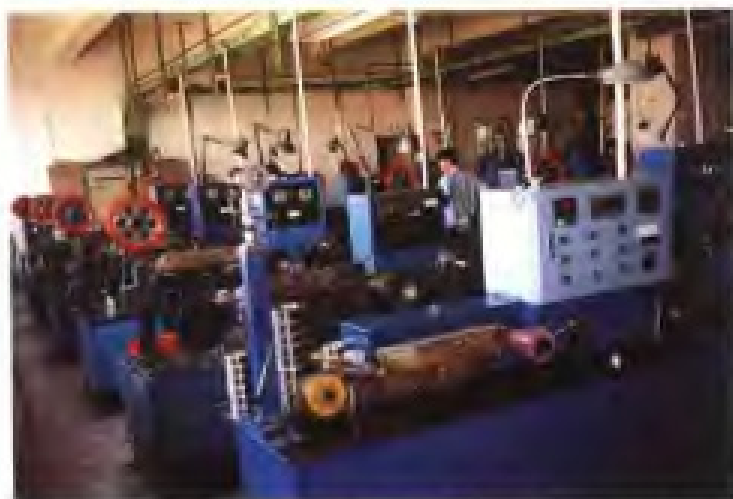
厦门虹鹭钨钼工业有限公司细钨丝生产线之八模拉丝机