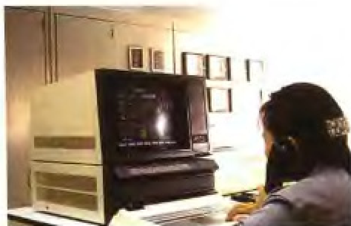
厦门钨业股份有限公司APT生产集散式计算机控制系统控制室