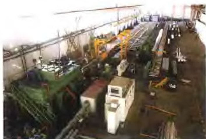
南平铝厂从意大利引进的铝型材挤压生产线