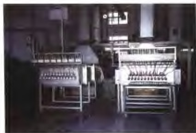
厦门虹鹭钨钼工业有限公司23管蓝色氧化钨生产炉