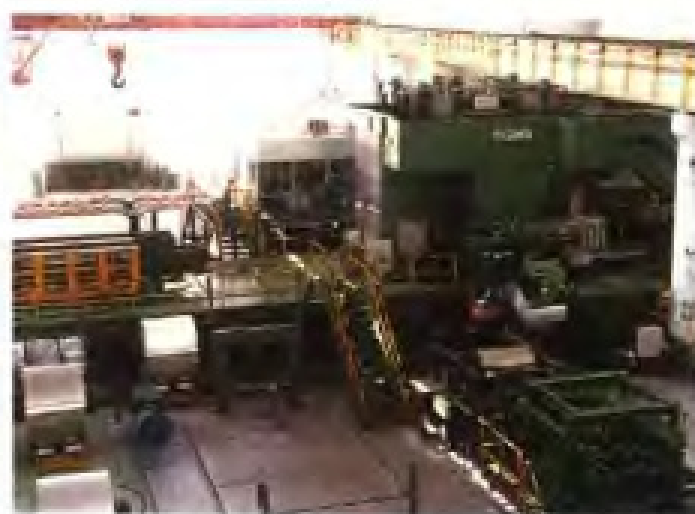
瑞闽铝板带有限公司引进的德国CVC6辊不可逆冷轧机