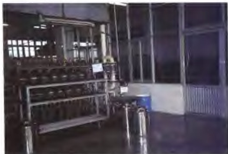
厦门虹鹭钨钼工业有限公司钨粉15管还原炉