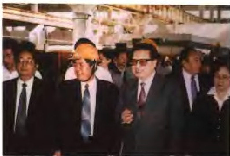
1996年12月22日，福建省代省长贺国强（中）到瑞闽铝板带有限公司调研