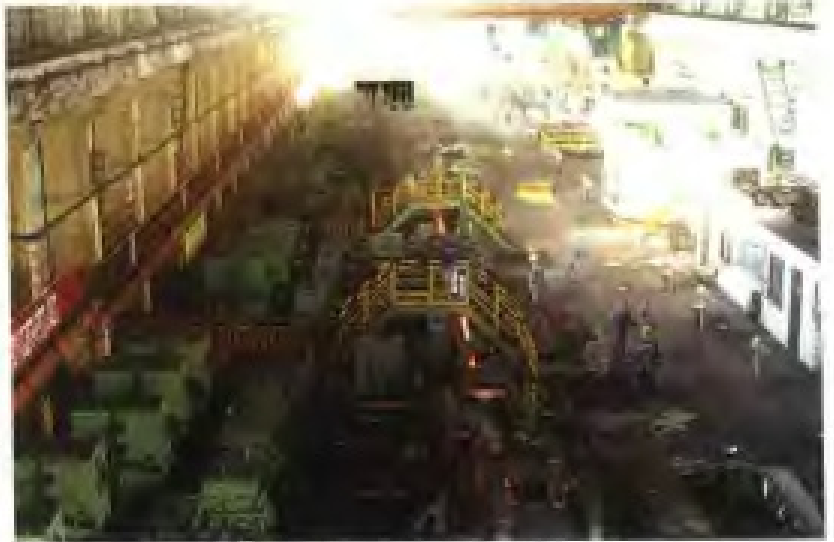
三明钢铁厂连轧棒材生产线车间