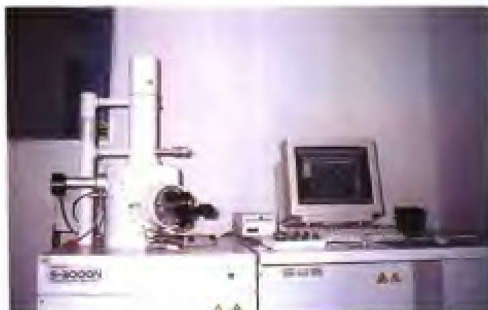
厦门金鹭特种合金有限公司检测仪器扫描电镜和氧氮测定仪