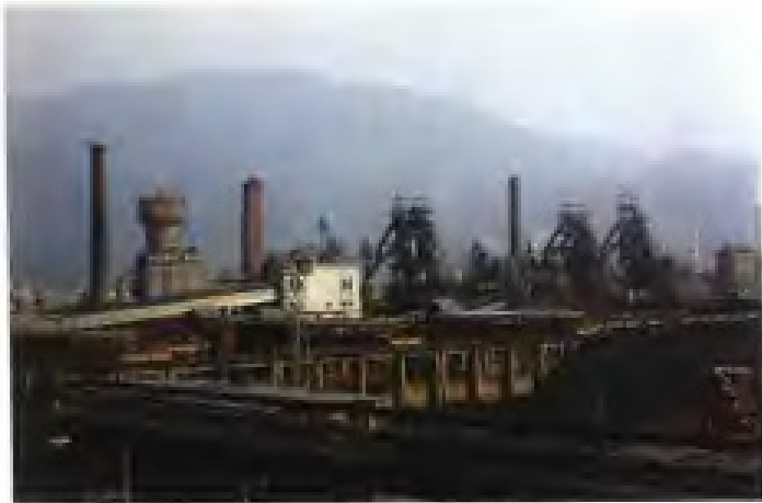
三明钢铁厂高炉群