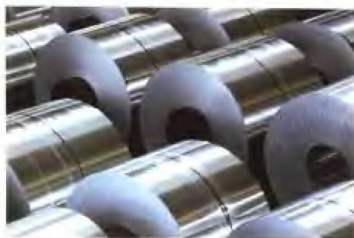
瑞闽铝板带有限公司铝板带产品