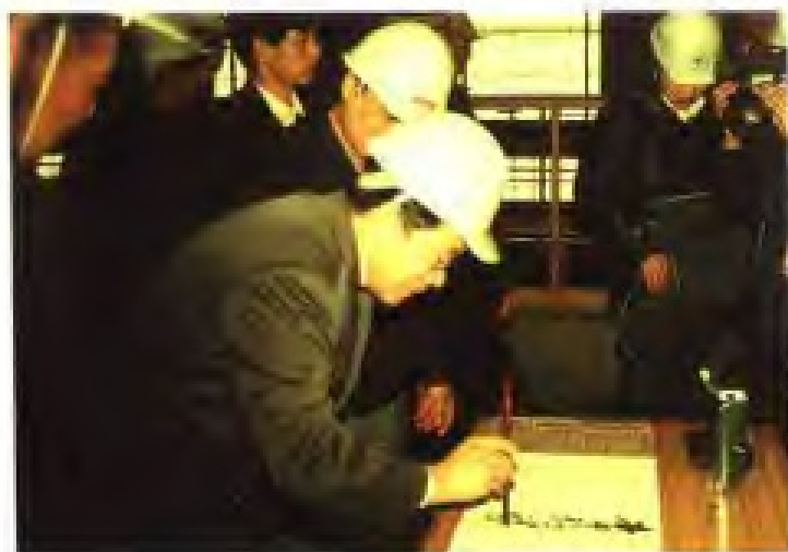
1990年2月8日，中共中央政治局常委李瑞环视察中国国际钢铁制品有限公司