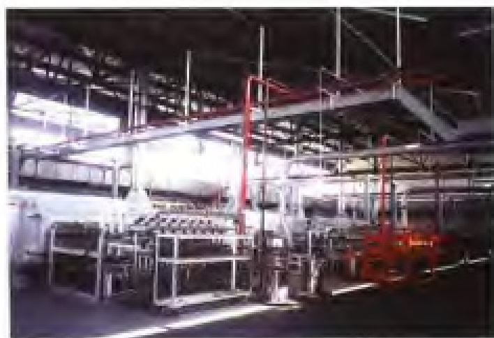
厦门金鹭特种合金有限公司还原炉群