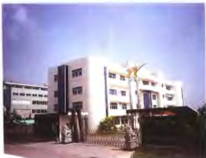
厦门金鹭特种合金有限公司外景