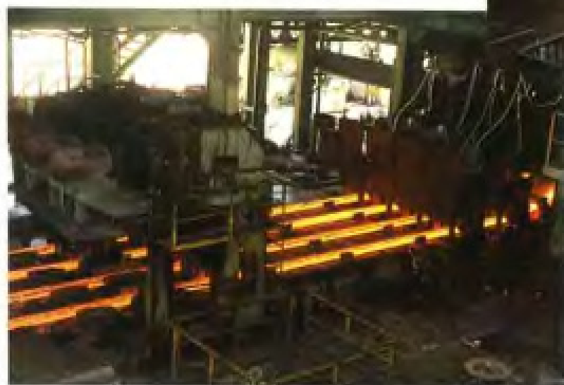
中国国际钢铁制品有限公司从英国引进的成套小方坯连铸机