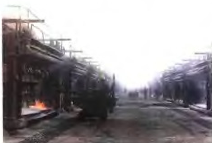
南平铝厂电解铝生产线