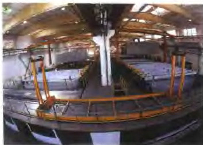
南平铝厂从法国和意大利引进关键技术的铝型材氧化着色生产线