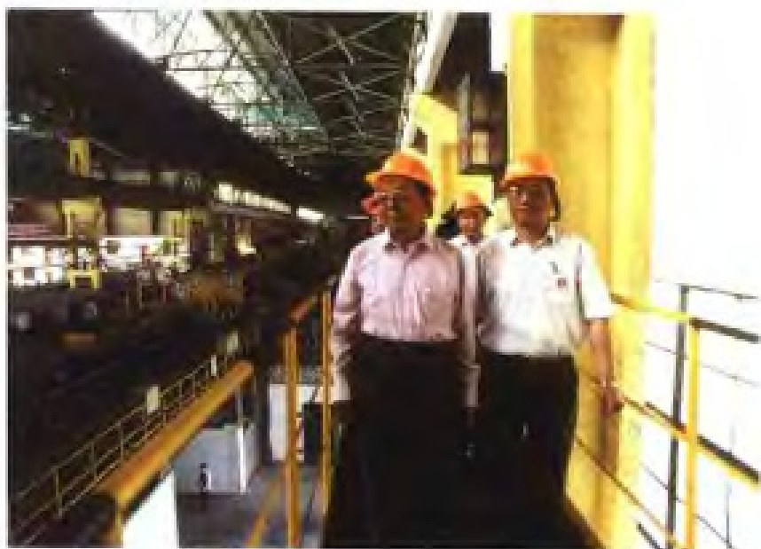
1999年6月3日，全国人大常委会副委员长田纪云（左一）视察三明钢铁厂