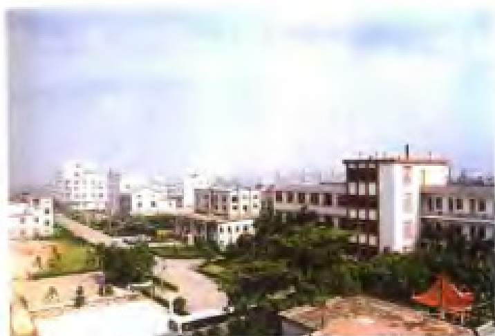
厦门钨业股份有限公司总部全景