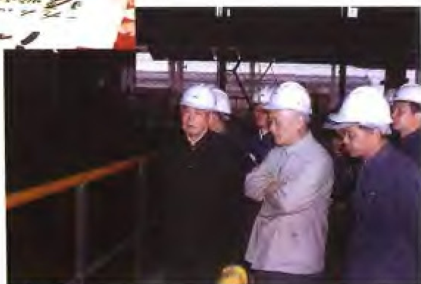
1983年11月2日，国家主席李先念（左一）由中共福建省委书记项南（中）陪同视察三明钢铁厂