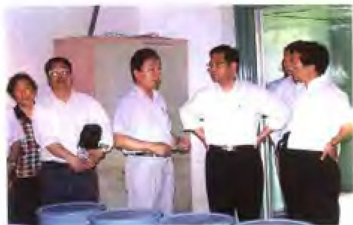
1998年4月9日，福建省副省长黄小晶（左四）视察厦门钨业股份有限公司