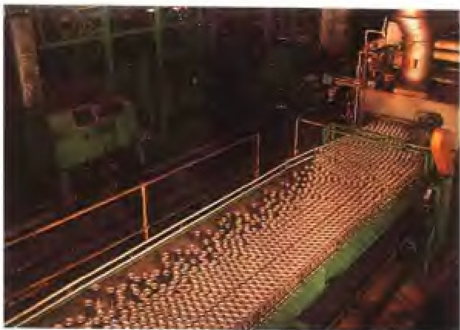
漳州国际铝容器有限公司铝质易开盖二片罐制罐生产线