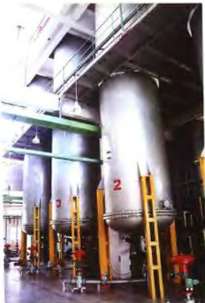
厦门钨业股份有限公司APT生产工艺关键设备之一——离子交换柱