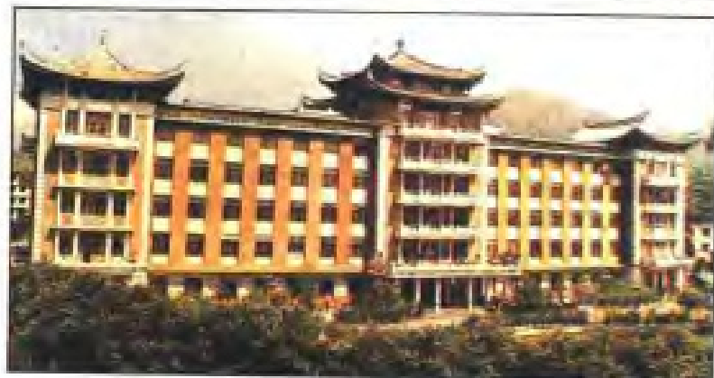
永春县医院“延年楼”（医疗综合楼） 建于1985年，建筑面积6397平方 米（华侨捐建）