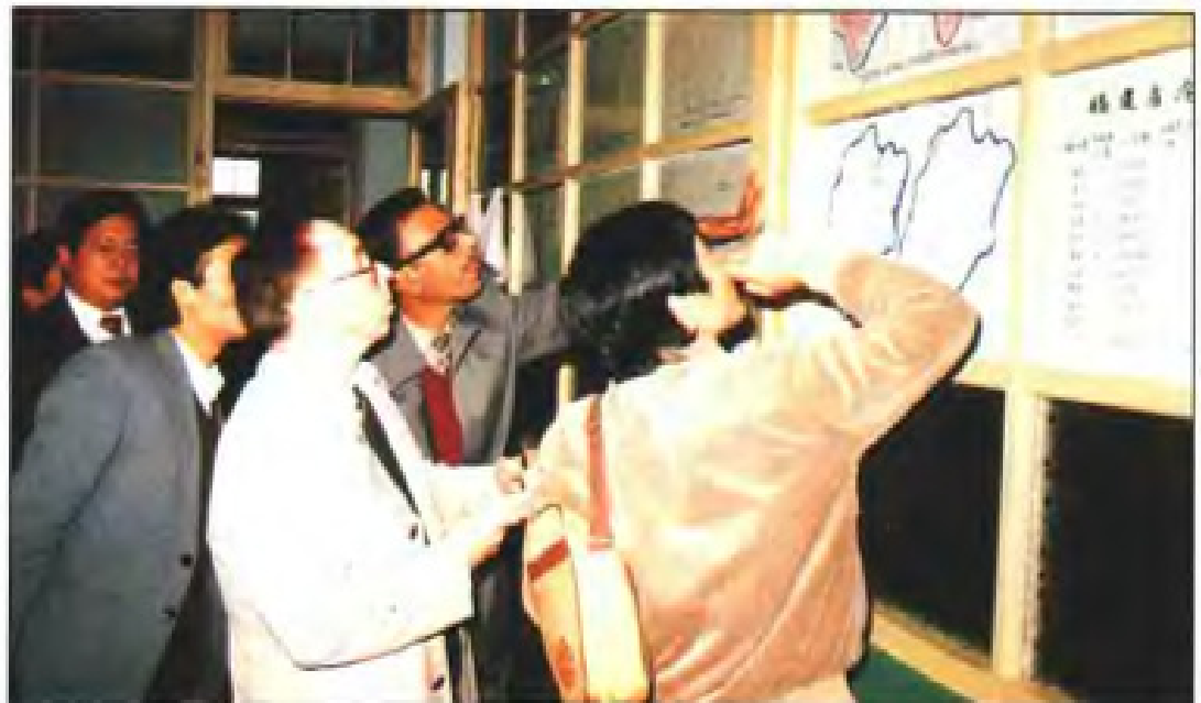
1988年联合国儿童基金会，世界卫生组织专家来福建省审评计划免疫达标情况