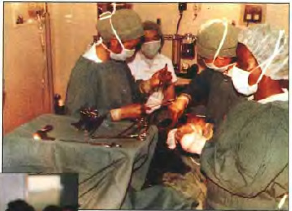
援助博茨瓦纳医疗队在为该国患者施行手术