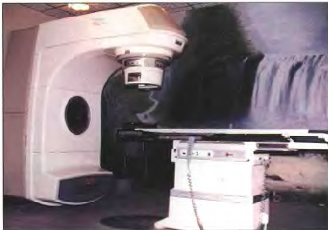
福建省肿瘤医院 80 年代引进的高、中、低能电子直线加速器