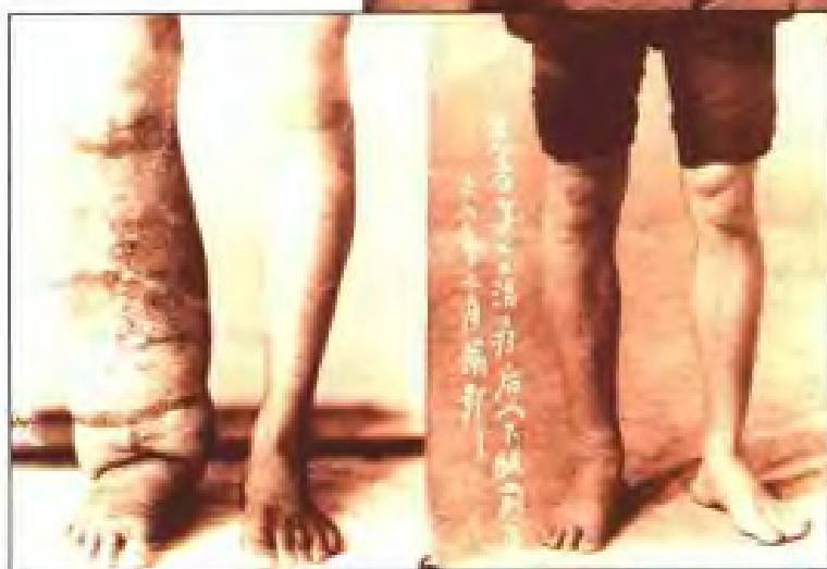
丝虫病患者治疗前后