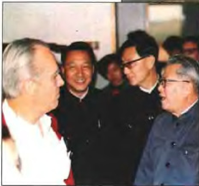
联合国儿童基金会，世界卫生组织官员 视察莆田妇幼卫生示范县