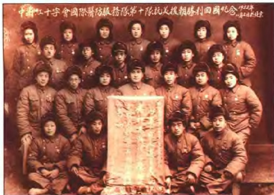
福建省组织的两批医务人员参加抗美援朝医疗队回国后在北京留影