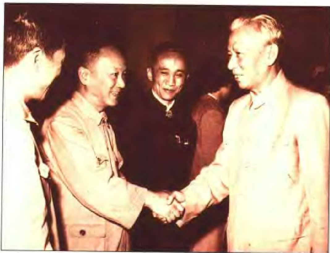
1960年，在全国文教群英会上，国家主席刘少奇亲切接见福建病毒学家吴蛟如