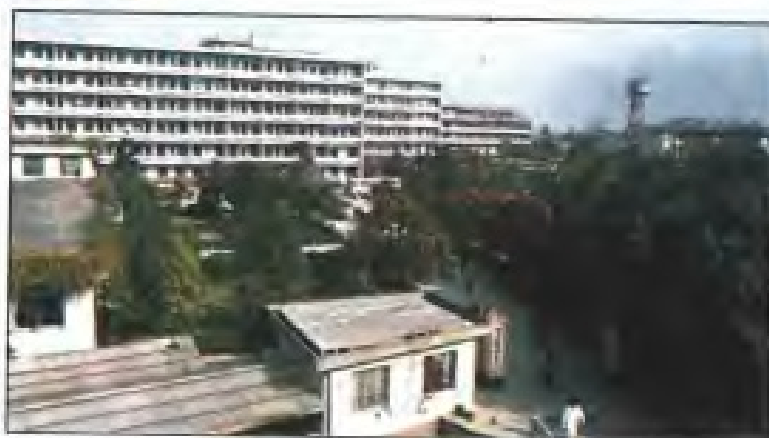
福清县医院外科大楼建于1983年， 建筑面积4790平方米（华侨捐建）