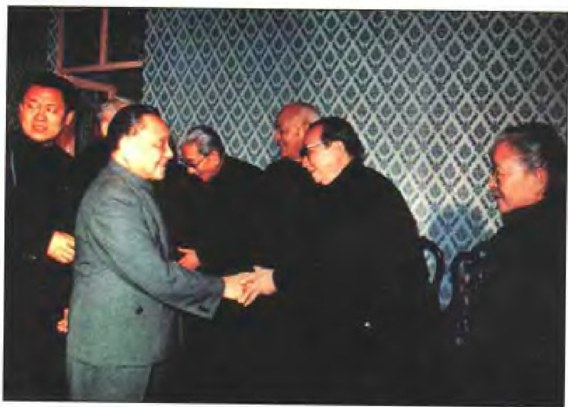
1984年3月，邓小平同志在厦门亲切接见福建名老中医陈应龙