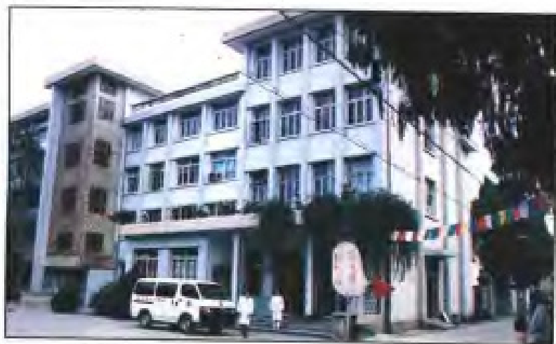
汀洲医院门诊大楼建于1984年， 建筑面积2194平方米