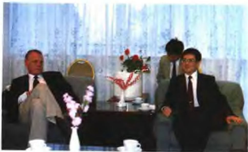
◀ 1989年4月，福建省省长王兆国会见欧洲共同体委员会驻中国大使杜侠都