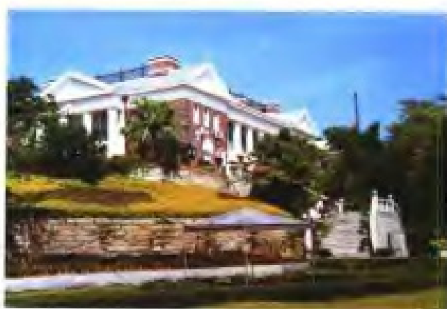
厦门美国领事馆旧址