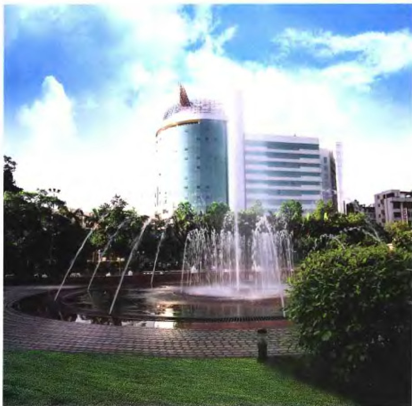
福建省人民政府外事办公室大楼