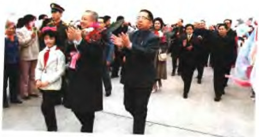
▶ 1983年12月18日，民主柬埔寨主席诺罗敦·西哈努克亲王访问福建，省长胡平前往机场迎接