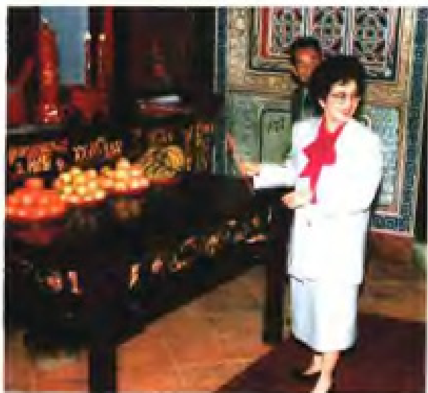
◀ 1988年4月，菲律宾总统科拉松·阿基诺夫人访问福建，在龙海许氏宗庙上香