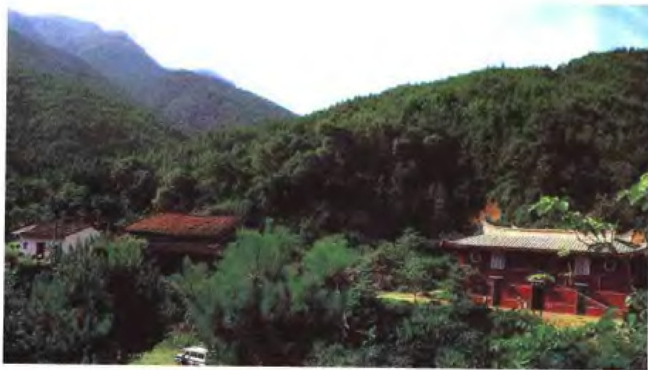
日本黄檗宗祖庭——福清黄檗山万福寺