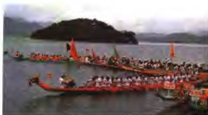
► 1988年，国际龙舟邀请赛在福州举行