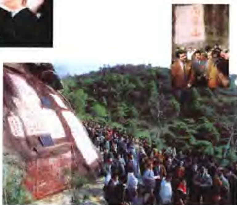
▶ 1991年2月，聯合國教科文組織“海上絲綢之路”考察團考察泉州九日山