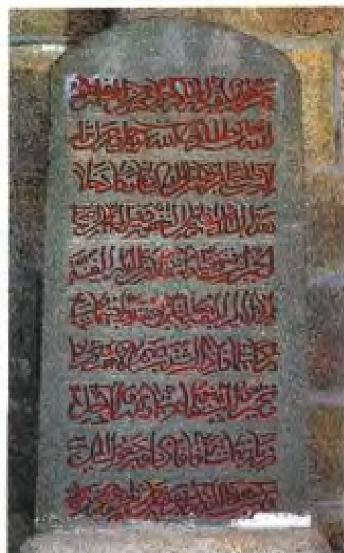
泉州伊斯兰教圣墓阿拉伯文墓碑