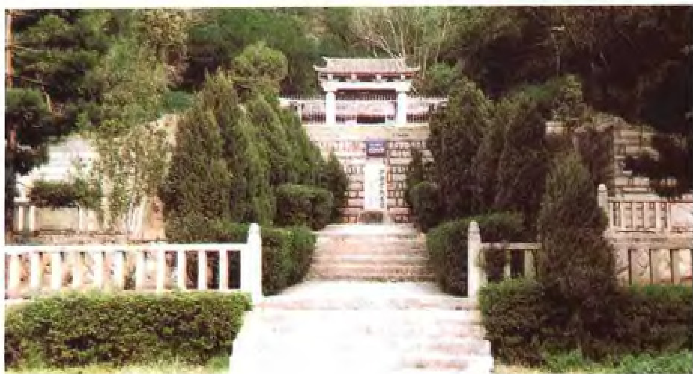
泉州伊斯兰教圣墓