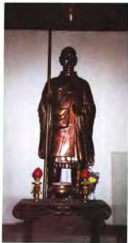
福州开元寺空海铜像