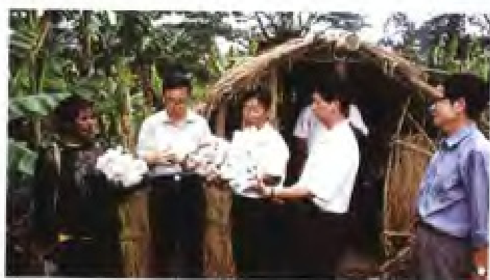
◀ 福建农业专家在巴布亚新几内亚东高地省传授食用菌栽培技术