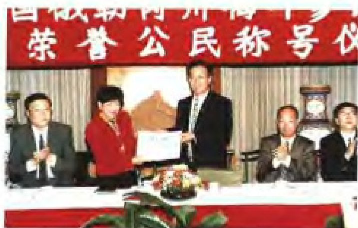
◀ 1994年12月，福建省副省长张家坤代表省政府授予美国俄勒冈州参议员梅叶女士福建省“荣誉公民”称号