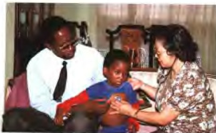
► 福建省援外医疗队在博茨瓦纳为病人诊病