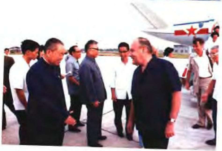
▶ 1980年9月，新西兰总理马尔登访问福建，省长马兴元前往机场迎接