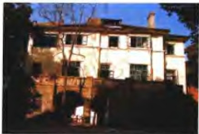
福州美国领事馆旧址