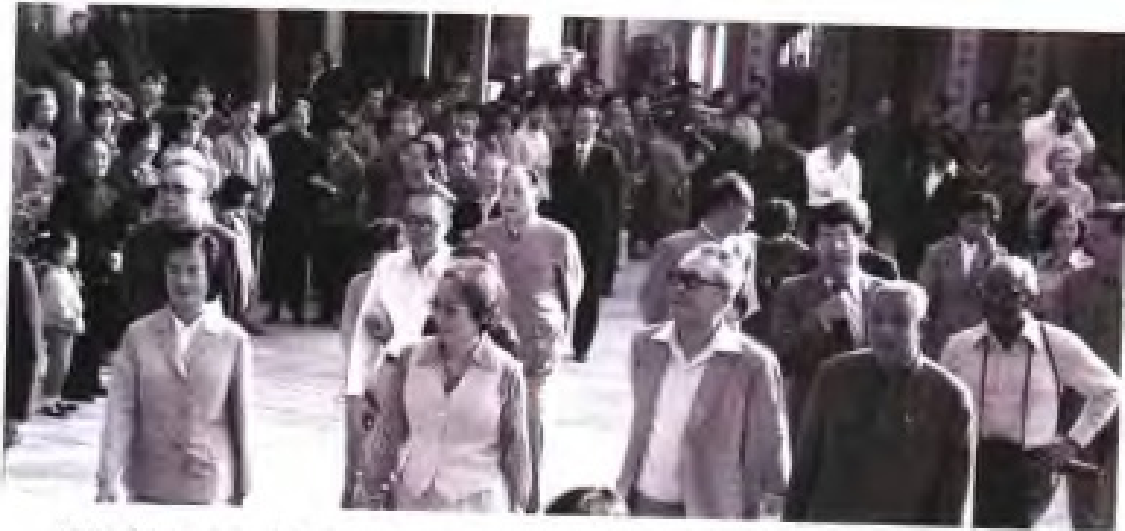
1980年11月，新加坡总理李光耀访问福建，省长马兴元陪同参观