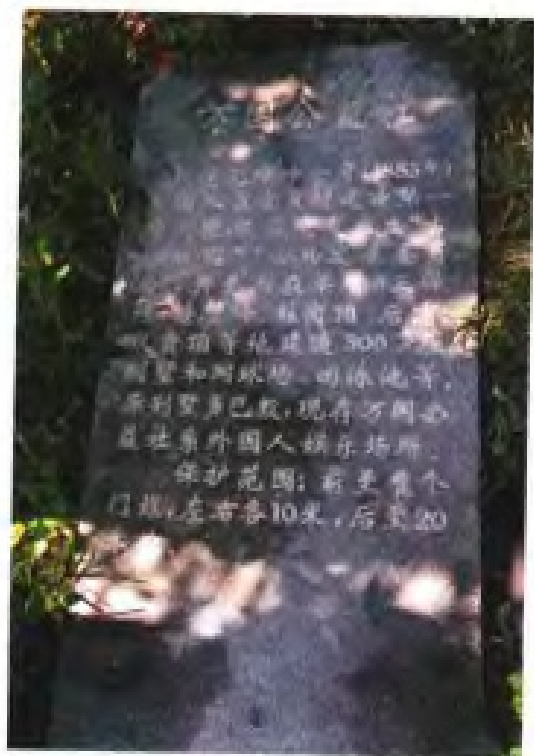
福州万国公益社遗址保护石碑