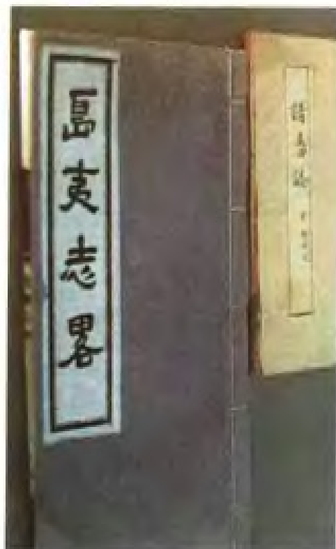
记述宋元时期与福建交往的国家和地区著作《诸番志》和《岛夷志略》