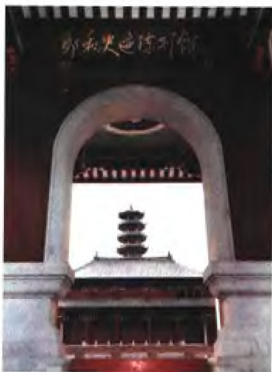
长乐郑和史迹陈列馆