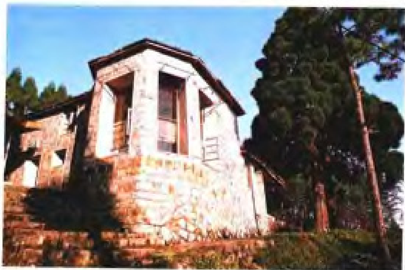
福州鼓岭解放前外国人别墅旧址