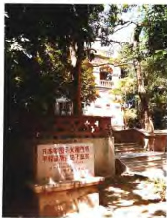
厦门日本领事馆旧址