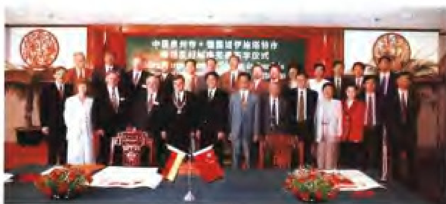
▶ 1995年泉州市与德国诺伊施塔特市締結友好城市关系