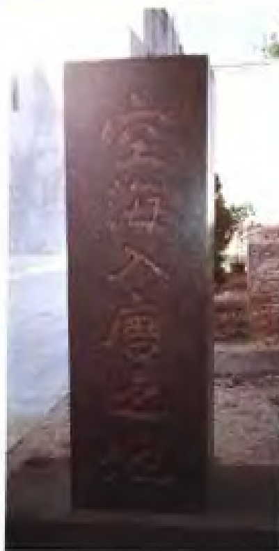
日本遣唐使空海入唐之地——霞浦县赤岸