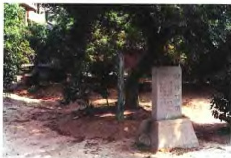
福州仓山琉球墓群