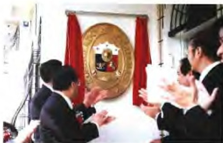
◀ 1995年1月，菲律賓駐廈門領事館舉行開館儀式