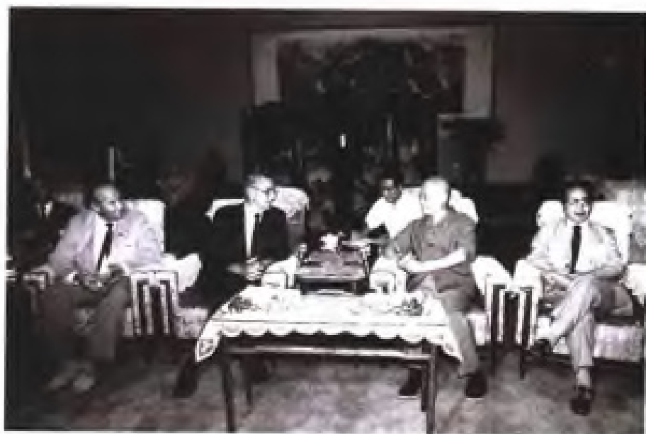
▶ 1984年9月，中共福建省委书记项南，省长胡平会见美国俄勒冈州州长维克托·阿蒂耶