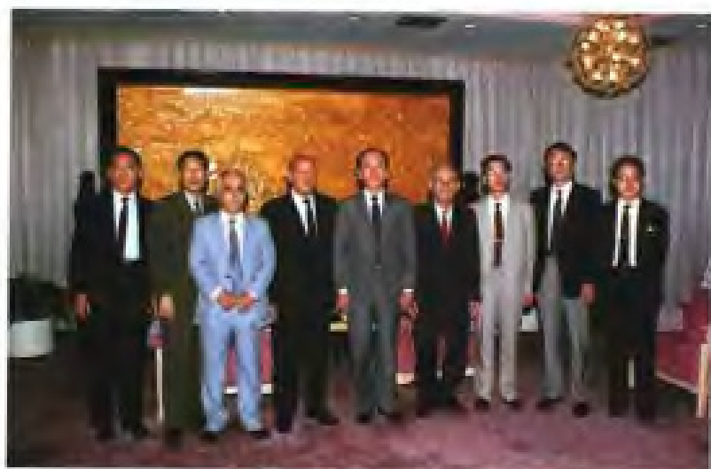
◀ 1992年6月，中共福建省委书记陈光毅会见来访的叙利亚共产党总书记尤素福·费萨尔