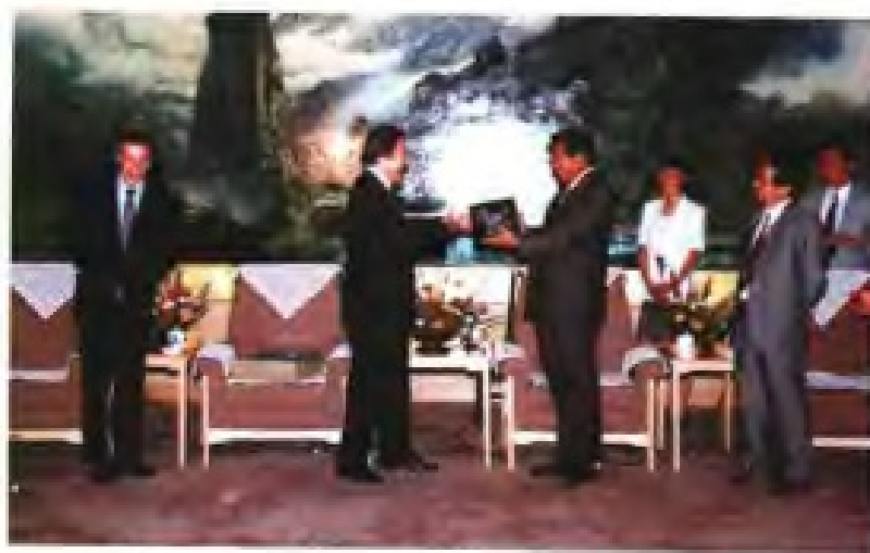
► 1996年6月14日，中共福建省委书记贾庆林、省长陈明义会见西班牙依莎集团总裁托尔达诺一行