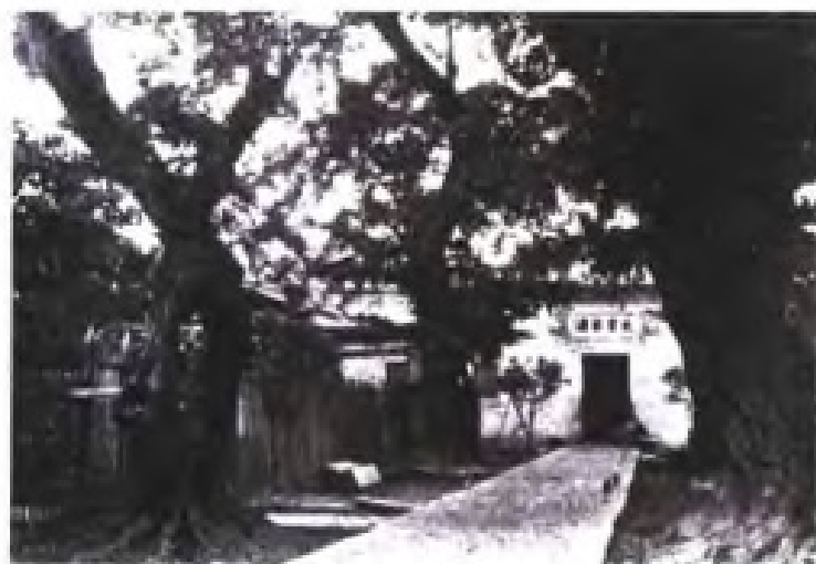
始建于明代的福州琉球馆