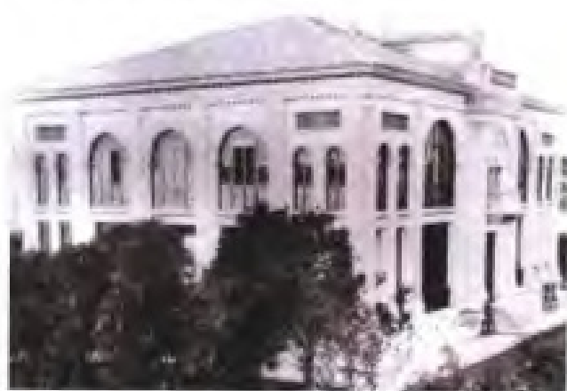
福州英国领事馆旧址