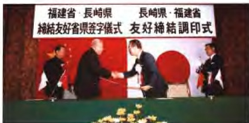
◀ 1982年10月，福建省与日本长崎县締結友好省县关系