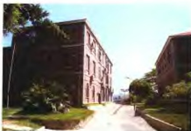
厦门英国领事馆旧址