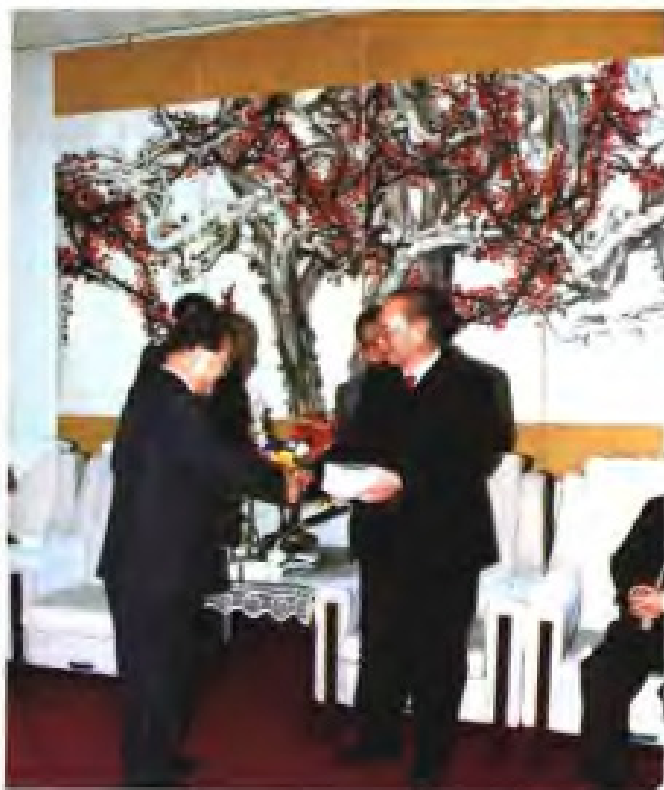
► 1991年11月16日，福建省人大常委会主任程序会见来访的长崎县议会议长宫内雪夫