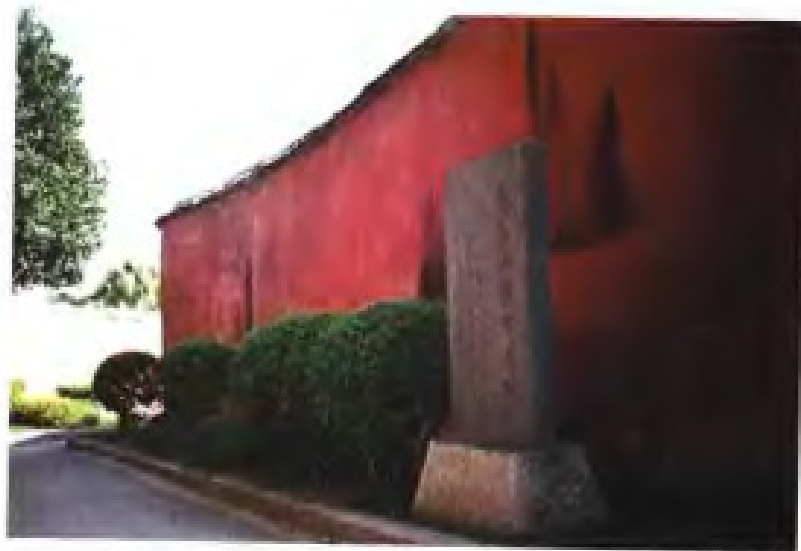
福州乌石山教案旧址