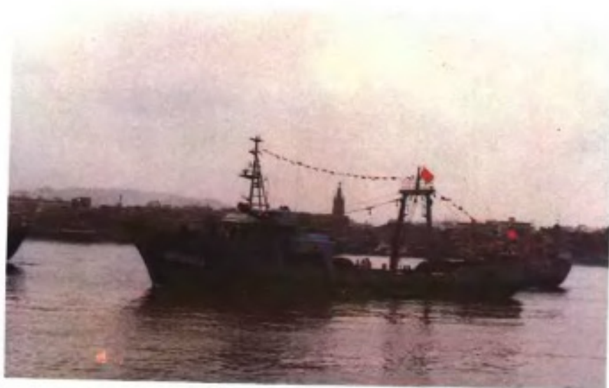
群众渔业队滑道拖网船