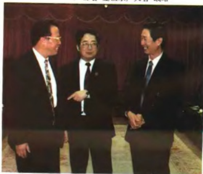
▼ 部署“建设水产大省”战略