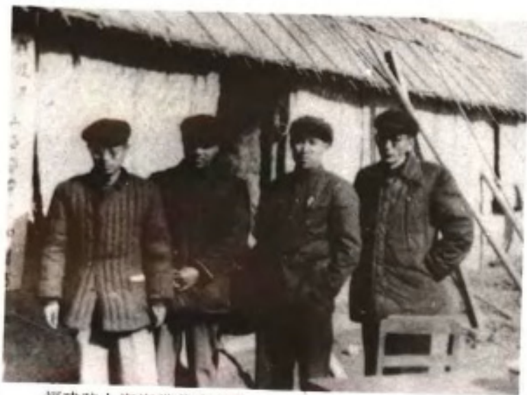
福建驻上海海带苗中转站