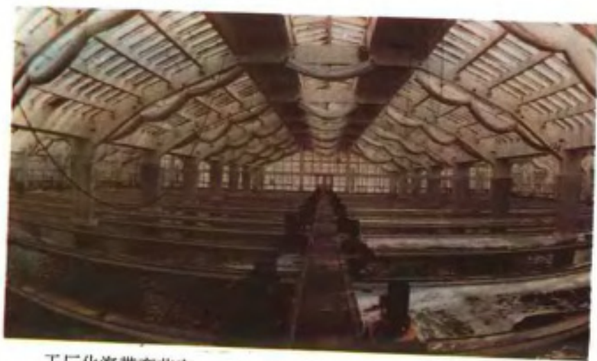
工厂化海带育苗室