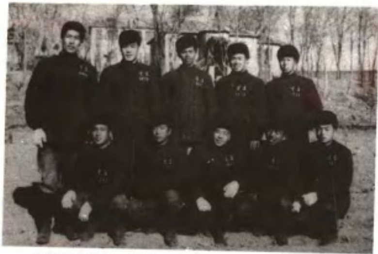
到大连市培育海带苗