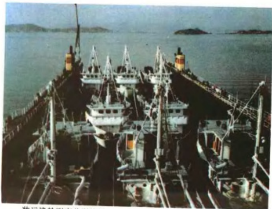
装运渔轮到南美洲捕捞