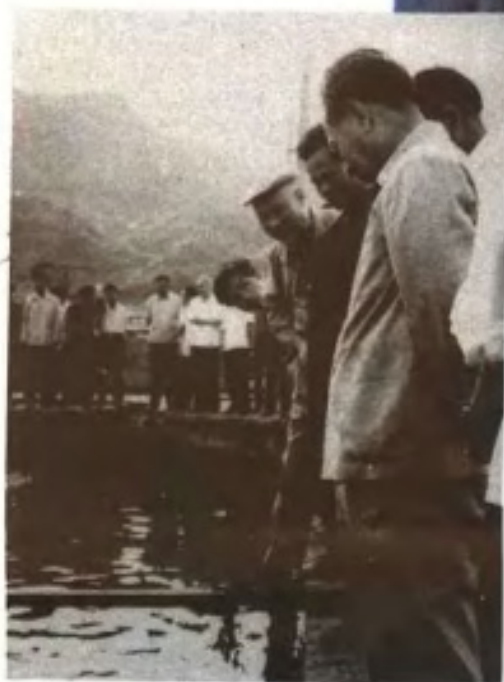
胡耀邦、项南视察养鳗场