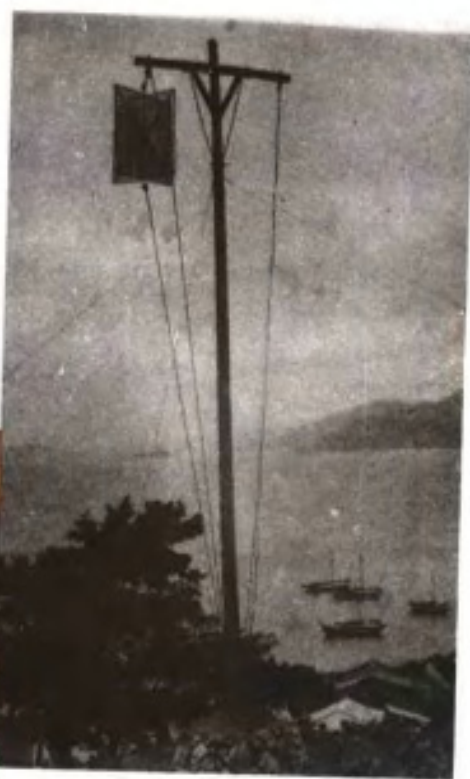
古老的暴风警报设施