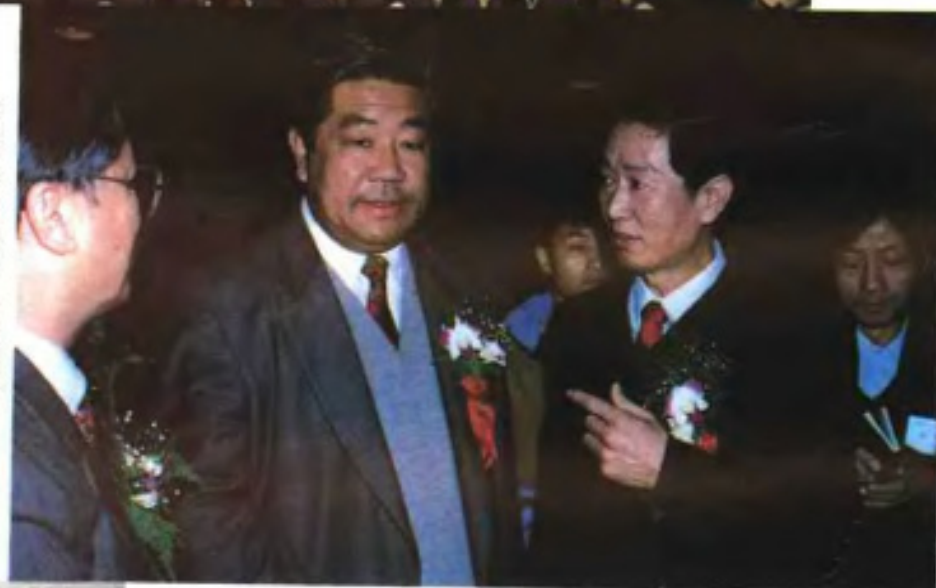
参观「海上田园」建设成果展