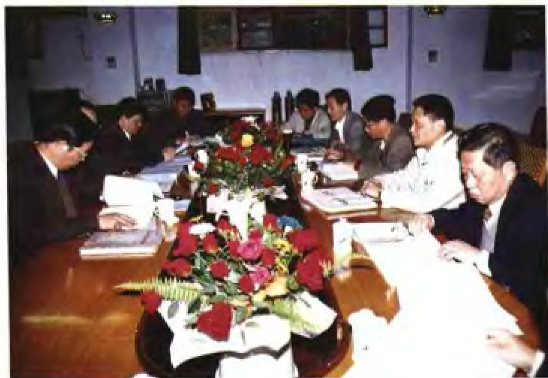
《福建省志·人事志》审稿会