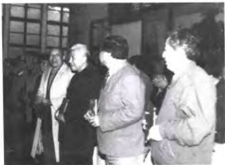
颁发享受政府特殊津贴证书