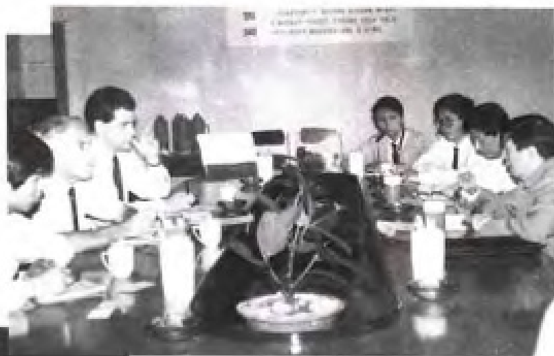
对外人才智力交流