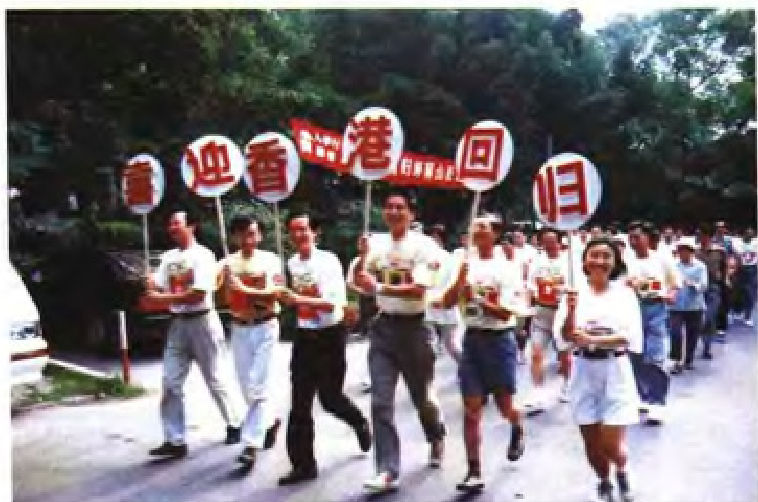
迎接香港回归体育活动