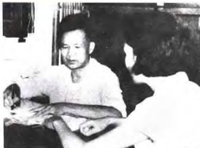
办理干部调配手续