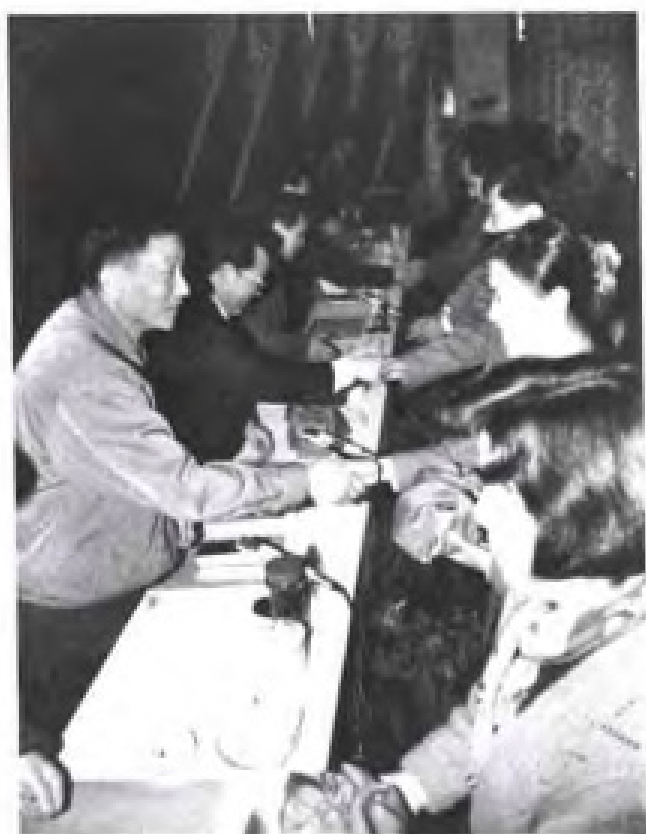
颁发工人技术等级岗位证书