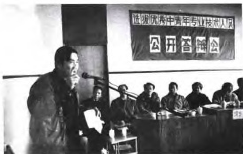
选拔优秀中青年专业技术人员