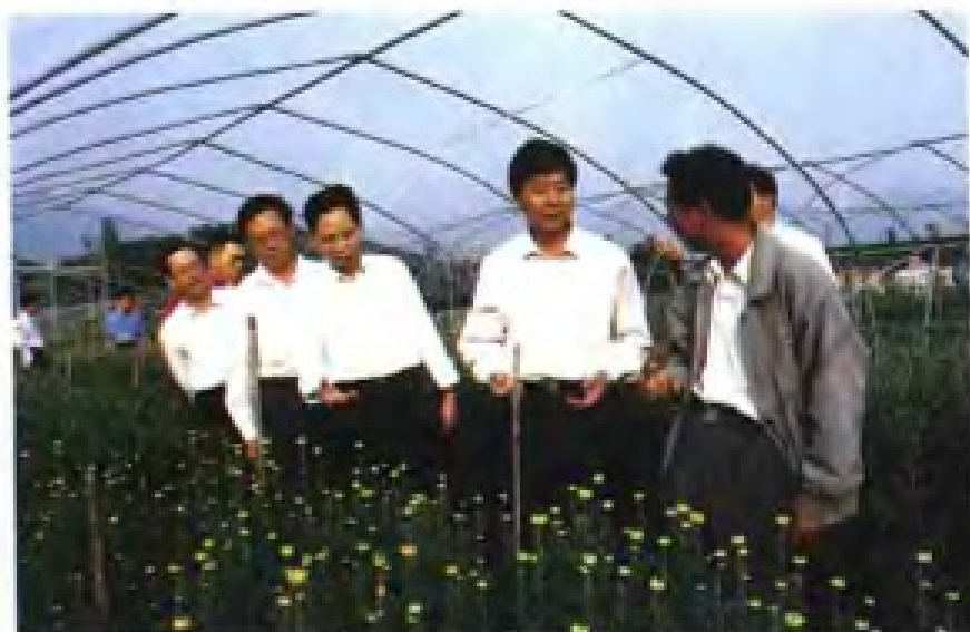
人才管理工作调研