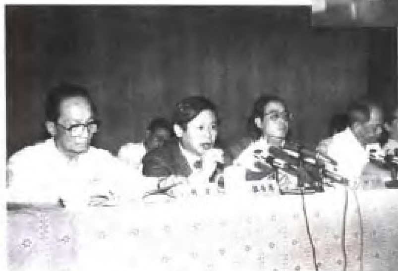
创业者奉献报告会