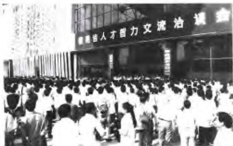
全省人才智力交流