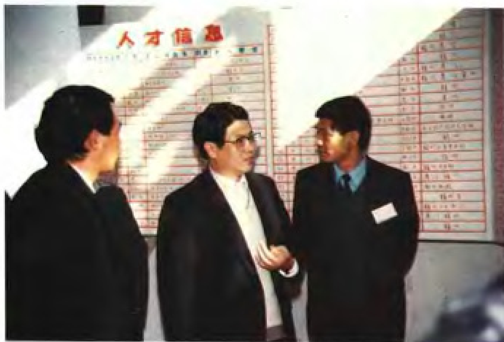
1988年12月，福建省省长王兆国视察人才市场。