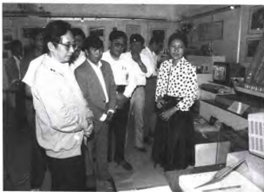
1990年7月1日，福建省副省长陈明义审查全国引智成果展览会福建省预展项目。