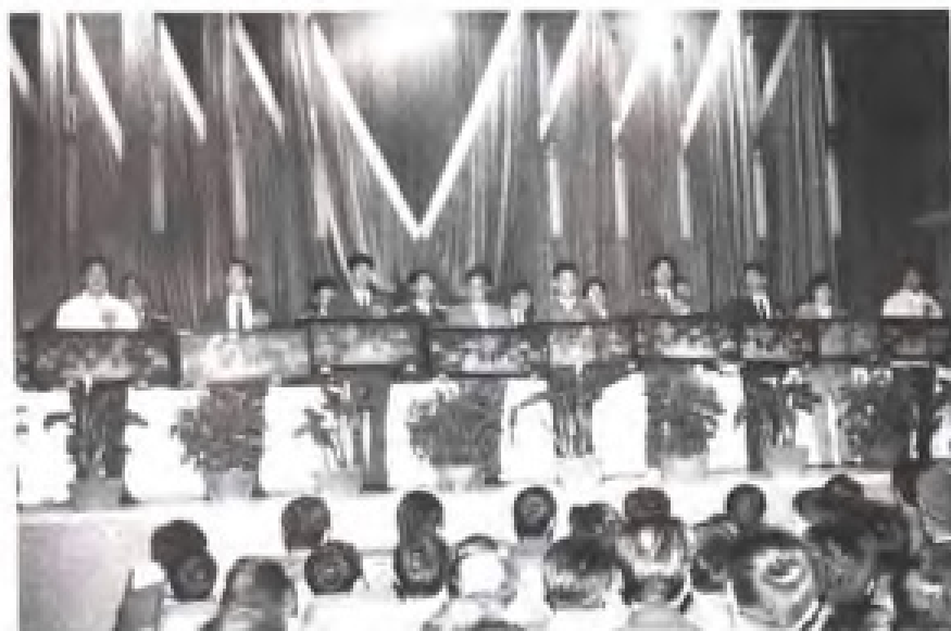
表彰军转干部先进个人