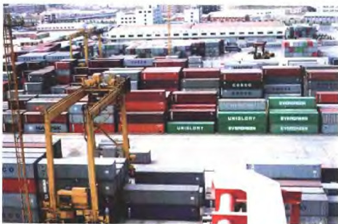
福州港集装箱堆场