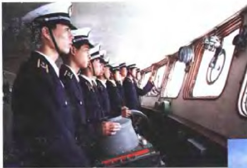
福建船政学校学生在实习