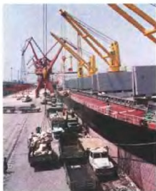
厦门港件杂货装卸