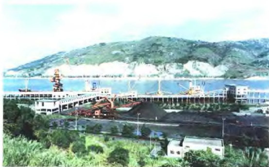
福州港松门港区煤码头