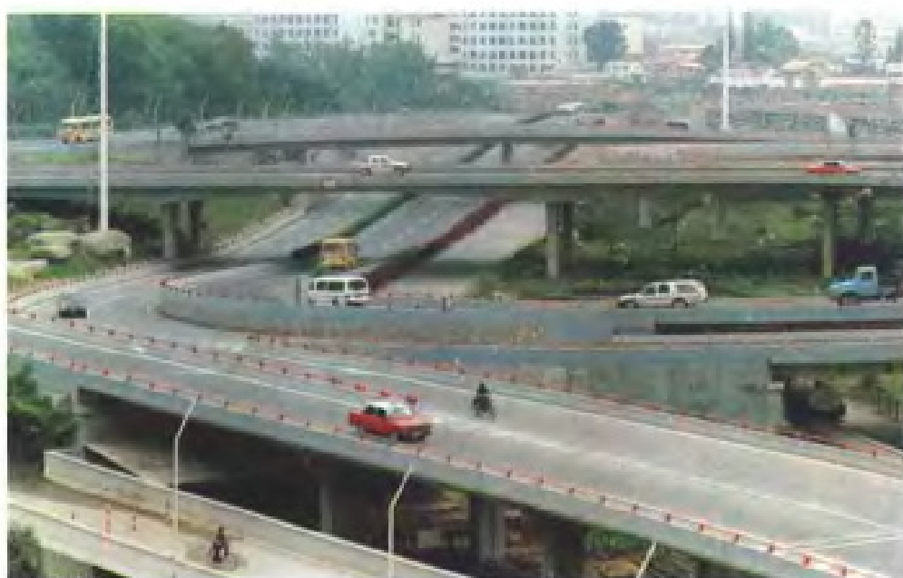
厦门石鼓山立交桥