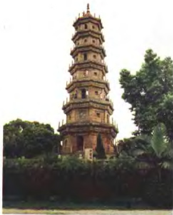
福州港自然导航标志——罗星塔