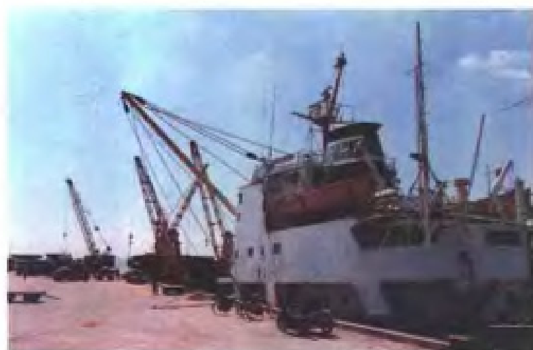
莆田秀屿港商业码头