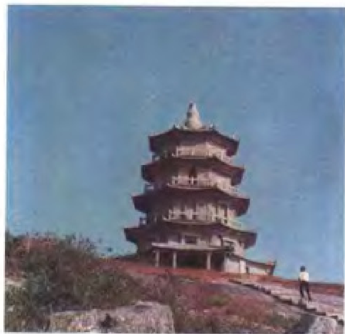
泉州石狮关锁塔(姑嫂塔)