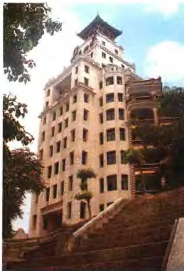
▲ 集美学村南薰楼(省内第一幢高层建筑, 建于20世纪50年代)