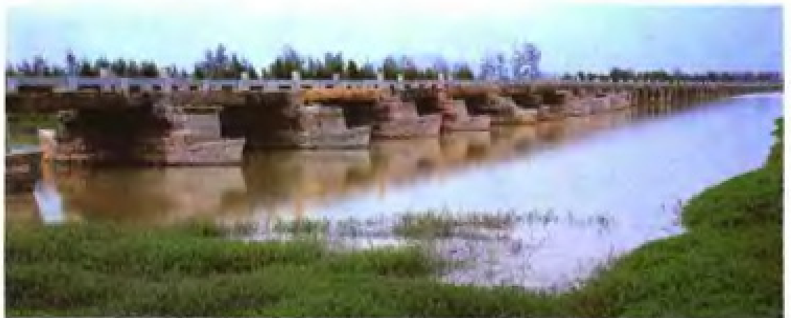
▲ 晋江安平桥（俗称五里桥）