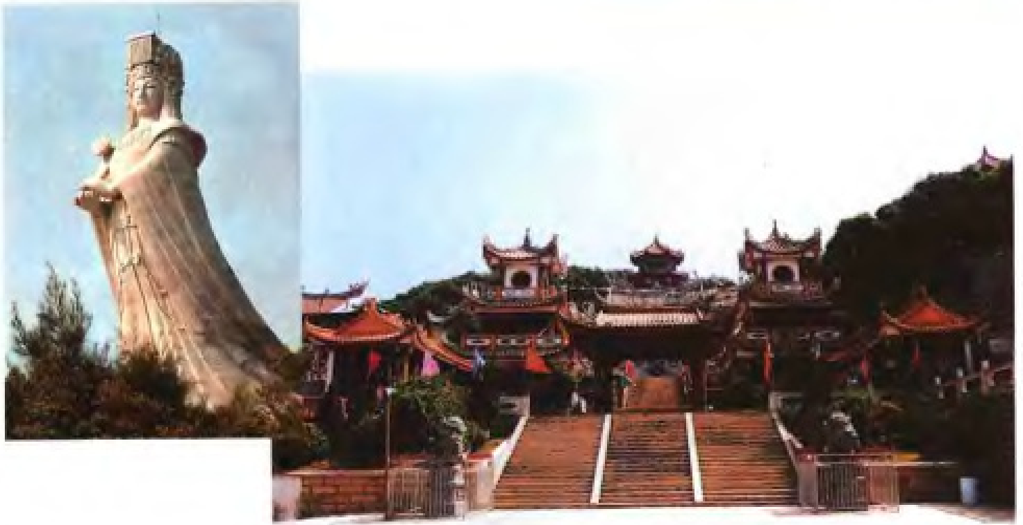
▲ 莆田湄洲湾妈祖庙