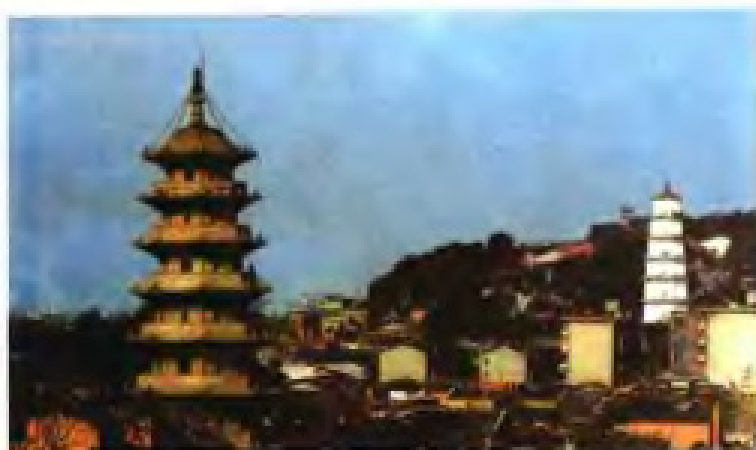
◀ 福州白塔（报恩定光多宝塔）乌塔（崇妙保圣坚牢塔）