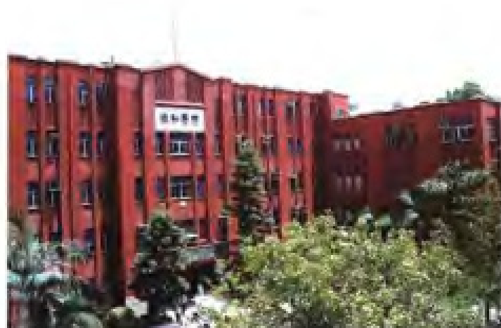
▲福州协和医院病房大楼（1938年建成）