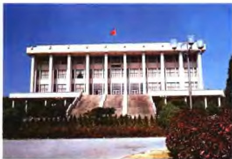
▲ 华侨大学陈嘉庚纪念堂