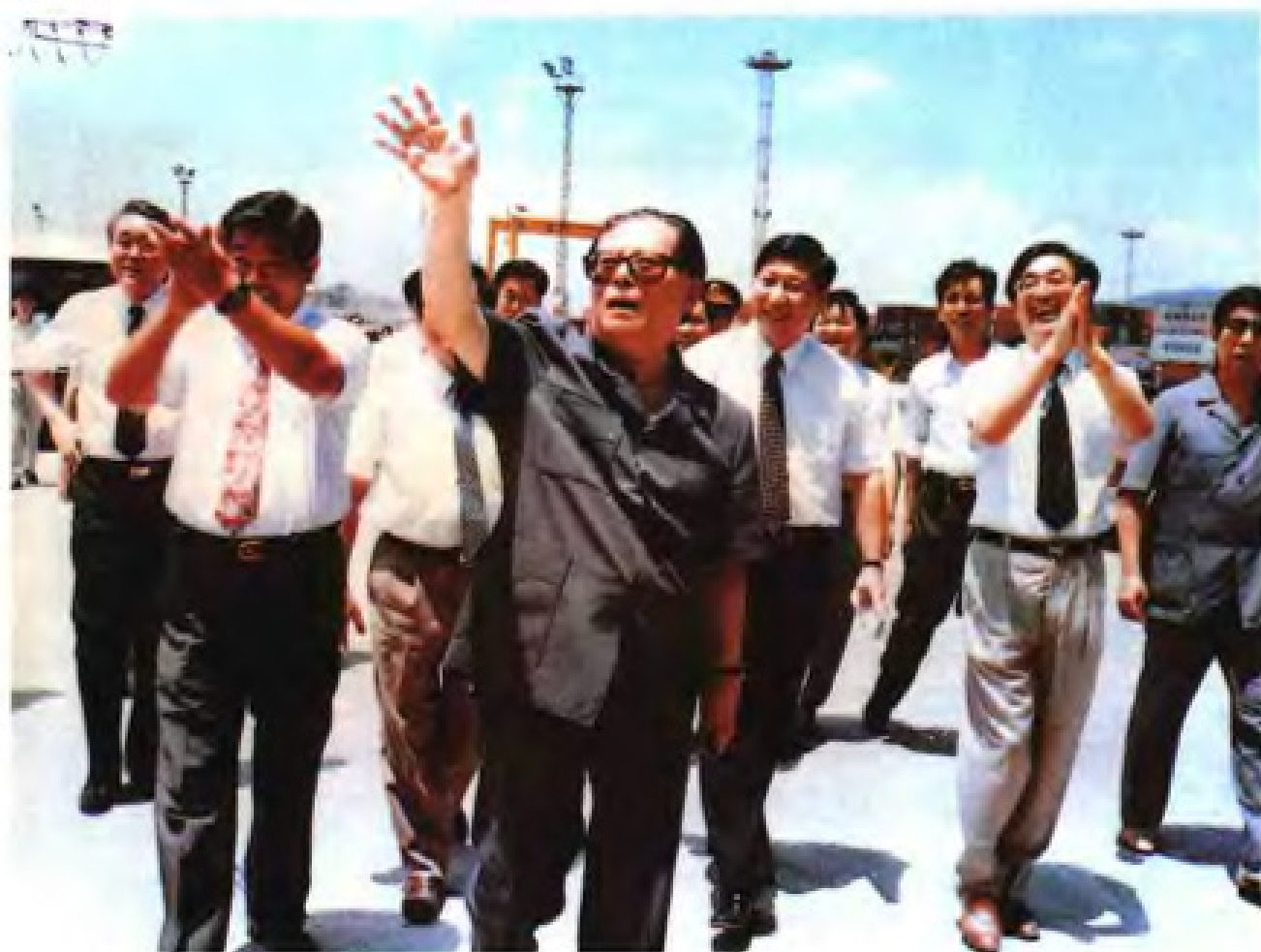
▲ 1994年6月，中共中央总书记江泽民视察福州港区建设工地