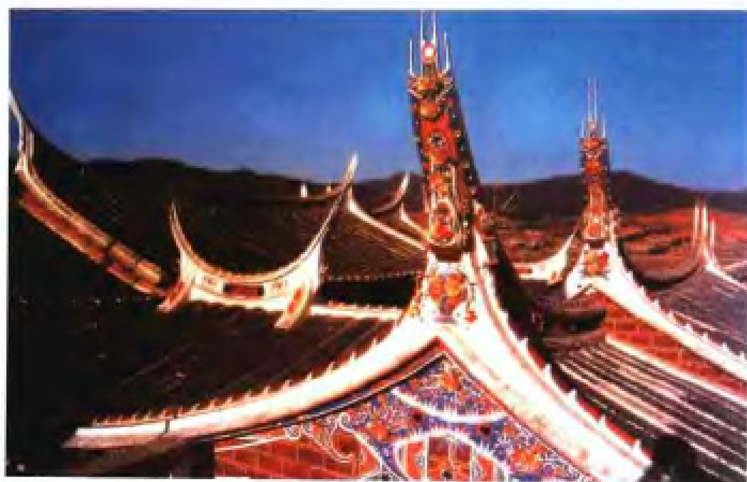
◀ 杨阿苗宅屋顶雕塑