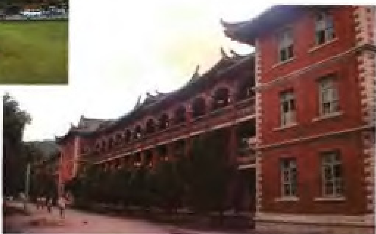
▶ 厦门大学芙蓉苑（建于20世纪20年代）