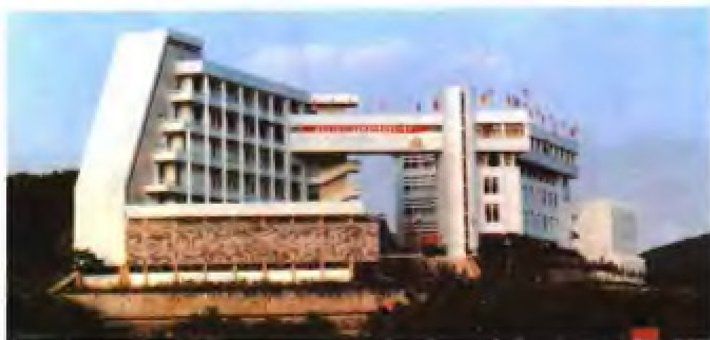
▲ 厦门大学艺术教育学院