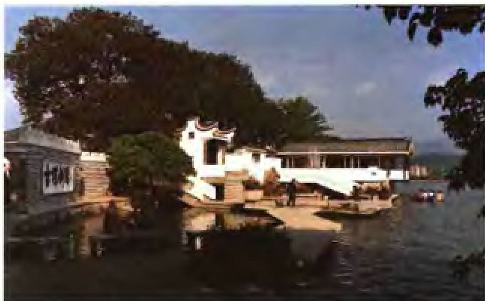
▶ 福州西湖古堞斜阳景点工程 (1986年获省优秀设计一等奖)