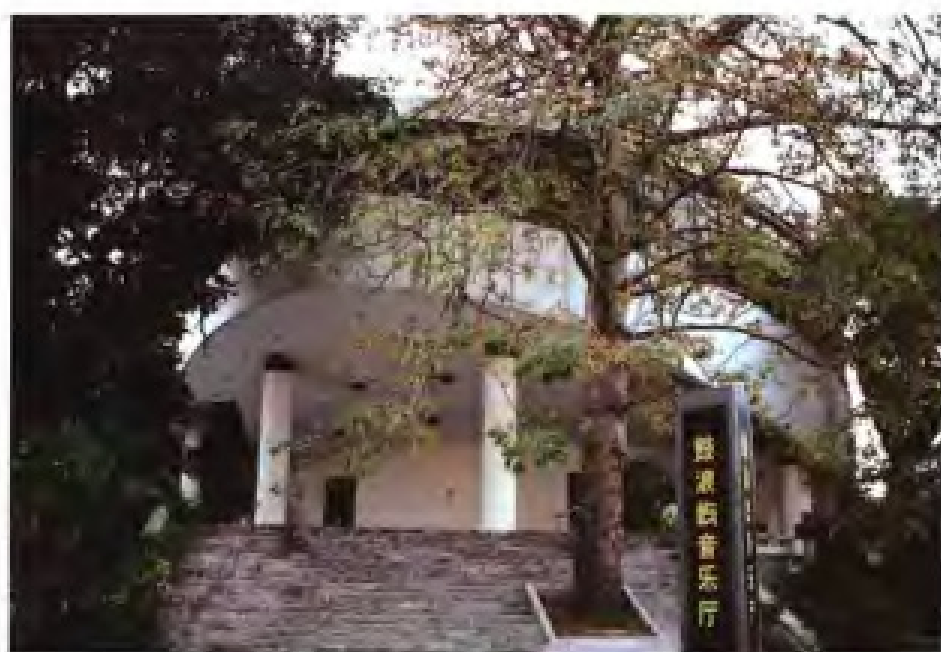
◀厦门鼓浪屿音乐厅