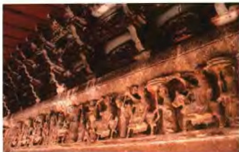
▲ 泰宁尚书第门楼雕刻