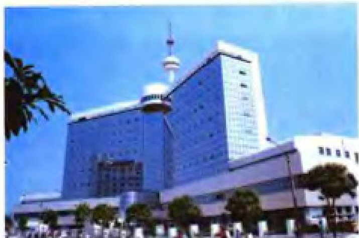
▲福建省广播电视中心大楼