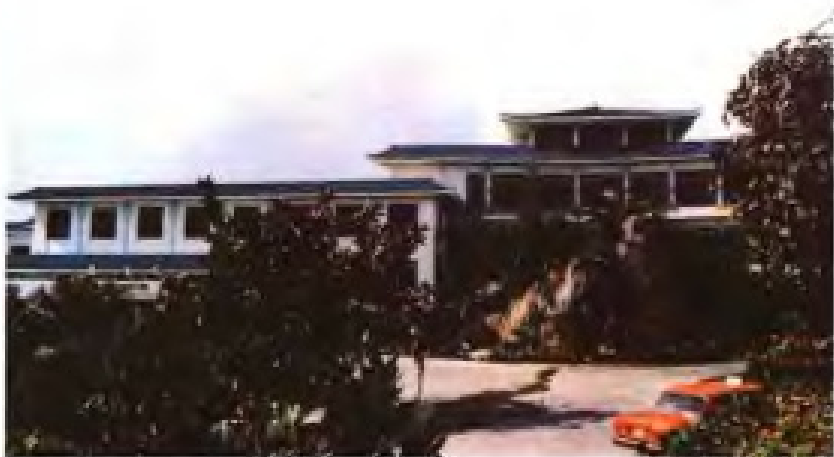
▲厦门悦华酒店（全省第一座五星级宾馆）