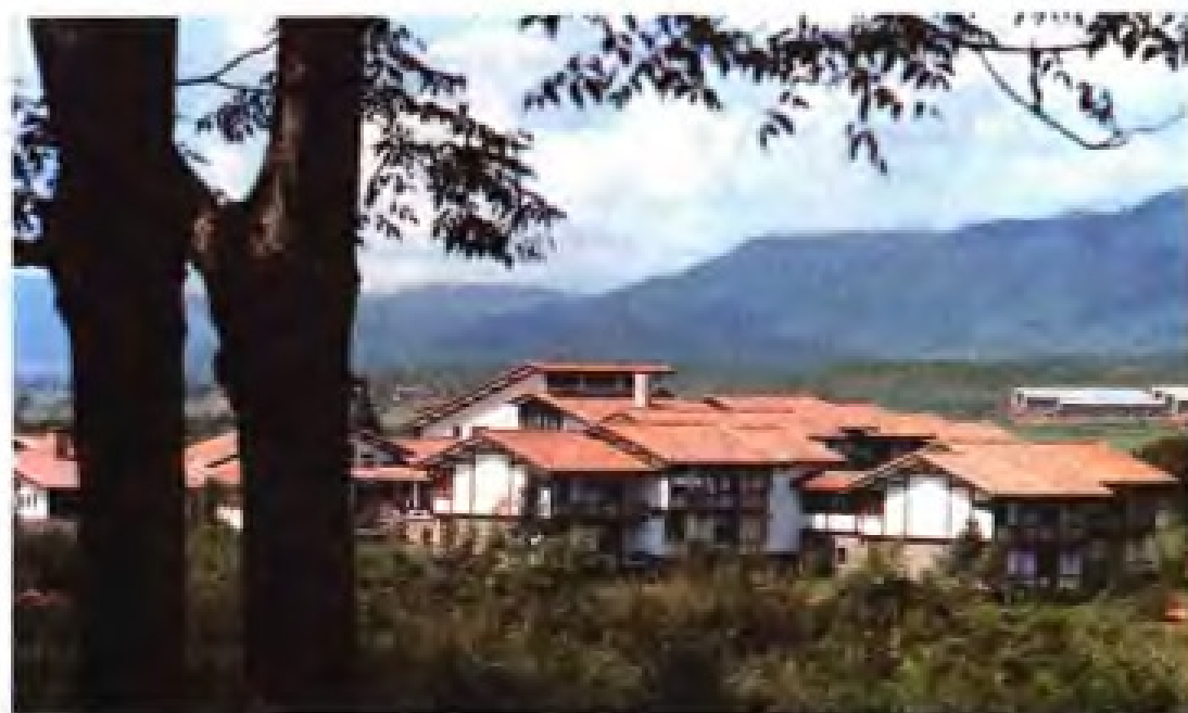
◀武夷山庄（1985年获全国优秀设计金质奖）