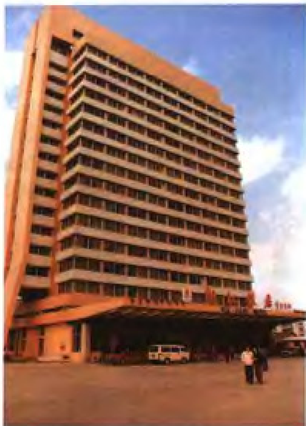
▲福州闽江饭店（1986年获省优秀工程设计二等奖）