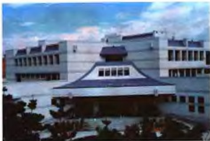
▲福建省画院综合楼（1992年被评为省优质工程，1993年获省优秀工程设计一等奖）