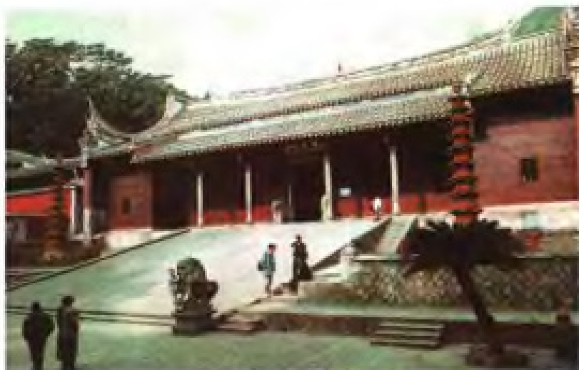
▶ 福州鼓山涌泉寺天王殿和千佛陶塔