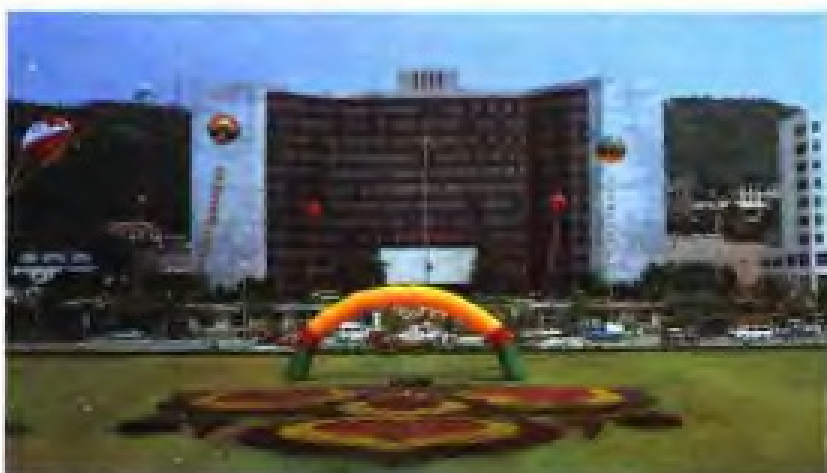
▲ 厦门市人民政府办公楼