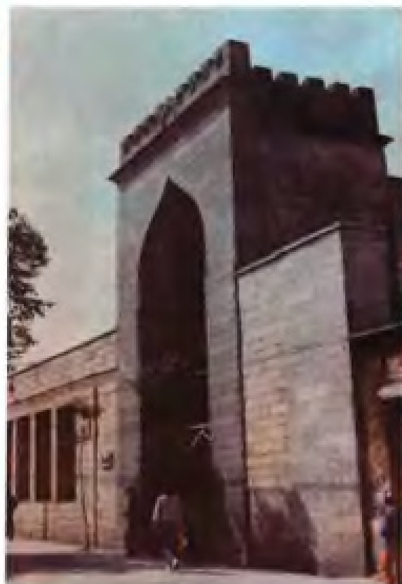
▲ 泉州艾苏哈卜清真寺