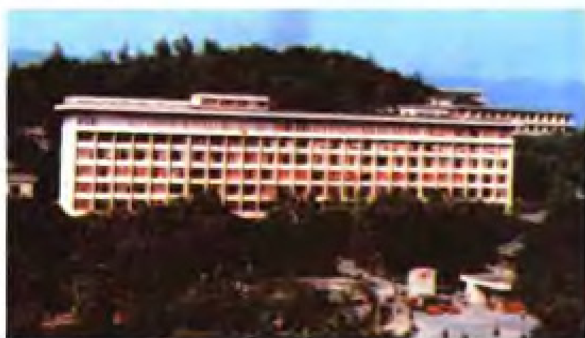
▲ 福建省人民政府办公楼