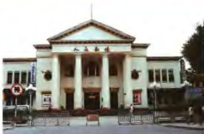
▲福建省人民剧场（1954年建成）