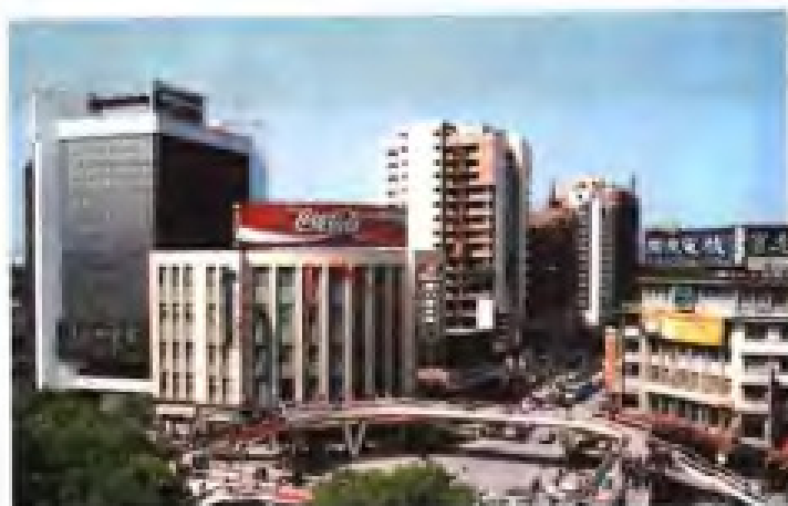
▲福州东街口百货大楼（旧楼建于1956年，新楼建于1985年）