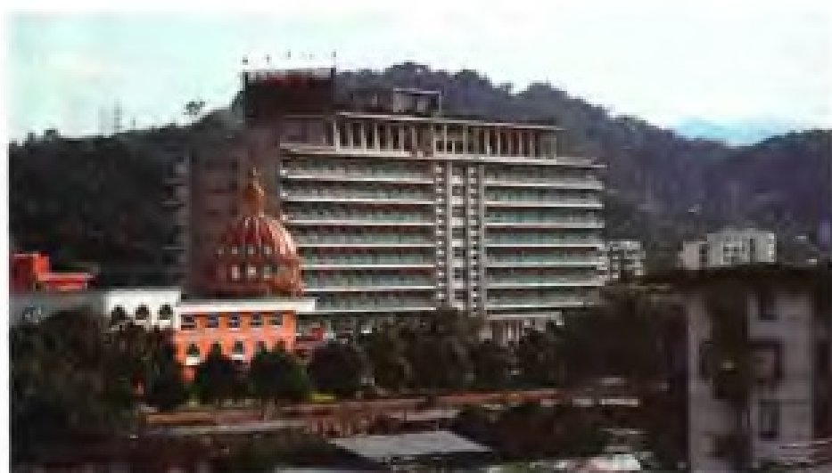
◀福州梅峰宾馆（建于1975年）