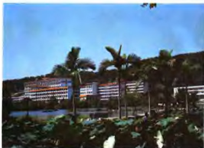
▲ 福建农学院教学区