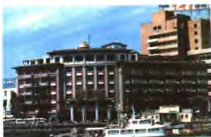
▲厦门鹭江宾馆（1960年建成，1984年改建）