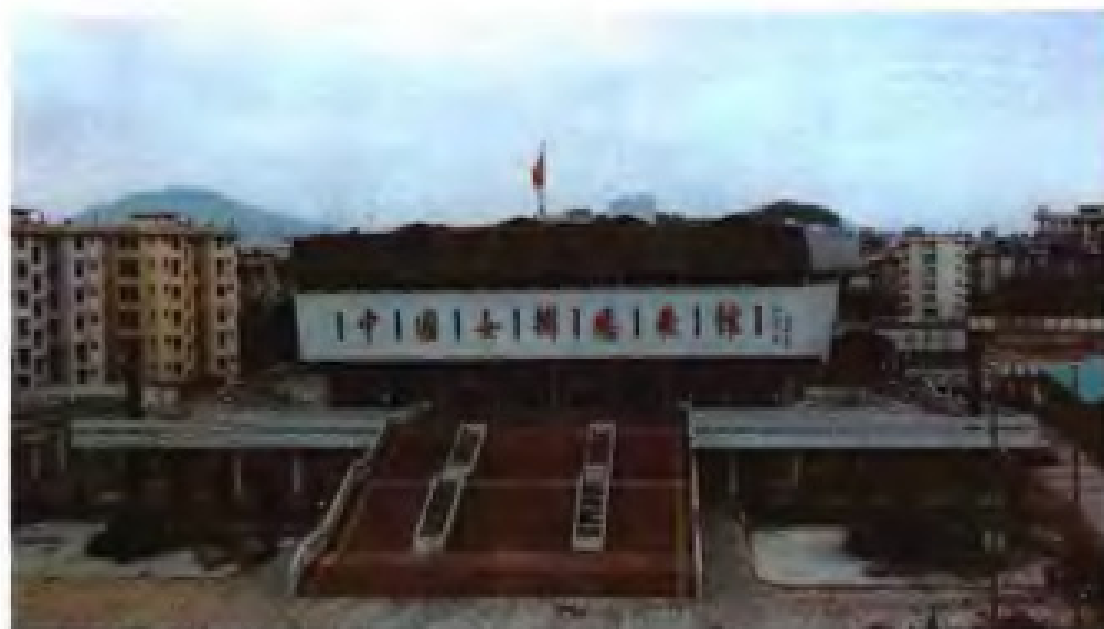
◀漳州体育训练基地——中国女排腾飞馆