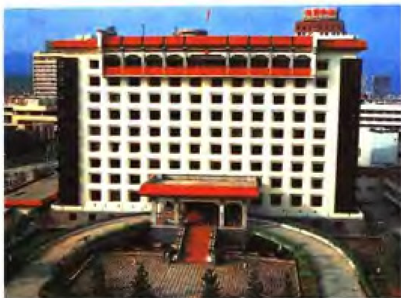
◀ 福建省人民代表大会常务委员会办公楼