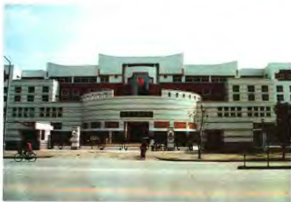
◀福建省图书馆新馆