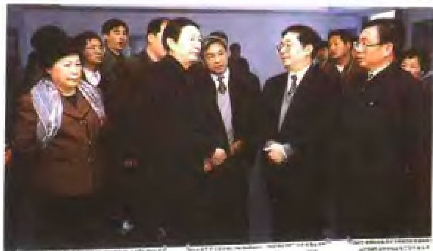
1999年，国务院总理朱镕基视察厦门 国际会展中心建设工程