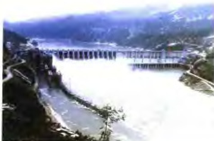
福建省“八五”计划重点建设项目之一——水口电站