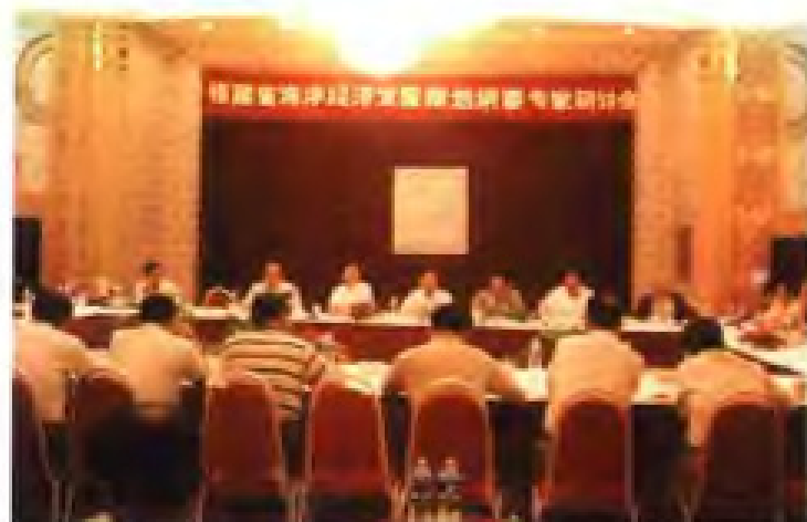
1996年8月，召开福建省海洋经济发展 规划纲要专家研讨会