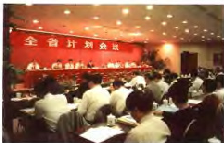
1997年12月，召开全省计划会议