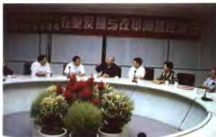
1995年12月，国家计委在福州召开 农业发展与改革问题座谈会