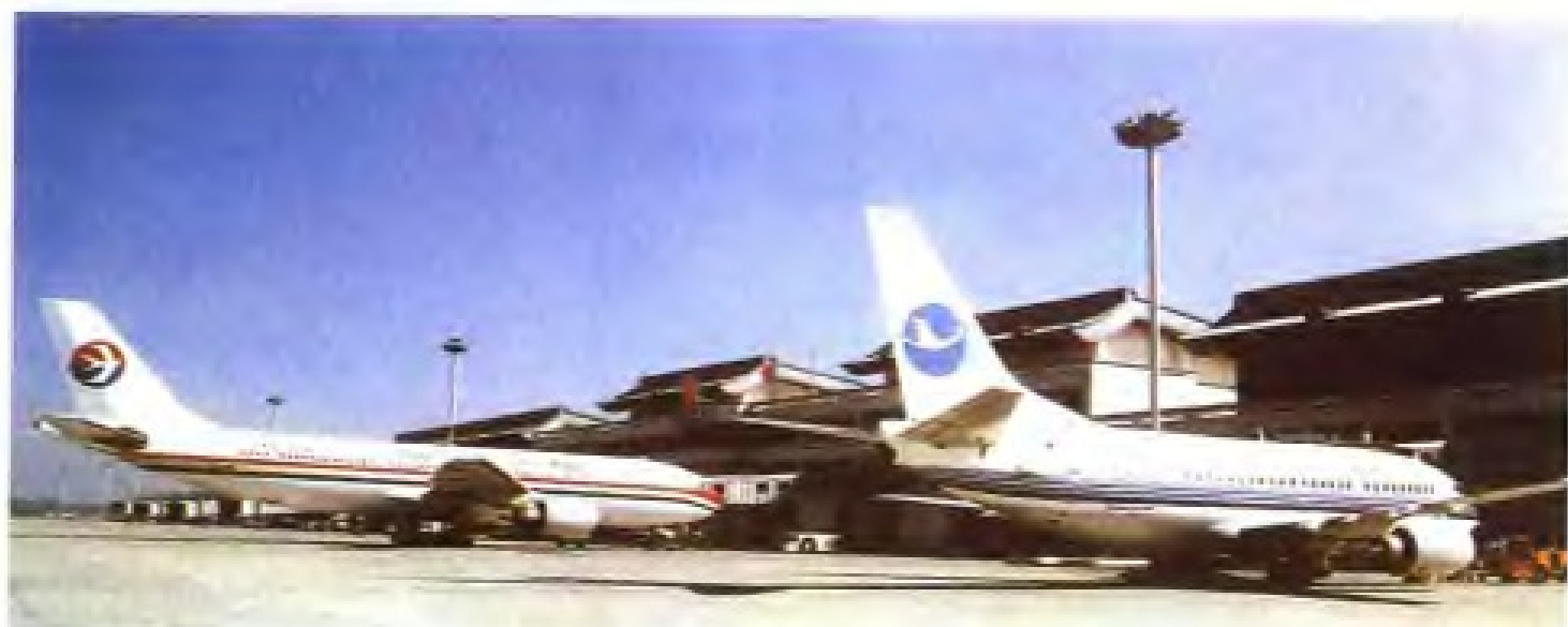
福建省“八五”计划重点建设项目之一——福州长乐国际机场