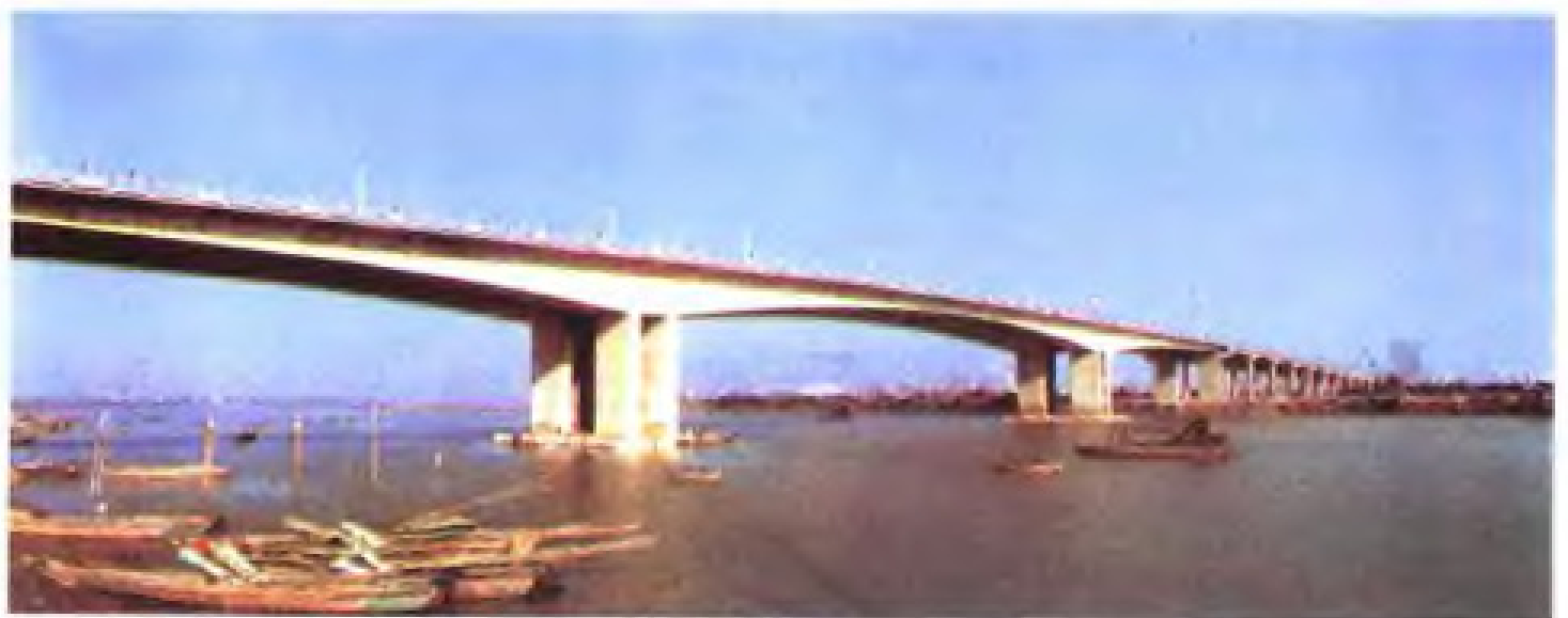
福建省“七五”计划重点建设项目之一——泉州刺桐大桥