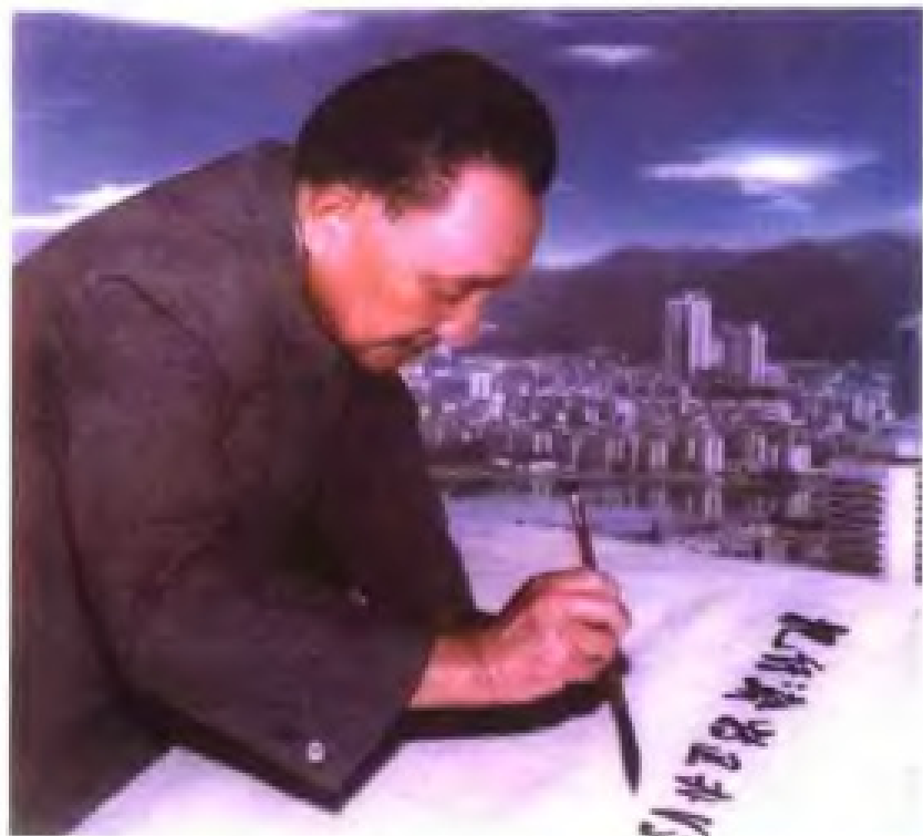
1984年，邓小平同志视察厦门经济特区