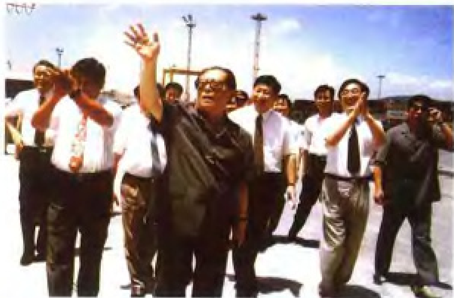
1994年，中共中央总书记江泽民 视察福州经济技术开发区