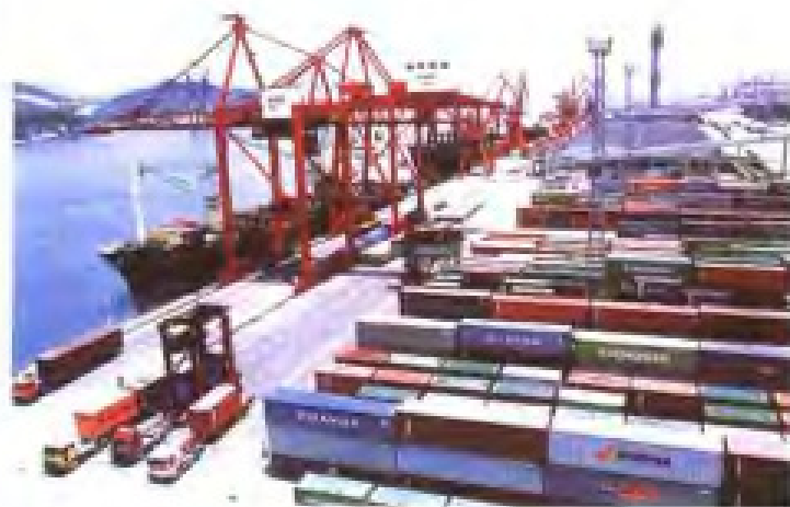
福建省“七五”计划重点建设项目之一——厦门东渡港