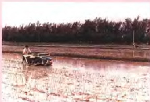
福清东阁华侨农场机械插秧