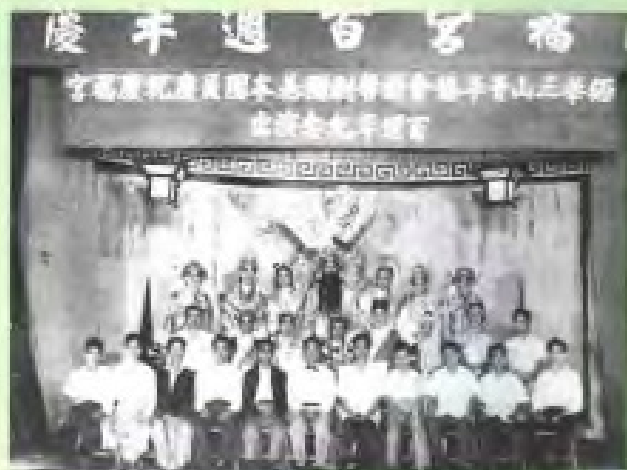
緬甸仰光慶福宮百年慶典