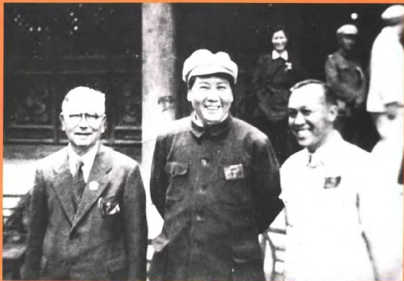
毛泽东主席与陈嘉庚、庄明理合影（1949）