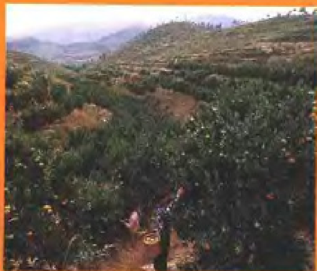
龙海双第华侨农场柑桔园