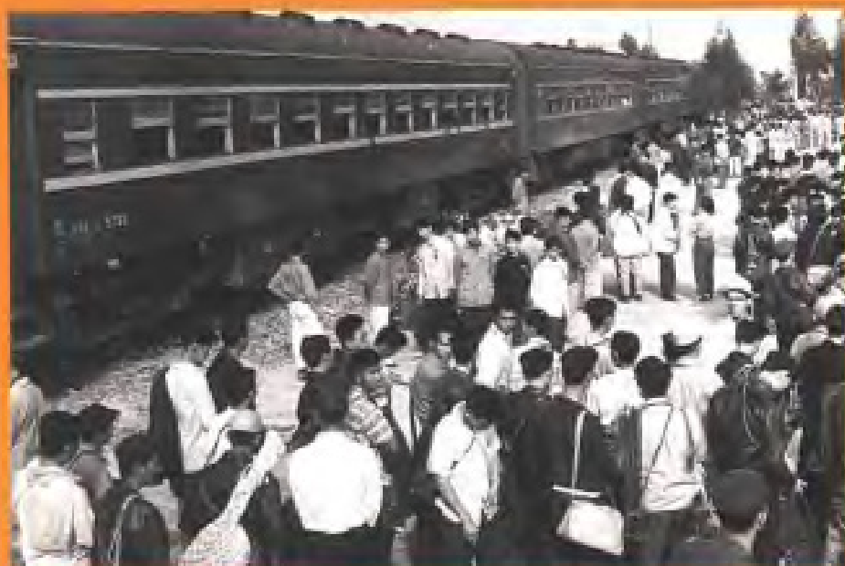
印尼归侨学生抵达集美 (1960年)