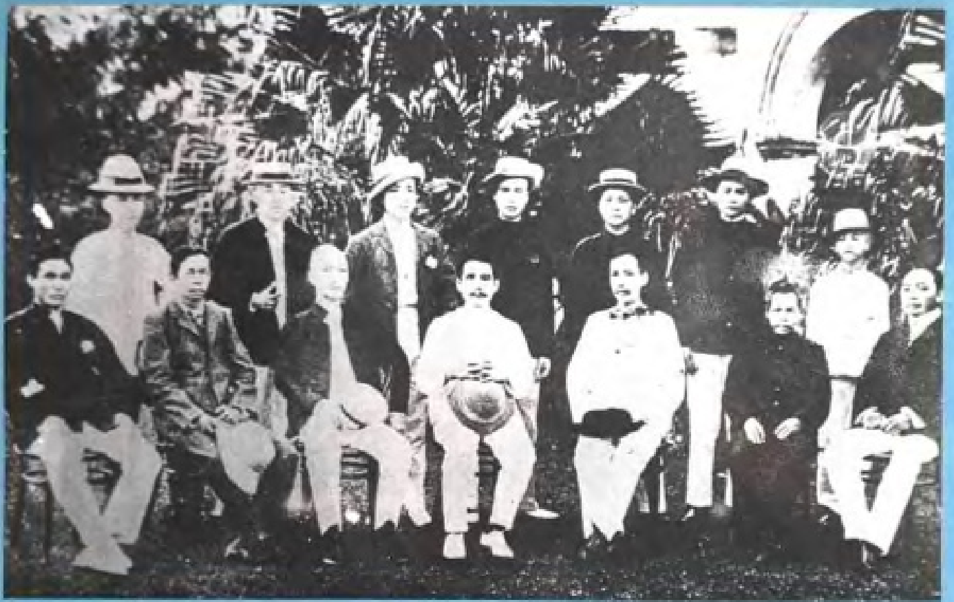
孙中山与陈楚楠等人合影（1906）