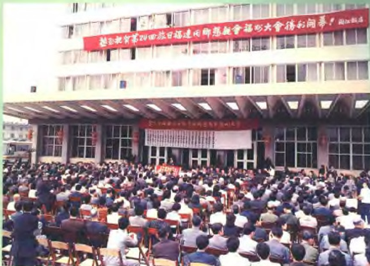
旅日福建同乡 恳亲会