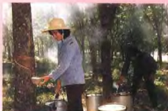
诏安建设农场建华作业区橡胶园