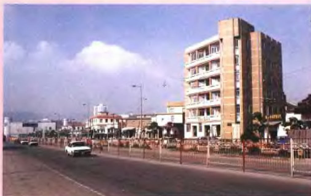
厦门华侨企业公司