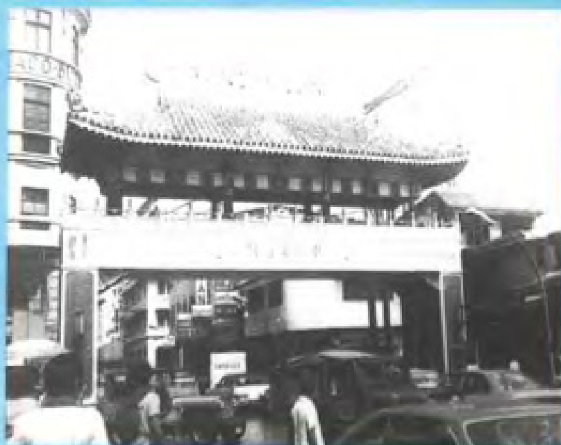
菲律賓中菲友誼門