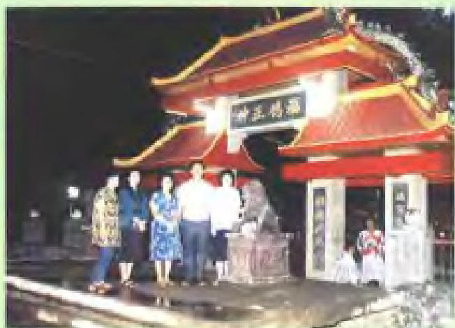
印尼三宝瓏的三保宮