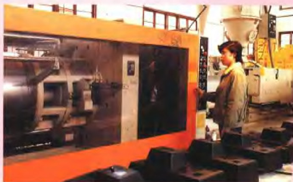
福州华侨塑料厂 工程塑料车间