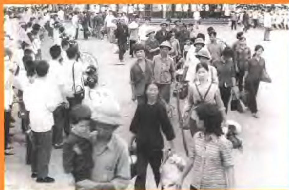
越南归侨到达福州(1978年)