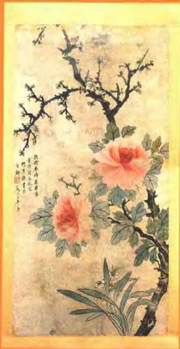
红梅.牡丹——何香凝作