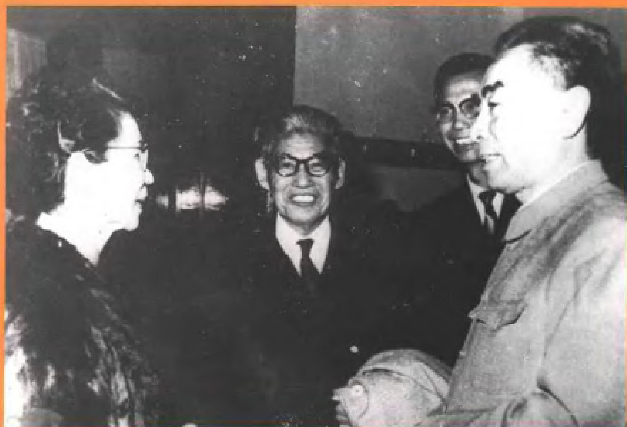
周恩来总理 会见李光前 夫妇 (1965)