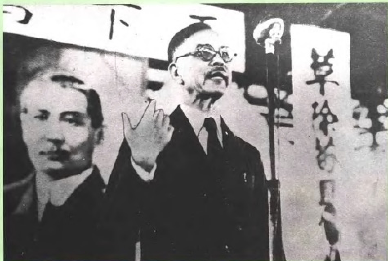
陈嘉庚在抗日筹赈大会上演说