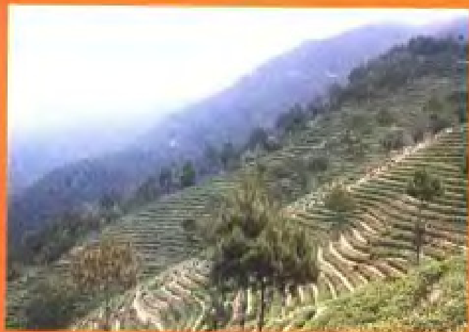
永春北礮茶果场海龙坑茶园