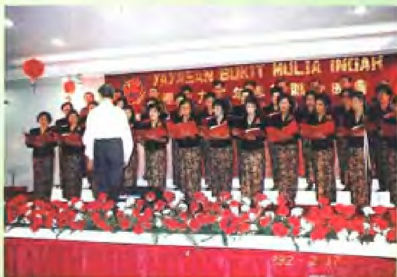
印尼雅加达吉祥山基金会联欢会