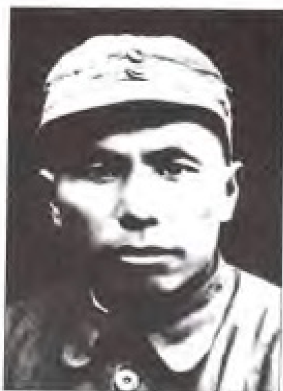
张鼎丞 1937年10月至1938年2月，任中共闽粤赣边省委书记