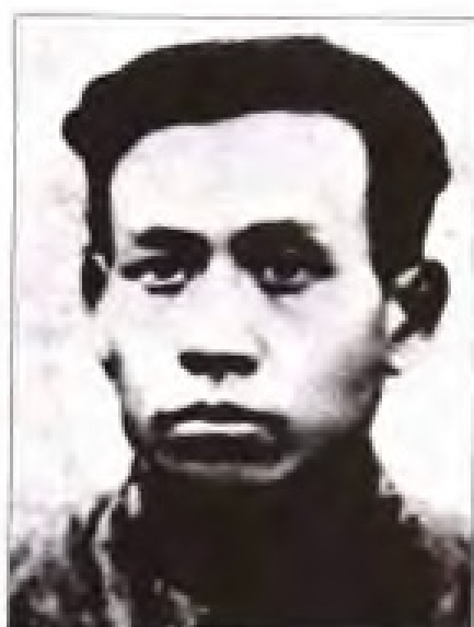
刘少奇 1934年7月至10月，任中共福建省委书记