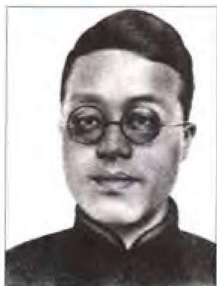
陈寿昌 1933年2月至6月，任中共福建省委书记