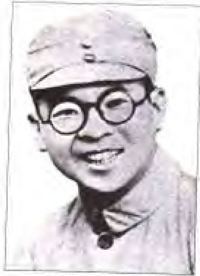
陈明 1927年12月至1928年2月,任中共福建临时省委书记