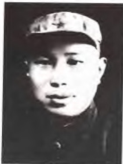
黄道 1936年6月至1938年1月，任中共闽赣省委书记