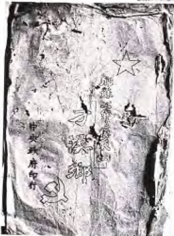
1933年11月，毛泽东第三次 到才溪乡，写下了《才溪乡调查》