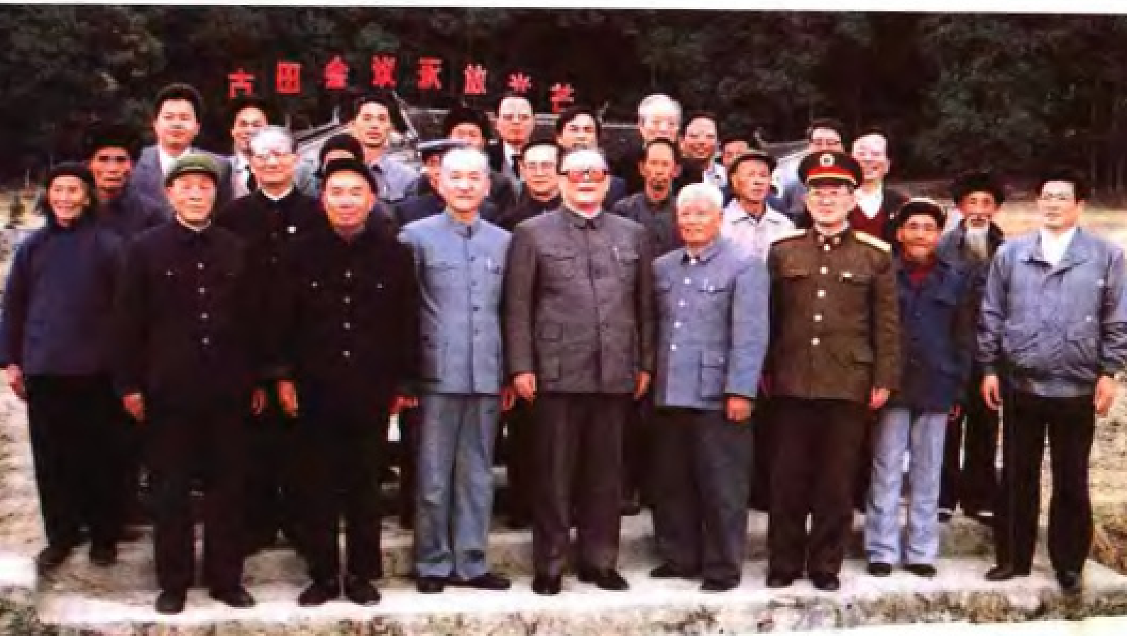
1989年12月，中共中央总书记江泽民在福建古田会议纪念馆前与老区群众代表合影