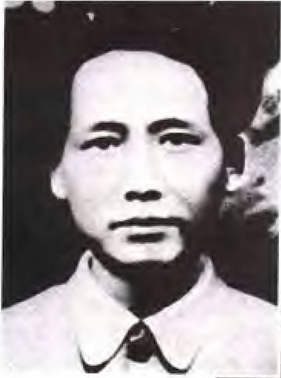
毛泽东率领红四军进军闽西时， 任红四军前委书记、党代表