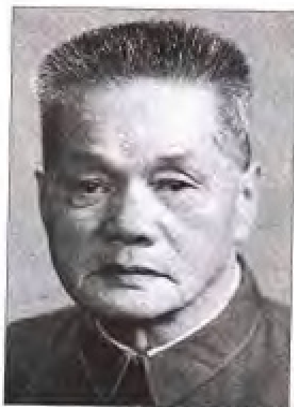
魏金水 1948年8月至1949年9月，任中共闽粤赣边区委书记