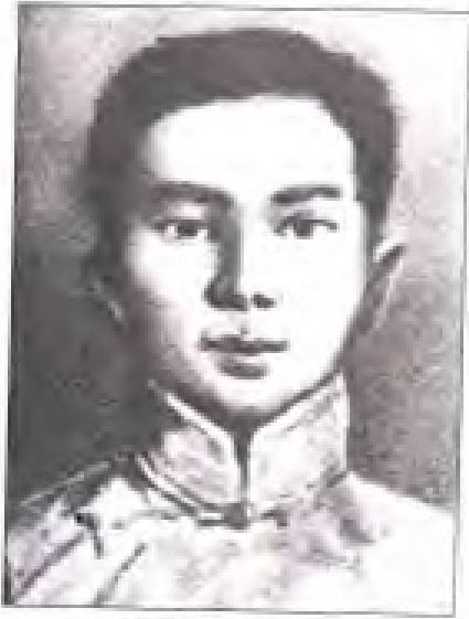
方尔瀚 1926年4月至6月,任中共福州地方执行委员会书记