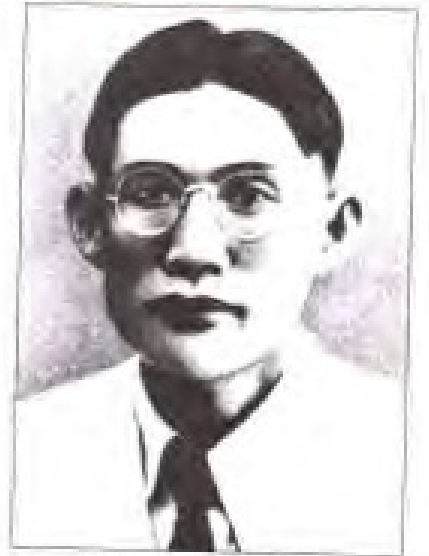
罗明 1928年2月至8月,任中共福建临时省委书记; 1929年5月至8月, 1929年12月至1931年3月,任中共福建省委书记; 1931年12月至1932年3月,任中共闽粤赣省委书记