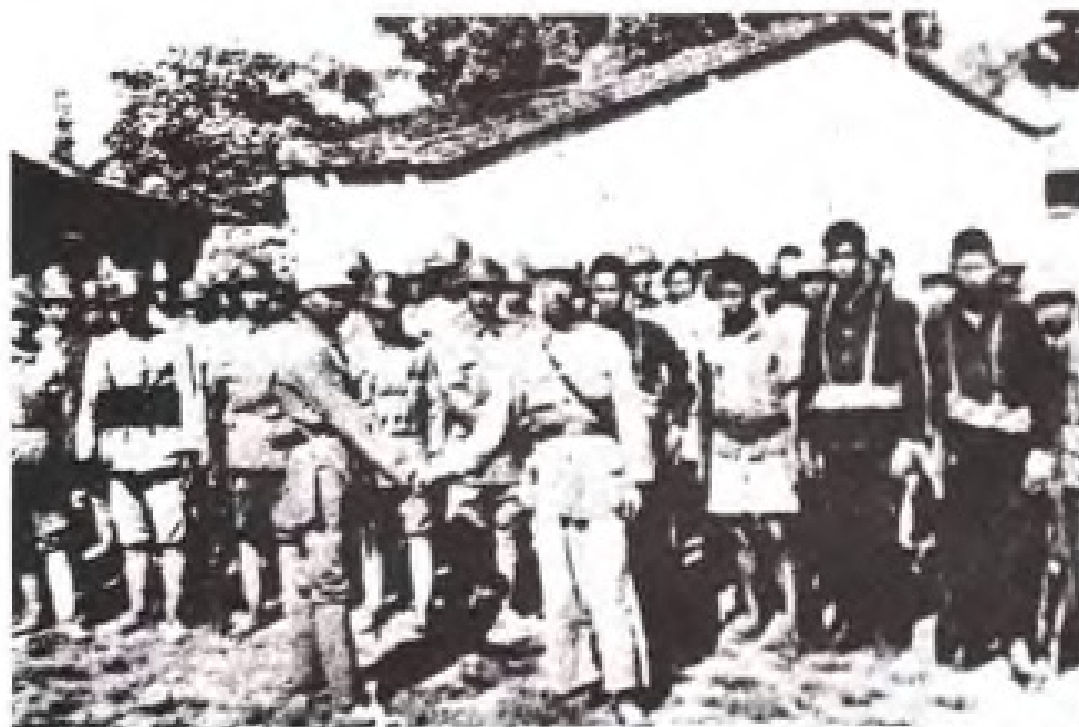
南下大军与福建游击队会师