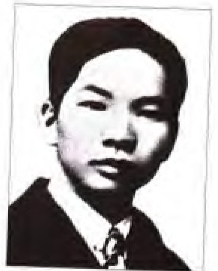
王海萍 1931年1月至4月,任中共福建省委代理书记