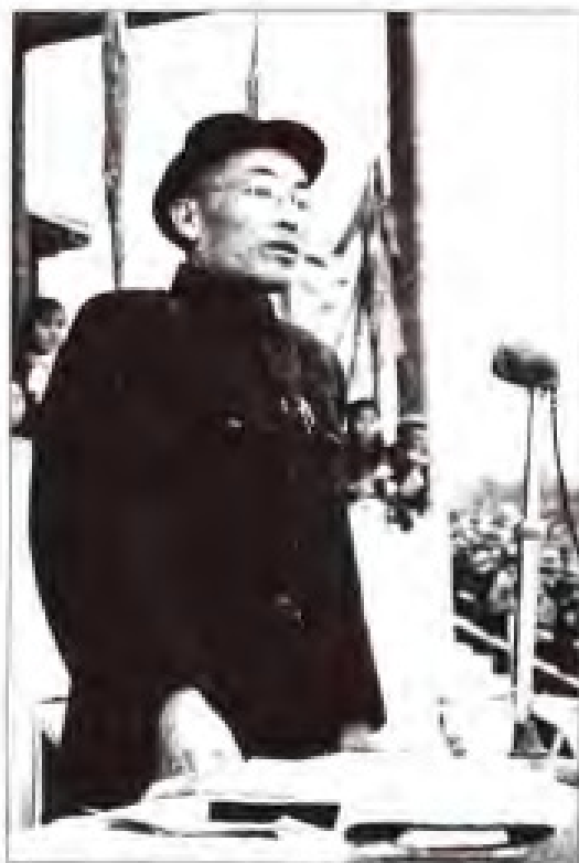
叶飞 1954年10月至1955年4月，任中共福建省委第一书记；1955年4月至1956年5月，任中共福建省委书记；1956年5月至1968年8月，任中共福建省委第一书记