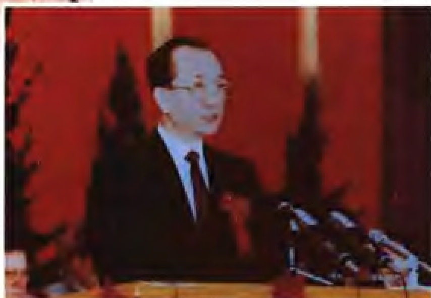
陈光毅 1986年3月至1993年12月，任中共福建省委书记