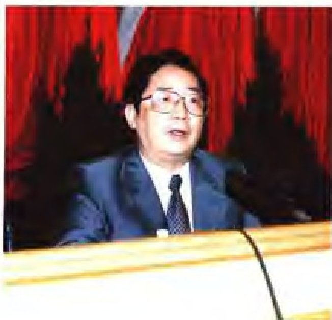
陈明义 1996年10月起，任中共福建省委书记