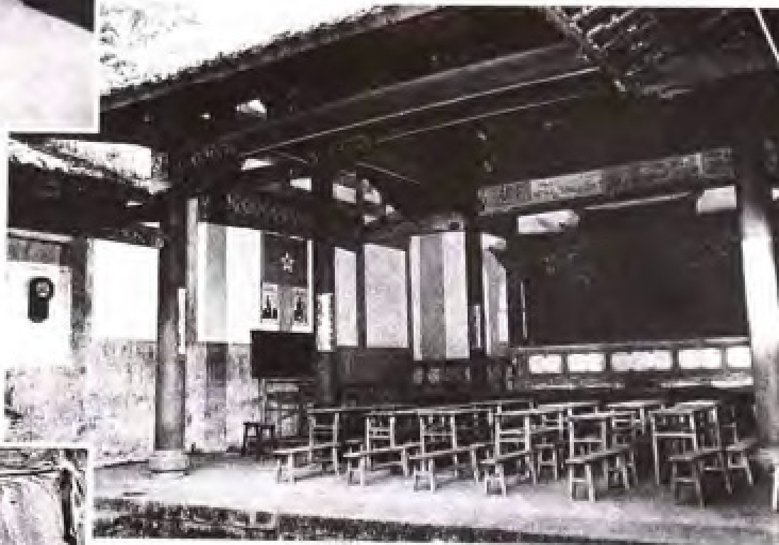
古田会议会场内景