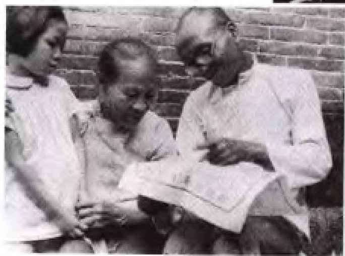
土改后农民分到土地证时的喜悦心情