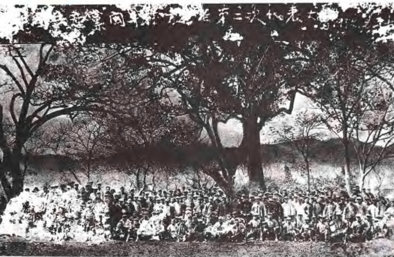
1932年3月，中共闽粤赣苏区第二次代表大会于长汀召开。图为全体代表合影