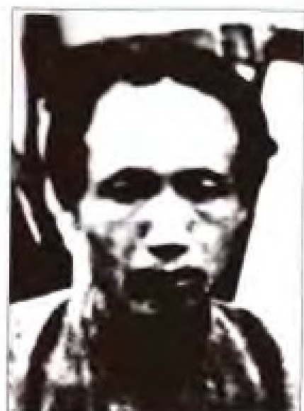
钟循仁 1935年1月至5月，任中共闽赣省委书记