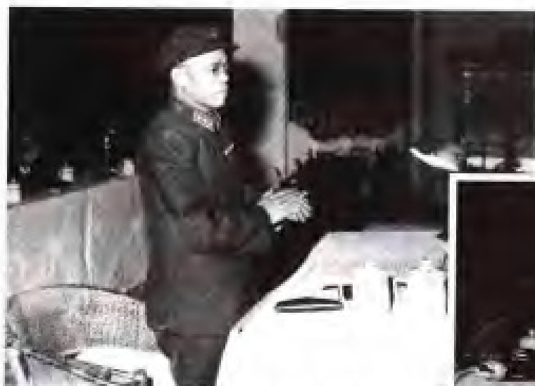
韩先楚 1968年8月至1973年12月，任福建省革命委员会主任；1970年4月至1971年3月，任中共福建省革命委员会核心领导小组组长；1971年4月至1973年12月，任中共福建省委第一书记