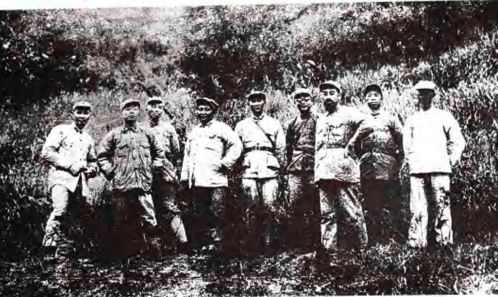
1933年11月，第五次反“围剿”期间，周恩来与部分红军指挥员于建宁前线合影(左起叶剑英、杨尚昆、彭德怀、刘伯坚、张纯清、李克农、周恩来、滕代远、袁国平)