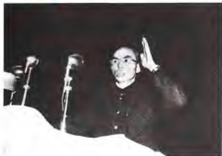
张鼎丞 1949年6月至1953年7月，任中共福建省委书记；1953年7月至1954年10月，任中共福建省委第一书记