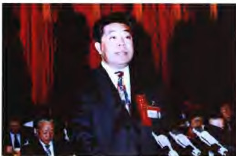
贾庆林 1993年12月至1996年10月，任中共福建省委书记