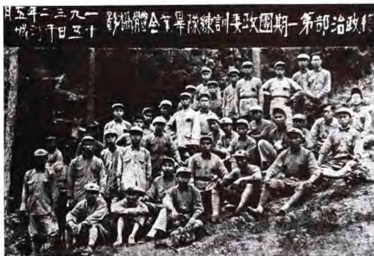
1932年5月，朱德与红军总政治部第一期团政委训练队全体队员于长汀合影(第二排右起第四人为朱德)