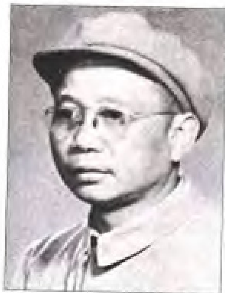
曾镜冰 1938年6月至1947年1月，任中共福建省委书记；1947年1月至1949年8月，任中共闽浙赣省委(区委)书记