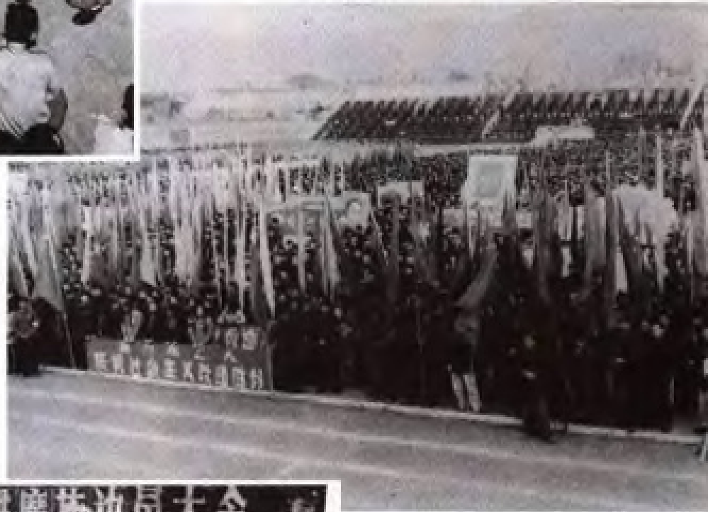
庆祝社会主义改造胜利