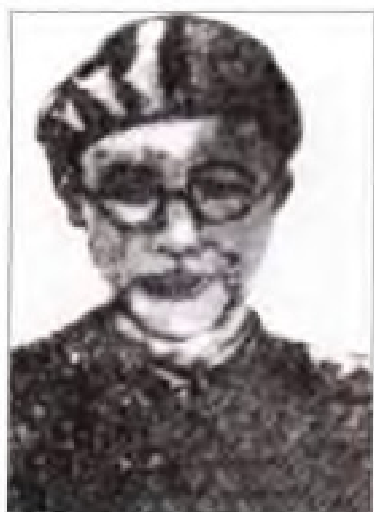
顾作霖 1933年4月至1934年1月，任中共闽赣省委书记