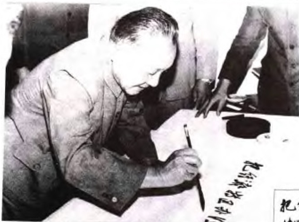
1984年2月，邓小平视察厦门经济特区时挥笔题词：“把经济特区办得更快些更好些”