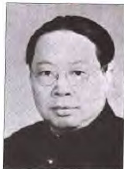
方方 1938年2月至1940年9月，任中共闽西南潮梅特委书记