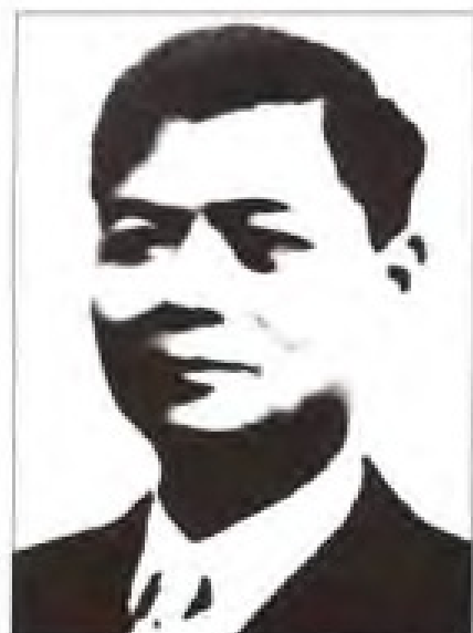
陈潭秋 1933年6月至1934年1月，任中共福建省委书记