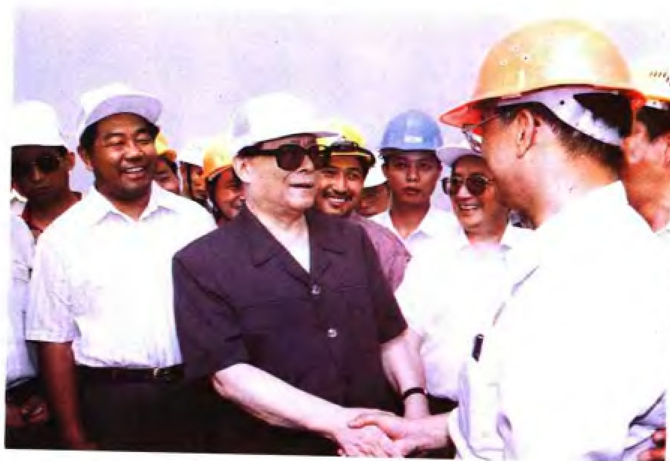
1994年6月，中共中央总书记江泽民视察厦门海沧嵩屿电厂