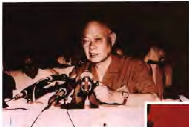
项南 1980年12月至1982年2月，任中共福建省常务书记；1982年2月至1985年6月，任中共福建省委第一书记；1985年7月至1986年3月，任中共福建省委书记