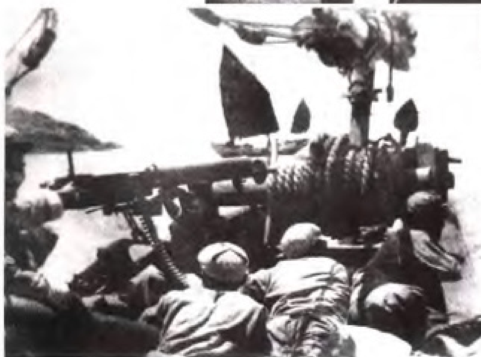
解放厦门——渡海作战