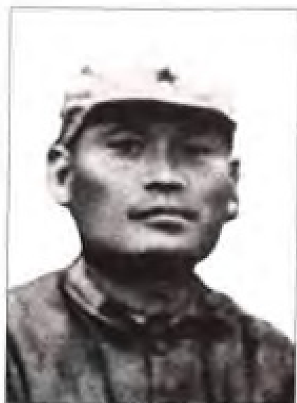
邵式平 1934年1月至8月，任中共闽赣省委书记