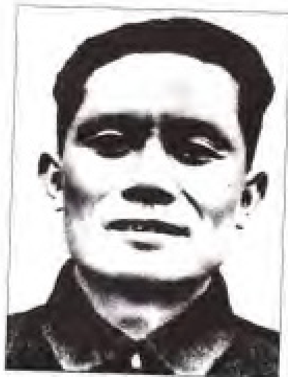
邓发 1930年12月至1931年5月,任中共闽粤赣特区委书记; 1931年5月至7月,任中共闽粤赣省委书记