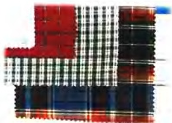
◀龙岩色织厂部分产品