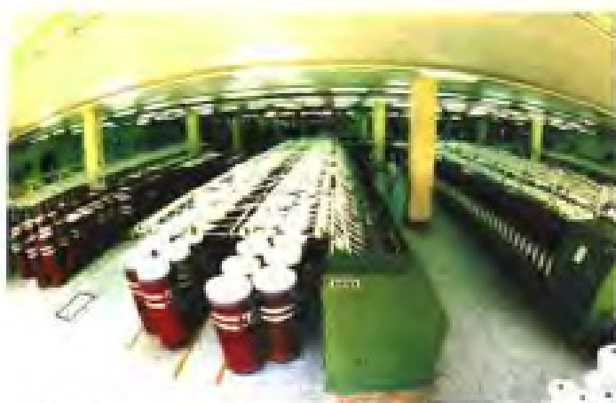
▲福州棉纺织印染厂纺纱生产线