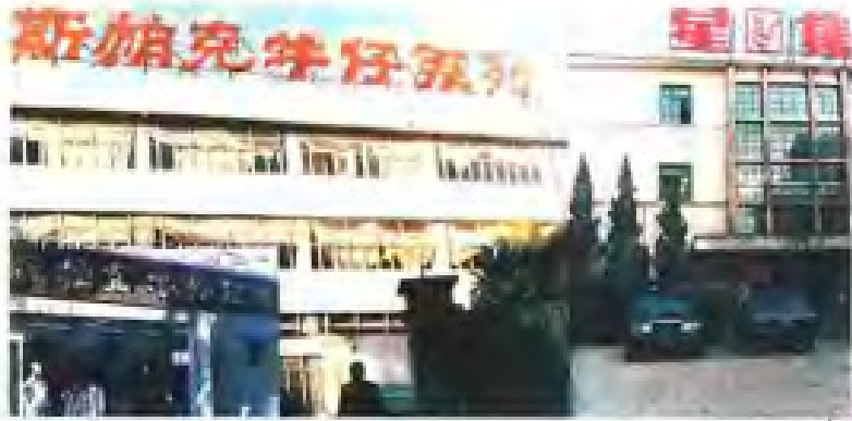
◀ 厦门星集制衣有限公司