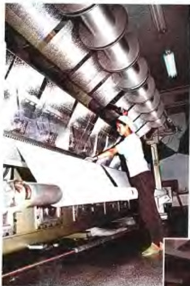
▲南平针织厂针织经编车间