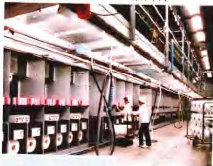
▼ 福建化纤化工厂涤纶分厂前纺车间