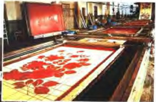
▲漳州毛纺织印染总厂印花机