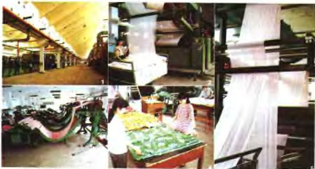
▶厦门印染厂生产现场