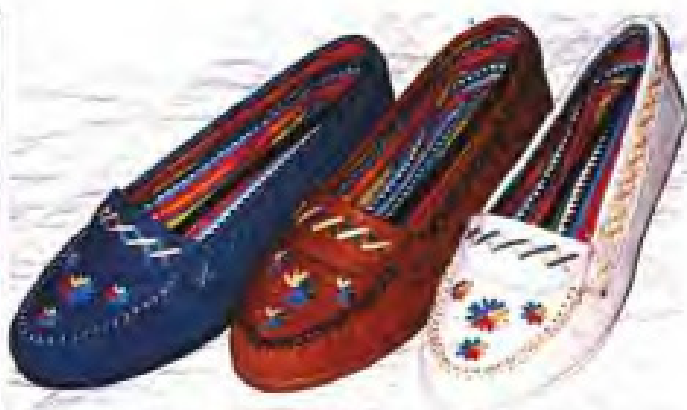
▲福州环球布鞋厂女休闲鞋产品