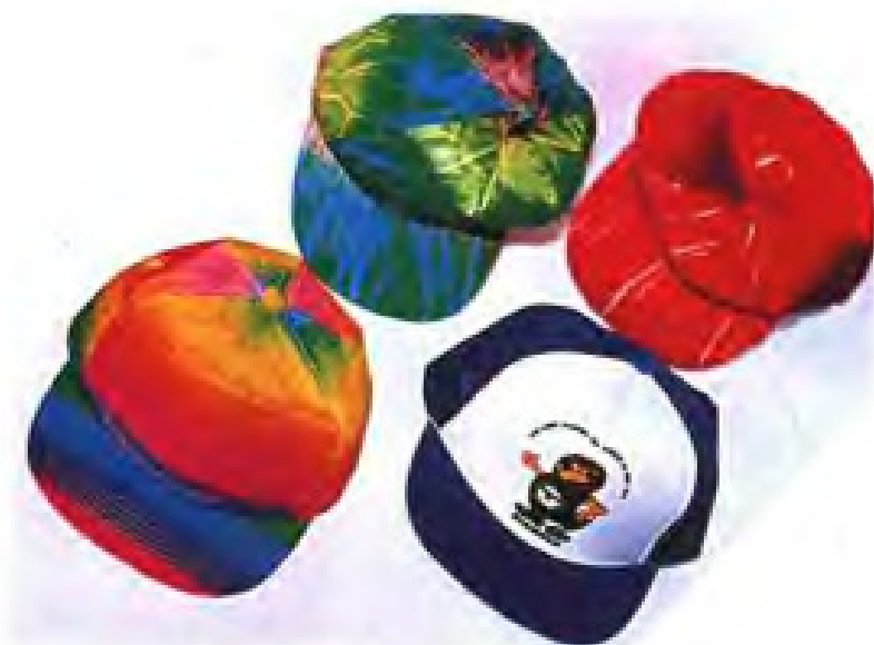
▲莆田县鞋帽厂出口时帽产品