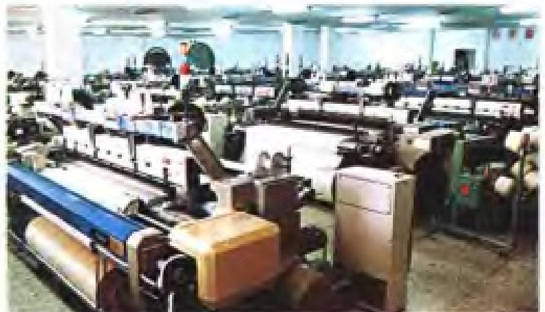
▶ 永安纺织厂剑杆织机