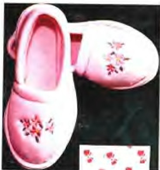
▲南平鞋帽厂省优室内拖鞋产品