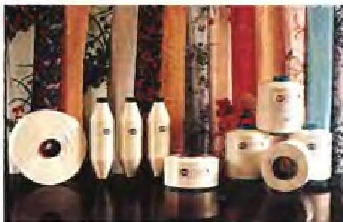
▼ 厦门华纶化纤有限公司部优系列产品