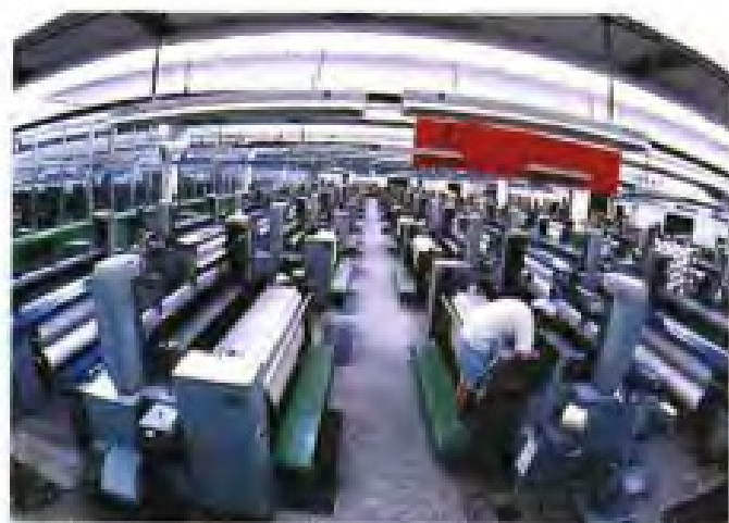
▲福州棉纺织印染厂喷气织机