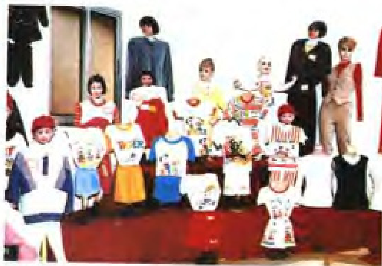
▲厦门针织厂针织童装系列产品