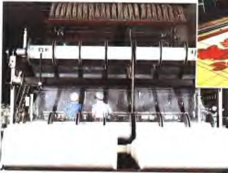
▼漳州毛纺织印染总厂经编机