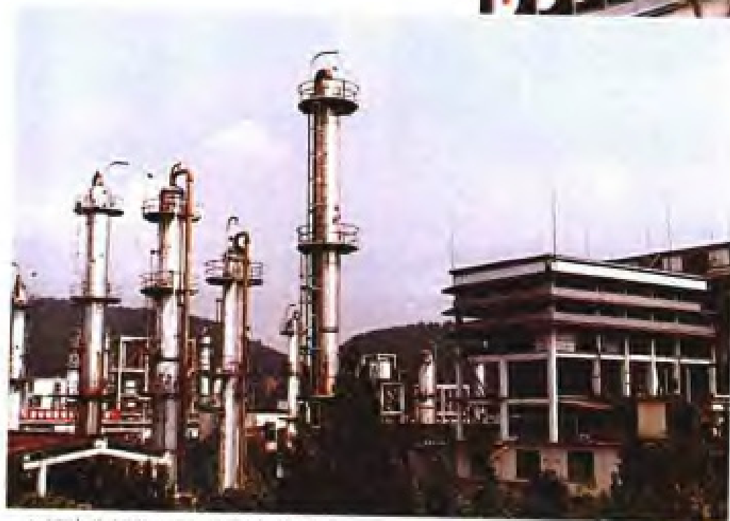
▲ 福建化纤化工厂聚乙烯醇车间