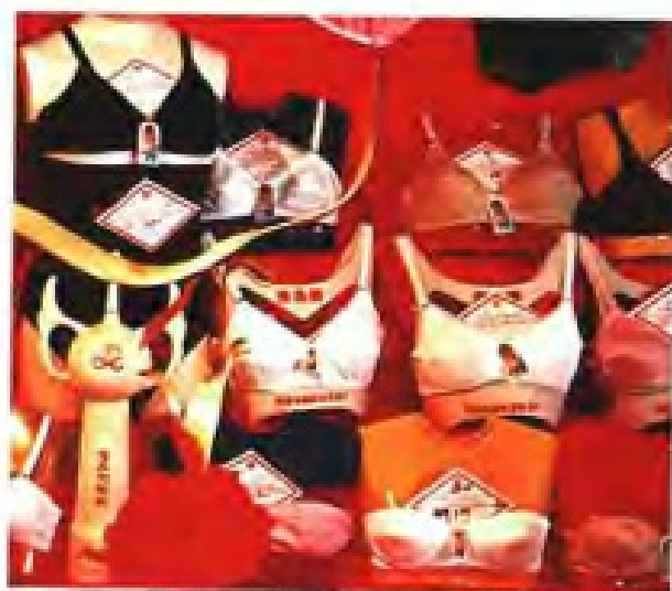
▲石狮市胸罩服装厂部分胸罩样品