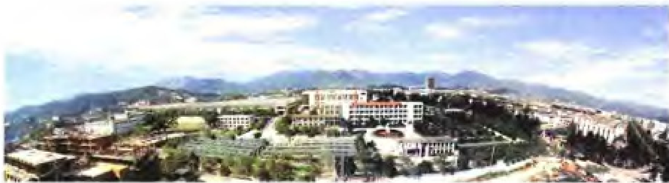
▲福州棉纺织印染厂厂景