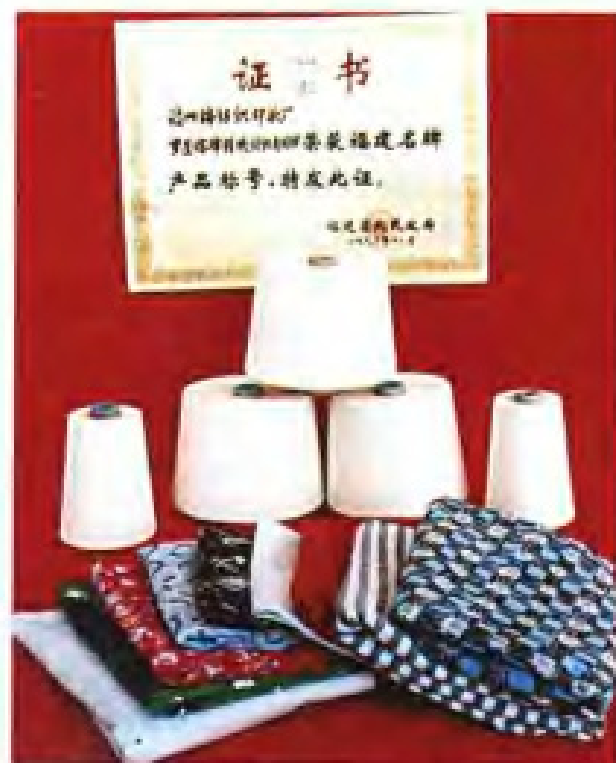
▲福州棉纺织印染厂部分产品