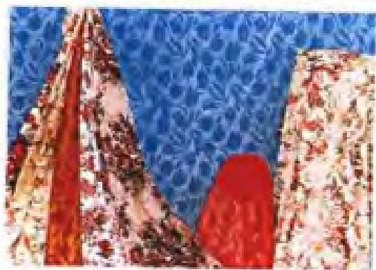
▲三明针织厂装饰布系列产品