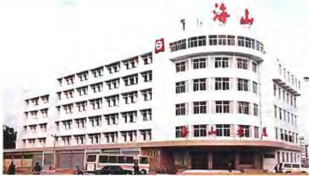
◀ 厦门海山实业有限公司大厦