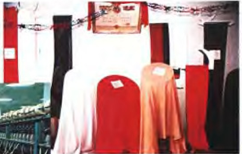
▼ 南平纺织厂PU革基布系列产品