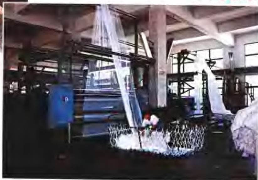
▶厦门华铃经编有限公司车间