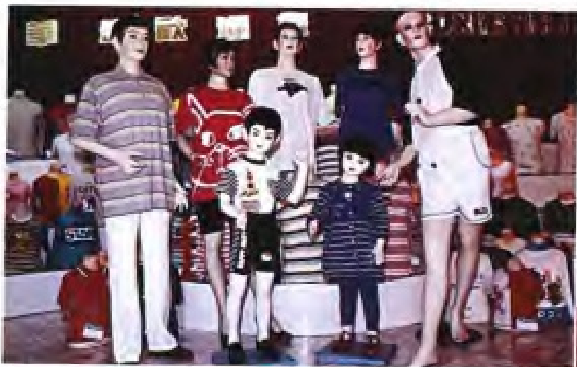
◀南平针织厂针织运动服装系列产品