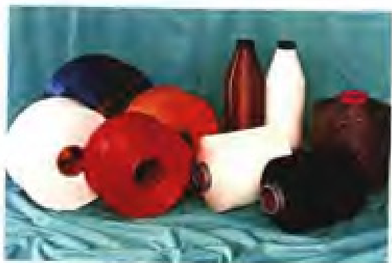
▲ 福建化纤化工厂部分化纤产品