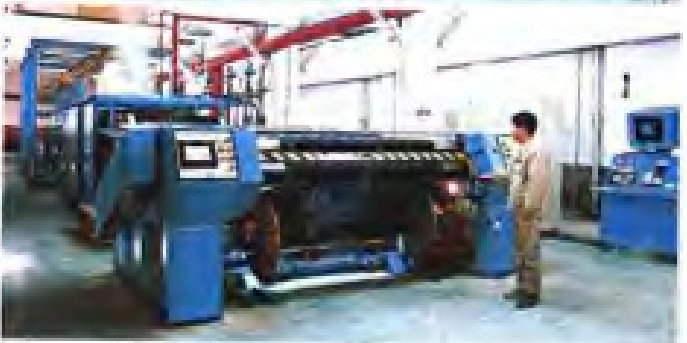
▲ 三明纺织厂牛仔布生产线