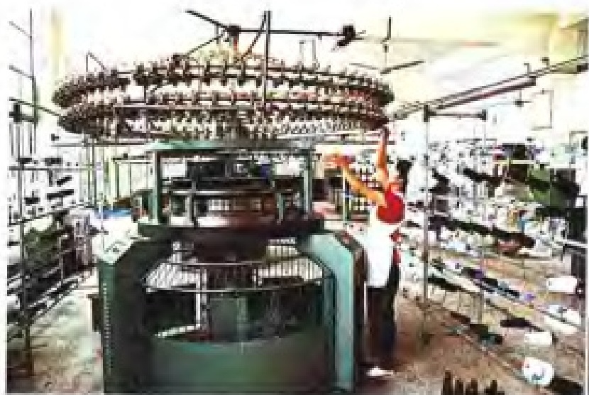
◀南平针织厂针织大圆机