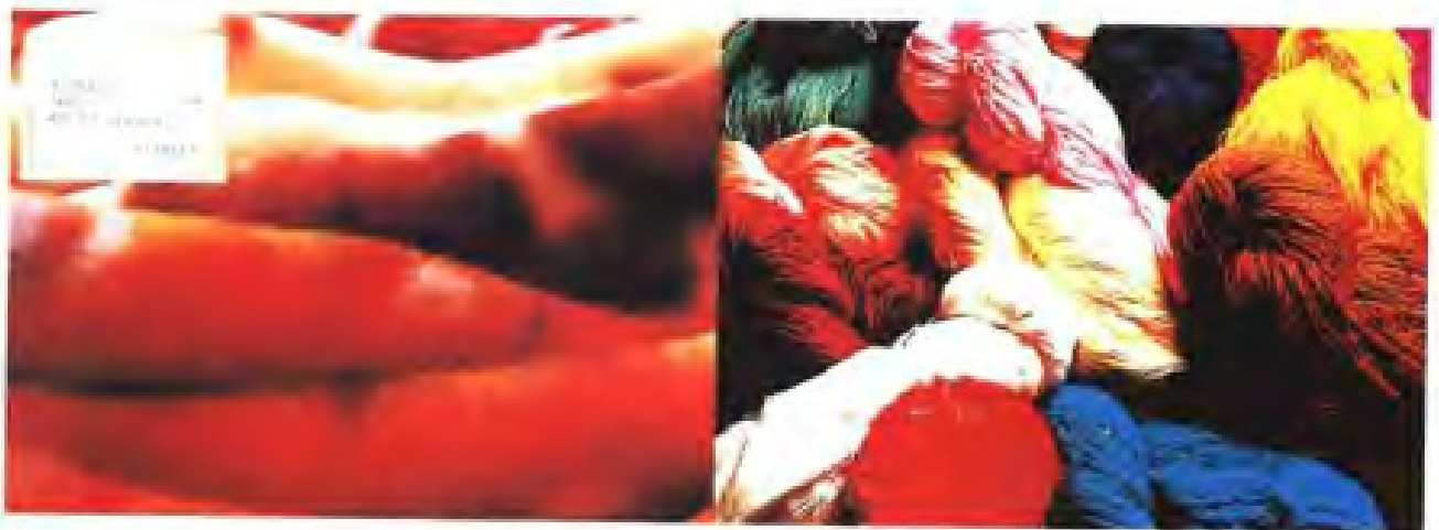
▲漳州毛纺织印染总厂部分产品