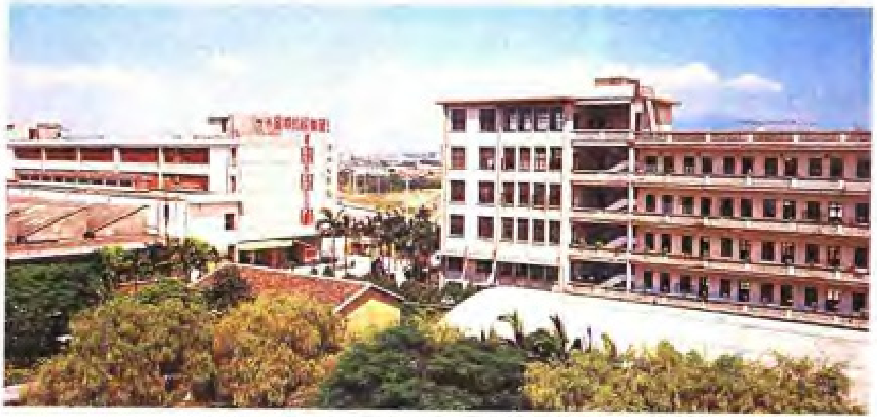
▲漳州毛纺织印染总厂