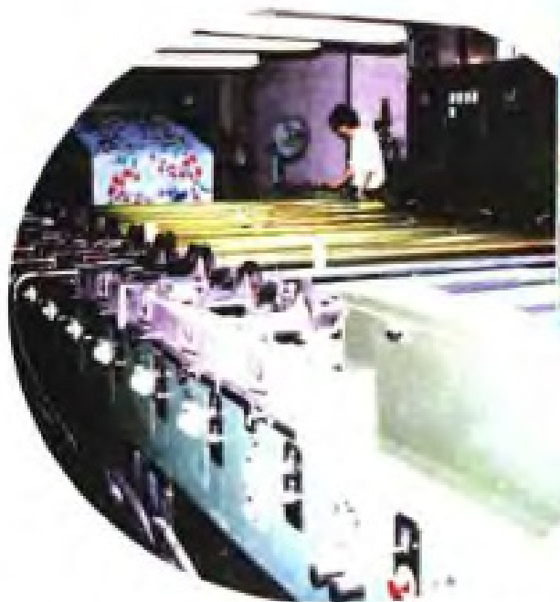
▲三明印染厂12套色圆网印花机