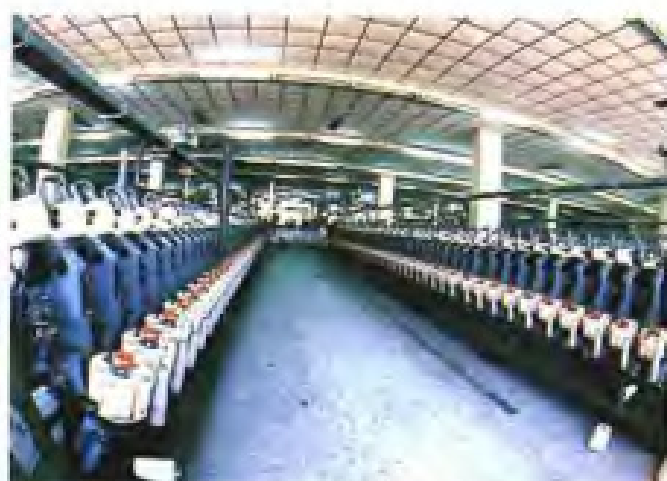
▲福州棉纺织印染厂自动络筒机