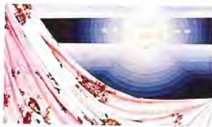
▲龙岩被单厂部分产品