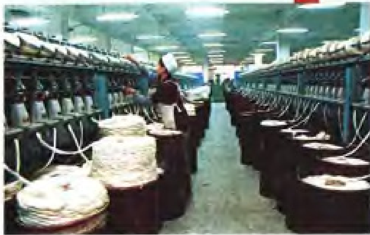
◀ 南平纺织厂气流纺纱车间