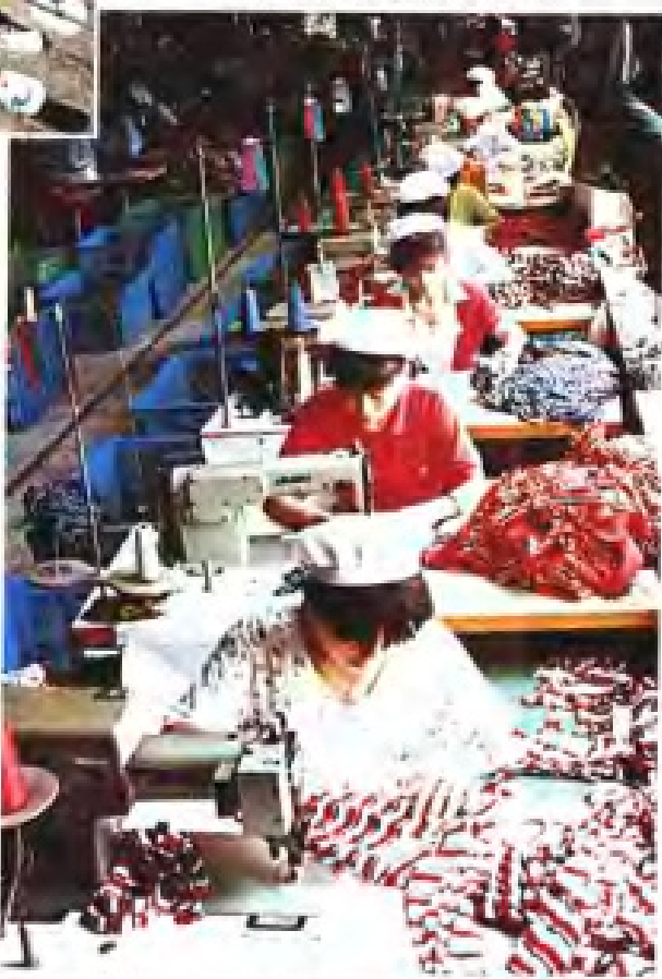
▼南平针织厂制衣车间