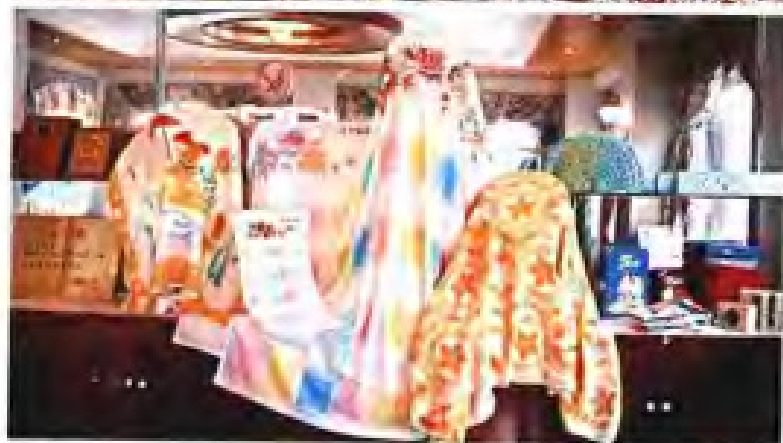
▲龙岩毛巾厂部分巾被产品