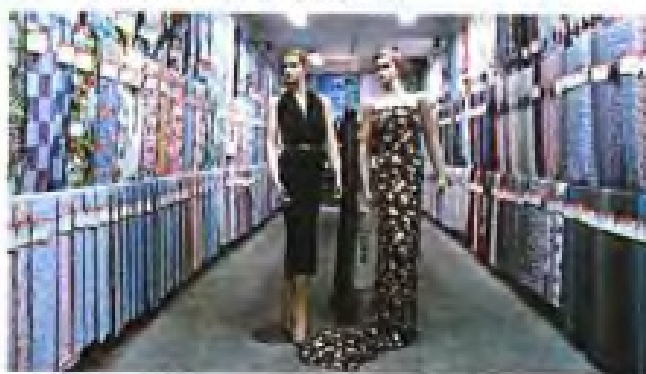
▼三明印染厂部分名优产品