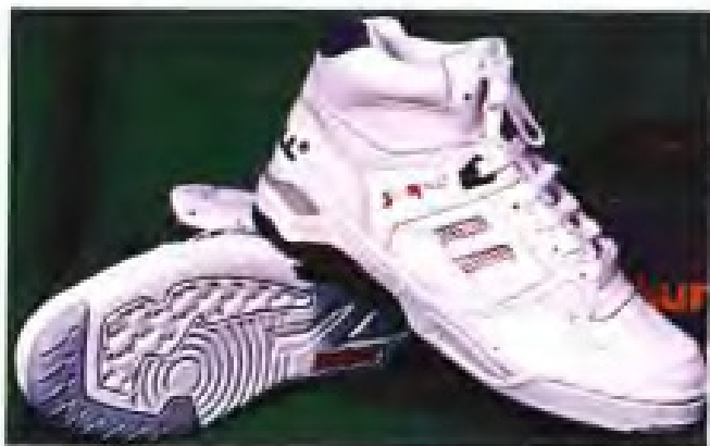
▲莆田县鞋革厂部优三路牌男运动鞋产品