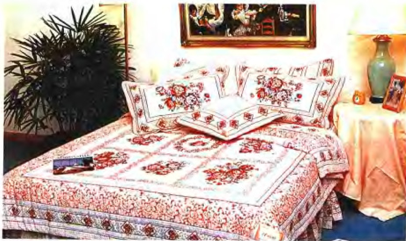
▲龙岩染织厂部分床上用品