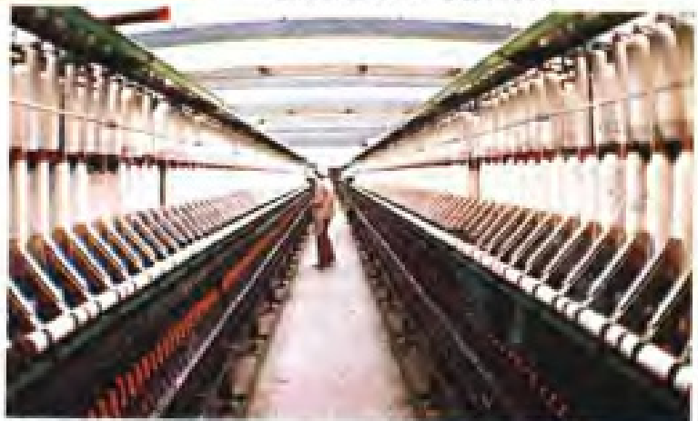
▼ 龙岩棉纺织厂纺纱车间