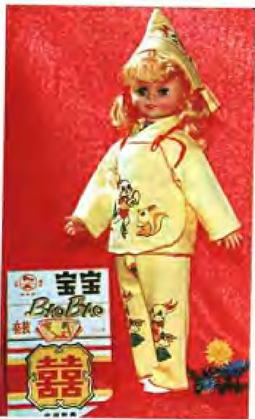
◀永安针织厂全棉儿童套装