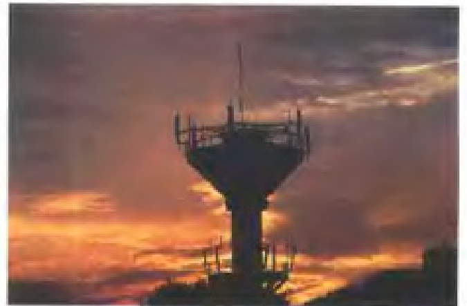
多功能无线寻呼系统