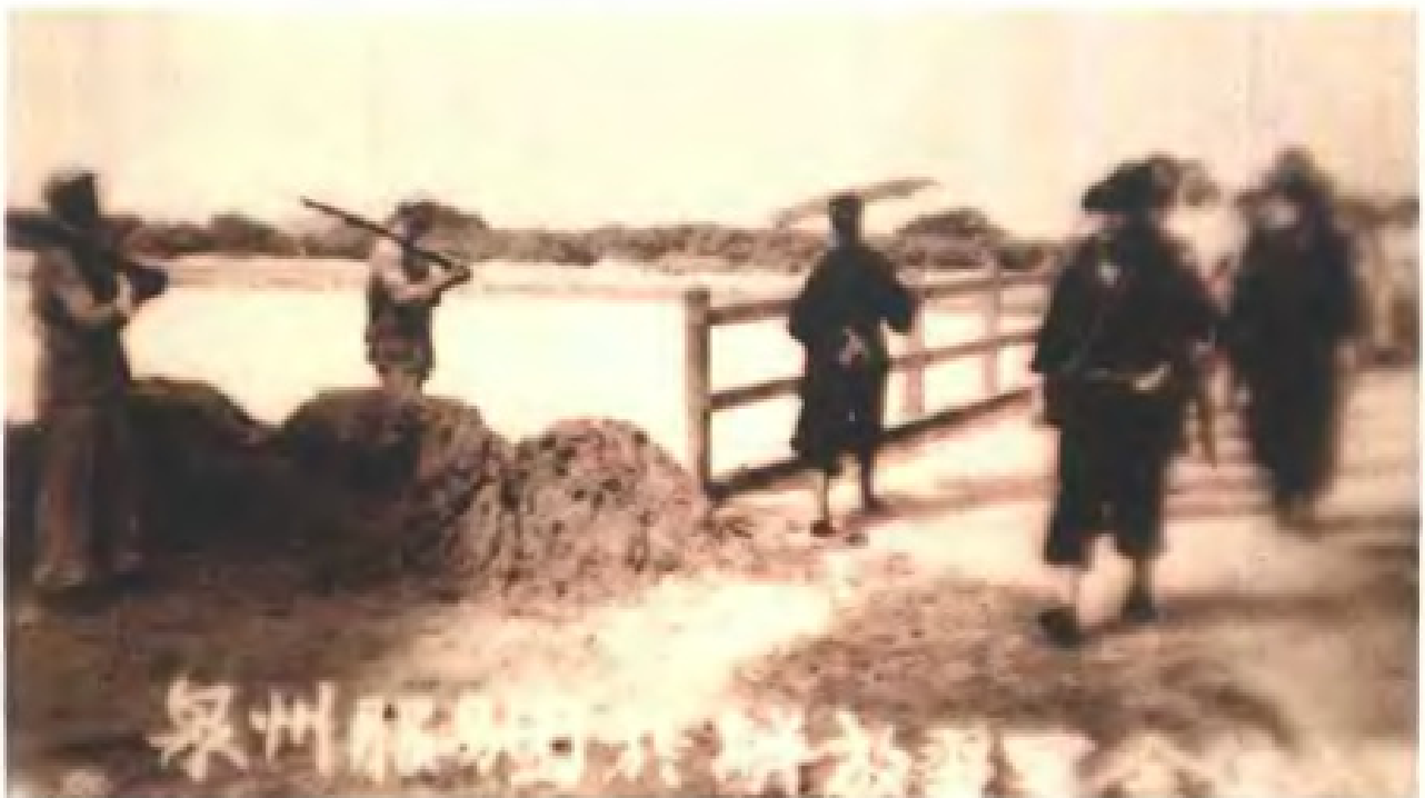
1949年8月31日泉州解放，翌日闽浙赣人民 游击纵队闽中支队泉州团队所部从顺济桥进城