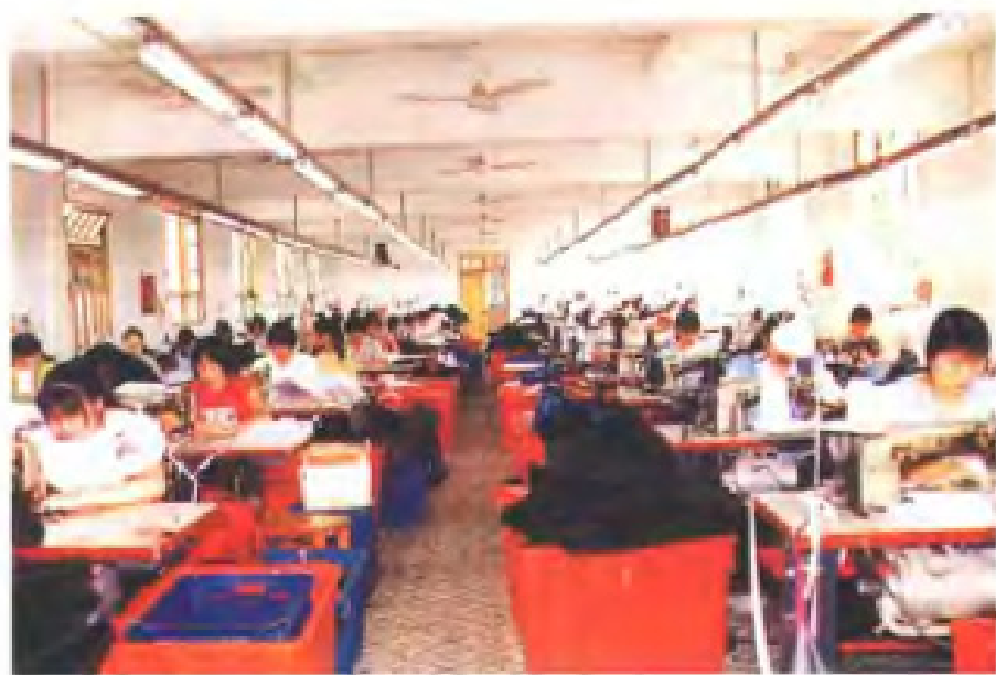
元鸿集团布袋生产车间