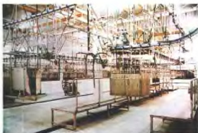
昌林食品生产车间