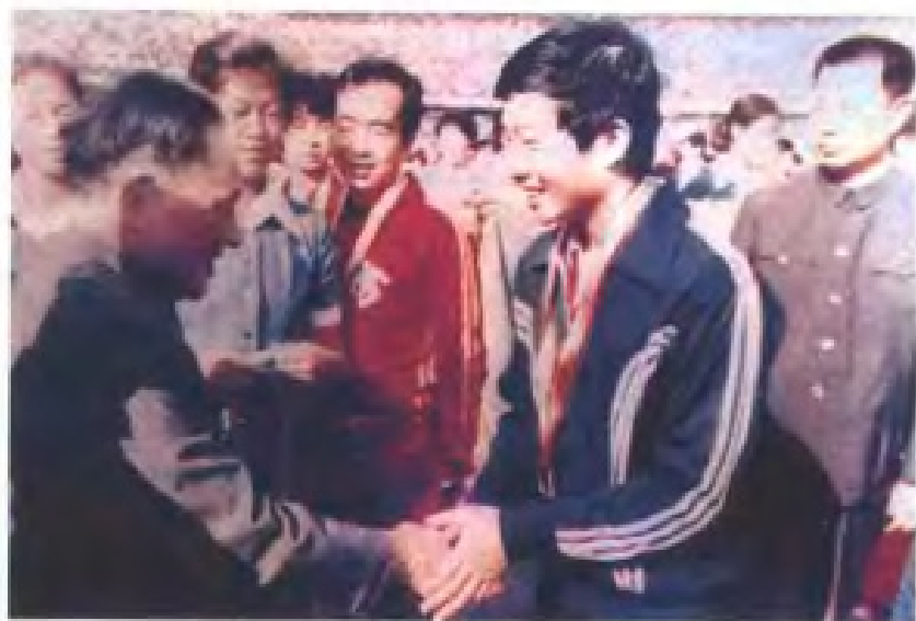
邓小平给羽毛球运动员林义雄颁奖