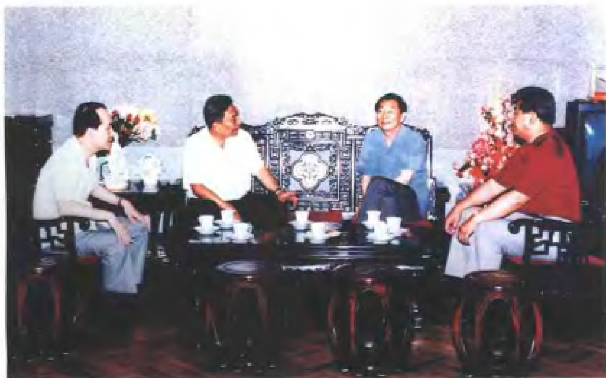
1992年7月国务院副总理朱镕基视察泉州时听取仰恩工程情况汇报