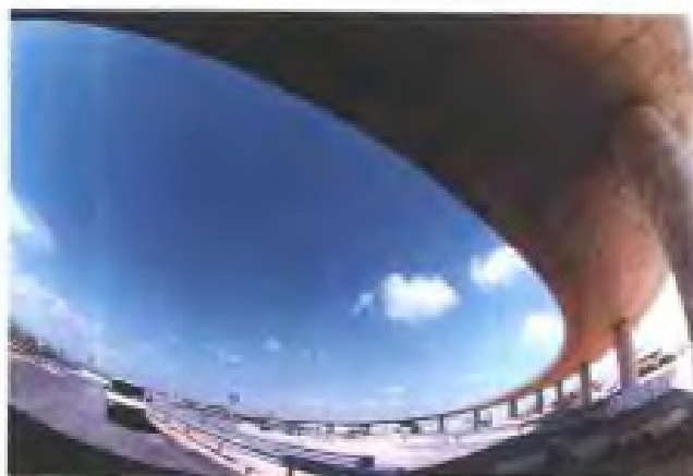
福泉厦高速公路(泉州段)