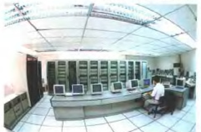
邮电通信设施一瞥