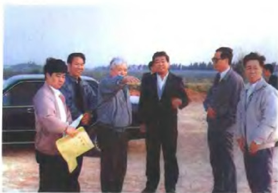
1993年福建省省长贾庆林视察万安开发区