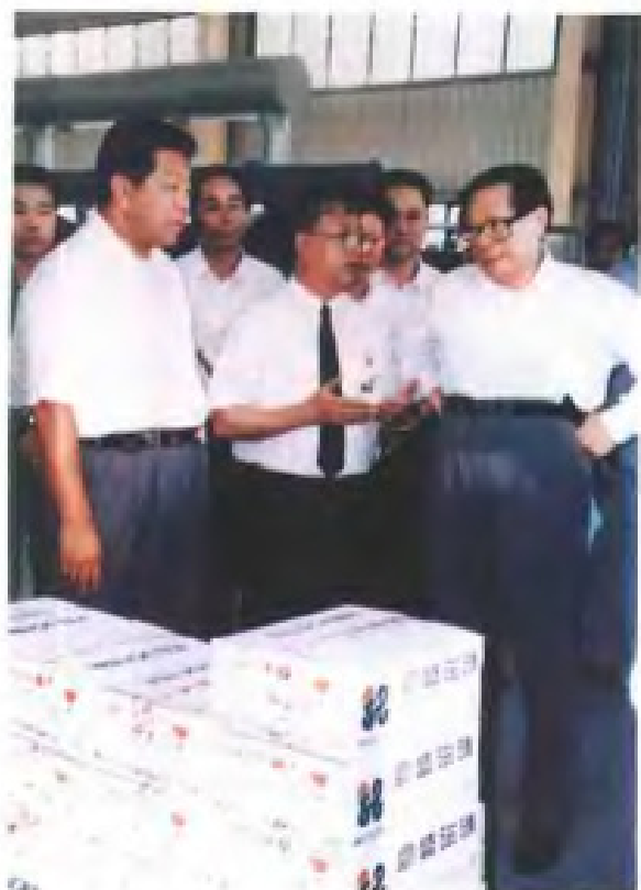
中共中央总书记江泽民视察豪盛集团