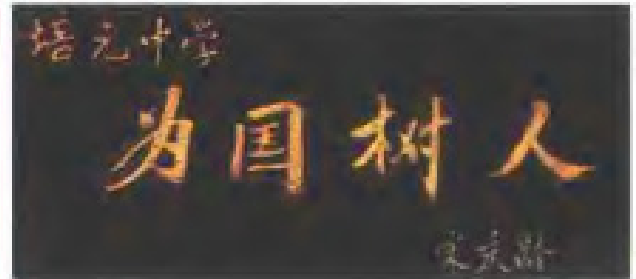
孙中山,宋庆龄为培元中学题字