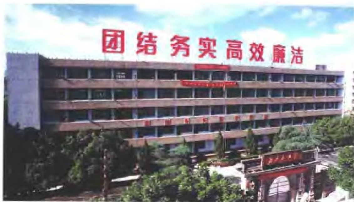
鲤城区政府办公大楼