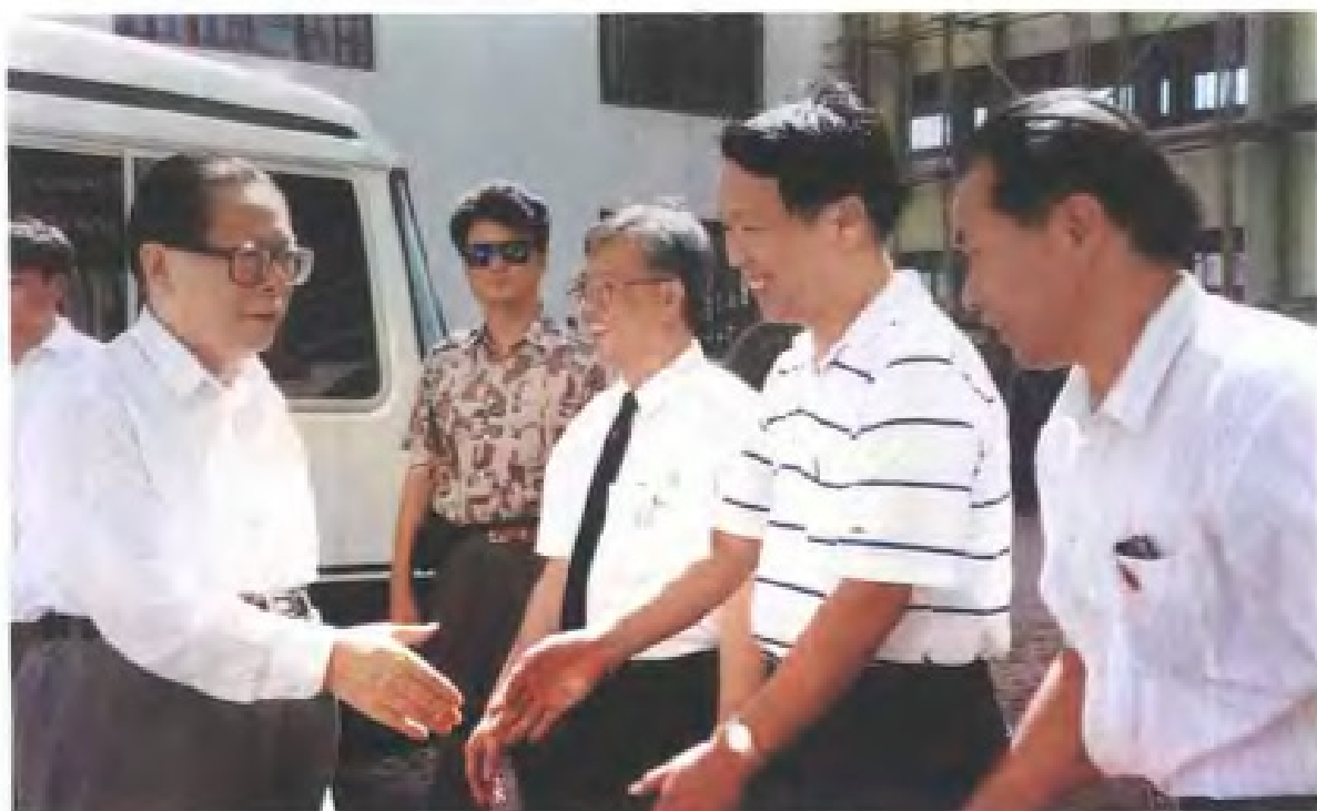
中共中央总书记江泽民视察鲤城