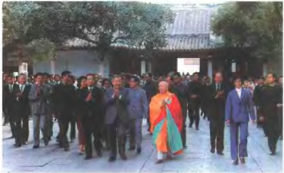
1985年12月東埔寨西哈努克 亲王和夫人在开元寺参观