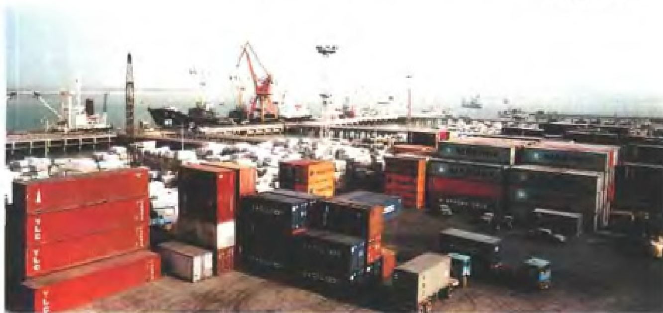
后渚港集装箱码头