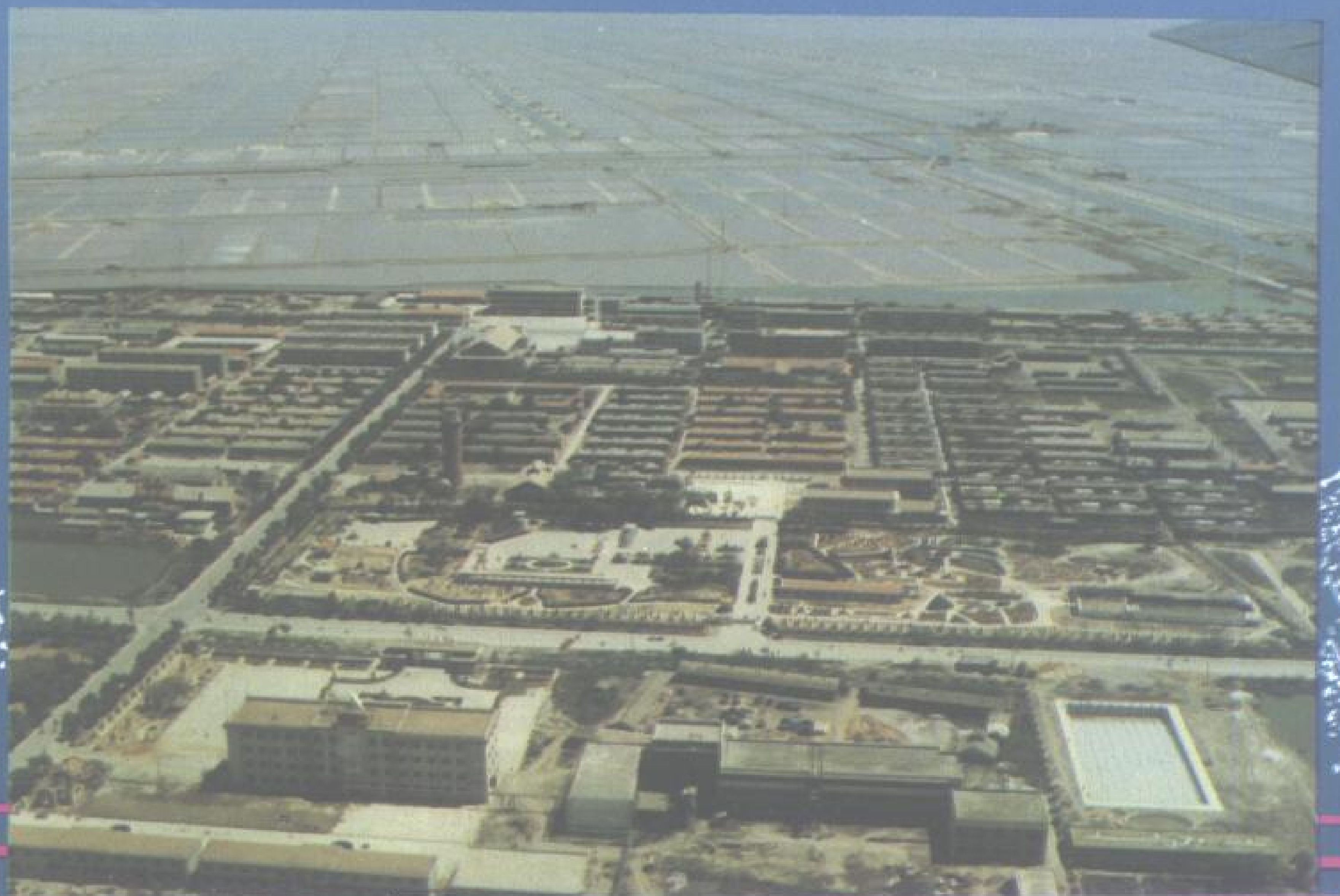
亚洲第一——南堡盐场