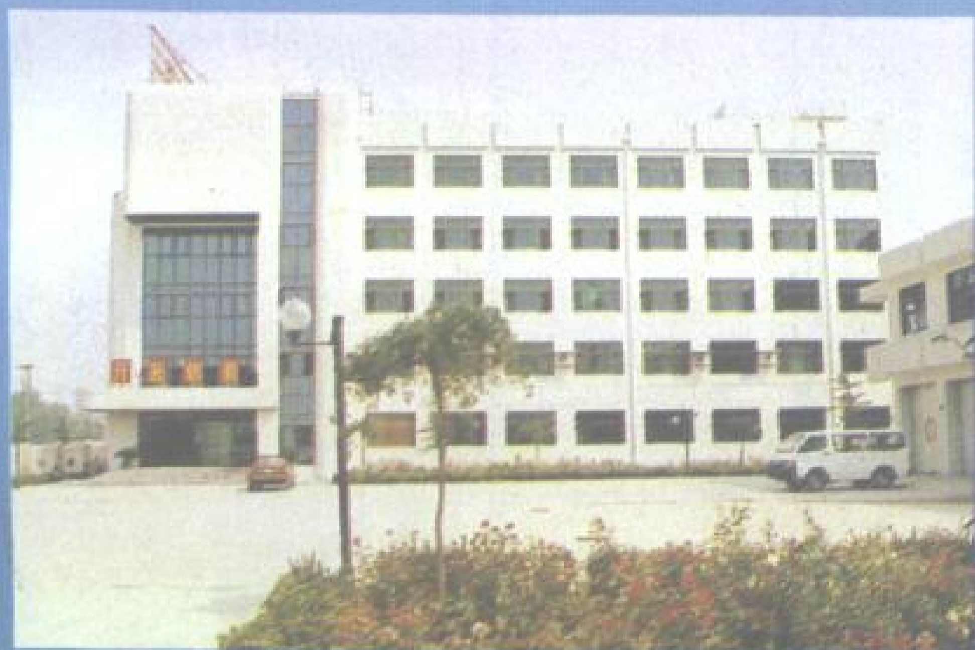
河北省盐务管理局办公大楼