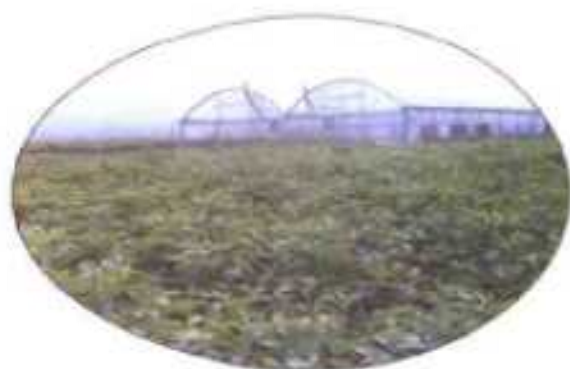
沙莲娜农业综合开发公司 (裴山镇)