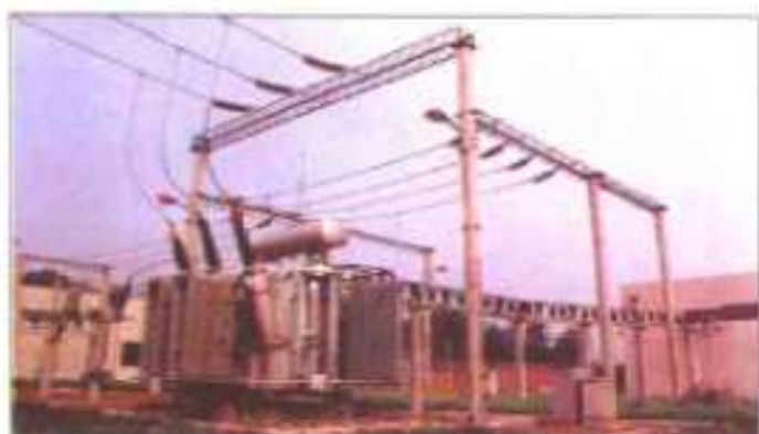
西陵 315KVA 主变压器