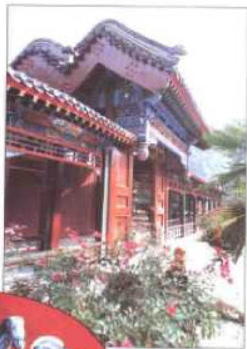
▶ 清西陵行宫(梁格庄)