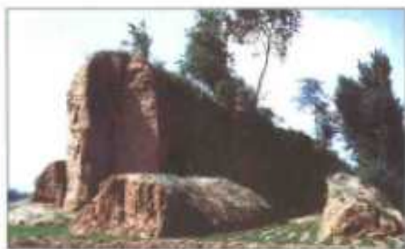
“燕下郡”古城墙一角