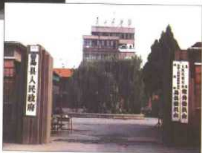
▶易县人大常委会、易县人民政府、政协易县委员会机关