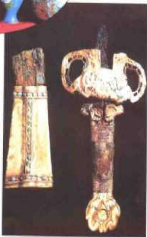
▶ 镶嵌松石金把残刀和残剑柄(燕国)