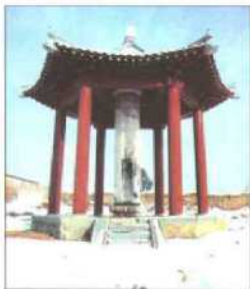
县城内的唐代老子道德经幢（苏灵芝书）