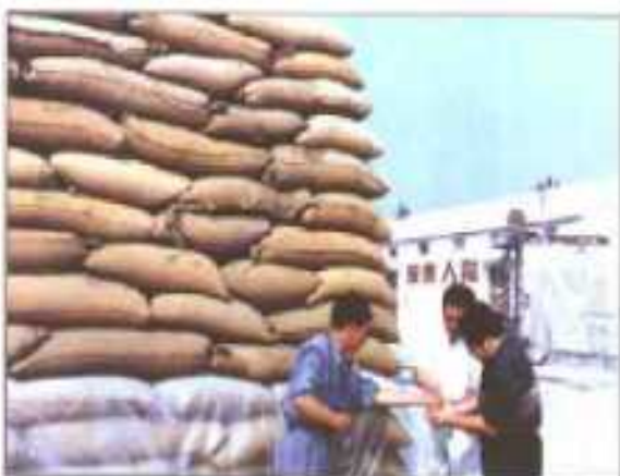
农发行支持粮食收购