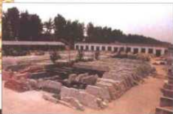
石板村加工厂(高村乡)