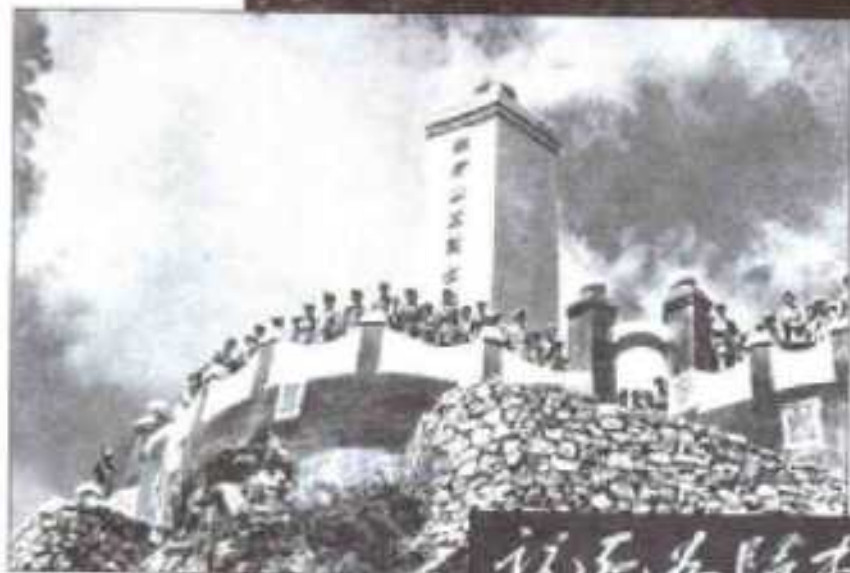
◀ 狼牙山三烈士纪念碑（1942.7）