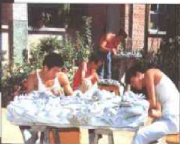
“观乡”台坛村制砚厂(尉都乡)