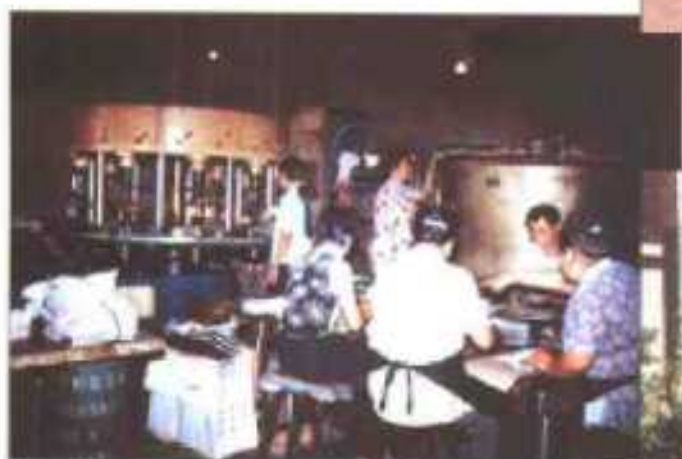
福利鞋厂注塑车间