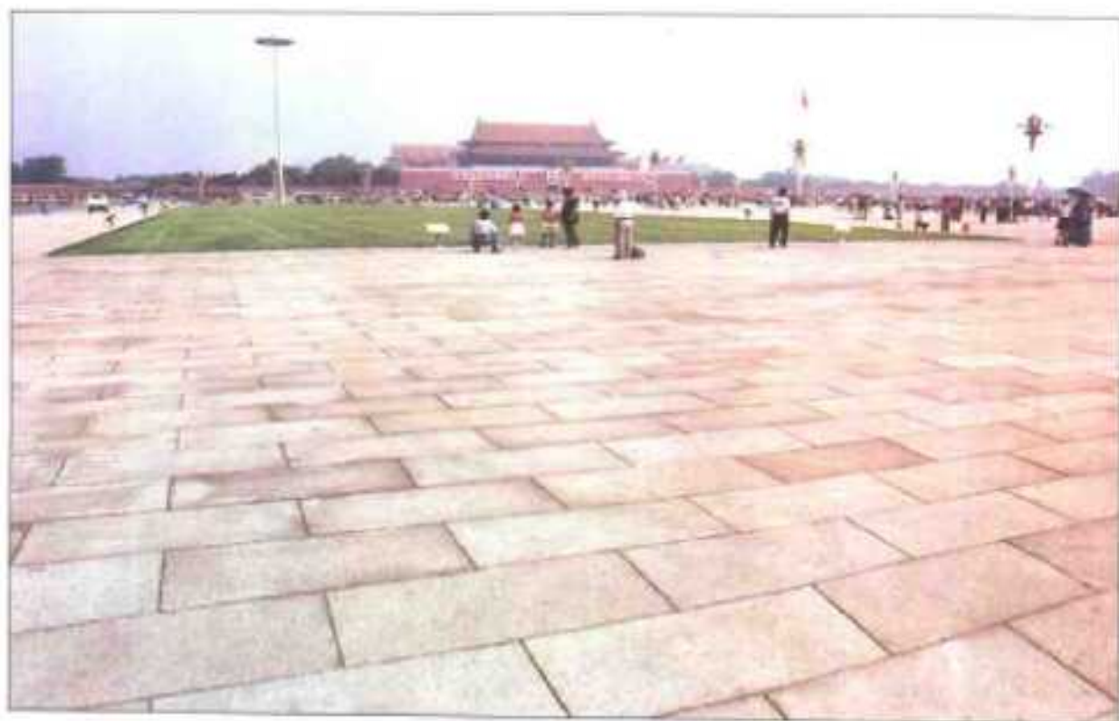
▲天安门广场铺地石被《人民日报》誉为“中华大地第一石”。易县特产“151”花岗岩。