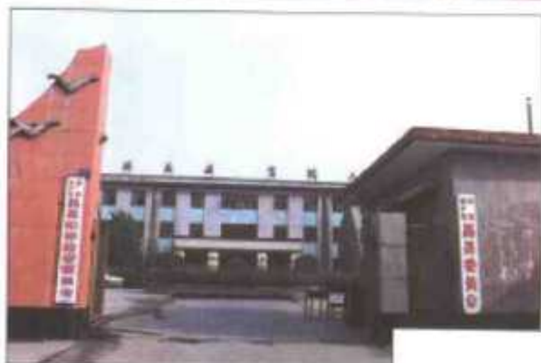
▲中共易县委员会、中共易县纪律检查委员会机关