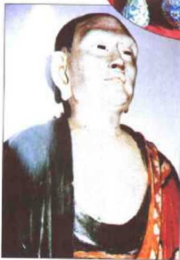
◀ 百佛挂壁佛(现藏美国十四尊)