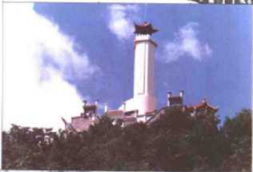
狼牙山五勇士纪念碑（1986年）