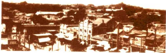
◎ 东皇城根远眺（旧照）

从光绪三十一年（1905年）正式定名“王府井大街”，到1975年恢复“王府井大街”名称，整整70年。历史好像在这里走了一个圈，从王府井大街出发，又回到了王府井大街。其间，有两次更名显得颇为滑稽。一是窃国大盗袁世凯倒行逆施，企图依仰洋人的势力当他的“洪宪皇帝”，给王府井大街起了个洋名，人民自然不屑，仍旧称“王府井大街”。二是“红卫兵”以“革命造反”的先锋自居，将王府井大街改为“人民路”，似有抬高人民地位的良好愿望。然而，人民依然称其为“王府井大街”。因为，王府井大街已经成为一种文化，深深地印在了人民的心中。