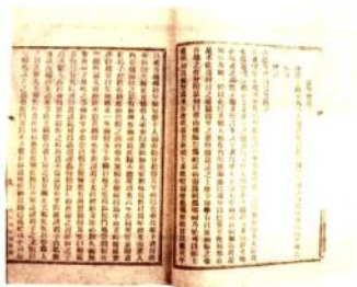
◎山阴会馆两邑会馆记

关于会馆的起源,学术界有不同意见。有研究者把会馆的渊源追溯到汉朝的邸舍 ① ,何炳棣先生否定此论,