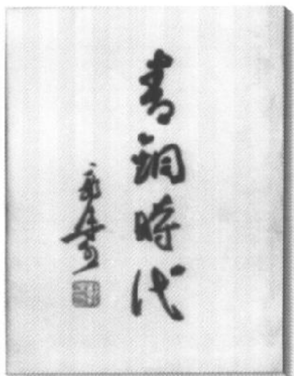
《青铜时代》 一九四五年三月 重庆文治出版社初版本书影