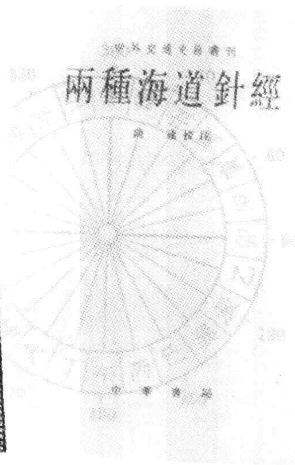
向达先生部分著作书影