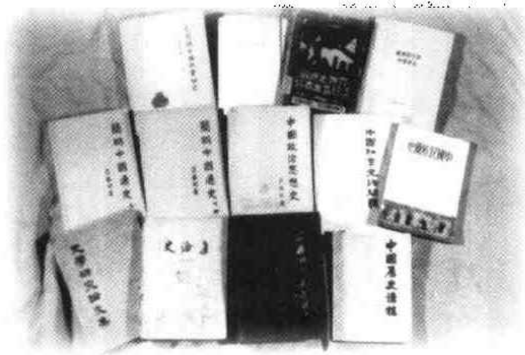
吕振羽先生部分论著书影