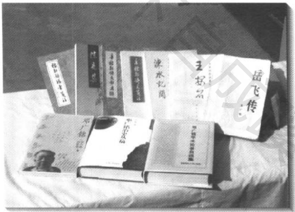
鄧廣銘先生部分書影