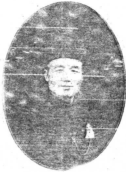
蘭振曹長科三第府政孫東齋修監