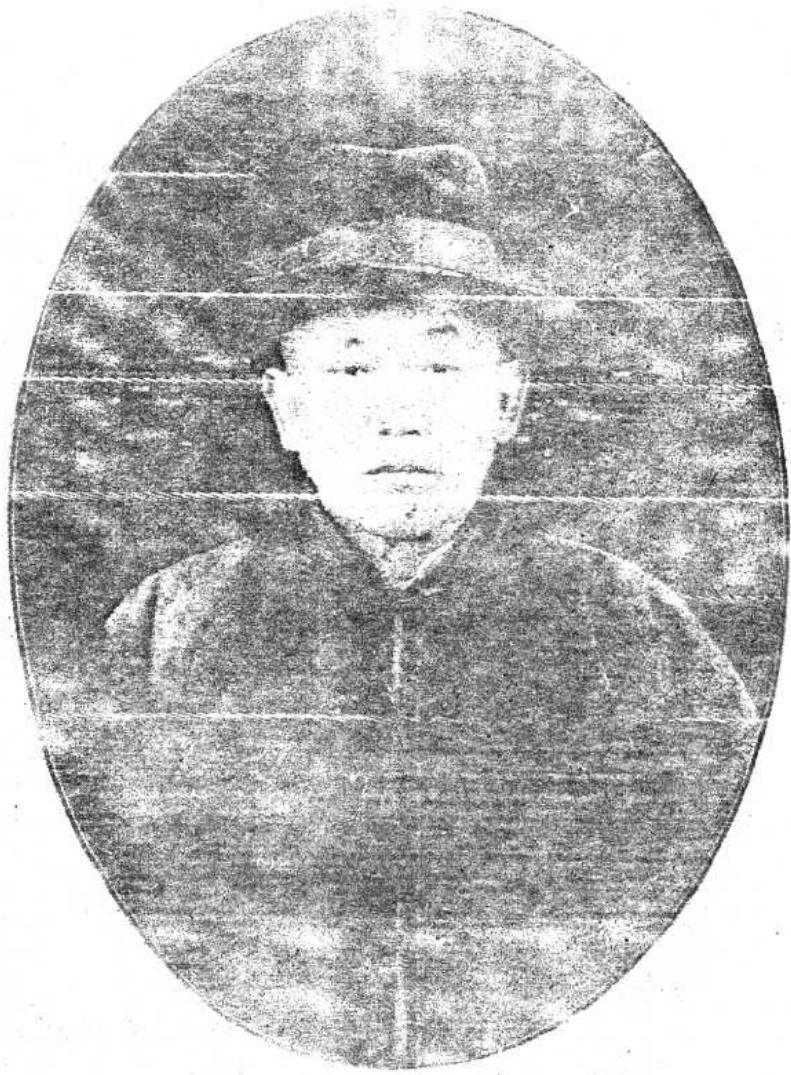
洋 清 子 英 德