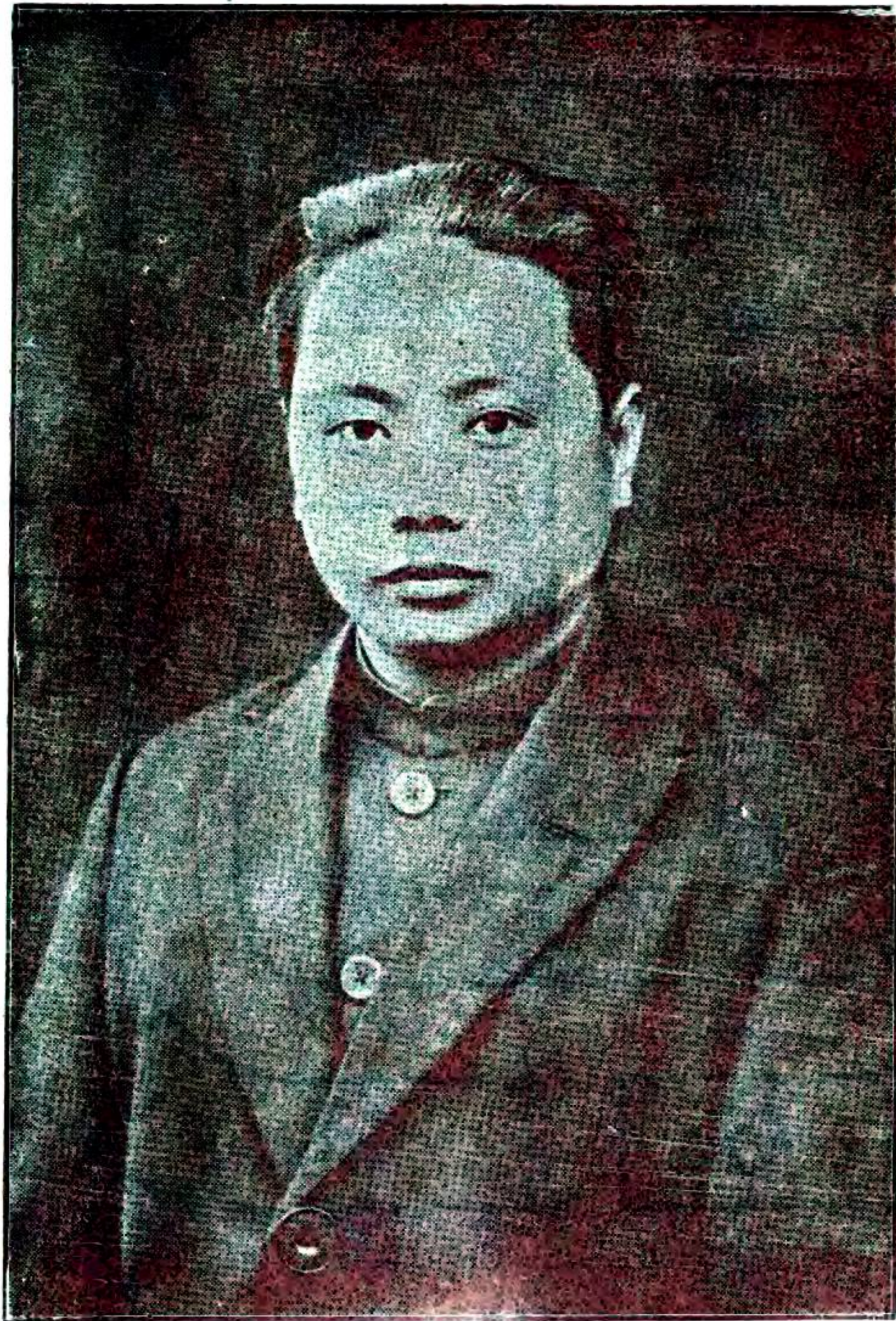
中江縣長蘇洪寬肖像