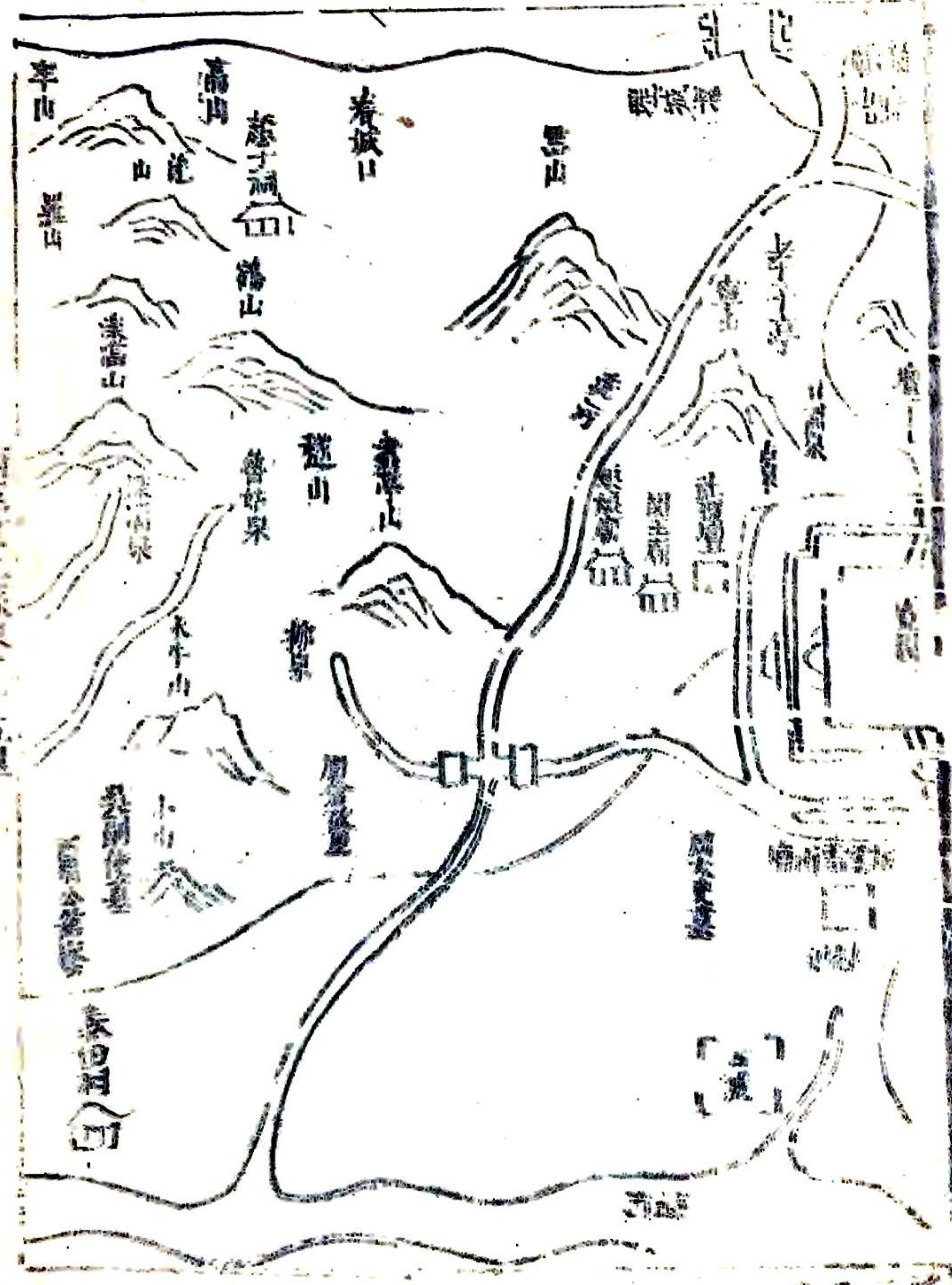
西至汶上縣界 十五里