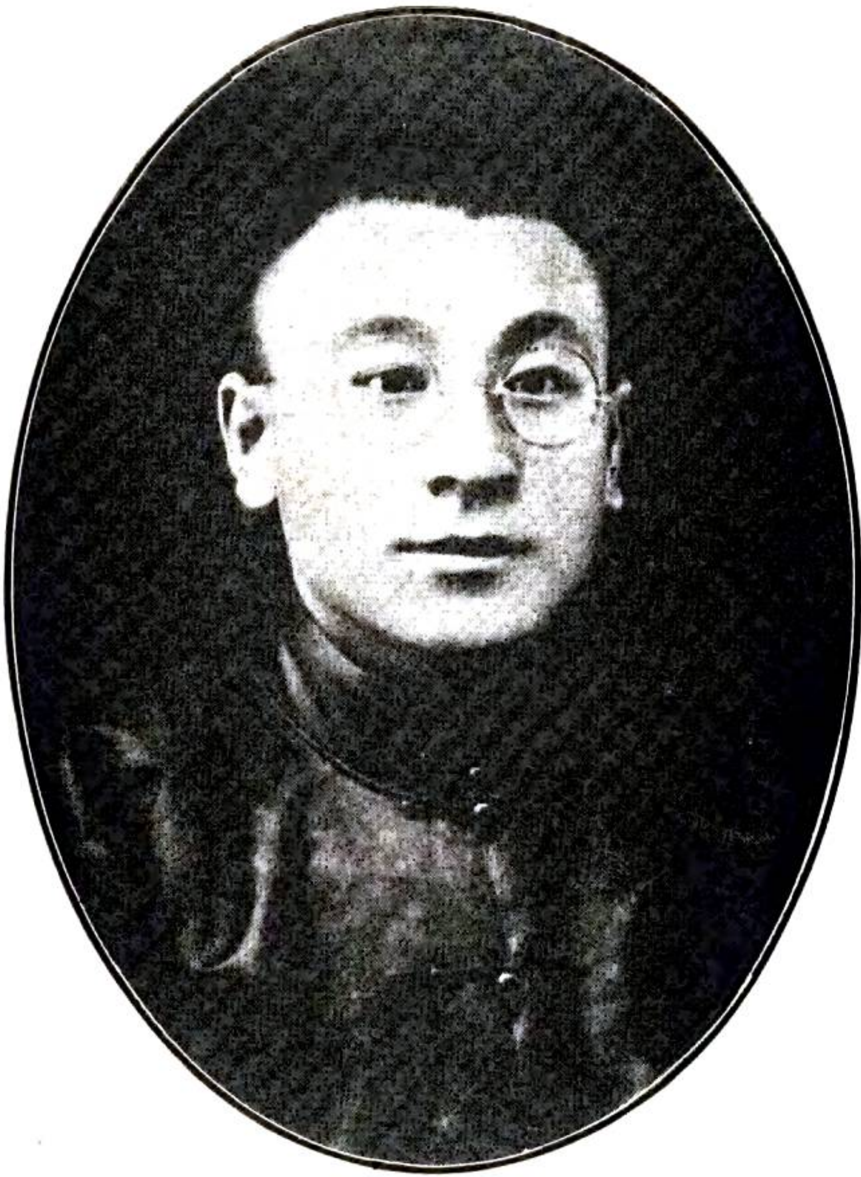
善維孫事知縣安台