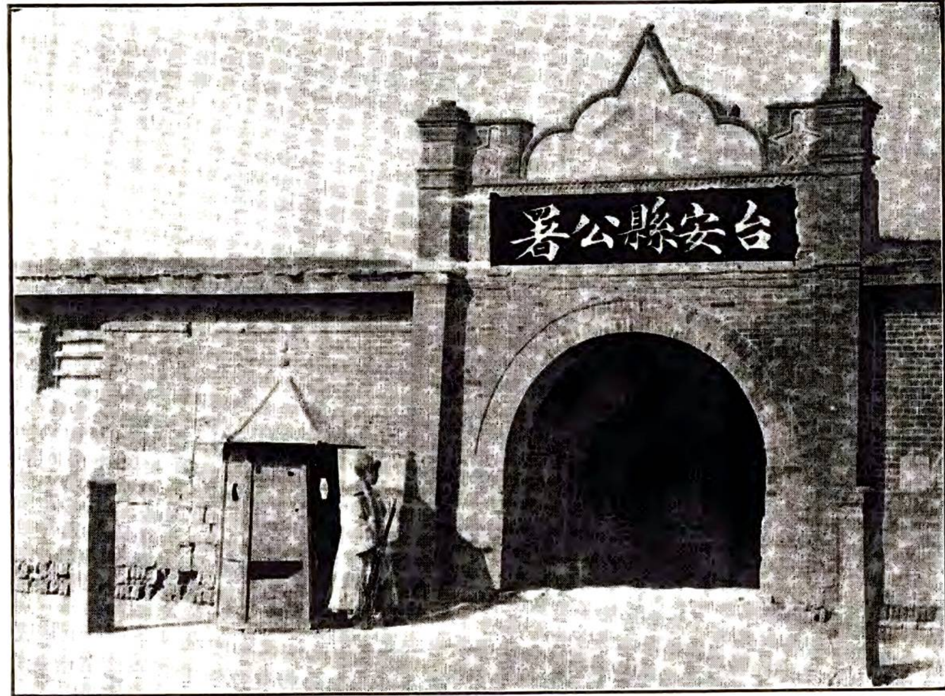
縣 公 署 正 門